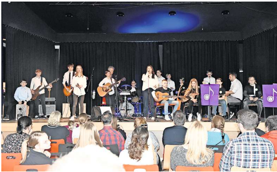
Der Auftritt der Schulband ist immer der Höhepunkt der Veranstaltung.

Mit einer Mail an Schnuppertag@kgsschwarmstedt.de können Eltern ihre Kinder anmelden.