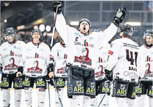
Die Scorpions setzten sich auch dieses Mal wieder gegen den Lokalrivalen durch.

nahezu sicher Oberliga-Nord Meister geworden, da es für den direkten Verfolger in der Tabelle äußerst unwahrscheinlich ist (zwölf Punkte und 36 Tore Vorsprung auf den zweiten Tabellenplatz), in den noch ausstehenden vier Spielen bis zum Start in die Playoffs die Scorpions von der Tabellenspitze zu verdrängen. Am kommenden Sonntag, 18. Februar, um 19 Uhr treffen die Scorpions im vorletzten Heimspiel der regulären Saison in der ARS Arena auf die KSW Icefighters Leipzig.