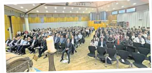
Rund 400 Gäste sind zur Winterfreisprechung der Kreishandwerkerschaft im Burgdorfer Stadthaus gekommen.