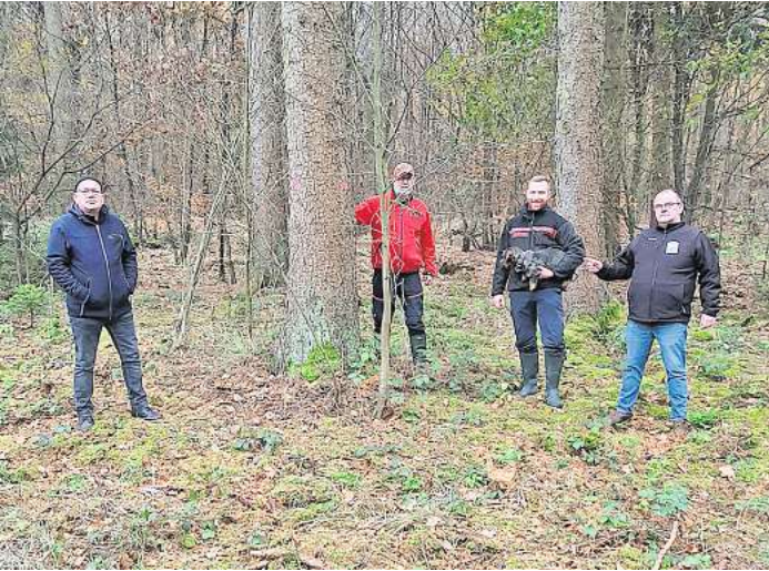
Die Flößer bei der Holzauswahl.

Der Verein Flößerei Aller-Leine wurde am 10. August 1998 gegründet. Die Aufgabe des Vereins ist die Erhaltung eines Floßbetriebs mit der Förderung der Gemeinschaft und dem Angebot einer Attraktion im Aller-Leine-