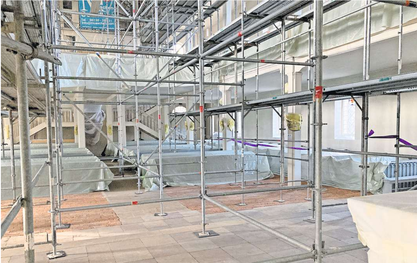
Ein Blick vom Altar: So sieht die Kirche St. Martini derzeit innen aus.

Deckensanierung im Brelinger Gotteshaus neigt sich dem Ende zu. Danach geht es an die Orgel.