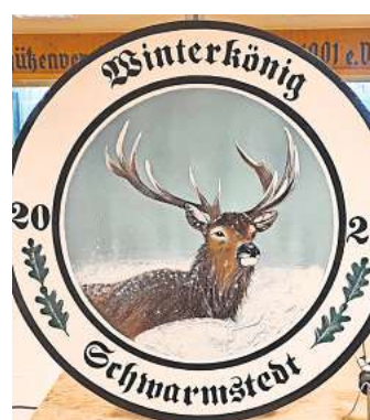
Die Winterkönigsscheibe ist beige.

SCHWARMSTEDT. Der Schützenverein Schwarmstedt lädt alle volljährigen Mitglieder am Freitag, 16. Februar, in der Zeit von 17 bis 19 Uhr (Meldeschluss) zum Schießen auf die Winterkönigsscheibe auf die Schießsportanlage Am Loh, Werkstraße 2, ein. Für das leibliche Wohl sorgt der Verein mit hausgemachten Eintöpfen und man kann es sich draußen an der Feuertonne gemütlich machen. Schießsport hilft dabei, viele körperliche Disziplinen aufzubauen, die nicht nur gesund sind, sondern auch Spaß machen.