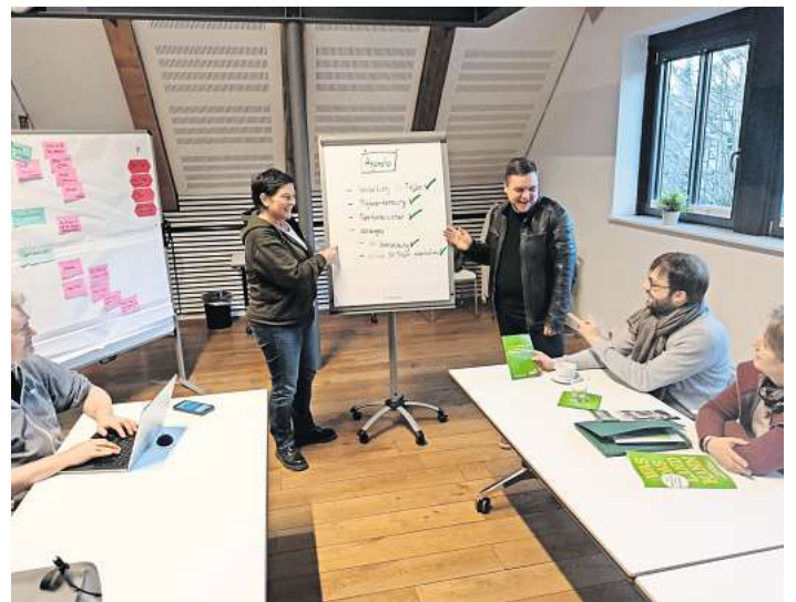
Die Grünen haben sich jetzt zur ihrer Klausursitzung im Bürgerhaus in Bissendorf getroffen.

Ein weiterer Schwerpunkt wird die Fortsetzung der Diskussion über den geplanten Windpark sein. Trotz des positiven Feedbacks auf unsere Podiumsdiskus-