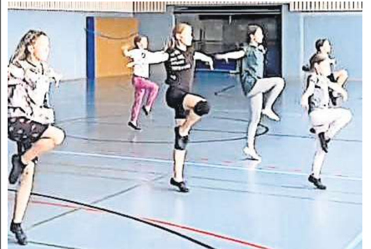
Auch Tanzen wird angeboten.

PINX Dance wird freitags von 15 bis 16.30 Uhr in den Räumlichkeiten der Kunstschule in Schwarmstedt stattfinden. Der erste Termin ist am 23. Februar, aber auch hier ist eine Anmeldung bereits ab jetzt möglich.