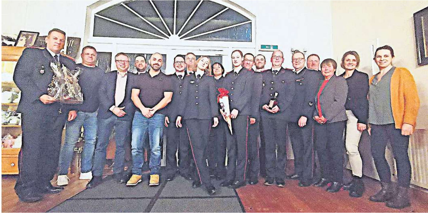
Geehrte und Beförderte bei der Freiwilligen Feuerwehr Bothmer mit ihren Gästen.

Auch in Bothmer ist in absehbarer Zeit die Gründung einer Kinderfeuerwehr geplant