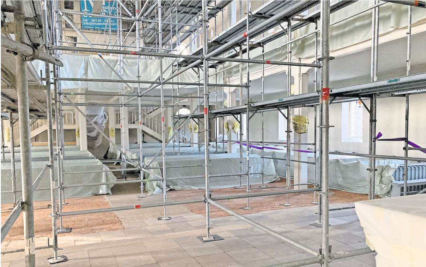
Ein Blick vom Altar: So sieht die Kirche St. Martini derzeit innen aus.

Deckensanierung im Brelinger Gotteshaus neigt sich dem Ende zu. Danach geht es an die Orgel.