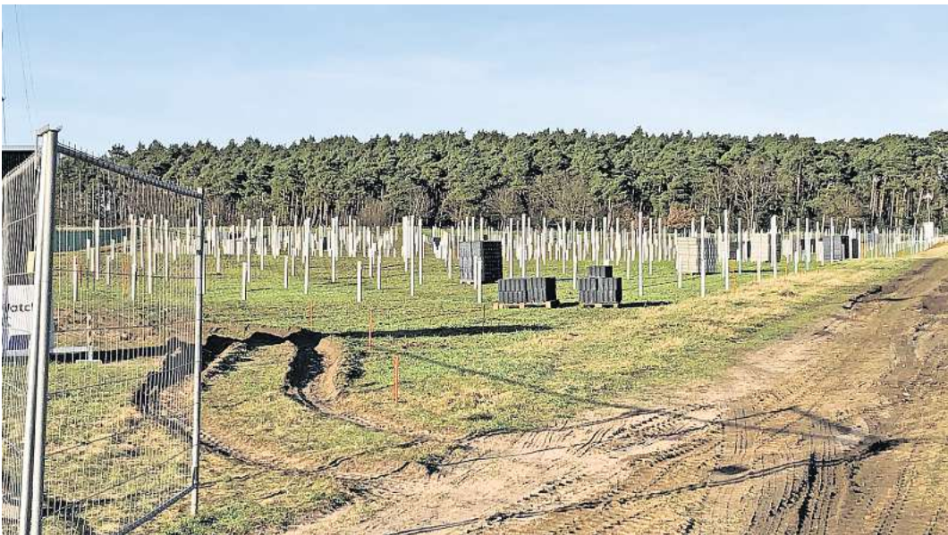
Rund 20 Gutachten mussten für den Bau des Solarparks angefertigt werden.

Im Vergleich zu den vorherigen Erfordernissen ist das aber laut dem Investor gar kein Problem. Denn Bäßmann benötigte für sein Projekt eine Baugenehmigung – und da hatten viele