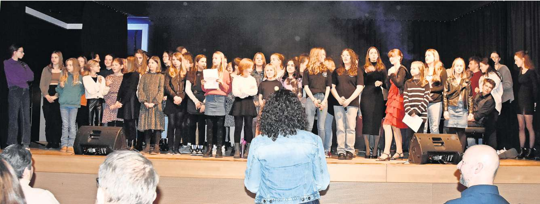
Abschlusslied auf der Bühne: Das Benefizkonzert der KGS-Schülervertretung war ein voller Erfolg.

Von Klassik bis Punk Rock für guten Zweck: 875,44 Euro für die Schwarmstedter Tafel und „Deutschland hilft“