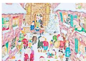
■ 2. Platz: Uwe Schneider (Langenhagen) 22,7