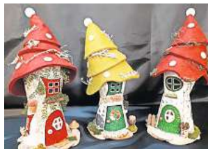
■ 1. Platz: Anja Schade (Hannover) 10,7 Prozent