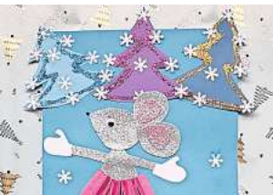
■ 2. Platz: Anna Siminova (Hannover) 8,7