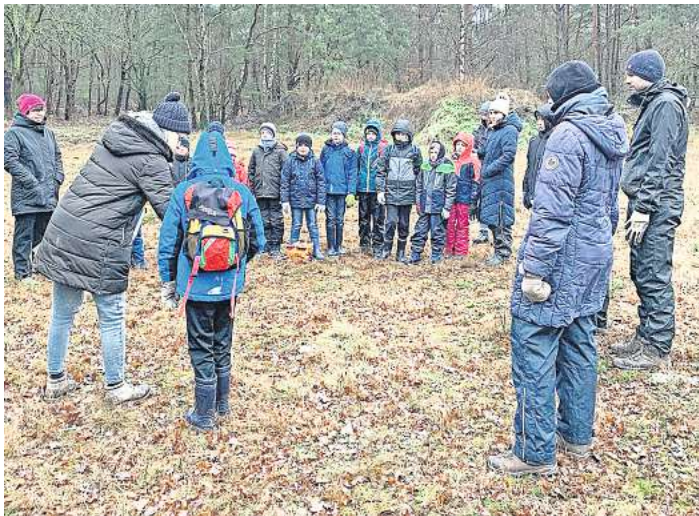
Die Naturschutzjugend war mit Feuereifer dabei und ließ sich das Vorgehen des Entkusselns genau erklären.

lichen Totholzhaufen aufgetürmt, dem neuen Zuhause für weitere Tiere. Im Sommer kehren die NAJU Kinder noch einmal zur blühenden Heide zurück, um die sechsbeinigen Bewohner und die ganze Vielfalt des Lebensraums live zu erleben. Das nächste NAJU-Treffen findet statt am Sonnabend, 10. Februar, um 10 Uhr. Treffpunkt ist am ehemaligen Schützenhaus Grindau (Buchholzer Mühlenweg 12). Gemeinsam wollen wir im Wald auf Frühlingsexpedition gehen. Gern können Lupe und Fernglas mitgebracht werden. Infos gibt es unter Telefon (0174) 7 98 86 37 oder per E-Mail an gruppe-schwarmstedt@nabu-heidekreis.de.