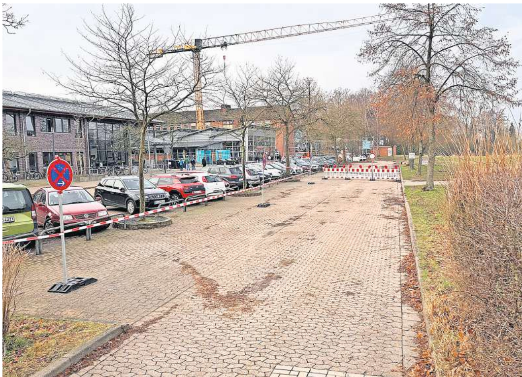
Eingeschränkt sind wieder Parkmöglichkeiten an der Schule vorhanden. Der Bauhof hat aufgeräumt.

Diese war wegen der Auswirkungen des Hochwassers gesperrt. Damit stehen zwar wieder mehr Parkmöglichkeiten an der Schule zur Verfügung, aber die Zufahrt ist nur eingeschränkt möglich, der hintere Teil der Straße ist unterspült und bleibt daher gesperrt. Es bestehen daher dort auch keine Wendemöglichkeiten, berichtet Samtgemeindebürgermeister Björn Gehrs. Es gilt daher weiter die Bitte an alle Eltern: „Bitte bringen Sie ihre Kinder nicht direkt zur KGS, sondern nutzen Sie Haltemöglichkeiten außerhalb der Straßen Am Beu und entfernt von der Schule.“ Auch die Einbahnstraßenregelung „Am Beu“ bleibt aufgrund der Straßenschäden und fehlender Bushaltestellen vor der Schule bis auf weiteres bestehen.