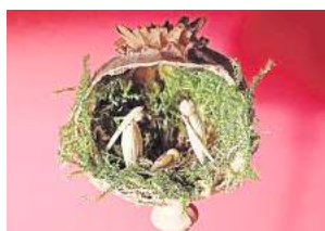
■ 2. Platz: Gabriele Sewening (Hannover) 6,1