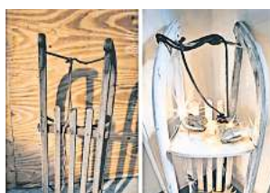
■ 3. Platz: Julia Eichhorst (Burgwedel) 4,0