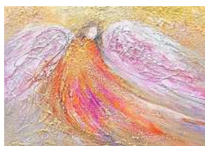
■ 3. Platz: Martina Schramm (Garbsen) 12,6