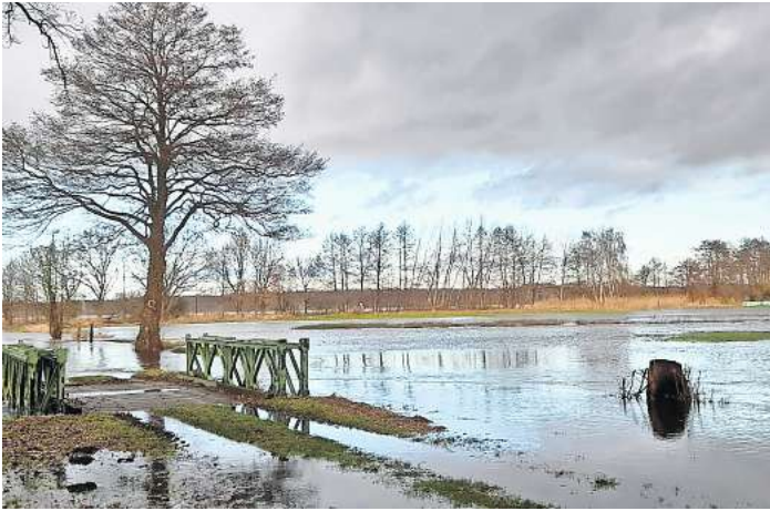
Allerhochwasser bei Marklendorf.