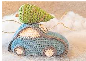
■ 3. Platz: Sybille Müller (Lehrte) 7,8