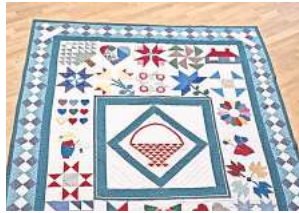
■ 2. Platz: Brigitte Klatt (Springe) 11,3