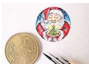
■ 1. Platz: Marina Smirnova (Wedemark) 24,6 Prozent