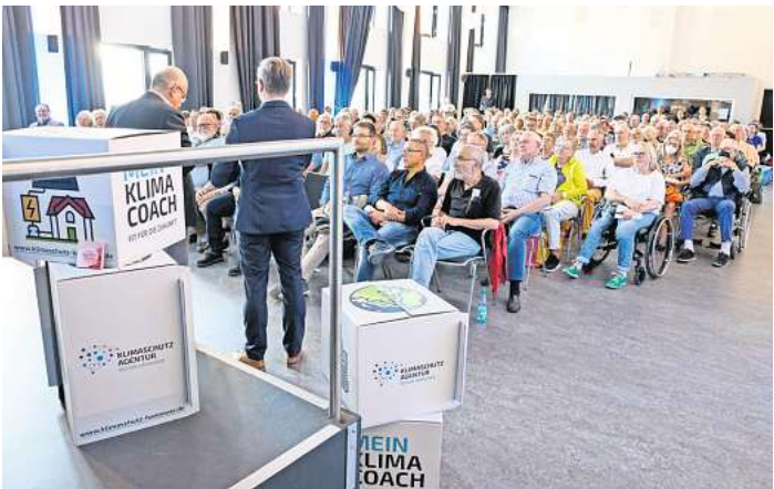
Die Klimaschutzagentur lädt für 19. Februar in den Bürgersaal ein.

grund der begrenzten Platzzahl wird um Anmeldung gebeten unter: www.klimaschutz-hannover.de/anmeldung-wedemark .