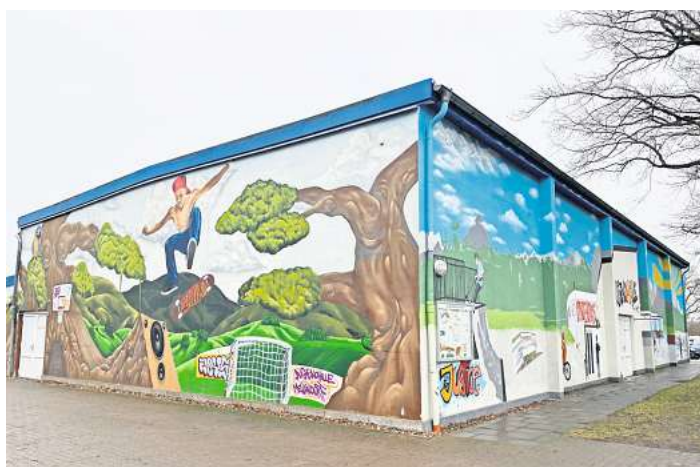
Gemeinde soll weitere Geflüchtete aufnehmen: Nun soll die Johanniter-Unfall-Hilfe die Gemeinschaftsunterkunft ab März betreiben.