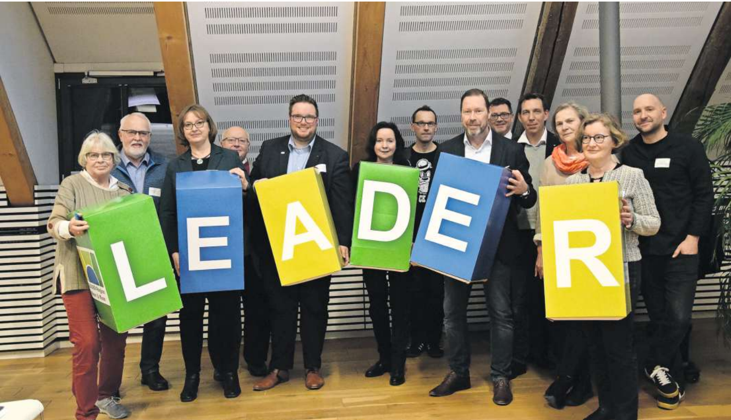
Der Auftakt der neuen Leader-Periode ging in Bissendorf über die Bühne.

Ausblick auf die kommenden Jahre für die drei Kommunen Wedemark, Neustadt, Wunstorf