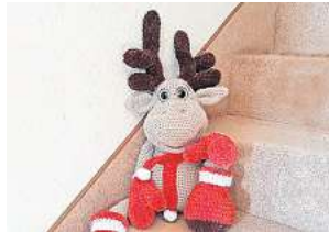
■ 1. Platz: Bettina Tegtmeier (Ronnenberg) 23,0 Prozent