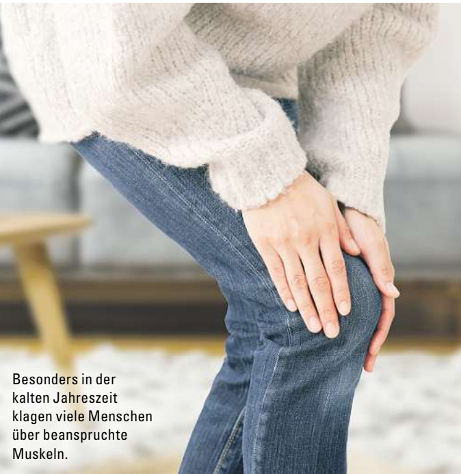
Besonders in der kalten Jahreszeit klagen viele Menschen über beanspruchte Muskeln.

„Ich habe Rubaxx öfters nach dem Sport aufgetragen und die Muskeln entspannen sich dadurch deutlich. Es lässt sich leicht auftragen. Sehr empfehlenswertes Produkt!“ (Irene T.)