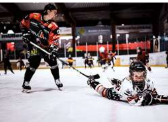
Die Kinder können das Gefühl „Eishockey“ erleben.

MELLENDORF/LANGENHAGEN. Am Sonnabend, 10. Februar, findet im Eisstadion Mellendorf (ARS Arena) zwischen 12.30 und 13.30 Uhr der Kids on Ice Hockey Day statt. Bei diesem Event können alle Kinder im Alter zwischen vier und neun Jahren, die Lust haben, das Gefühl „Eishockey“ zu erleben, eine Stunde lang mit unseren Trainern und einigen Spielern der Hannover Scorpions Spaß auf dem Eis haben. Viele Hände werden bei den ersten Schritten auf dem Eis unterstützen. Die Teilnahme ist kostenlos! Für die Eltern werden Ansprechpartner vor Ort Fragen rund um das Thema Eishockey, Wedemark Scorpions Nachwuchsarbeit und Vereinssport beantworten. Bitte Handschuhe, Fahrradhelm und Inline-Schoner mitbringen, wenn vorhanden. Schlittschuhe und Schläger bekommen die Kids. Einige Ausrüstungsteile sind auch da. Kostenlos. Zum Abschluss gibt es Hotdogs und Getränke für alle Teilnehmer. Fragen werden in der Geschäftsstelle der Scorpions unter (05130) 95 94 10 oder unter hannah.mielke@wedemark-scorpions.de beantwortet.