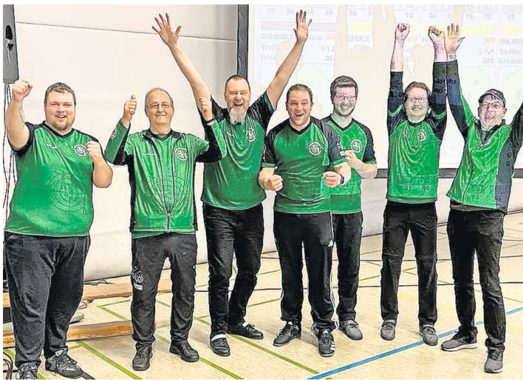
Der Jubel der Lindwedeler Schützen, dass sie es doch noch in die erste Bundesliga geschafft haben, kannte keine Grenzen und da wollen sie jetzt auch bleiben..