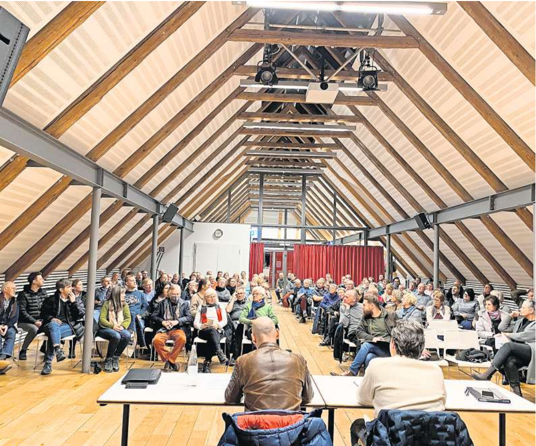
Ein Thema von Interesse: Rund 120 Besucherinnen und Besucher informieren sich über eine Kellersanierung nach dem Hochwasser vor drei Wochen.

Die Kosten für eine Kellersanierung sind unterschiedlich. Sie hängen davon ab, ob es ein Holzhaus oder ein gemauertes Haus ist. Zu berücksichtigen ist auch, wie alt das Gebäude und wie groß der Keller ist. Zudem sind die Ursachen für das Eindringen von Wasser sehr unterschiedlich. Wichtig ist aber, dass ein erfahrenes Unternehmen die Sanierung ausführt und Garantie gibt.