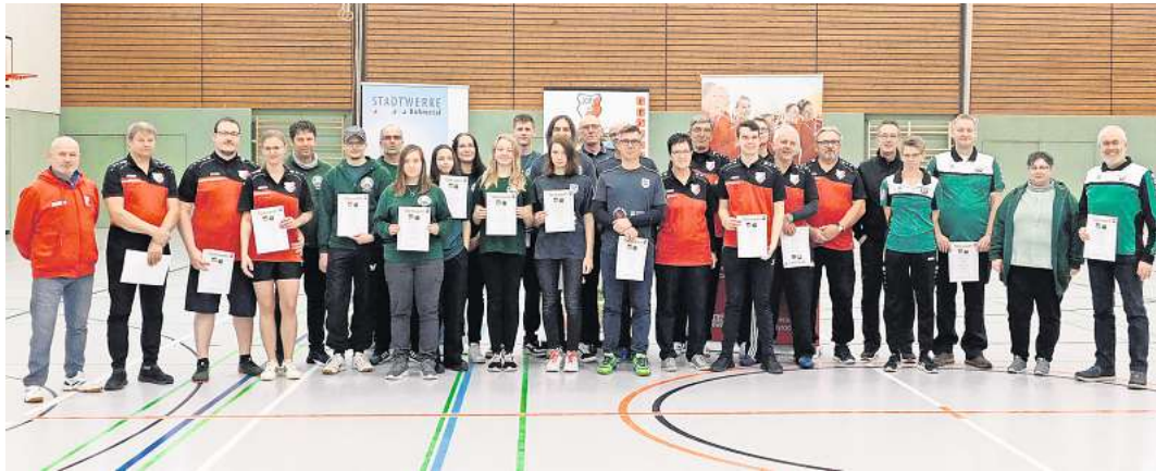
Die Teilnehmer der Hallen-Kreismeisterschaft der Bogenschützen beim TV Jahn Walsrode.