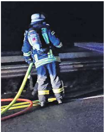
Letztendlich brannte nur ein Reifen, dennoch musste die Feuerwehr schnell und umsichtig sein.

SCHWARMSTEDT. Am Mittwochmorgen letzter Woche, kurz nach sechs Uhr wurden die Ortsfeuerwehren Buchholz/Aller, Essel, Marklendorf und Schwarmstedt mit dem Einsatzstichwort „Brennt LKW“ auf die Bundesautobahn A7 alarmiert. An einem Reifen kam es aufgrund eines technischen Defektes zu einem Brand. Beim Eintreffen der ersten Kräfte hatte sich dieser Reifen bereits vom Auflieger gelöst und brannte am linken Fahrbahnrand. Das Feuer konnte von den Feuerwehren, auch unter Zuhilfenahme von Schaummittel, schnell gelöscht werden. Der LKW wurde etwa 500 Meter weiter, auf dem Standstreifen stehend, vorgefunden. Hier hatte sich die Achse stark erhitzt und wurde mittels Wasser abgekühlt. Neben den genannten Feuerwehren war die Polizei ebenfalls am Einsatzort. Die Fahrbahn Richtung Norden war für die Dauer der Maßnahmen voll gesperrt.