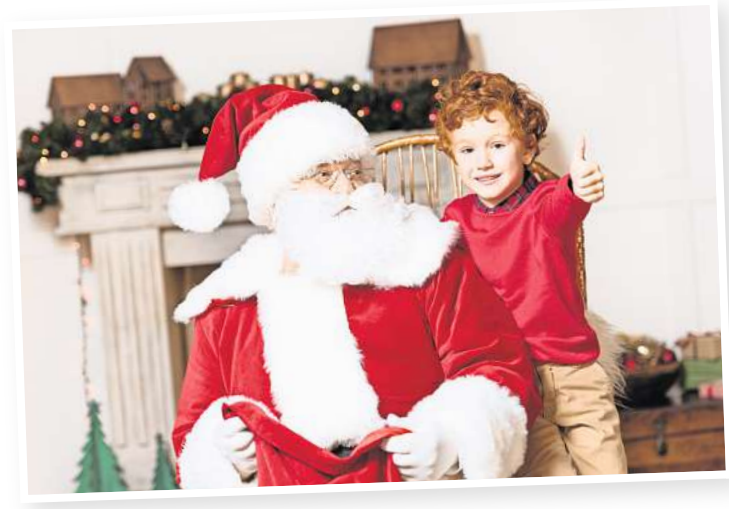
Der Besuch vom Weihnachtsmann ist ein Highlight für Kinder.