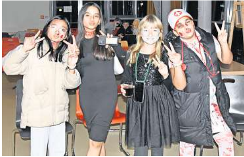
Die Klasse 7G1 und Friends hatten selbst ein Theaterstück geschrieben.