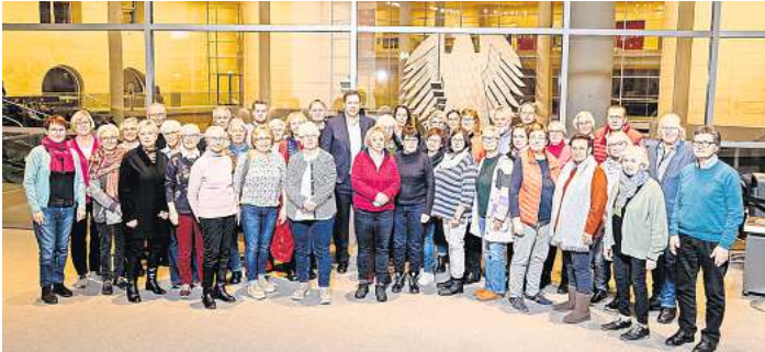
Gruppenfoto der Besuchergruppe mit Lars Klingbeil im Deutschen Bundestag in Berlin.

HEIDEKREIS. Bürgerinnen und Bürger für drei Tage Berlinfahrt mit Klingbeil Etwa 50 Bürgerinnen und Bürger aus dem Heidekreis und Kreis Rotenburg haben auf Einladung des heimischen Bundestagsabgeordneten Lars Klingbeil an einer dreitägigen politischen Bildungsfahrt nach Berlin teilgenommen. Die Teilnehmenden besichtigten unter anderem das Bundeskanzleramt, den Bundestag und hatten die Gelegenheit, sich bei einem einstündigen Gespräch mit Klingbeil über aktuelle Themen und Anliegen aus der Heimat auszutauschen. Auf dem Programm der Bildungsfahrt standen unter anderem die Gedenkstätte Deutscher Widerstand, eine Stadtrundfahrt, ein Informationsgespräch