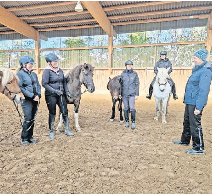
Die Teilnehmer arbeiteten alle an ihrem Knackpunkt.

nehmer des Kurses schnell an ihrem Knackpunkt arbeiten. Ergänzt wurden die effektiven Reitstunden durch zwei Theorieeinheiten. In ihnen wurde zunächst der Istzustand und dann die Zielsetzung für die kommende Turniersaison herausgearbeitet. Anschließend planten alle individuell ihre Trainingsinhalte zur Erreichung der gesetzten Ziele. Die beiden Trainingstage verliefen für alle Teilnehmenden sehr erfolgreich und der Sportkader freut sich schon auf eine Fortsetzung mit Silke Feuchthofen.