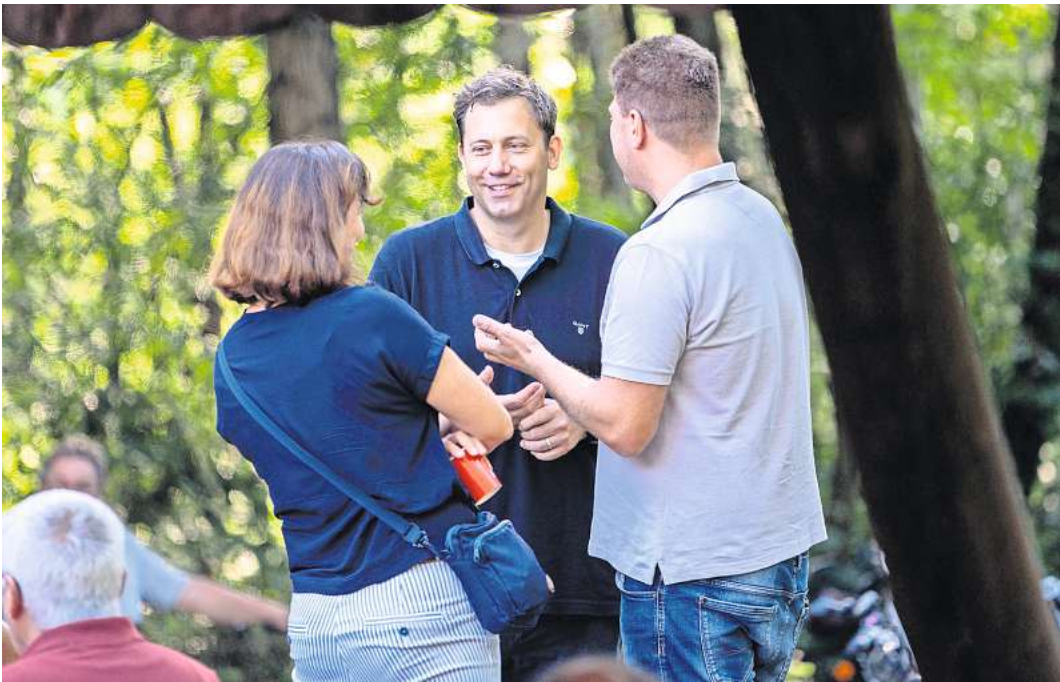
Reger Austausch nicht nur mit Parteigenossen und Genossinnen: Lars Klingbeil (Mitte) beim Grillfest der SPD in Munster.

Bei insgesamt 51 Veranstaltungen in Form von Bürgerdialogen, Diskussions-Runden, Unternehmensbesuchen und Treffen mit lokalen Akteuren und Ehrenamtlichen diskutierte Klingbeil mit mehr als 2.800 Bürgerinnen und Bürgern vor Ort. „Die Tour der Ideen ist das Herzstück meiner parlamentarischen Arbeit für die Region. Hier komme ich mit den Menschen vor Ort auf Augenhöhe ins Gespräch. Vor allem in Zeiten des Umbruchs merke ich wieder, wie wichtig es ist, Politik nahbar zu gestalten. Das heißt: Vor Ort sein, zuhören, erklären, Themen mitnehmen und sich darum kümmern“, sagt der SPD-Politiker zu den Beweggründen seiner Tour der Ideen. Besonders freut habe den hiesigen Bundestagsabgeordneten, dass die Angebote zu Dialogveranstaltungen so gut angenommen worden seien, bei denen Bürgerinnen und Bürger immer zahlreich erschienen sind. „Die Tour hat sehr klar gezeigt, dass die Menschen vor Ort interessiert sind an