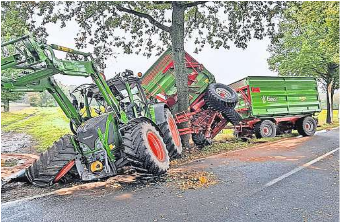
Am zweiten Baum endete die Fahrt: Die Schäden am Traktor und am ersten Anhänger zeugen von der Wucht des Aufpralls.

Der Garbsener war am Sonnabend um kurz nach 8 Uhr mit einem Traktor samt zwei unbeladenen Anhängern aus Resse kommend in Richtung Wiechendorf unterwegs. Als Rehe die Landesstraße 383 querten, bremste der Fahrer ab und wich aus. Das Gespann kam nach rechts von der Fahrbahn ab. Der Traktor kollidierte zunächst seitlich mit einem am Fahrbahnrand stehenden Baum und prallte dann gegen einen weiteren Baum. Dabei wurde der Fahrer leicht verletzt. Der Trecker erlitt vermutlich Totalschaden. Er musste mitsamt des vorderen, stark beschädigten Anhängers abgeschleppt werden. Auch die Bäume wurden erheblich beschädigt. Mitarbeiter der Kreisstraßenmeisterei musste einen