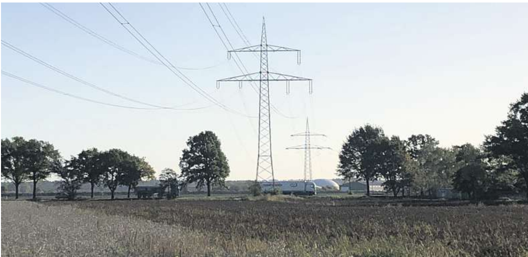
Blick gen Osten: Zwischen den beiden Masten quert die vorhandene Leitung die L190 nördlich von Elze. In Blickrichtung links wird die 110-KV-Leitung geführt, auf der rechten Seite die 220-KV-Leitung.

Alternativlos scheint die Trassenführung durch zwei Engstel-