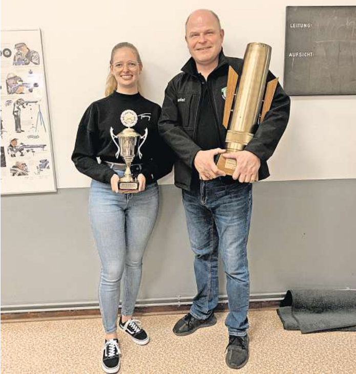
Die Mellendorfer haben jetzt ihre Winterkönige gekürt.