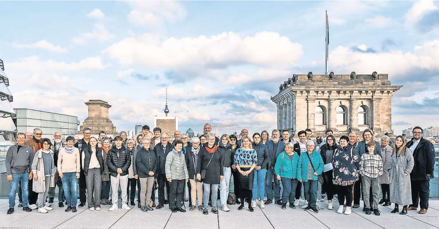
Die Teilnehmer diskutierten auf der Reise über eine Vielfalt von Themen.

Dreitägige Bildungsfahrt führte in die Bundeshauptstadt