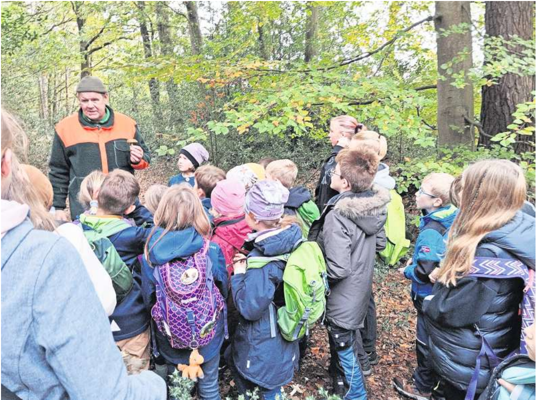
Die Ferienaktion des DVV Abbensen fand großen Anklang.

pedition macht schließlich hungrig und durstig. Nach rund drei kurzweiligen und ereignisreichen Stunden wurden die Kinder wieder abgeholt. Bei den meisten wies die Kleidung deutliche Spuren der „Expedition“ auf, einige waren sichtbar müde, aber Spaß gemacht hat es allen.