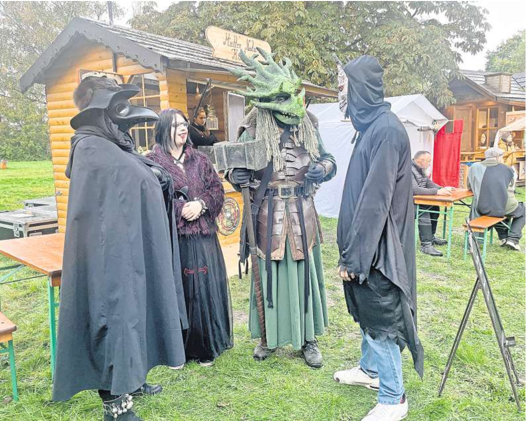
Der Mittelaltermarkt in Mellendorf – ein breites Spektrum an Charakteren.

Wer sich selbst ein Bild von der Welt des Mittelalters und dem Spaß hinterm Verkleiden machen möchte: Das Nordische Marktvolk – Infos unter www.das-nordische-marktvolk.de – ist regelmäßig auch in Niedersachsen auf Veranstaltungen anzutreffen.