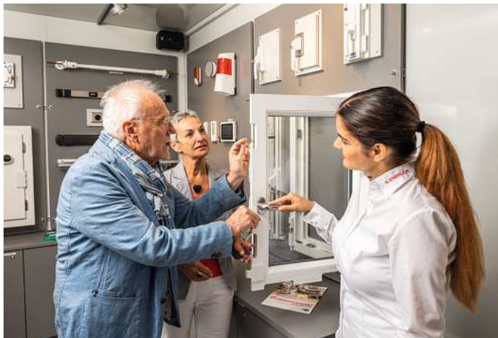
Beratungsgespräch zu Einbruchschutz und Sicherungstechnik.

AM 29. OKTOBER 2023 – „EINE STUNDE MEHR FÜR MEHR SICHERHEIT“