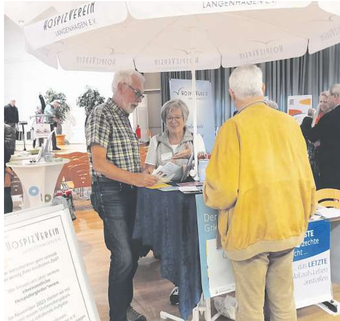
Die Ehrenamtlichen führten am Welthospiztag gute Gespräche.

Gleichzeitig haben die Ehrenamtlichen auf die nächsten Veranstaltungen aufmerksam gemacht.