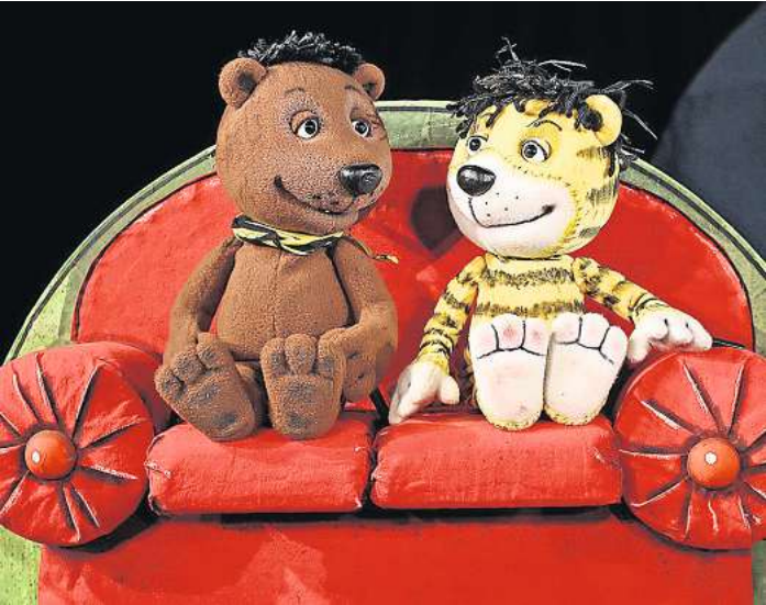
Kinder und auch neugierige Erwachsene sind zum Figurentheater ins Bissendorfer Bürgerhaus eingeladen.

BISSENDORF (kra). Die nächste Gelegenheit zur Blutspende in der Wedemark besteht am Montag, 30. Oktober, im evangelischen Gemeindehaus Bissendorf, Am Kummerberg. Zwischen 15.30 und 19.30 Uhr bittet das DRK dort um Unterstützung. Spender sollten gesund sein und sich fit fühlen. Ab dem 18. bis zum vollendetem 72. Lebensjahr darf Blut gespendet werden. Wer zum ersten Mal dabei ist, sollte nicht älter als 64 Jahre sein. Der Personalausweis muss mitgebracht werden und der Spenderausweis, falls vorhanden. Um einen reibungslosen Ablauf zu gewährleisten, bittet das Deutsche Rote Kreuz darum, vorher einen Termin online auf dem Portal www.spenderservice.net zu buchen. Spontane Spender seien aber ebenfalls willkommen. Zur Belohnung gibt es im Anschluss einen Imbiss vom Blutspende-Unterstützungsteam Bissendorf.