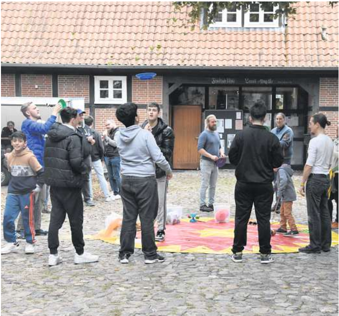
Jonglieren will geübt sein.

In einem kleinen Workshop gab es die Möglichkeit, selbst das Jonglieren auszuprobieren. Der Zauberer „Friedrich“ zeigte in dem Saal des Uhle-Hofes sein Können und löste bei Jung und Alt Erstaunen aus. Auch nach seinem Auftritt verzauberte er die Gäste und verriet eine paar Zauberticks, welche von den Jugendlichen mit großer Begeisterung ausprobiert wurden. Spiele wie Leitertgolf, ein großes Viergewinn, Spike-Ball und die Schussgeschwindigkeitsmessung wurden Open Air auf dem Uhle-Hof-Rasen angeboten. In dem Jugendtreff selber gab es die Möglichkeit unter Anleitung Mangas zu zeichnen und Pokémon-Duelle zu spielen. Interessierte Eltern konnten den Jugendtreff besichtigen und sich