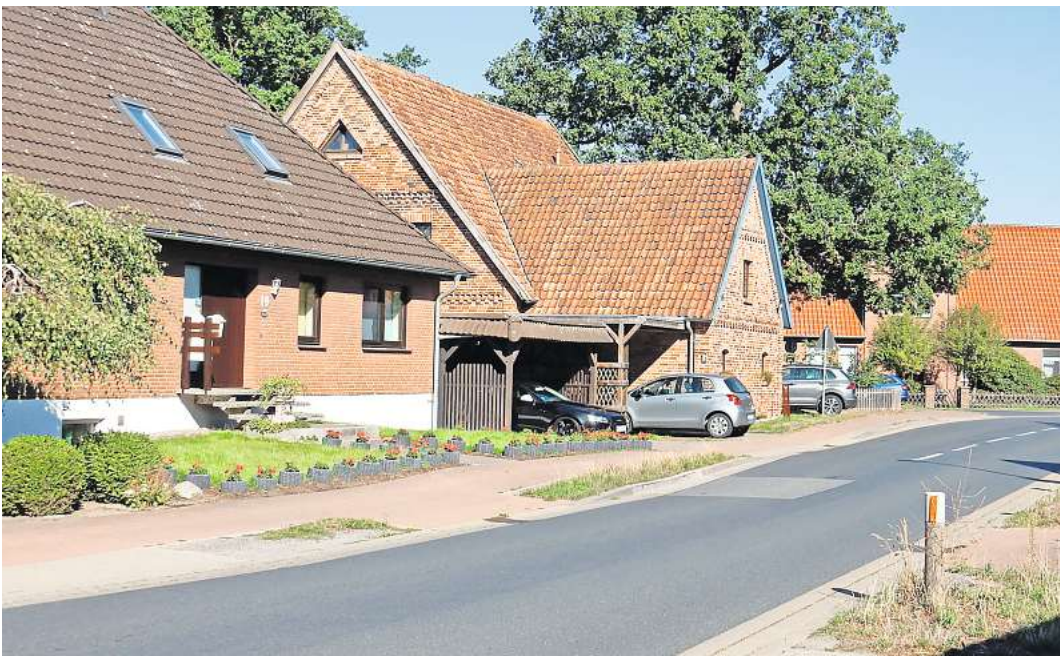
Mögliche Vorgaben: So sieht die typische Bebauung in Meitze aus, an der sich auch eine künftige Gestaltungssatzung orientieren könnte.

Bei denkmalgeschützten Gebäuden greifen diese Regelungen nicht, und bei Bestandsgebäuden gilt eben Bestandschutz. Gedacht ist die Satzung vor allem für Neubauten, um architektonischen Wildwuchs zu vermeiden. Für bestehende Gebäude wird sie dann wirksam, wenn aufwendige Sanierungen nötig werden. Muss das Dach nach einem Sturmschaden erneuert werden, muss dies nach den Regeln der Gestaltungssatzung erfolgen. Jörg Woldenga (VVWR) wollte wissen: „Was passiert, wenn ich eine Wärmedämmung außen machen will?“ Das