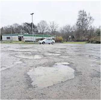
Regengüsse verwandeln den geschotterten Parkplatz am Sportzentrum II regelmäßig in eine Schlammfläche.

Fünf Vereine sind am Sport-zentrum II angesiedelt: der Rad-sport-Club Blau-Gelb Langen-hagen, der Schützenverein Lan-genhagen, der DjK Sparta Lan-genhagen und der Segelclub Pas-sat.