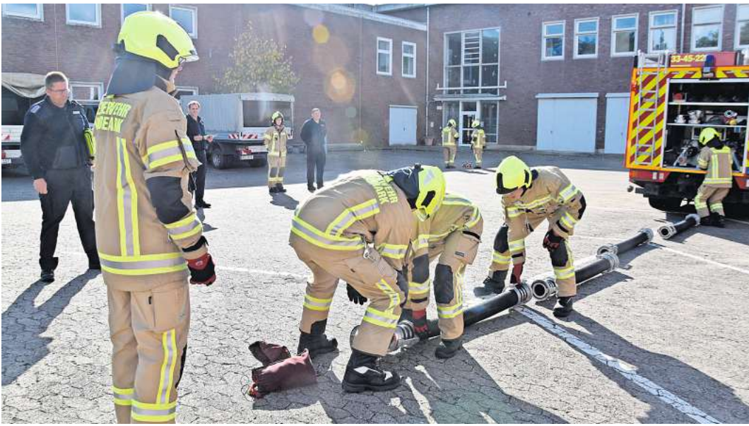
Kritischer Blick der Prüfer im Hintergrund: Die Prüflinge koppeln eine Saugrohrleitung.