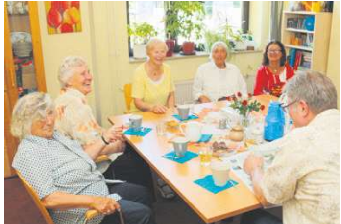
Gemeinschaft ist im Alter wichtig.

Für alle Aktivitäten dürfen die Räumlichkeiten der Emmausgemeinde unentgeltlich genutzt werden, da der Verein satzungsgemäß eng mit der Gemeinde verflochten ist.