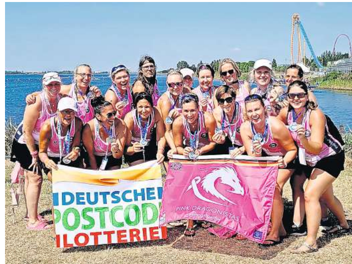
Die Pink Dragonistas holten Gold vor den Irinnen.