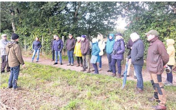
Exkursion durch die Leinewiesen und die Feldmark rund um Schwarmstedt.

Die Route der Exkursion führte die Teilnehmer durch die Leinewiesen und die Feldmark einmal fast ganz um Schwarmstedt herum.