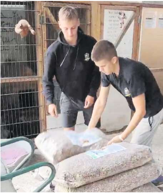
Ankunft der Futterspende in Lwiw.

Ein besonderes Projekt ist die laufende Futterhilfe für das „Haus der geretteten Tiere“ in Lwiw in der Ukraine. Dieses Tierheim nimmt tierische Kriegsgesopfe aus der ganzen Ukraine auf. Hunde, Katzen, Nager und auch Reptilien sind darunter. Dank der großzügigen Unterstützung des Kiebitzmarktes in Schwarmstedt, der das Futter zum Selbstkostenpreis liefert und die Logistik der