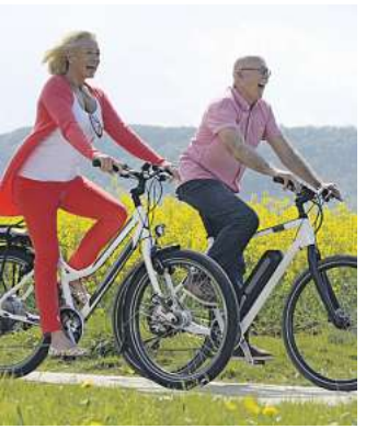
„DAS GEL IST DER HAMMER!“ (Robert S.)

Cannabis ist eine der ältesten traditionellen Pflanzen. Schon seit tausenden von Jahren werden ihre Blü-