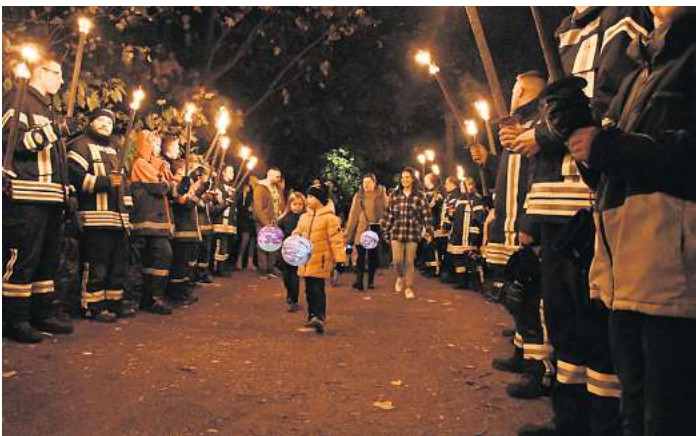
Mit viel Licht: Laternenumzüge, wie hier 2022 in Garbsen, sind bei den Kindern beliebt.

Ebenfalls am 3. November wird es in Hellendorf hell: Die Dorfgemeinschaft richtet das Laternen-