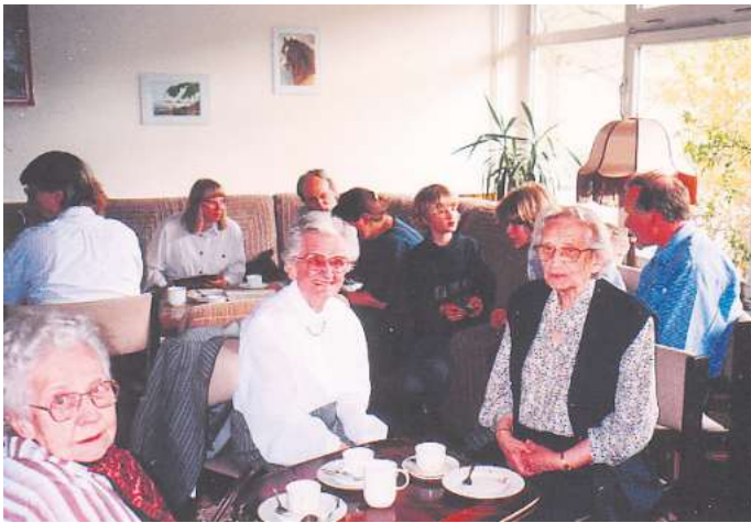
Schon seit drei Jahrzehnten treffen sich Senioren in Langenhagen.

Im Jahr 2006 startete „Diadem“ in Kooperation mit Birkenhof Ambulante Pflegedienste und den evangelisch-lutherischen Kirchengemeinden in Langenhagen. Geschulte Helferinnen und Helfer übernehmen stundenweise die Betreuung von Pflegebedürftigen in Familien, um die pflegenden Angehörigen zu entlasten. Für dieses Projekt wurden Verein und die Kirchengemeinden von der Landeskirche mit dem Siegel „Diakonische Gemeinde“ ausgezeichnet. Aktuell ist der Verein selbst alleiniger Träger von „Diadem“.