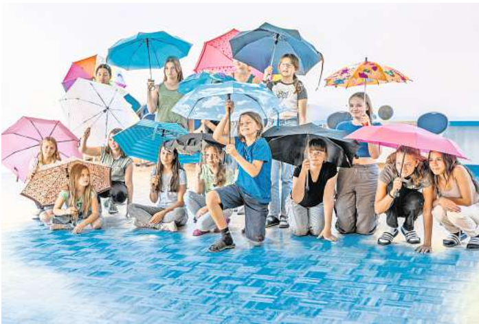
Die Dreieinigkeit spielt auch eine zentrale Rolle im Konzert in Elze.