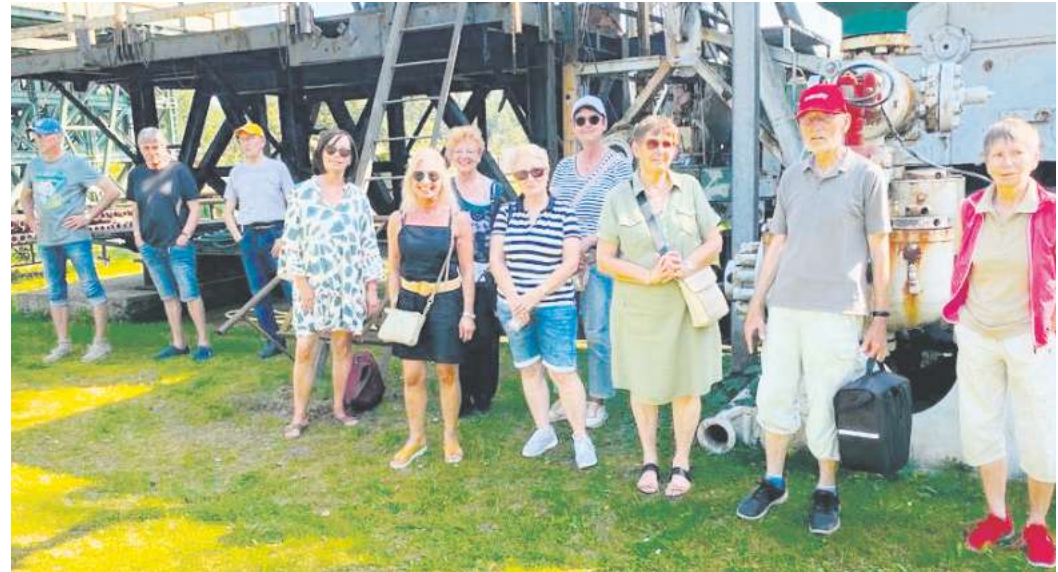
Die Besucher aus Mellendorf hörten viele interessante Geschichten über das Thema Erdöl.

Diese geologische Besonderheit führte um 1900 zu einem Ölrausch in der Südheide. Man hatte in nur geringer Tiefe ein riesiges Ölfeld entdeckt und schnell machten Hunderte von auswärtigen Ölarbeitern seinerzeit den beschaulichen kleinen Heideort vorübergehend zum „Klein Te-