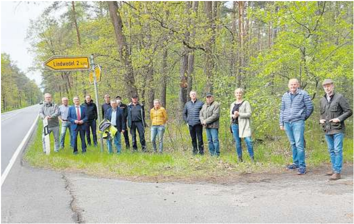
Bereits seit Jahren engagieren sich Samtgemeinde und Gemeinden für den Radweg, wie beispielsweise der Rat Lindwedel 2021 mit einem Ortstermin an der L190.

Hier habe es immer wieder Anträge aus der Samtgemeinde, aber auch aus Lindwedel, Schwarmstedt, Buchholz und Essel gegeben, um den Radwegbau voranzubringen. Gehrs hofft daher, dass viele Bürgerinnen und Bürger den Informationstermin wahrnehmen werden.