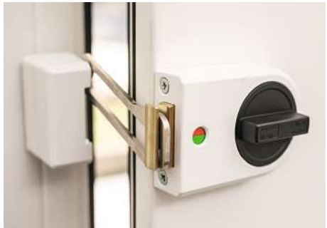
Kastenriegelschloss mit Sperrbügel.

Unabhängig von einer aufmerksamen Nachbarschaft und allgemein sicherheitsbewusstem Verhalten empfiehlt die Polizei auch die Installation von einbruchhemmenden Vorrichtungen. Die Erfolgchancen sind für Einbrecher sehr viel schlechter, wenn Fenster und Türen spezielle mechanische