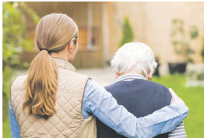
Sich auf Hilfe einzulassen wirkt entlastend.

lps/LK. Der Körper verändert sich. Das ist ein ganz natürlicher Prozess. Obwohl man diesem mit einem gesunden Lebensstil entgegengehen sollte, machen sich womöglich früher oder später Einschränkungen bemerkbar. Solche können sowohl auf physischer als auch geistiger Ebene stattfinden. Entscheidend ist, sich nicht darin zu verlieren. Es besteht immer noch die Möglichkeit, das Beste herauszuholen. Dafür muss man jedoch bereit sein, Hilfe zu suchen und anzunehmen. Auf Hilfe angewiesen zu sein, kann ein Angstgefühl hervorrufen: Man ist nicht länger selbstständig, schwach oder eine Belastung, sind Gedanken, die Betroffene heimsuchen könnten. Es ist wichtig, seinen Frieden damit zu schließen. Dafür kann es helfen, auf sein Leben zurückzu-