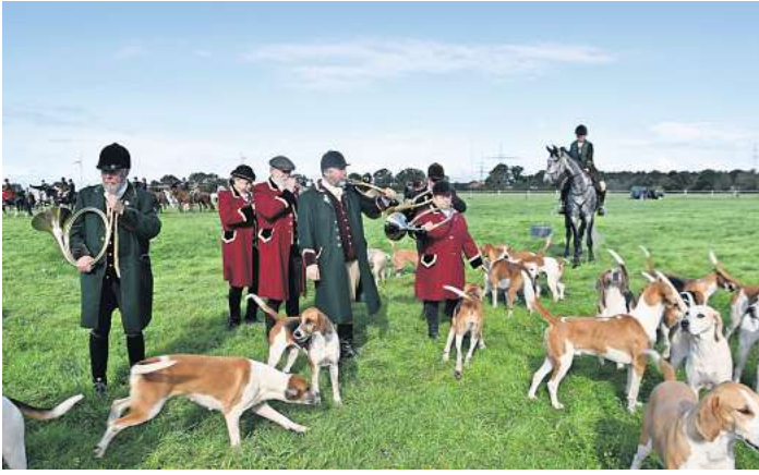
Jagdhornklang gehört dazu: Familie Tessmann stimmt Reiter und Zuschauer mit den traditionellen Signalen auf die Jagd ein.

Das erste Feld hatte 31 Natursprünge zu bewältigen und erledigte dies routiniert. Ein besonderer Höhepunkt der Meitzer Jagd ist stets die Wietze-Querung mit dem steilen Ein- und Ausritt. Und auch diesmal fielen zwei Reiter ins kühle Wasser.