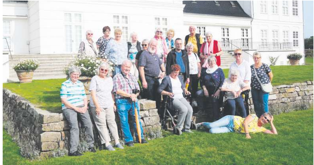
Die Reisegruppe erlebte vier tolle Tage im äußersten Norden Deutschlands.

Krähenwinkel/Kaltenweide. Ab nach Flensburg in die nördlichste Stadt Deutschlands. Schifffahrt, Strand und tolles Wetter. Der Reihe nach: Am ersten Tag Ankunft in Flensburg und gleich die Stadtführung, Höfe, Rum und alte Schiffe. Man glaubt ja die Stadt ist flach wie ein Brett: Irrtum, es ging bergan. Hier in dieser Stadt wurde der Film gedreht den bestimmt alle kennen, nämlich „Werner-Beinhart“. Ach ja da ist ja auch noch dieses „berühmte“ Gebäude. Keine Ahnung? Na, das Kraftfahrtbundesamt mit den Punkten vom Straßenverkehr. Am zweiten Tag ging es entlang der Förde nach Glücksburg zum Wasserschloss. Anschließend nach Kappeln an die Schlei zum Fernsehdrehort „Der Landarzt“. Schiffsrundfahrt mit dem Rad-dampfer auf der Schlei nach Schleimünde. Dritter Tag Königreich Dänemark auf die Insel Als mit Besichtigung vom Schloss Sonderburg. Jetzt erst mal Erholung, ab an den Strand von Son-