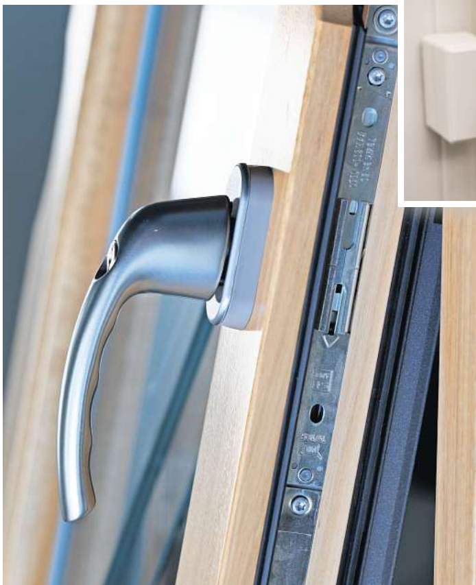
Fensterbeschlag und abschließbarer Fenstergriff.

- Veranstalten Sie ein Nachbarschaftstreffen und laden Sie dafür ggf. Vertreterinnen und Vertreter der Polizei und der Kommune mit ein.