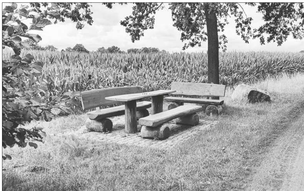
Am 20. August gibt es am Dreikreise-Stein einen gemütlichen Frühschoppen.

Grenzen 2024“ betraut ist und das „Treffen am Stein“ früher immer regelmäßig im Jahr vor den Wettbewerben stattfand, möchte die Dorfgemeinschaft dieses in Form eines Frühschoppen mit den Bewohnern der beiden Neustädter Dörfer Stöckendrebber und Niedernstöcken, aus Rodewald, das zur Samtgemeinde Steimbke gehört, und Suderbruch und Norddrebber aus der Gemeinde Gilten wieder aufleben lassen.