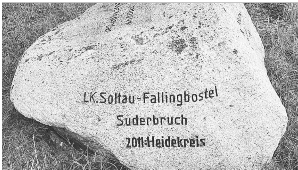
Der Findling mit den Inschriften ist Wahrzeichen einer langen Tradition, die jetzt wiederbelebt werden soll.

Die Ortschaften Stöckendrebber und Niedernstöcken (Landkreis Hannover), Norddrebber und Suderbruch (Heidekreis) sowie Rodewald, zugehörig zum Nienburger Landkreis, pflegten diese Tradition über lange Jahre, bis das Interesse weniger wurde und mit der Corona-Epidemie dann ihr vorläufiges Ende fand. Da die Dorfgemeinschaft Suderbruch mit der Ausrichtung des „Spiels ohne