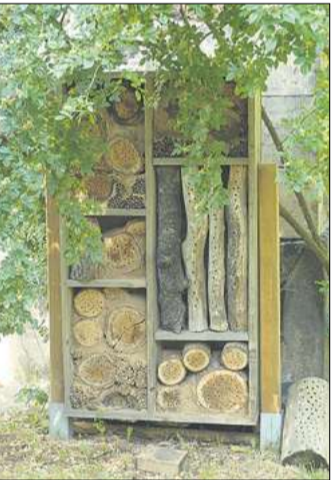
Die Insektenhotels stießen auf viel Interesse.

Mittel in Höhe von 3,58 Millionen Euro werden bis 2026 vom Bundesministerium für Umwelt, Naturschutz und nukleare Sicherheit (BMU) und dem Bundesamt für Naturschutz (BfN) zur Verfügung gestellt.