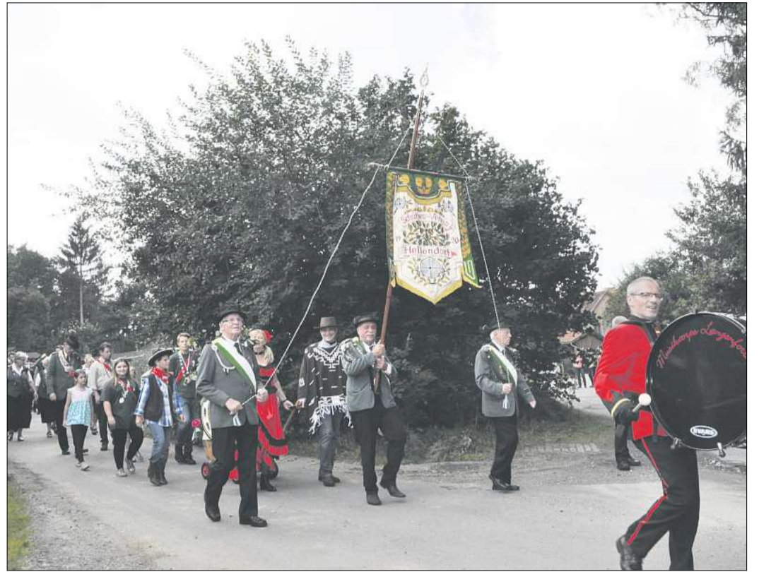
2021: Und los geht der Schützenausmarsch, begleitet vom Musikcorps Langenforth, zum Annageln der Scheiben.

Hellendorf. Sie würden sich über eine festlich geschmückte Wegstrecke freuen, verkünden die Hellendorfer Schützen – und brauchen sich über die entsprechende Mitwirkung ihrer Mitbürger wohl keine Sorgen zu machen. Am Sonnabend, 12. August, be-