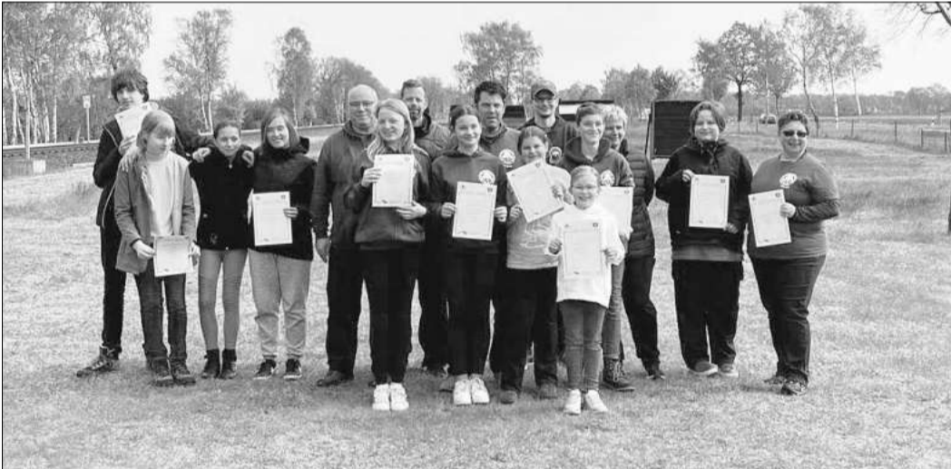
Die Teilnehmer der Vereinsmeisterschaft des SV Hope.

Mit Pfeil und Bogen auf Titeljagd gegangen