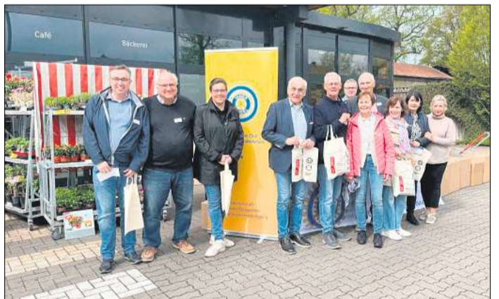
Rotary Club und Inner Wheel packten tüchtig mit an.

Dank der im Vorfeld erfolgten Berichterstattung waren die Kunden bestens informiert und sagten spontan die Hilfe durch ihren Mehreinkauf zu. Die Märkte hat-