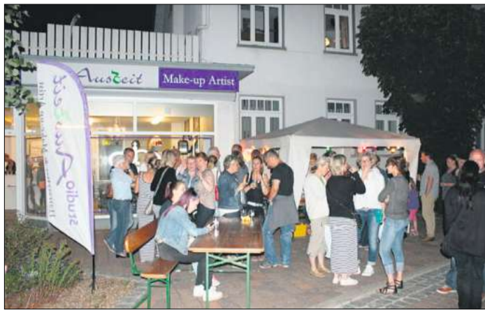
Fröhlich feiernde Menschen vor der „Auszeit“ bei einer der vergangenen Langen Nächte.

21. Juli: Mit Flohmarkt und vielen Aktionen