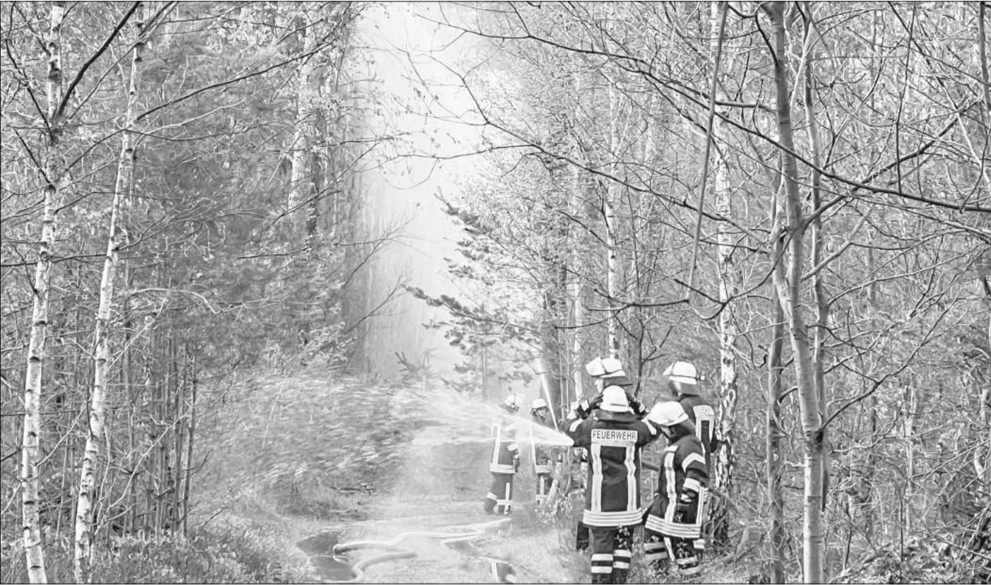
Ausbildung unter realistischen Bedingungen: Ein Waldbrand kann rund um Hope und Lindwedel jederzeit auftreten.

Gemeinsame Übung der Samtgemeindefeuerwehr