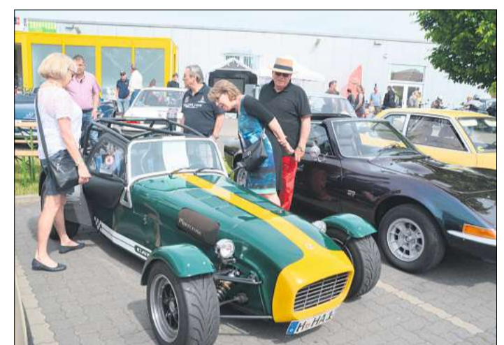
Jeder Oldtimer hat seinen eigenen Fanclub und wird genau inspiziert.