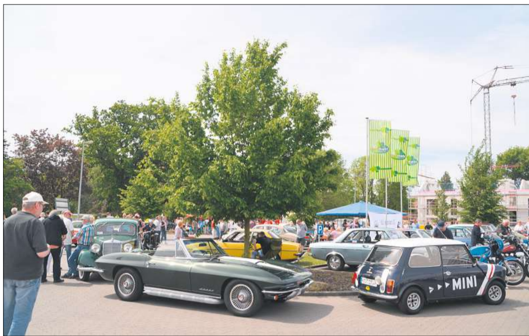
Viele Oldtimerfans zieht es zum Treffen auf den Parkplatz des Frischmarkts Pagel in Resse.

Auf dem Parkplatz, des Frischmarkts Pagel an der Straße Altes Dorf, findet die Präsentation der Oldies statt, zu dem alle Oldtimerfans und diejenigen, die es noch werden wollen, herzlich eingeladen sind. Wie schon in den letzten Jahren soll es auch diesmal wieder ein zwangloses Treffen historischer Fahrzeuge werden, bei dem auch der gemeinsame Erfahrungsaustausch der Teilnehmer nicht zu kurz kommen soll. Eine Anmeldung zu diesem Treffen ist nicht erforderlich. Der Automobil Club