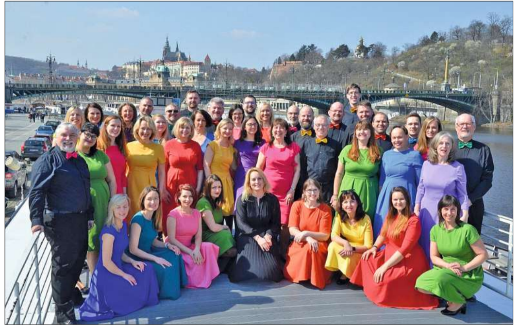
International erfolgreich: die Lucky Voice Band.