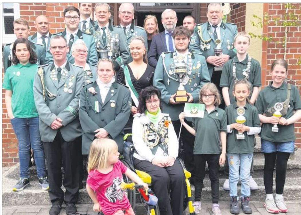
Die Könige mit ihren Rittern sowie Geehrte und Pokalgewinner beim Schützenverein Gilten.