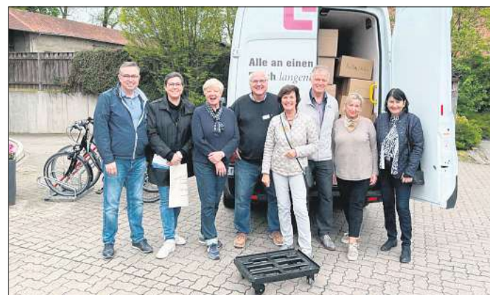
Die Langenhagener Tafel freute sich über die große Unterstützung.

Den vielen Einkaufskunden für ihren Mehreinkauf, den Marktleitern für den Aufbau der gesonderten Aktionsflächen, der Flughafen Hannover Langenhagen GmbH für das Sponsoring der Einkaufsbeutel, der Delkeskamp Verpackungswerke GmbH für die benötigten Kartons und den Ehrenamtlichen der Langenhagener Tafel, die auch am Sonnabendnachmittag die Waren abgeholt und eingelagert haben.