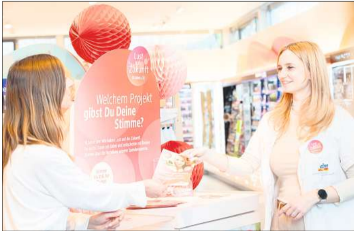
Die dm-Kunden können für ein Zukunftsprojekt abstimmen.

Langenhagen. Zum 50-jährigen Geburtstag fördert dm deutschlandweit rund 3.000 Zukunftsprojekte. Auftakt des dm-Jubiläums ist vom 19. bis 31. Mai in den über 2.000 dm-Märkten und im dm-Onlineshop. Unter dem Motto „Lust auf Zukunft“ feiert dm 2023 seinen 50. Geburtstag und hat zu diesem Anlass die dm-Zukunftsinitiative ins Leben gerufen. Diese hat zum Ziel, die Menschen in Deutschland in den Dialog zu Themen zu bringen, die sowohl dm als Unternehmen bewegen als auch die gesamte Gesellschaft im Hinblick auf eine lebenswerte Zukunft besonders betreffen. Diese Zukunftsthemen sind: Kinder und Jugendliche, Neue Arbeitswelten, Ökologische Zukunftsfähigkeit, Gesundheit und das Ich im Wir. Zum Auftakt dieser Zukunftsinitiative fördert dm rund 3.000 Projekte von Vereinen, Organisationen oder Initiativen, die sich für die Zukunftsthemen engagieren. In den mehr als 2.000 dm-Märkten in Deutschland stellen sich vom 19. bis 31. Mai je zwei Zukunftsprojekte aus dem lokalen Umfeld vor. In diesem Zeitraum heißt es „Zukunft gestalten, Freude teilen“ und Kundinnen und Kunden können in den dm-Märkten ihrem Favoriten ihre Stimme geben. Am Ende der Aktion unterstützt jeder dm-Markt das jeweilige Projekt mit mehr Stimmen mit