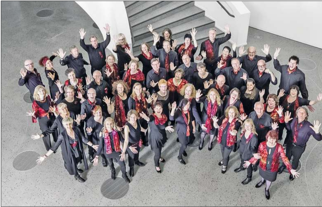
In Brelingen zu sehen: Choir under Fire.

Der Eintritt ist frei, jedoch freuen sich die Sängerinnen und Sänger über Spenden für die Chorarbeit. Weitere Informationen über den Choir under Fire und seine nächsten Konzerttermine finden Interessierte auf der Homepage des Chores unter www.choir-under-fire.de .