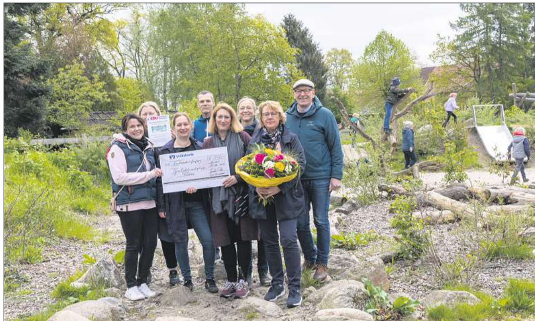
Die Mitglieder der Spielplatzinitiative Buchholz/Aller freuen sich über den Ehrenamtspreis und die Glückwünsche der ehemaligen Ministerin Barbara Otte-Kinast (mit Blumen).

Dieser Einsatz sei vorbildlich und preiswürdig und wurde deshalb mit enormen Beifall und der Verleihung des Ehrenamtspreises bedacht. Barbara Otte-Kinast war