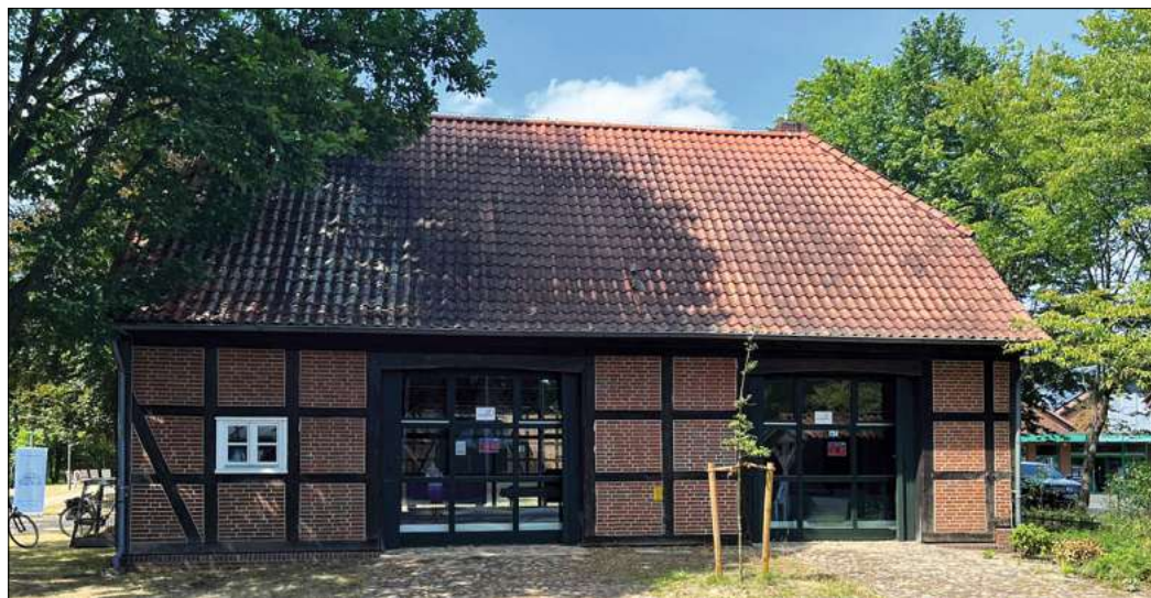
So viele Veranstaltungen wie noch nie werden in diesen Osterferien im Jugendtreff angeboten.

Der MTV bietet zudem in der Vierfeldsporthalle der KGS am Montag und am Mittwoch, in der Zeit von 17 bis 19 Uhr für alle Neun-