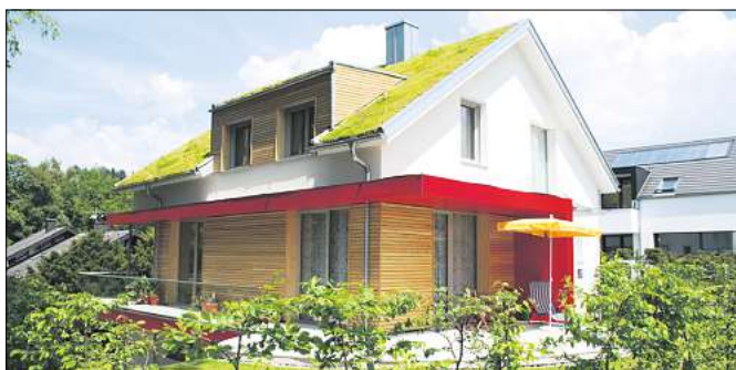
Dachbegrünung tut der Umwelt unheimlich gut.

gewässert werden. Nach circa einem Jahr sollten sich die Pflanzen bereits üppig entwickelt haben. Damit man lange etwas von der Dachbegrünung hat, eignen sich vergleichsweise anspruchslose Pflanzen. Für Dachbegrünungen bewähren sich sogenannte Sedum-Mischungen. Hierzu zählen beispielsweise Mauerpfeffer, Hauswurz und Steinbrech. Diese Pflanzen speichern das Wasser und sind deutlich pflegeleichter als viele andere Pflanzenarten. Die Monate Mai, Juni, September und Oktober eignen sich am besten für die Aussaat.