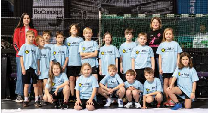
Große Ehre für die Minis des Mellendorfer Turnvereins: Sie liefen an der Hand ihrer Idole in die ZAG-Arena ein.