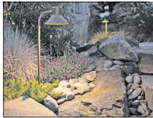
Richtige Lampen für den Außenbereich sorgen für schönes Flair.

Ips/AM. Eine Außenbeleuchtung dient zwar primär der Sicherheit, aber auch auf Balkon oder Terrasse ist die Beleuchtung ein wichtiges Wohnelement. Außenbeleuchtungen weisen Lieferanten, Besuchern und Bewohnern den Weg zur Haustür und können ab der Dämmerung konstant leuchten oder mit einem Bewegungsmelder versehen sein. Damit Nachbarn nicht beeinträchtigt werden, sollte die Außenbeleuchtung nicht zu hell sein. 400 bis 600 Lumen reichen völlig aus, besonders in der Nachtruhe zwischen 6 und 22 Uhr. Was die Arten der Beleuchtungsmöglichkeiten angeht, so hat man eine große Auswahl: Von Wand- oder Wegeleuchten über Spots bis hin zu Teich- und Solarleuchten kann man alles installieren. Wichtig hierbei ist, dass die Außenbeleuchtung zu einem schönen Wohnambiente beiträgt. Schließlich fühlt man sich mit warmweißer Beleuchtung oder im Licht einer dimmbaren LED-Pendelleuchte wohler, als neben einem hellen Spot auf der Terrasse zu sitzen.