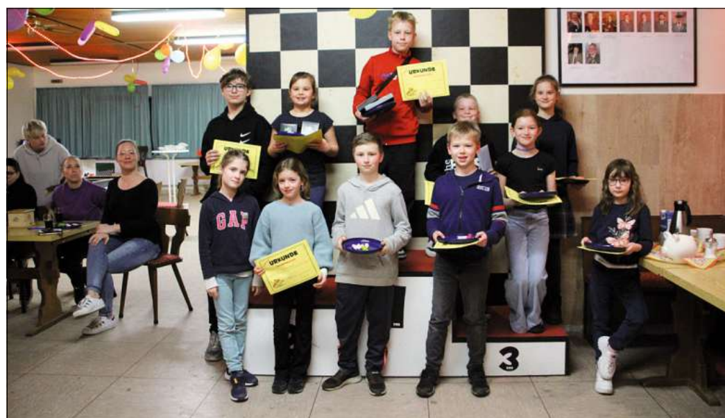
Siegerehrung der Winterspiele des Seifenkistenrennvereins bei den Kindern am Ende eines vergnüglichen Nachmittags.