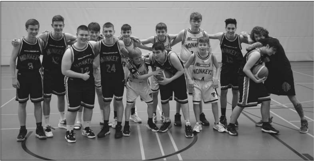
Die Teams der Monkeys sind hochmotiviert bei der Sache.