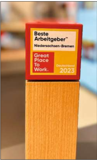
Award „Beste Arbeitgeber Niedersachsen/Bremen“.