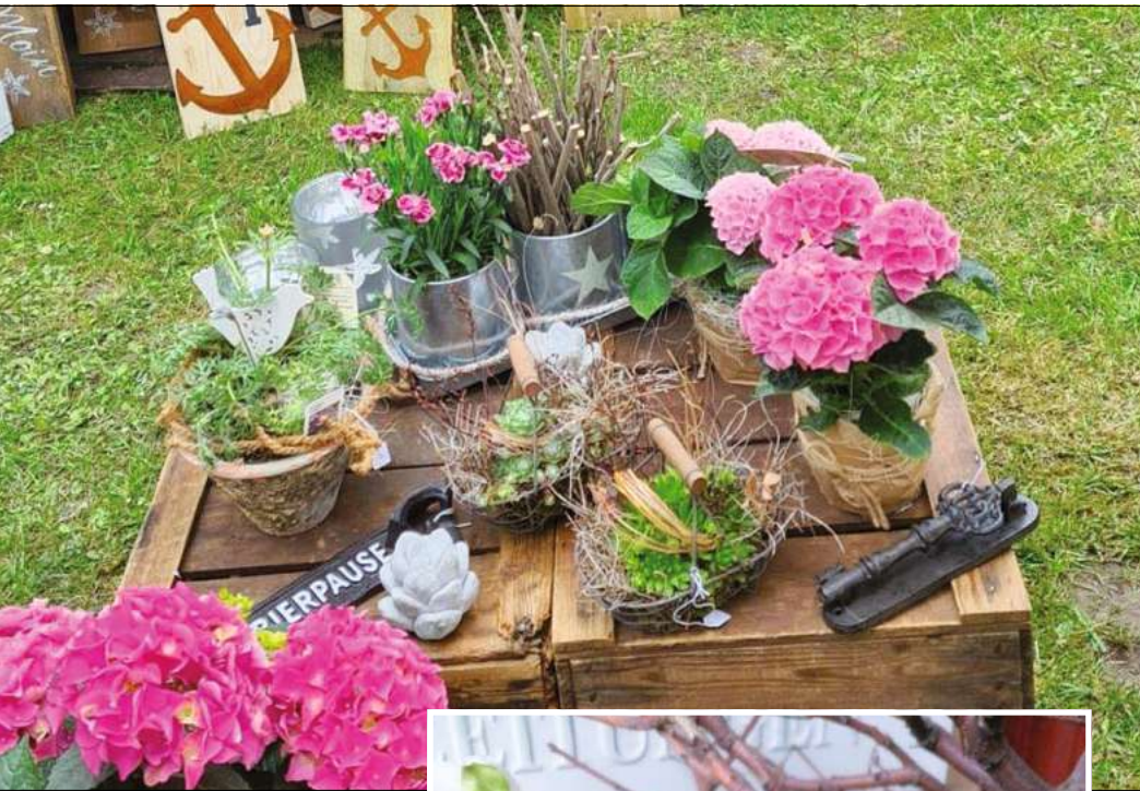
Floristisches und Kunst für drinnen und draußen gibt es auf dem „Kleinen Markt der schönen Dinge“ zu entdecken.