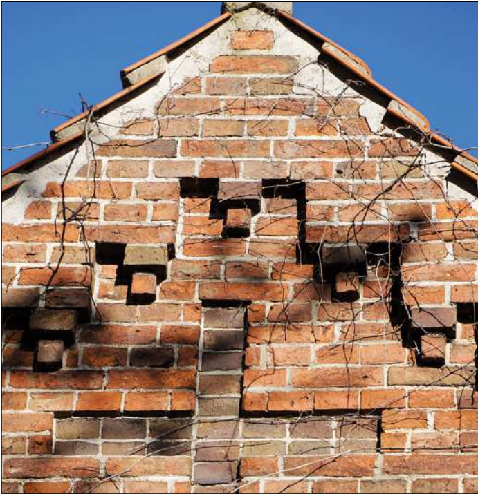
Wer weiß, auf welchem Hof in Elze dieses Detail zu finden ist?

Elze. Damit alle in Zukunft mit noch offeneren Augen durchs Dorf laufen, veröffentlicht der Verein Dorfbild Elze jeden Monat ein Suchbild mit einem Detail eines Hauses oder einer Hofanlage. Dieses Merkmal ist von der Straße aus zu erkennen, sodass das jeweilige Grundstück nicht betreten werden muss. Das Suchbild hängt auch im Schaukasten des Vereins Dorfbild Elze, Wasserwerkstraße 21/21a. Die richtige Lösung kann bis zum Monatsende per E-Mail geschickt oder in den Briefkasten von Wasserwerkstr. 21a oder 23 eingeworfen werden. Der Gewinner oder die Gewinnerin wird unter allen Einsendenden durch Los bestimmt und bekommt einen kleinen Preis (Naturalien aus Elze). Die Lösung kann auch per E-Mail an ehtheilmann@dorfbild-elze.de geschickt werden. Die phantasievolle Wandverzierung, nach der im Februar gefragt wurde, findet man in der Bunten Riede Nr. 16 (Familie Thom). Es schmückt die dem Garten zugewandte Giebelseite am Haus. Auch das zugemauerte