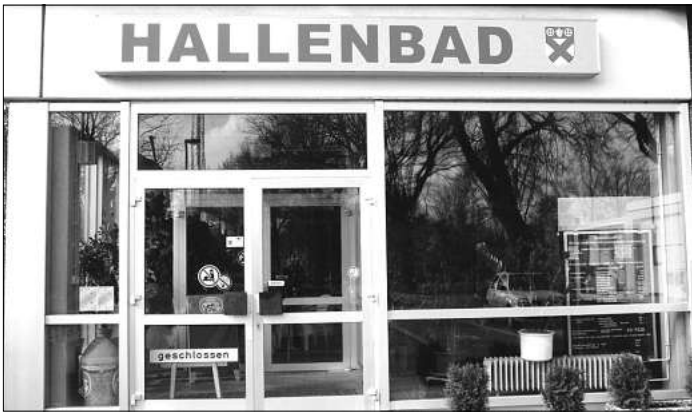
Im Hallenbad Schwarmstedt wird nächsten Freitag ein Spielenachmittag im Rahmen des Ferienprogramms angeboten.

Den Eingang findet man über den Seiteneingang. Die Mitgliedschaft sowie die Ausleihe von Büchern sind kostenlos, die Ausleihfrist beträgt drei Wochen. Zusätzlich bietet die Bücherei Schwarmstedt für Kinder und Jugendliche die kostenlose Nutzung der ebook- und eaudio-Ausleihe an. Für die Ausstellung eines Ausweises ist die Unterschrift eines Erziehungsberechtigten erforderlich.