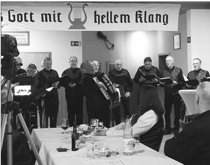
Auftritt des MGV Gilten bei seinem eigenen Sängerbball.