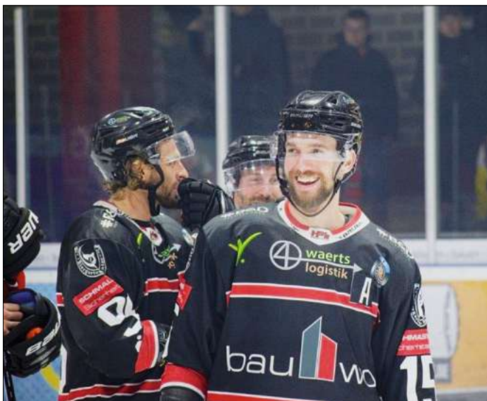
Wie gegen Duisburg wollen die Scorpions auch gegen Füssen jubeln.

Sollte kein Team die Serie in den ersten drei Begegnungen gewinnen, käme es am Freitag, 24. März, in Füssen zu einem möglichen Spiel vier. Das absolut letzte Spiel der Serie fände dann am Sonntag, 26. März, um 18 Uhr wieder auf heimischem Eis in Mellendorf statt.