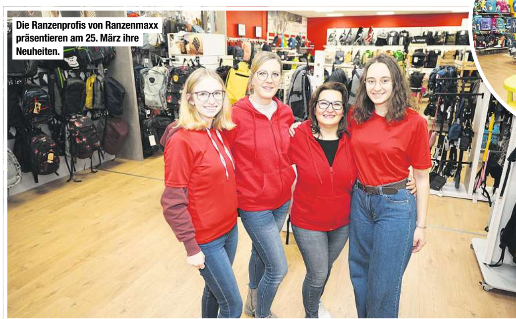
Die Ranzenprofis von Ranzenmaxx präsentieren am 25. März ihre Neuheiten.

Die beliebten Schulanzen von School-Mood gibt es jetzt mit einem vielfach nachgefragten Höhenverstellungssystem. Eine innovative Mate-