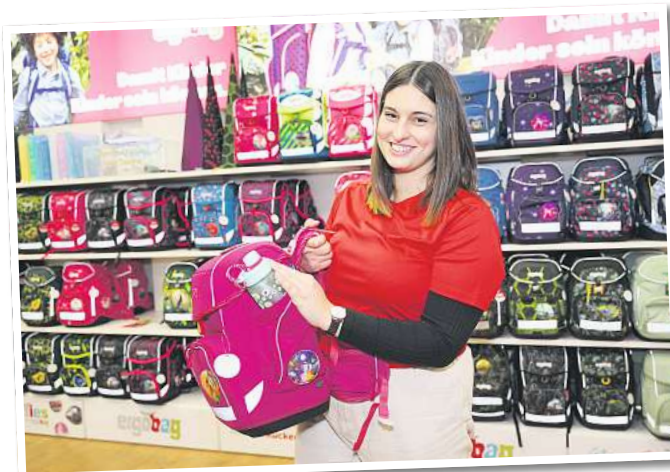
Praktisch: Schulanzen und Rucksäcke von ergobag gibt es jetzt mit integrierten Seitentaschen.