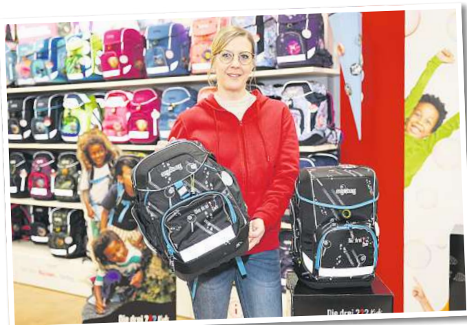
Rätsel gelöst: „Die Drei ???“-Sonderedition von ergobag.