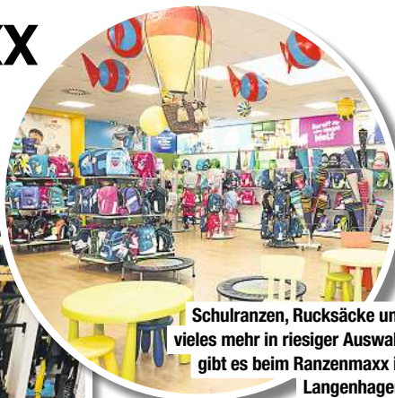
Schulanzen, Rucksäcke und vieles mehr in riesiger Auswahl gibt es beim Ranzenmaxx in Langenhagen.