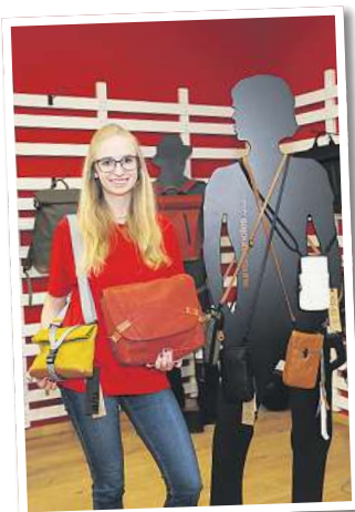
Neu beim Ranzenmaxx: die handgefertigte Leder-Kollektion von aunts & uncles.