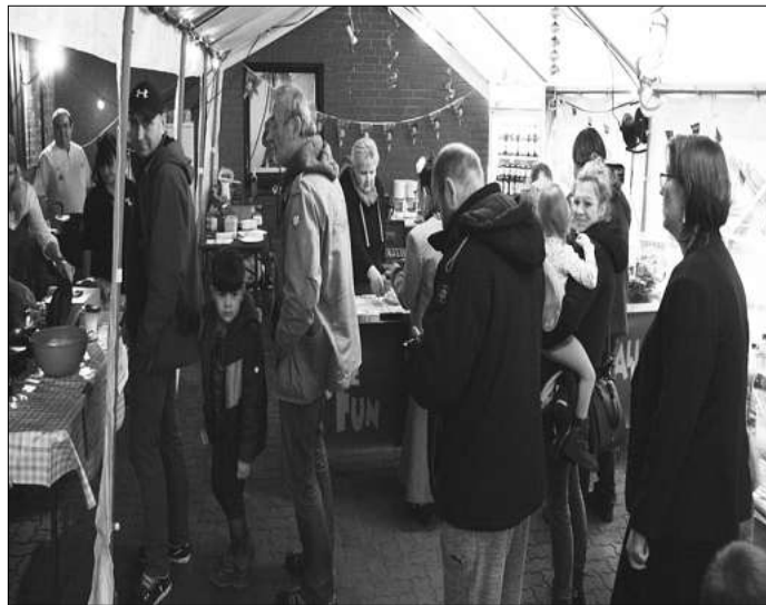
Im Zelt wuselten alle Teilnehmer der Faschingsparty bild durcheinander, auch viele Eltern waren mit dabei.

Das Programm bot eine Mischung aus witzigen Mitmachspielen und tollen Auftritten vom Puppenrock und seinen Freunden. Es wurde getanzt, gespielt und natürlich rumgetobt. Der Aufwand hat sich gelohnt, da sind sich die Organisatoren einig. Zum Abschluss der Party wurde es nochmal spannend, die fünf besten