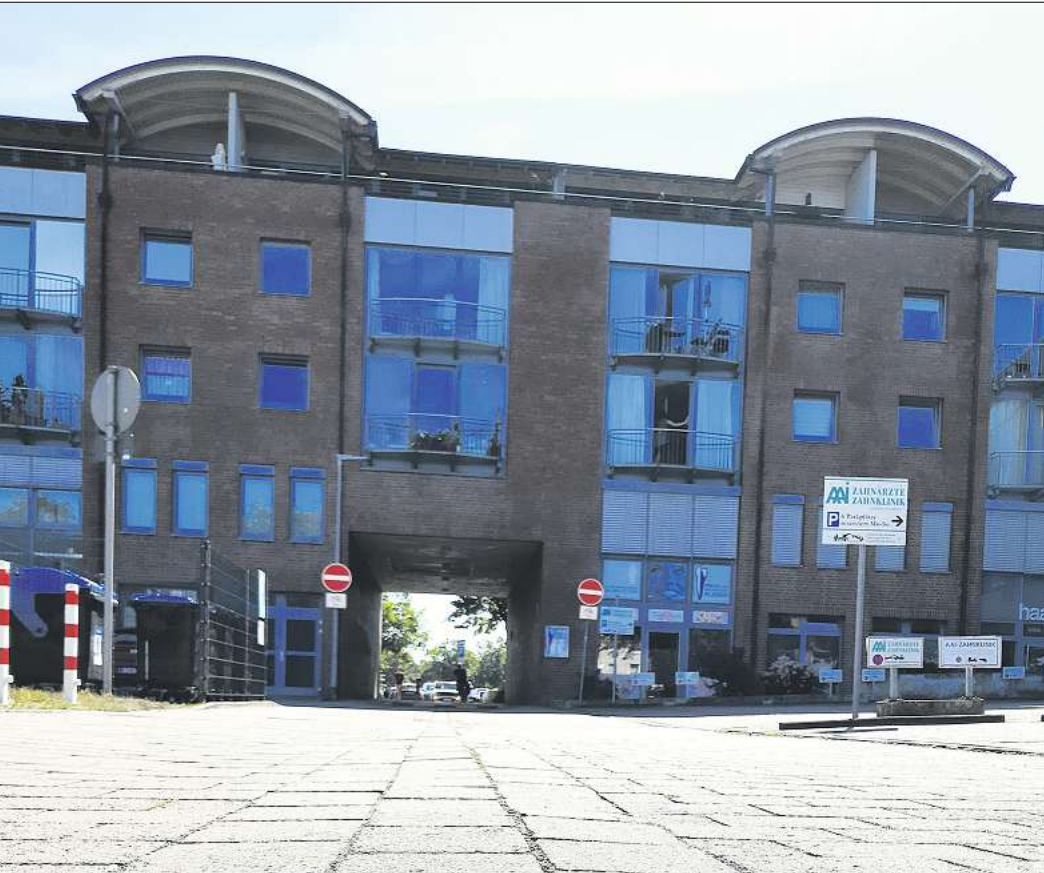
Auch die Durchfahrt in Richtung Parkplatz Schützenstraße wird im Zuge der Fahrbahnsanierung gesperrt.

Langenhagen. Der Walter-Raap-Weg ist ab Montag, 27. Februar, bis voraussichtlich Mitte April gesperrt. Die Stadt lässt dort die Fahrbahn und die öffentlichen Parkflächen wiederherstellen. Sie investiert mit dieser Maßnahme etwa 100.000 Euro in Langenhagens Verkehrsnetz. Im Zuge der grundhaften Sanierung wird auf der etwa 100 Meter langen Verbindung von Schützenstraße und Walsroder Straße der