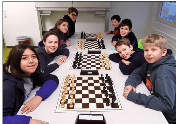
Die Schachspieler des Gymnasiums Mellendorf schlugen sich wacker.