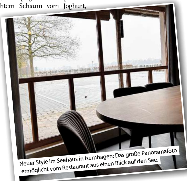
Neuer Style im Seehaus in Isernhagen: Das große Panoramafoto ermöglicht vom Restaurant aus einen Blick auf den See.