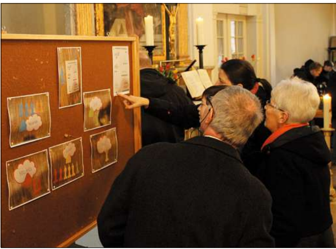
Bilder verdeutlichen, wie die Pastorenstellen in der Wedemark künftig auf die Gemeinden verteilt werden.