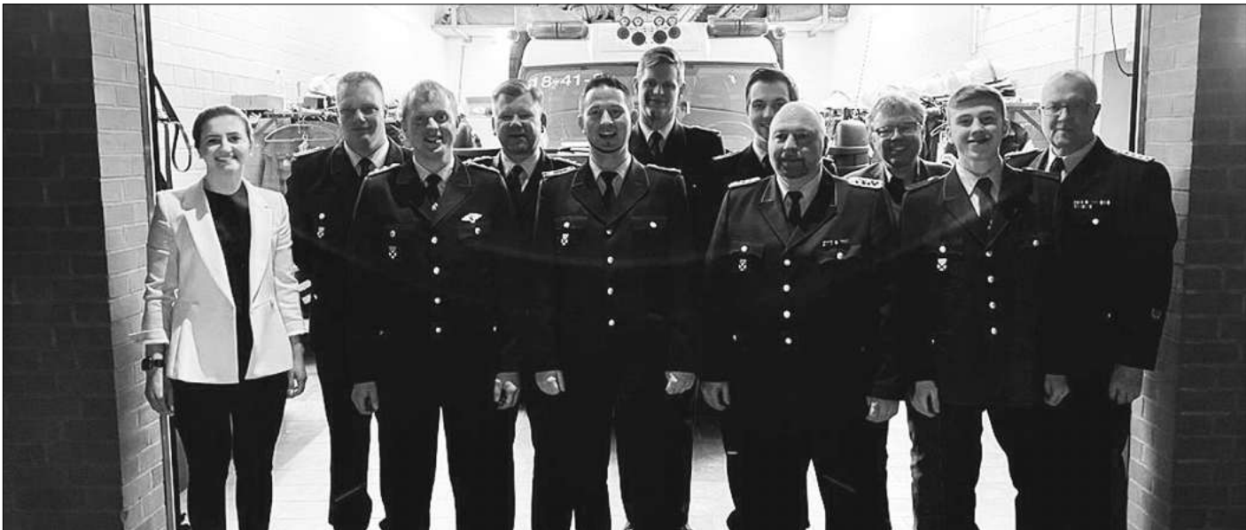
Die Honoratioren mit den Gewählten, Beförderten und Geehrten der Freiwilligen Feuerwehr Marklendorf.

Hauptversammlung der Freiwilligen Feuerwehr Marklendorf