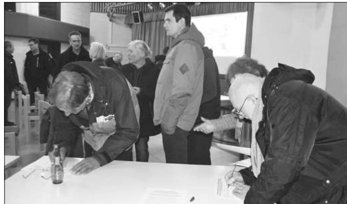
Nach der Veranstaltung trugen sich viele Versammlungsteilnehmer in die ausliegenden Unterschriftenlisten ein.