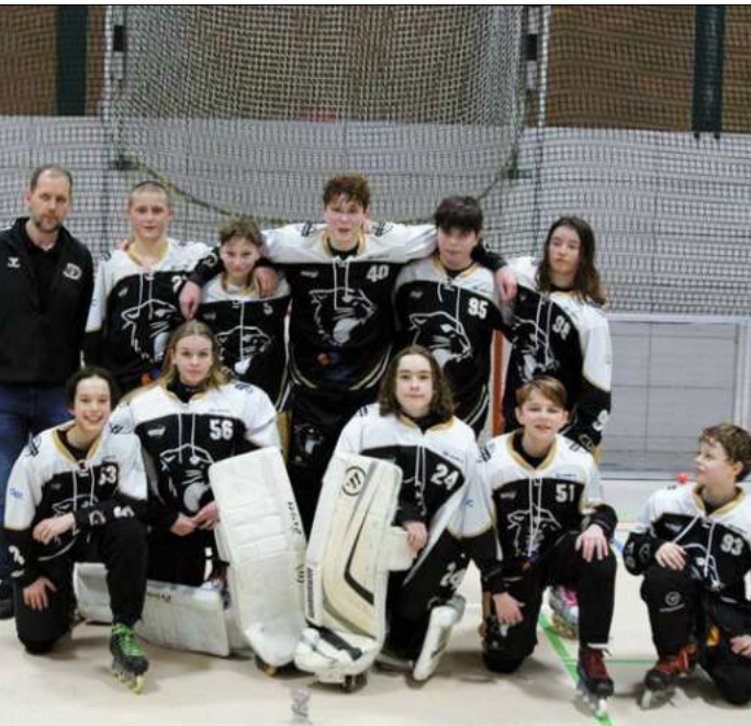
Die U 16 der Bissendorfer Panther.