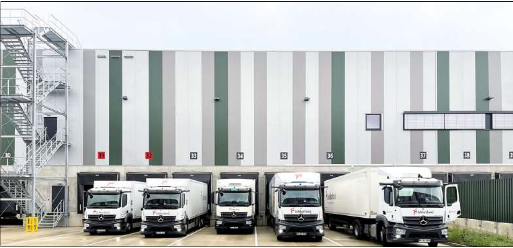
Lekkerland wird von Gailhof aus der Nachfrage im Außer-Haus-Konsum gerecht. Die LKW beliefern von der Wedemark aus Kunden in ganz Norddeutschland.

Gailhof. Das Lekkerland-Logistikzentrum in der Wedemark hat den Betrieb aufgenommen. An dem Standort im Industriegebiet Gailhof sind rund 250 Menschen beschäftigt. Lekkerland, ein Tochterunternehmen der Rewe-Group, beliefert von dort aus rund 4.000 Verkaufsstellen in Norddeutschland, darunter Tankstellen, Convenience Shops und Coffee Stores. Das Sortiment des Großhändlers umfasst nahezu alle Produkte, die beispielsweise in einem Tankstellenshop erhältlich sind: von frischen Snacks wie Salaten und Sandwichs über Lebensmittel, Kaffee und andere Getränke bis hin zu Tabakwaren und Prepaid-Produkten. „Wir freuen uns sehr, dass wir nun hier in der Wedemark angekommen sind. Viele Mitarbeitende wohnen in der Region, sodass bereits eine Verbindung besteht, die über das Logistikzentrum hinausgeht. Diese wird sich in den kommenden Jahren sicher noch vertiefen“, sagt Michael Cohrs, der als Director Logistics North für die Logistik von Lekkerland in Norddeutschland verantwortlich ist. Ab August will Lekkerland in dem Logistikzentrum Ausbildungsplätze unter anderem in den Ausbildungsberufen Berufs-