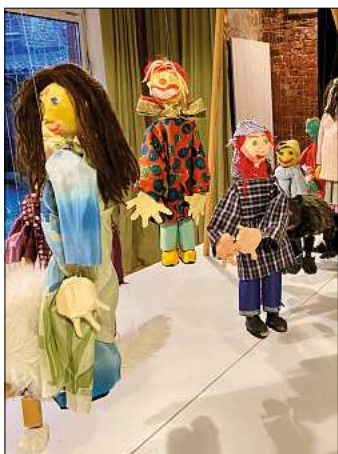
In einem interessanten Kooperationsprojekt mit dem Kulturverein Brelinger Mitte entwarfen die Grundschüler diese Marionetten.