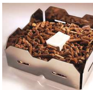
Pellets ersparen das mühevollen Hacken und helfen bei einer sauberen Kaminbefuerung.

Ips/AM. Inzwischen nennen viele Hausbesitzer einen Kaminofen ihr Eigen. Bislang wurde er vermehrt für mehr Gemütlichkeit im Haus eingesetzt. Denn das mühselige Holzhacken wird überwiegend nur für bestimmte Anlässe wie Weihnachten oder romantische Abende zu zweit in Kauf genommen. Mittlerweile setzen jedoch immer mehr Menschen auf einen Pelletkorb, denn er stellt eine attraktive Alternative zur klassischen Heizung mit Brennholz dar. Durch die Nutzung eines Pelletkorbs erspart man sich das mühevollen Hacken, Sägen und Spalten des Holzes. Pelletkörbe bestehen aus formstabilem und feuerfestem Stahl, weshalb sie sehr langlebig sind. Ein weiterer Vorteil ist die saubere Kaminbefuerung, denn die Pressholzpellets fallen so nicht durch das Kamingitter. Die Dichte der Lochung und die Größe des Korbes sind von der Größe der Pellets abhängig. Weiterhin richtet sich die Größe des Pelletkorbs nach der Größe der Kaminkammer. Hierbei etablierte sich eine Standardgröße von 24 Zentimetern, die für die meisten Öfen geeignet ist.