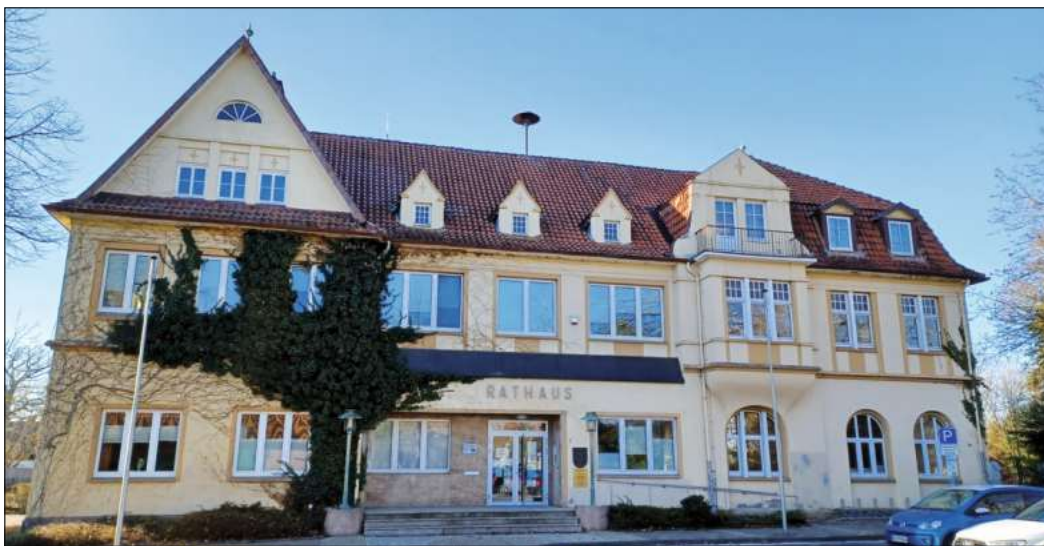
Das Rathaus in Schwarmstedt mit seiner ortsbildprägenden Fassade soll saniert werden. Zahlen zu Raumbedarf und Baukosten müssen aber jetzt erst erhoben werden.

Es war eine teilweise hitzige Diskussion am Montagabend im Uhle-Hof. Um den Beschluss unter Dach und Fach zu bekommen, war schließlich sogar eine Sitzungsunterbrechung notwendig.