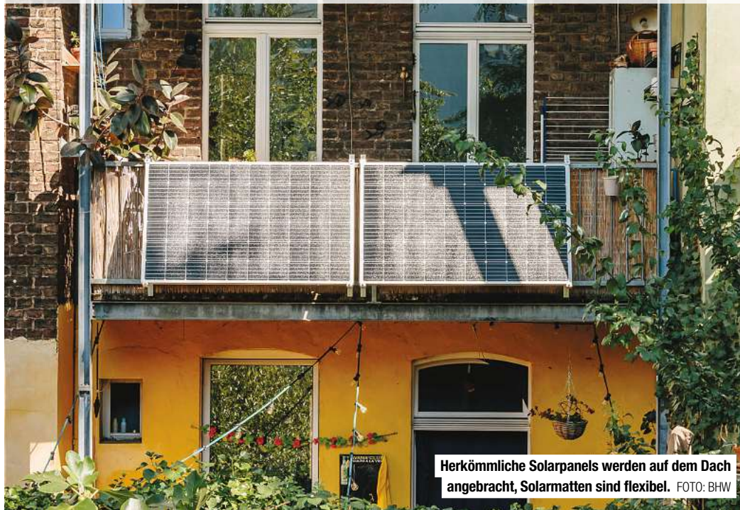
Herkömmliche Solarpanels werden auf dem Dach angebracht, Solarmatten sind flexibel.

Ips/AM. Balkonkraftwerke arbeiten genauso wie ihr großes Pendant auf Hausdächern oder Solarparks. Die Mini-Solaranlagen senken die Stromkosten im eigenen Zuhause und schonen gleichzeitig die Umwelt. Sie können sowohl am Balkongeländer als auch auf einem Garagendach oder an der Hausfassade angebracht werden. Dadurch sind sie für nahezu jeden Haushalt geeignet. Durch ihre einfache Handhabung werden Balkonkraftwerke auch oft als Stecker-Solargeräte bezeichnet. Sie zeichnen sich durch