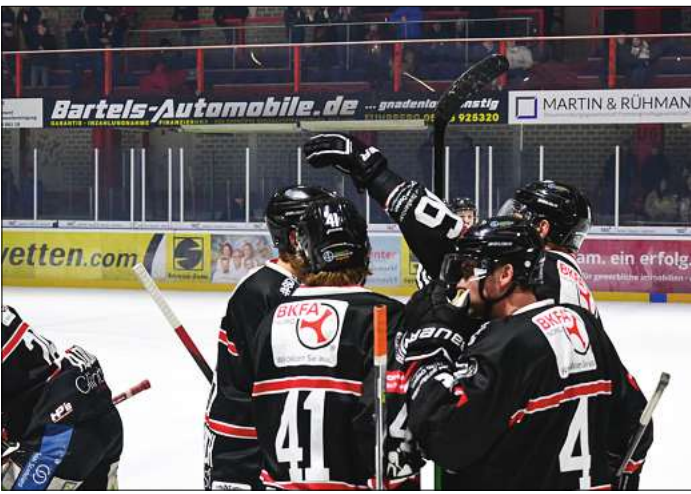
Die Scorpions jubelten auch im Spiel gegen die Piranhas aus Rostock.