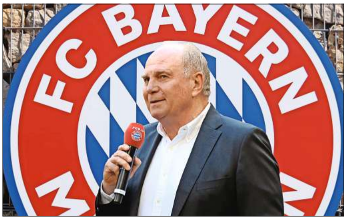
Der Stargast beim 150. NP-Anstoß: Bayern-Ikone Uli Hoeneß.

Hannover. Zum 50. Anstoß war Europameister Thomas Helmer da. Zum 100. Anstoß kam mit Weltfußballer Lothar Matthäus eine lebende Legende nach Hannover. Nun wird der Kult-Talk der Neuen Presse, der die Fußballfans in der Region seit zwölf Jahren begeistert, 150. Das wird natürlich groß gefeiert, am Donnerstag kommender Woche, 16. Februar. Um 18 Uhr treffen sich die Teilnehmer in der Alten Druckerei, der neuen Eventlocation auf dem Gelände der Madsack Mediengruppe in Hannover-Bemero-de, August-Madsack-Straße 1. Zur Feier des Tages lädt die Neue Presse so viele Leserinnen und Leser, Sponsoren und Freunde des Anstoß-Talks ein, wie niemals zuvor bei diesem Format. 500 Gäste sollen es werden, für Gratis-Getränke werden Bierwagen der Gilde bereit stehen, und es gibt vorab einen Snack. Tatsächlich ist es der NP-gelungen, nach Helmer und Matthä-