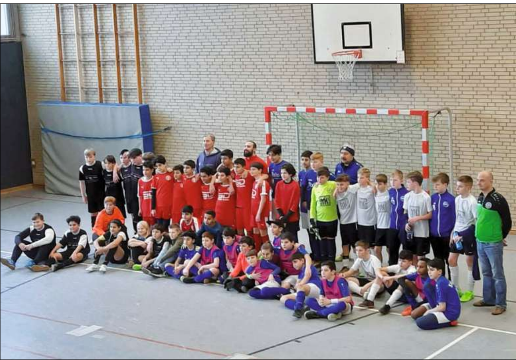
Die Kieler und die Brelinger in der Sporthalle.