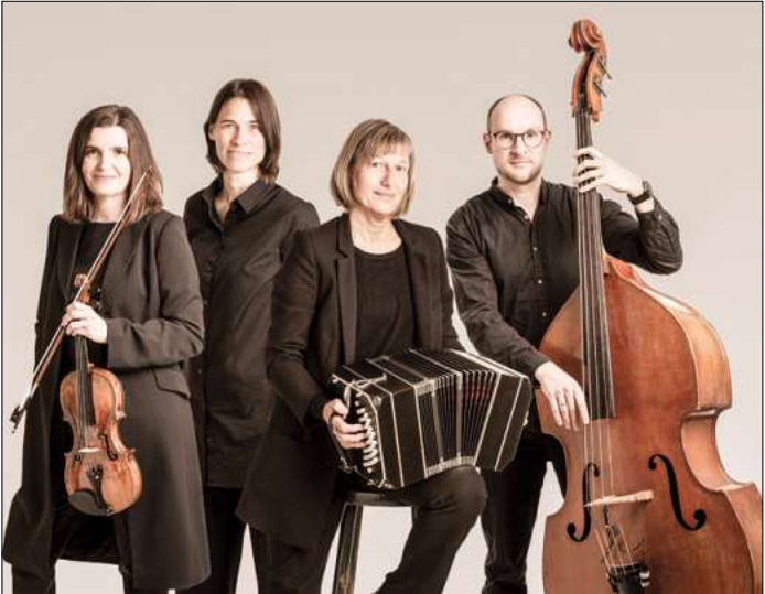
Das Ensemble faux pas.