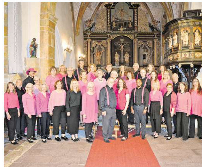
Der Chor AnySingElse.

Tipp: Im Rahmen eines Workshops mit dem Künstler „Kira – funkeln Insekten“ am Sonntag, 17. Mai, von 16 bis 18 Uhr, können aus Glasperlen, Sicherheitsnadeln und Draht künstlerische Insekten geschaffen werden. Arbeiten von Künstlerinnen und Künstlern, die sich an der Intraregionale beteiligen, sind in zehn weiteren Kunstvereinen zu sehen. Hinweise über die einzelnen Standorte sind auf der Website www.intraregionale.org zu finden. Entsprechende Info-Flyer sind auch beim Imago Kunstverein erhältlich. Öffnungszeiten: Mittwoch bis Freitag von 11 bis 13 Uhr und 15 bis 18 Uhr, Samstag von 11 bis 13 Uhr und 15 bis 17 Uhr, Sonntag von 15 bis 17 Uhr, an Feiertagen geschlossen.