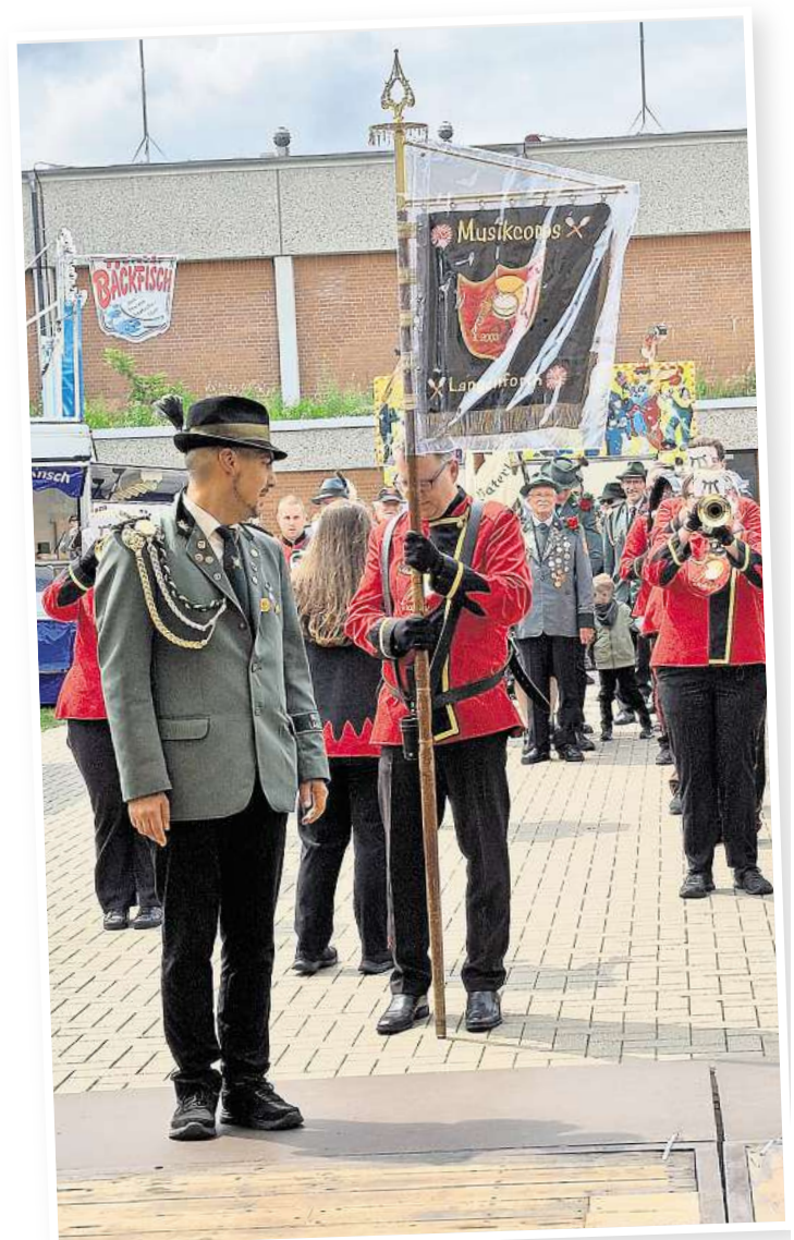
Vor dem großen Ausmarsch zum Scheibennageln werden die Gastvereine mit musikalischer Begleitung begrüßt.

Schützenkönigs die Ziele. Mit einer letzten Tanzparty zu Hits der 90er und der 2000er Jahre endet das Mellendorfer Schützenfest 2026.