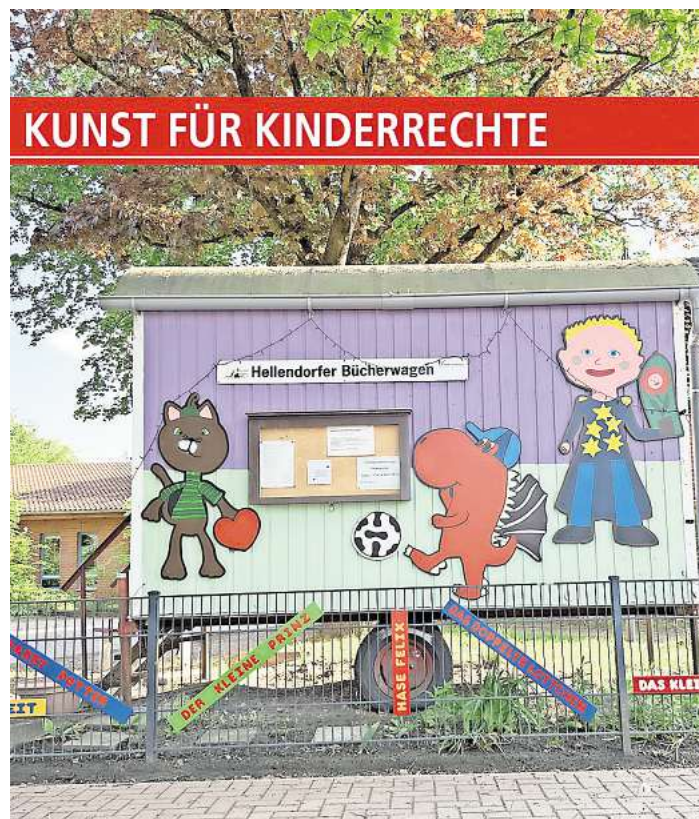
Jetzt Bücherwagen - ursprünglich Kinderrechts-Kunstwerk.