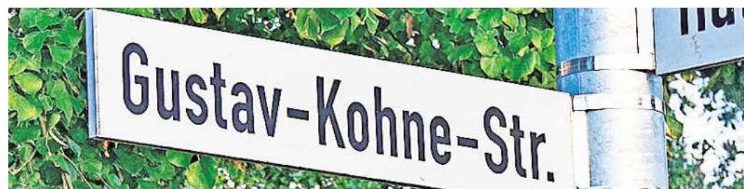
In der Nähe des Hofes, wo er aufwuchs, befindet sich die Gustav-Kohne-Straße.