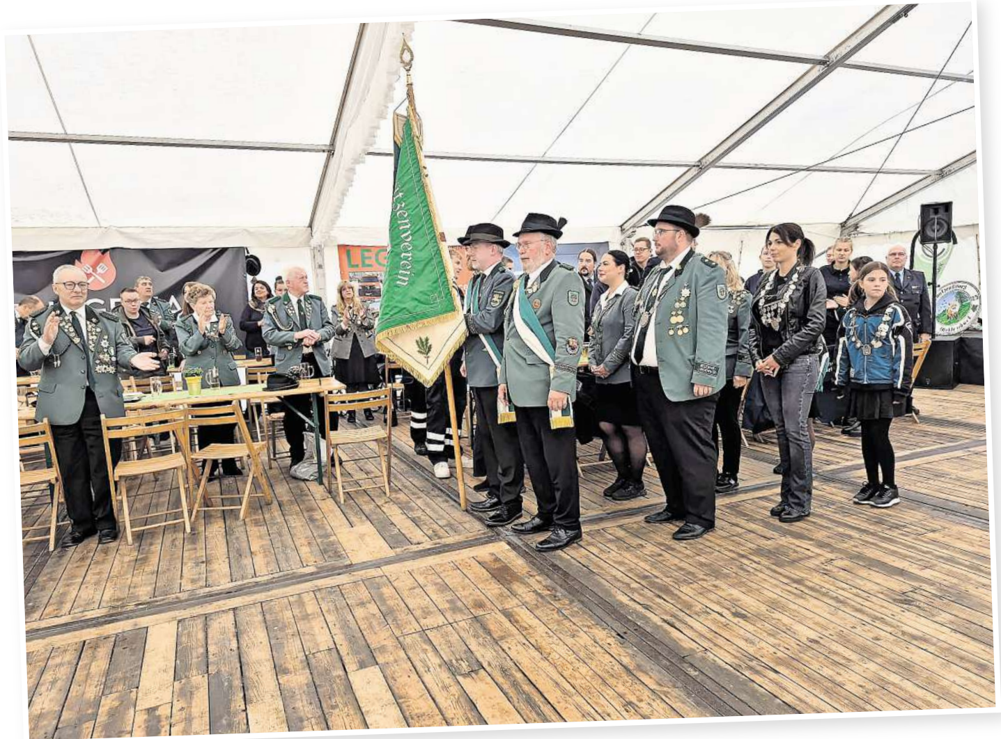
Mit dem Einmarsch der Vorjahres-Majesäten startet in jedem Jahr das Mellendorfer Schützenfest.