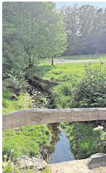
Malerischer Zulauf.

stoßen wir auf ein gemauertes Häuschen, das einen besonderen Zweck hat: Es ist ein Fledermausquartier. Ein Stück weiter führt eine kleine Brücke über den Zulauf, der zeigt, wo das Wasser herkommt, dass im Rückhaltebecken bei hohen Niederschlagsmengen gesammelt wird: Aus den nordwestlichen Gebieten Mellendorfs.