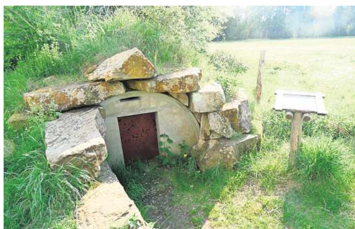
Fledermausquartier für den Winter.

dern, die zur Gestaltung gehören. Vögel zwitschern. Es ist ein kurzer Rundgang, der Spaß