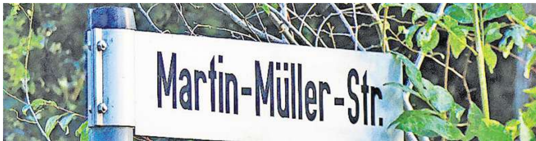
Die Martin-Müller-Straße liegt im Süden Brelingens