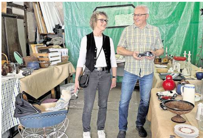
Besuch aus der Nachbargemeinde: Lindwedels Bürgermeister in der Flohmarktscheune der Familie Theilmann.

Von Werkzeug über Porzellan und Keramik bis zu Möbelstücken reichte das Angebot und wenn man etwas Schönes gefunden hatte und beim Preis vorsichtig nachfragte, war die Antwort oft erfrischend: „Ach, geben Sie mir zwei Euro“ ist einfach eine gute Nachricht, wenn man zwei alte charmante Bücherstützen gedanklich schon im eigenen Bücherzimmer vor Augen hat.