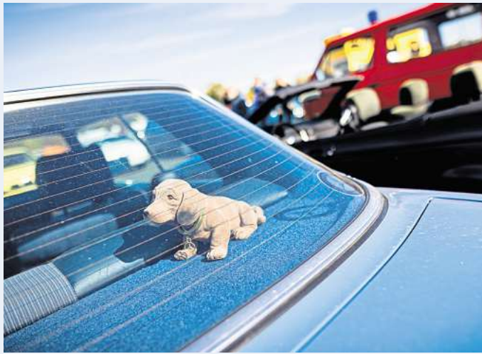
Seltene Tier oder aussterbende Art? Der Wackeldackel versieht laut einer Umfrage in rund zwei Prozent der Autos in Deutschland seinen treuen Dienst.

So besitzen etwa nur 87,5 Prozent der befragten Auto-Verschönerer einen Verbandskasten. Dabei müsste die nützliche Kiste laut Straßenverkehrszulassungsordnung in 100 Prozent aller Autos vorhanden sein. Auch bei der Warnweste (82 Prozent haben sie dabei) und dem Warndreieck (86 Prozent)