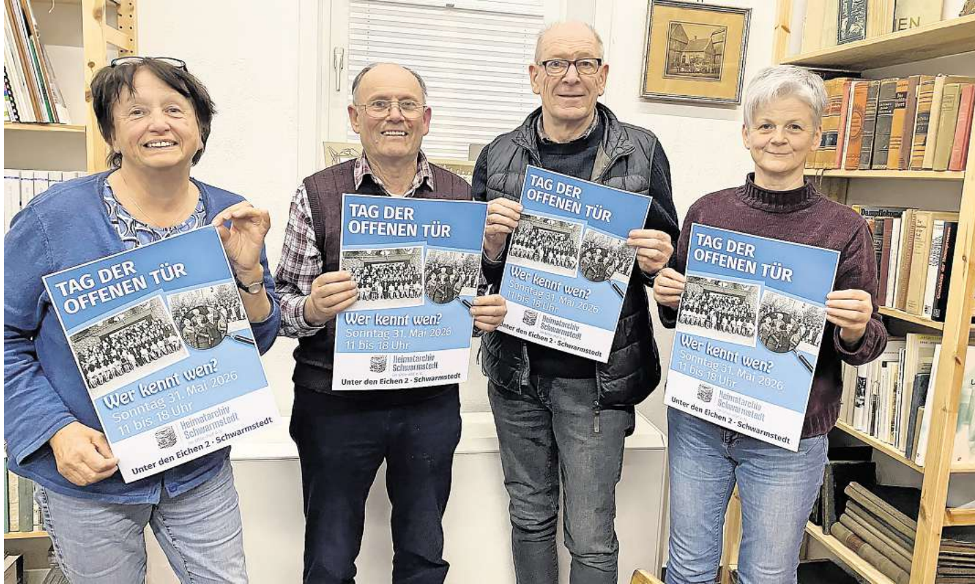
Das Team des Heimatarchivs lädt ein.