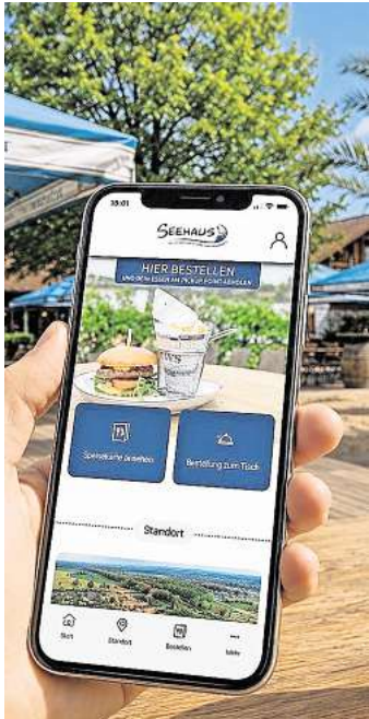
Online bestellen – ab 22. Mai möglich.

Abholung am Pickup Point. Das Ziel: Mehr Entspannung statt Warteschlange – und mehr Zeit,