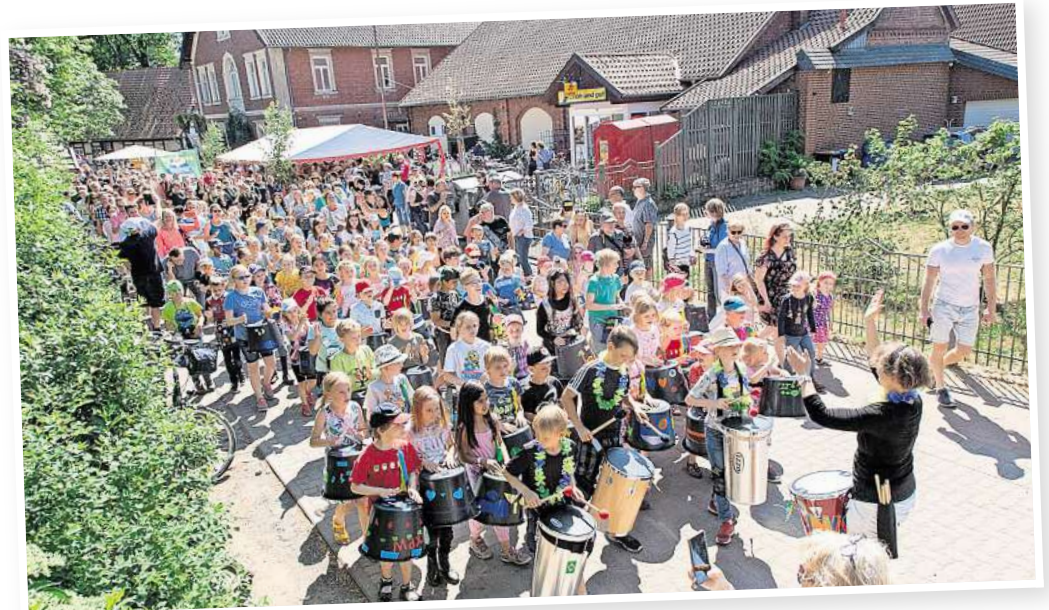
Auch diesmal wird die Trommel-Gruppe wieder durch das Dorf ziehen und für Aufmerksamkeit sorgen.

Es gibt Tische, an denen wird die 20-jährige Geschichte des Kulturvereins lebendig und erlebbar gemacht. Zu erleben gibt es vom Hufbeschlag bis zu Oldtimern, Töpferkunst viele weitere Höhepunkte ein pralles Programm. Ein informativer Flyer, der an zentralen Punkten im Dorf und in der Brelinger