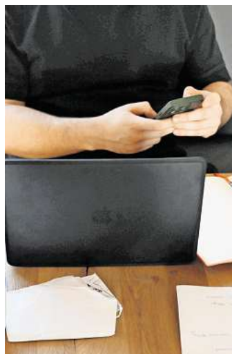
Die Arbeit von zu Hause erledigen: Aus steuerlicher Sicht kann das – gerade bei kurzen Arbeitswegen – durchaus lohnenswert sein.

Für viele Beschäftigte kann das Homeoffice daher finanziell die bessere Wahl sein. Denn die sechs Euro pro Tag sind unabhängig von Entfernung oder tatsächlichen Kosten – und damit klar kalkulierbar. „Wer nur wenige Kilometer zur Arbeit fährt, erhält über die Entfernungspauschale oft weniger als im Homeoffice“, sagt Karbe-Geßler. Wer es sich also aussuchen kann und nur einen kurzen Arbeitsweg hat, fährt mit der Heimarbeit steuerlich besser. Wichtig: Ganz gleich, für welche Pauschale man