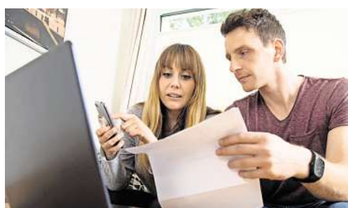
Besser zu zweit als allein: Finanzthemen sollten Paare im Idealfall gemeinsam angehen.

eingebundene Partner schnell überfordert sein. Häufig fehle der Überblick über Konten, Depots, Versicherungen und laufende Verpflichtungen. Anlage und Entnahmeentscheidungen müssten plötzlich unter emotionalem Druck getroffen werden. „Das begünstigt Fehlentscheidungen“, so Craatz. Dieses Risiko lässt sich Craatz zufolge reduzieren, indem beide Partner frühzeitig finanzielle Angelegenheiten gemeinsam angehen und somit Transparenz über alle Vermögenswerte besteht. „Besonders hilfreich ist eine zentrale digitale Übersicht über sämtliche Ver-