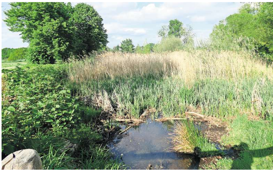
Ganz schön zugewuchert.

Ruhig ist es hier am Wochenende, wenn Schulen und Kita geschlossen sind. Geschichtetes Holz, idealer Unterschlupf für Kleingetier, weist uns in Heckenform den Weg. Der führt um das Wasserbecken herum, das derzeit kaum als solches zu erkennen ist, denn große Gräser haben den Grund erobert. Doch der Weg ist frei und beim Umrunden