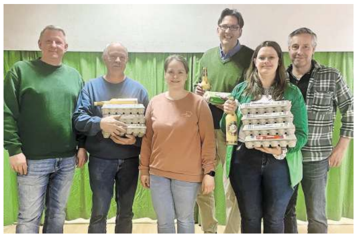
Die Sieger des Scherenbosteler Ostereierschießens