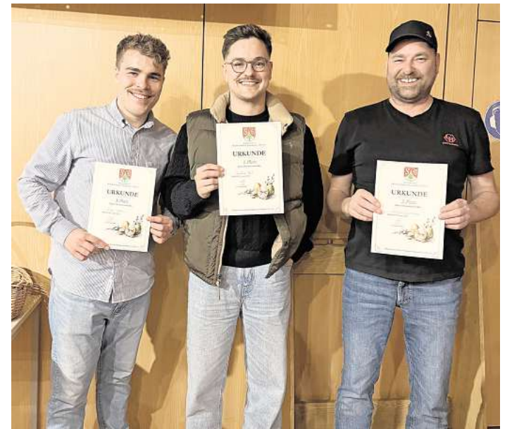
Die Sieger beim Eierpreisschießen.