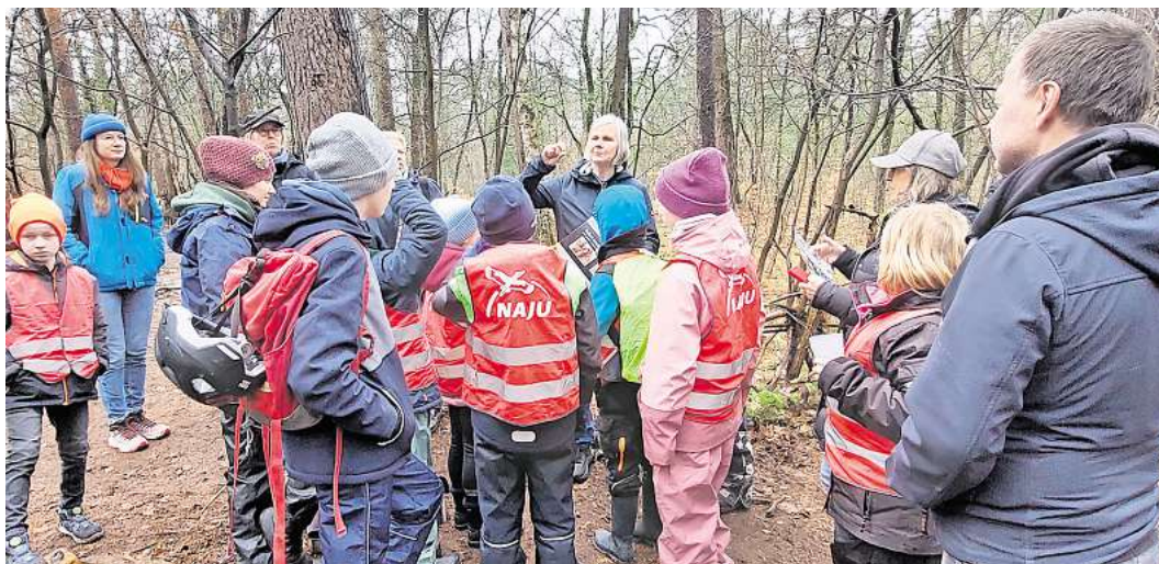
Naturexkursion: Das machten den jungen Teilnehmenden Freude.

Moose können ähnlich einem Schwamm in kurzer Zeit ein Mehrfaches ihres Gewichtes an Wasser aufnehmen, speichern und bei Dürre fast bis zum völligen Austrocknen wieder abgeben, ohne selbst abzusterben. Darüberhinaus beherbergen Moospolster als Miniökosysteme Tausende von Kleintieren wie Käfer, Asseln, Spinnen und Springschwänze. Viele dieser Bewohner konnten die Kinder aufspüren. Doch was sind eigentlich