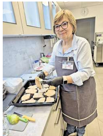
Landfrau Gaby hatte das Panieren der Schnitzel übernommen.

Und wenn am Ende die Gäste am Tisch zufrieden sind und feststellen „das schmeckt ja wie zu Hause“, dann ist das der größte Lohn für alle. Im vergangenen Sommer