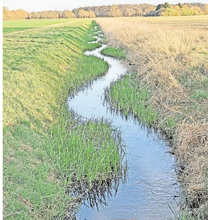
Bennemühler Mühlenbach zwischen Bestenbostel und Plumhof.