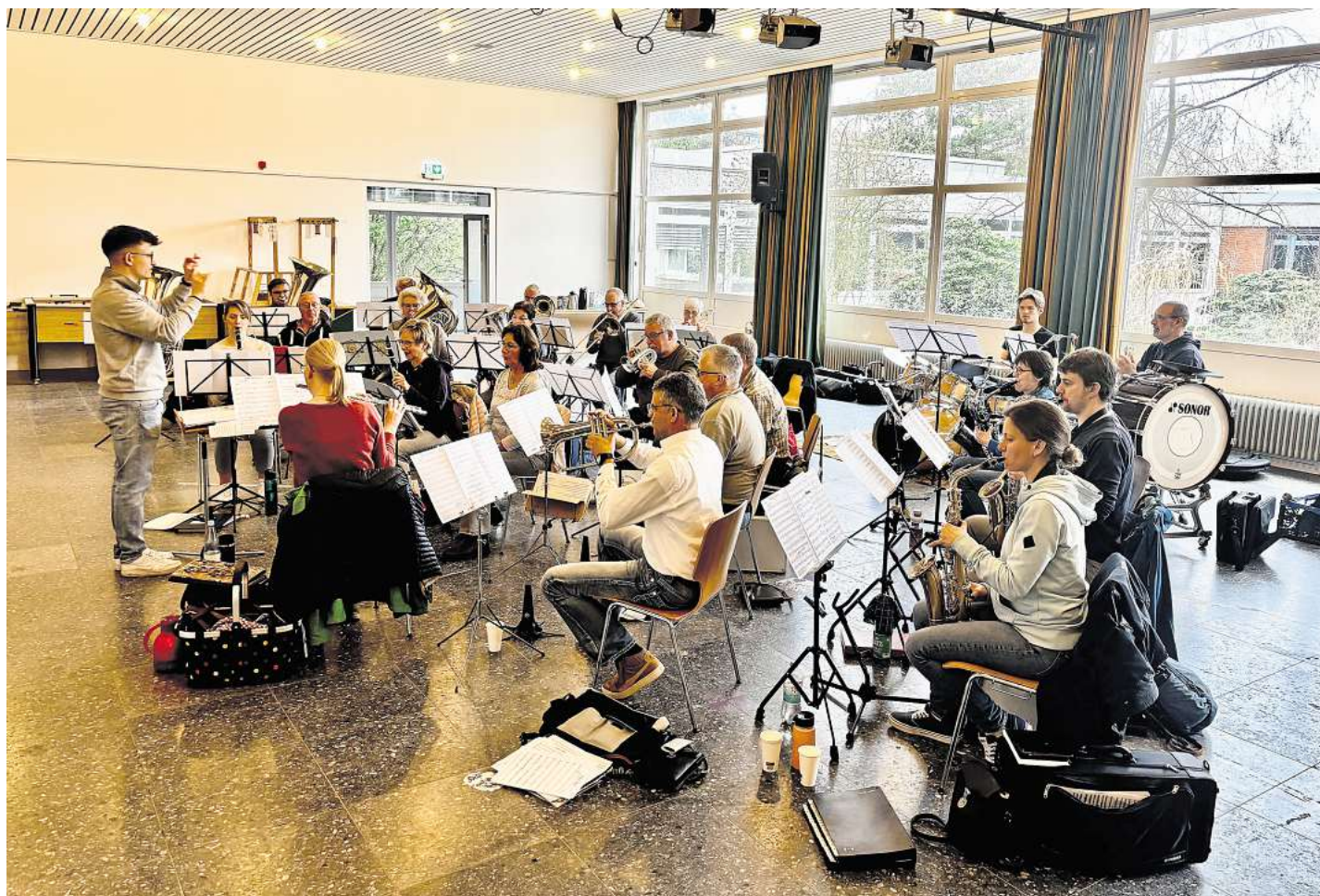
Proben für das große Frühjahrskonzert.

Der Eintritt beträgt 10 Euro. Der Musikzug der Freiwilligen Feuerwehr Elze freut sich auf zahlreiche Gäste und lädt alle Musikfreunde herzlich ein, einen unterhaltsamen und stimmungsvollen Nachmittag zu erleben.