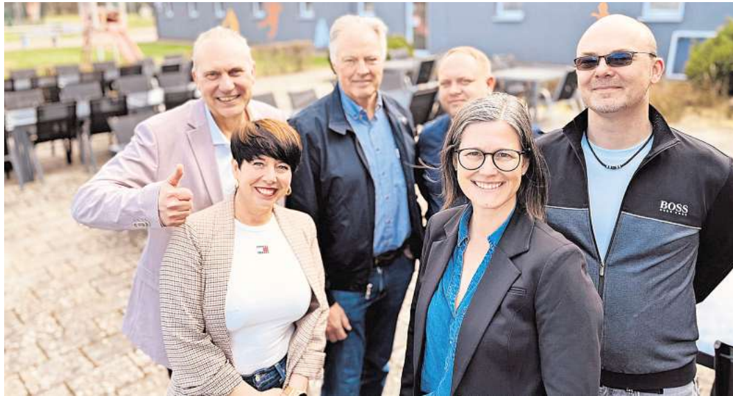
Die Initiator/innen der Messe.