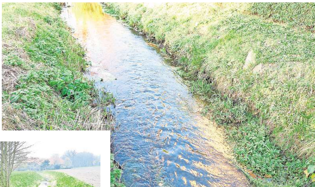
Die Große Beeke im Hellbruch zwischen Elze und Meitze.

WEDEMARK (BE). Sie ist 16,8 Kilometer lang und fließt von der Quelle bis zur Mündung fast ausschließlich durch Wedemärker Gebiet: die „Große Beeke“. Bis in die 50er Jahre des vergangenen Jahrhunderts hinein war es nicht ungewöhnlich, dass sie über ihre Ufer trat und weite Bereiche überschwemmte. Im dürrer Jahr 2018 trocknete sie hingegen völlig aus und hatte auch in den Folgejahren noch sommerliche Episoden mit trockenem Bett. Im Überflutungswinter 2023/2024 hingegen drohte sie nach einem