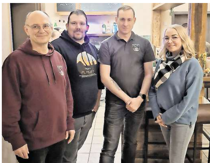
Die Sieger im Ostereierschießen.