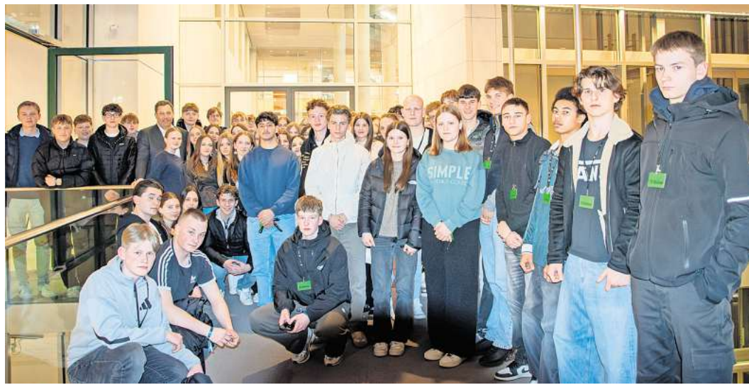
KGS-Schüler/innen zu Besuch in Berlin.

Ein weiteres Thema war die Frage, wie Politik nah an den Menschen bleiben kann. Klingbeil betonte dabei die Bedeutung des direkten Austauschs in seinem Wahlkreis: „Ich will wissen, was die Menschen bewegt – im