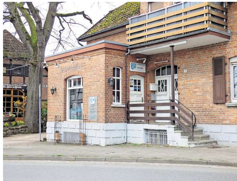
Nach rund 25 Jahren am Standort in Bissendorf steht jetzt der Umzug in modernere Räume nach Wennebostel an.

Einfach mal einen Beratungstermin vereinbaren und von den Fachleuten klären lassen, welche sinnvolle Modernisierung am Gebäude oder Heizung in Frage kommt und am Ende bares Geld einsparen kann.