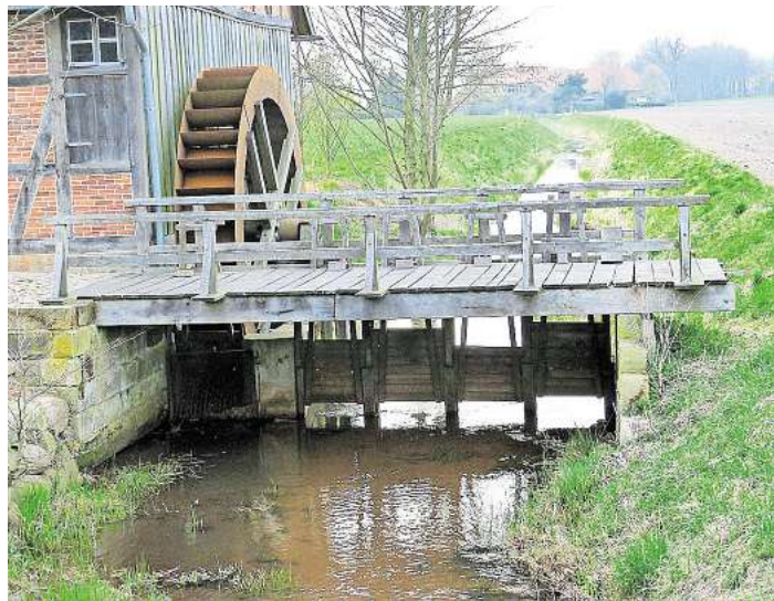
Die Beekemühle in Vesbeck.