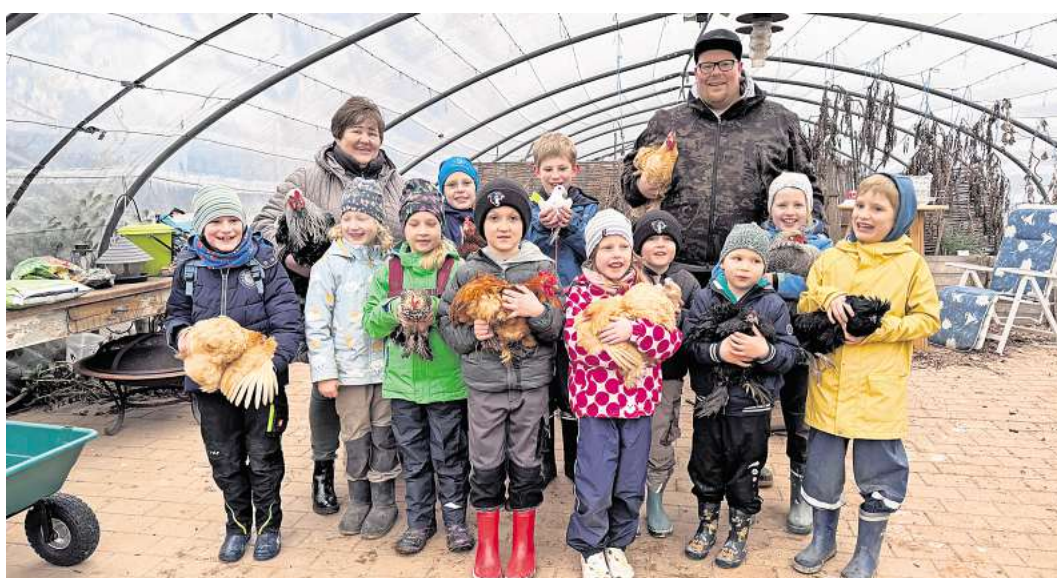
Die Teilnehmer/innen hatten viel Spaß beim Rassegeflügelzüchterverein.

Außerdem starteten zwei Brieftauben in die Höhe, die den Weg zum nächsten Programmpunkt begleiteten. Anschließend