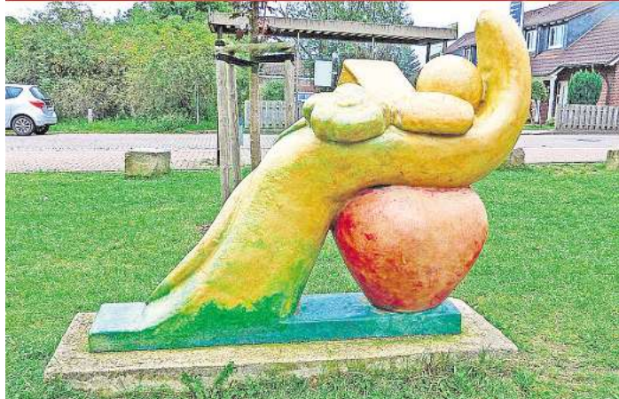
Hand auf's Herz