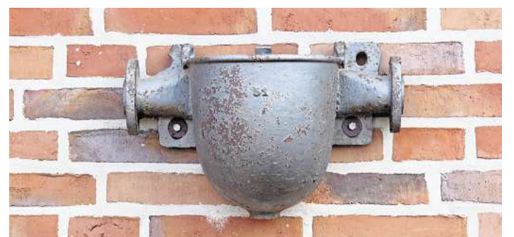
Wo findet man dieses Motiv.

Der Dank des Vereins gilt den vielen Helfern, die die Veranstaltung ermöglichen haben, sowie insbesondere den örtlichen Unternehmen Schönhoff und Kochservice Schmidt für Ihre Unterstützung.