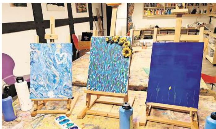
Im KunstFreiRaum kreativ werden.

Kurz gesagt: Reinkommen, Material schnappen, kreativ werden. Dienstag ist Atelier-Zeit! Die nächsten Termine in der Kinder- und Jugendkunstschule am Mühlengraben 19 in Bissendorf: 14. und 28. April, 12. Mai, 02., 16. und 30. Juni von 17 bis 19 Uhr.