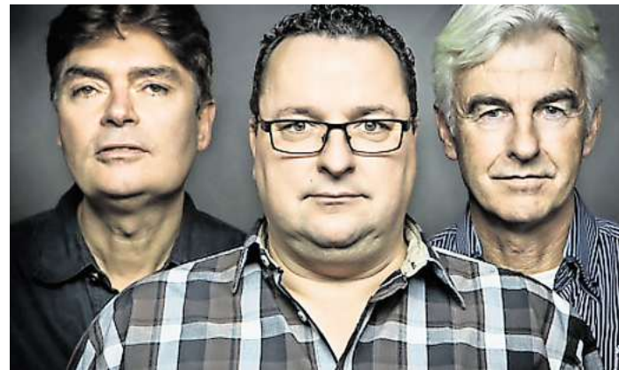
Holmes and Watson.