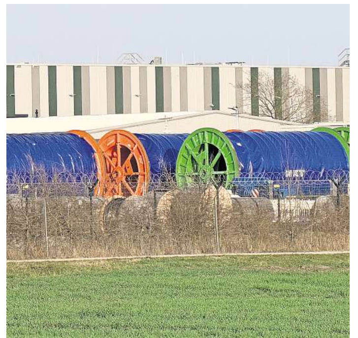
Kabellager für Suedlink - in Berkhof - die Trasse läuft anderswo.

Für die Wedemark ist die deutlich umstrittenere Trasse „Suedlink“ glücklicherweise nur noch insofern ein Thema, dass TenneT nahe Berkhof Kabel dafür lagert. Sie sind knapp 100 Tonnen schwer, circa 12 Meter lang und etwa vier Meter hoch. Platz bietet das Lager für insgesamt 220 Trommeln. „Die Kabel aus Berkhof werden sowohl im 66 km langen Abschnitt in der Region Hannover sowie im nördlich-gelegenen Abschnitt im Heidekreis verlegt. Hierfür werden sie nach Abschluss der Tiefbauarbeiten zu den jeweiligen Abspalplätzen in den Sektionen transportiert“, heißt es bei TenneT.