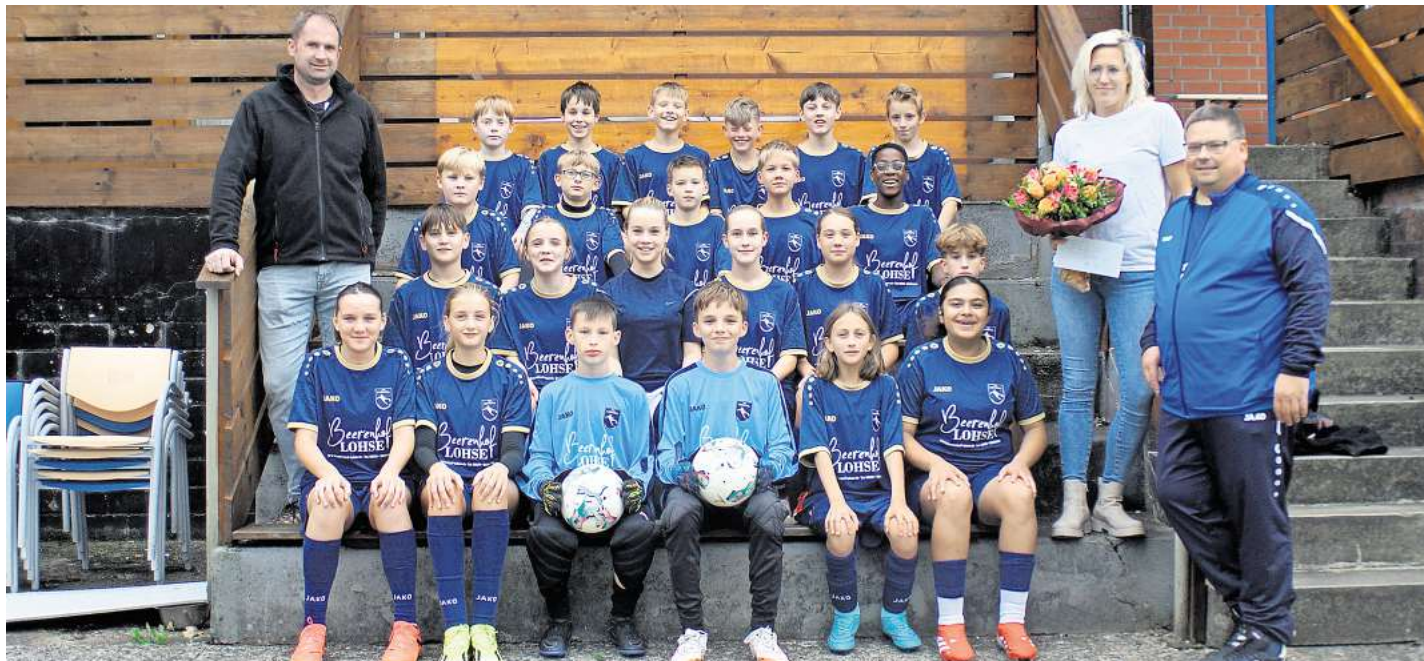
Das erfolgreiche Team mit Sponsoren und Trainer.

lich dem neuen Hallenkreismeister SV Soltau sowie dem Zweitplatzierten TV Jahn Schneverdingen. Auch bei der Endrunde in Schneverdingen wurden die jungen Spielerinnen und Spieler wieder von zahlreichen Eltern und Großeltern begleitet, die für eine großartige Unterstützung auf den Rängen sorgten. Mannschaft und Trainer bedanken sich herzlich für diesen Rückhalt. Mit der Herbstmeisterschaft auf dem Feld, einem starken dritten Platz in der Halle und neuen Trikots im Gepäck blickt die U13 der JSG Leinetal nun motiviert auf die kommenden Aufgaben.