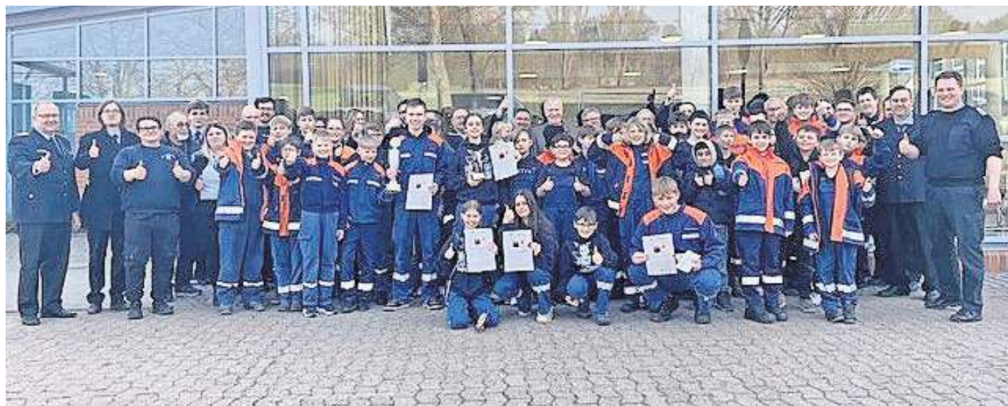
Eine große Schar an Teilnehmenden.

► Ev.-luth. Kirchengemeinde St. Laurentius, So., 15.03., 10.30 Uhr: Gottesdienst in der St. Matthäi-Kapelle in Bothmer, P. Richter ► Kath. Kirche Heilig Geist, Schwarmstedt, So., 15.03., 9 Uhr: Heilige Messe ► Ev.-luth. Kirchengemeinde Gilten, So., 15.03., Gottesdienste in der Nachbarschaft