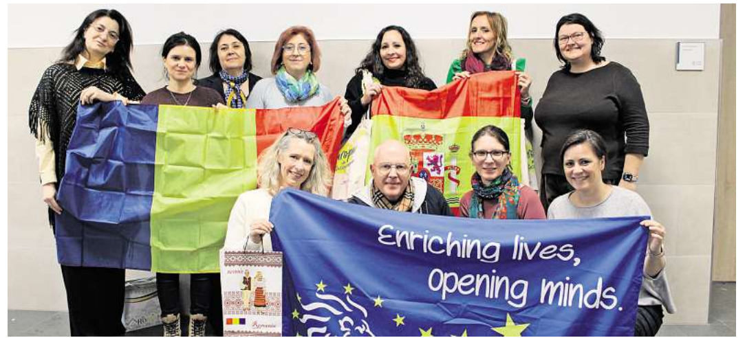
Der Campus Wedemark wird wieder ein Stück internationaler.