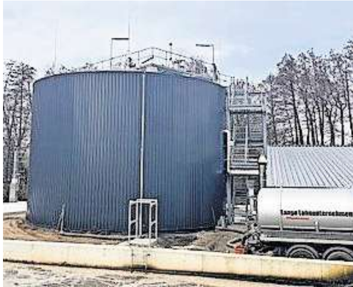
Ein Lastwagen liefert den ersten Impfschlamm an.

Bevor der Faulschlamm in den Faulturm gelangt, wird er eingedickt, das heißt ihm wird Wasser entzogen. Anschließend wird er schrittweise in den Turm gebracht, um ein kontinuierliches „Füttern“ der Bakterien und eine