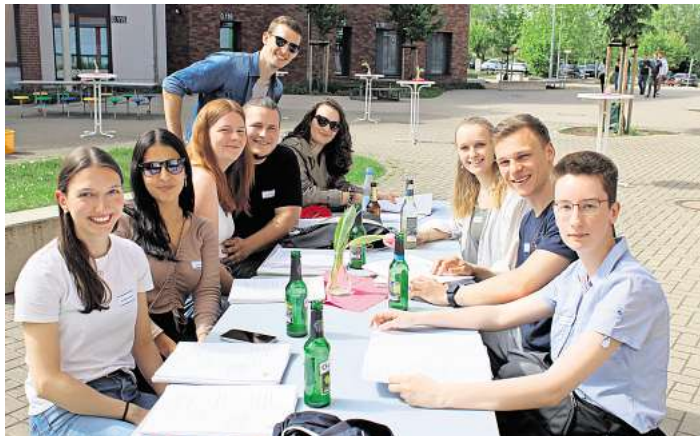
Die Ehemaligen freuen sich auf das Wiedersehen.

Großes Ehemaligentreffen am Gymnasium Mellendorf im Mai