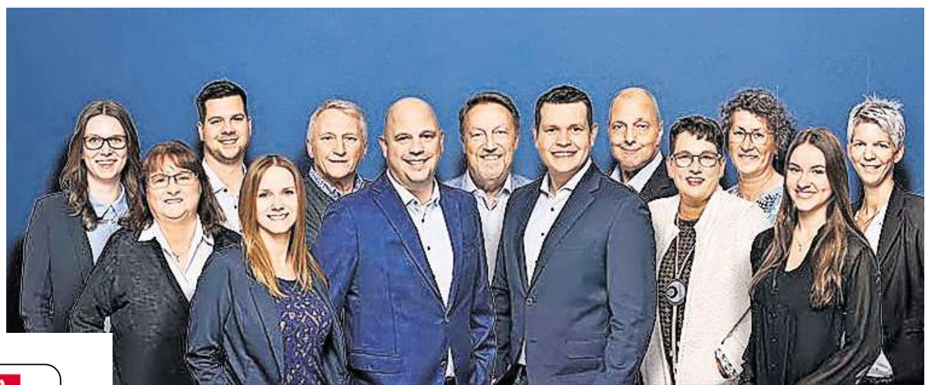
Die Fechner & Schwolow OHG vereint drei VGH Standorte unter ihrem Dach und kann dadurch mit einem umfangreichen Team nahezu jeden Versicherungsfachbereich sowie den Finanzdienstleistungsbereich optimal abdecken.