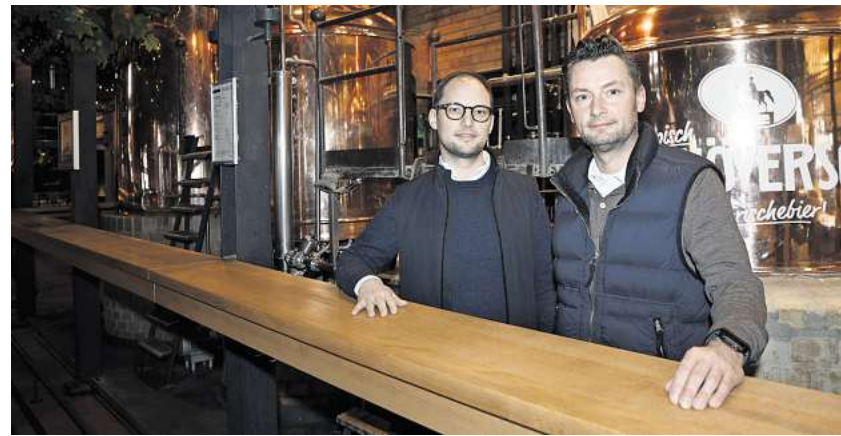
„Bei uns können drei Generationen an einem Tisch feiern.“

magaScene: Trägt das Konzept der Brauereigaststätte noch? Oder würde das Brauhaus