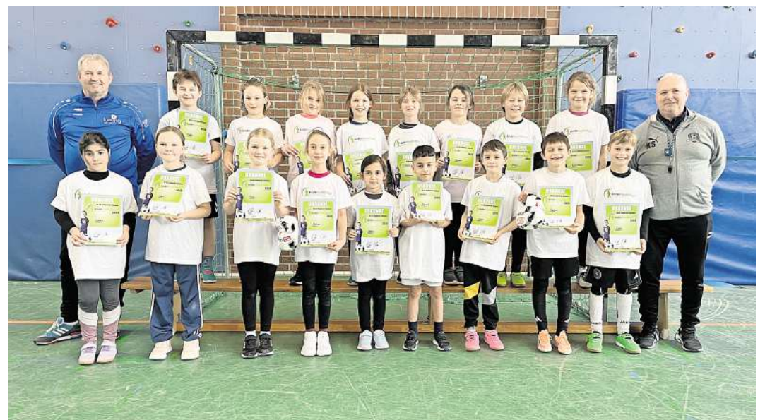
Einige sammelten erste Erfahrungen mit dem Fußball.