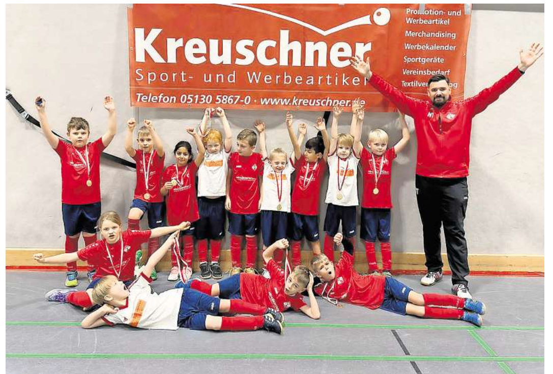
Die insgesamt 16 Teams sorgten für einen rundum gelungenen Turniertag.

Ein besonderer Dank gilt dem Hauptsponsor Kreuschner Sport- und Werbeartikel, der anlässlich seines Firmenjubiläums die vier erstplatzierten Teams zusätzlich mit großzügigen Gutscheinen auszeichnete. Der Kreuschner Hallencup 2026 wird allen Beteiligten sicherlich noch lange in positiver Erinnerung bleiben.