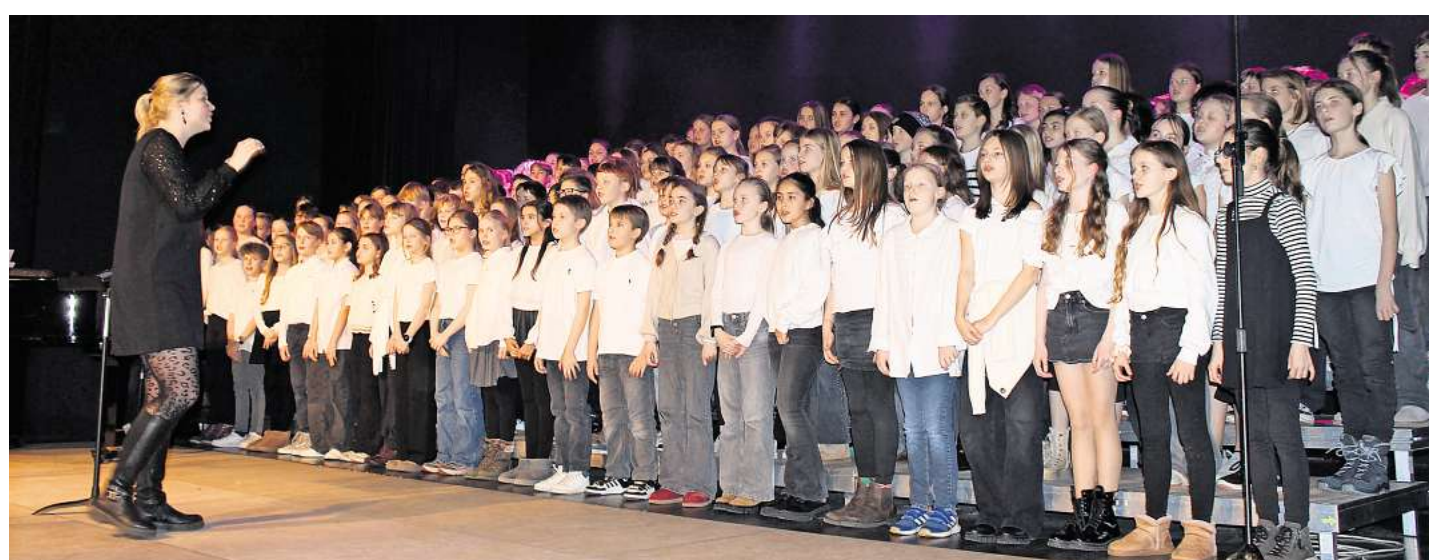
Am Ende des Abends blieb eines hängen: Musik verbindet.

Der Jugendchor unter der Leitung von Christoph Badde nahm das Publikum anschließend mit auf eine musikalische Reise, die zwischen Strandfeeling und Filmszene begann – und im Applaus mündete. Mit „Good Vibrations“ wurde es sonnig, während „Count on me“ die wohl angenehmste Form von Verlässlichkeit bot: Freundschaft – aber mit Mehrstimmigkeit. Mit „Fields of Gold“ wurde es schließlich ruhig und nachdenklich – bevor das Publikum dann ein echtes Highlight präsentiert bekam: das „Medley from Forrest Gump“ Von der Titelmelodie über „California Dreamin‘“, „Raindrops keep fallin‘ on my head“, „Sweet home Alabama“, „San Francisco“ und „Hound Dog“ bis zu „What the world needs now is love“ – ein Medley, das ungefähr so viele Stimmungen enthält wie eine komplette Woche Schulalltag.