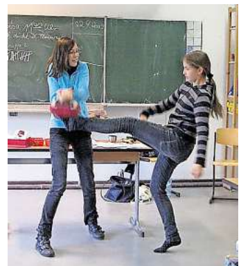
Mädchen lernen ihre eigenen Stärken kennen.

Auf der Webseite des Vereins www.kikonzept.de kann das Anmeldeformular angefordert werden. Da die Teilnehmerinnenzahl begrenzt ist, ist die Kontaktaufnahme vorab notwendig.