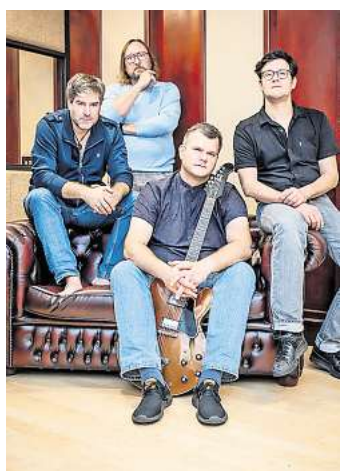
„Kleemann“ steht für einen unverwechselbaren Sound mit viel Power.

Die Eintrittskarten für 15 Euro Vorverkauf (18 Euro Abendkasse) sind zu erhalten bei: imago Kunstverein Wedemark, Bücher