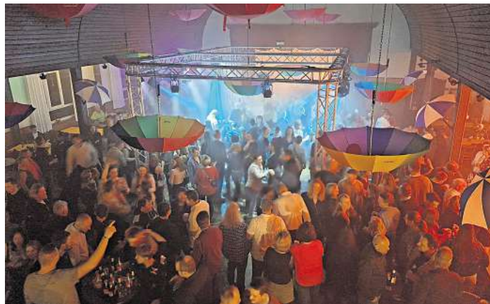
Die Saalparty in Büchten: eine unvergessliche Nacht zum Feiern und Tanzen.