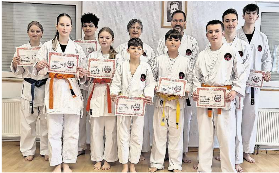
Das Karate-Prüfungsprogramm war sehr umfangreich.

Nach Prüfung von Grundtechniken mussten je nach Stufe mehrere Kata vorgeführt werden. Gekisai Dai Ichi, Gekisai Dai Ni, Daifa, Seyunchin, Sanchin, hinter jedem japanischen Namen verbirgt sich ein festgelegter Ablauf aus Abwehr und Angriffstechniken mit ganz unterschiedlichem Schwierigkeitsgrad. Je höher die Graduierung, desto mehr dieser Kata mussten ge-