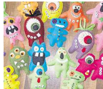
Fröhliche Monster sind bei der Kinder- und Jugendkunstschule auch im Angebot.