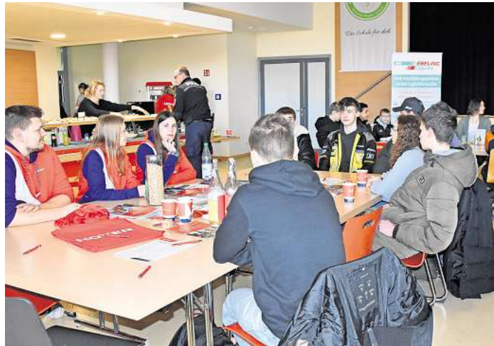
Speditionen präsentierten sich genauso...