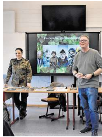
wie die Bundeswehr.