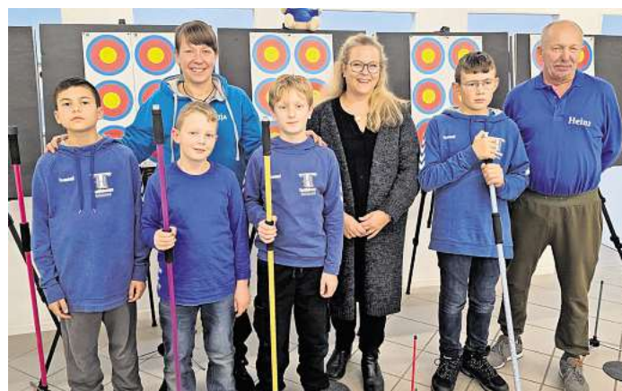
Die neue Ausrüstung stellt einen wichtigen Meilenstein für das Team dar.

Die neue Ausrüstung stellt einen wichtigen Meilenstein für das Team dar. Sie ermöglicht nicht nur bessere Trainingsbedingungen, sondern schafft auch die Grundlage für die weitere sportliche Entwicklung sowie die Nachwuchsarbeit. Gerade in einer Randsportart wie dem Blasrohrschießen sind moderne und einheitliche Materialien ein entscheidender Faktor, um langfristig erfolgreich und attraktiv zu bleiben. „Ohne diese Unterstützung wäre die An-