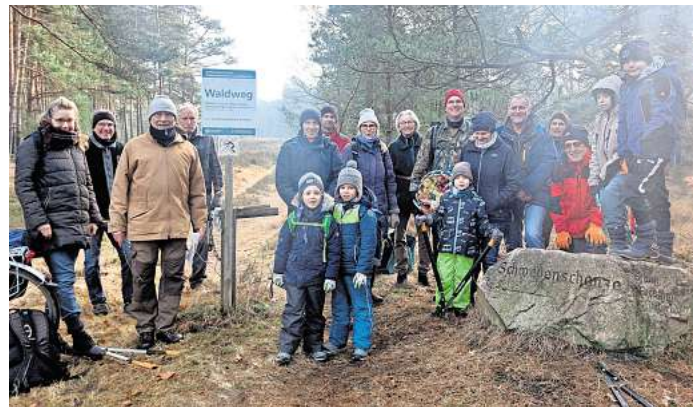
Rund 20 kleine und große Naturschützer waren zwei Stunden im Einsatz.

SCHWARMSTEDT. Entkusseln ist aktiver Naturschutz. Die Schwedenschanze, eine als Naturdenkmal des Heidekreises anerkannte Heidefläche, liegt eingebettet in einen Kiefernforst und in der Nähe von Heidelbeerplantagen. Dies bringt es mit sich, dass auskeimender Fremdbewuchs aus beiden Arealen die Heide zu überwachsen drohen. Diese „Kusseln“ heißt es fortlaufend und schonend zu entfernen. Die unzähligen Jungkiefern in allen Größenordnungen ließen sich im besten Fall von den Helfern mit bloßen Händen aus der Erde ziehen, bei stärkerer Verwurzelung mussten sie mit dem Astkneifer bodennah gekappt werden. Rund 20 große und kleine Naturschützer waren zwei Stunden fleißig im Einsatz und trugen das „Kusselgut“ anschließend in den Kiefernforst, wo es als Schutz um dort angepflanzte Jungbuchen geschichtet wurde.