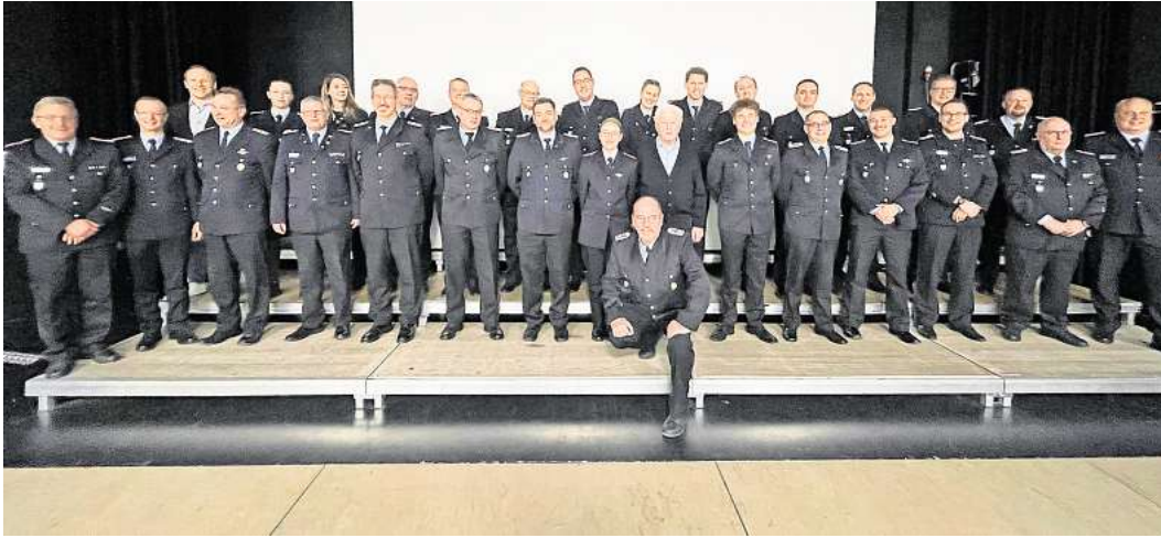
Die Freiwillige Feuerwehr Mellendorf zählt 77 Mitglieder.