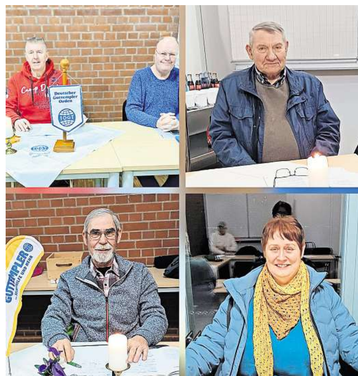
Bei den Guttemplern gingen jetzt Wahlen über die Bühne.