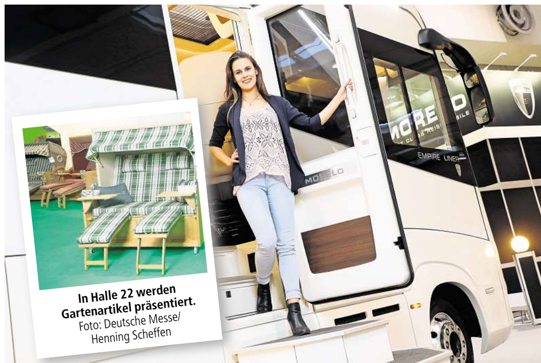
Die Themenwelt Caravaning & Camping ist eines der Herzstücke auf der ABF.

Die Themenwelt Automobil ist bei der ABF ebenfalls ein wichtiger Bereich mit großer Modell- und