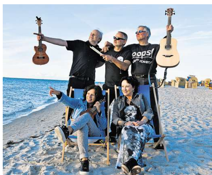
Pop, Rhythm'n Blues und Folk, alles natürlich mit viel Seele gespielt, dafür steht Guitavio.

Das Quintett legt größten Wert auf die Eingängigkeit ihrer Musik. Viele Besucher hören die Musik zum ersten Mal, da muss sie bereits zünden. Und das funktioniert bei Guitavio wunderbar. Erfahrung, Spielfreude, Könnerschaft an den Instrumenten, intelligentes Songwriting und eine professionelle Performance nehmen den Zuhörer unmittelbar mit und sorgen für beste Unterhaltung. Es werden musikalische