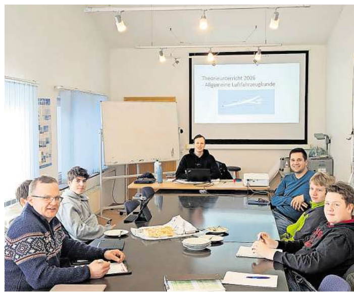
Theorieausbildung: Fliegen beginnt lange vor dem Start.

Besonders wertvoll ist dabei die Art der Wissensvermittlung. Die Schulung wird von erfahrenen Fluglehrerinnen und Fluglehrern begleitet, die ihre langjähri-