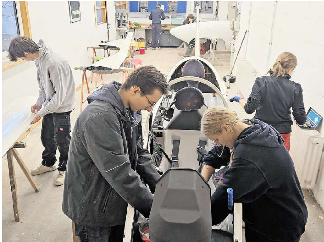
In der Winterpause laufen eine Menge vorbereitende Arbeiten.