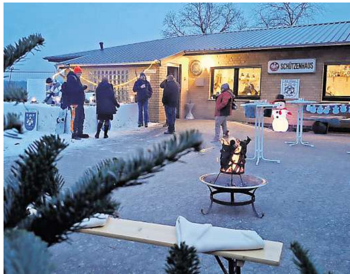
Der Schützenverein Elze hatte zum Wintervergnügen eingeladen und für entsprechende Deko vor dem Schützenhaus gesorgt.

ELZE. Am letzten Wochenende im Januar veranstaltete der Schützenverein Elze zum vierten Mal einen Winterzauber am Schützenhaus und das Wetter hat dieses Jahr mitgespielt: endlich hat es mit dem geplanten Schneetresen geklappt. Die Mitglieder und Besucher waren begeistert und genossen im winterlichen Flair heiße Getränke am Feuerkorb bei kaltem Wetter. Zum Aufwärmen ging es ins schön dekorierte Schützenhaus, um bei selbstgemachten leckeren Kleinigkeiten einen tollen Nachmittag zu verbringen. Einen großen Anklang fanden die interessanten Treckerfahrten durch Forst Rundshorn. Das nächste öffentliche Event wird das Ostereierschießen im April sein. Alle Interessierten sind dazu herzlichst eingeladen.