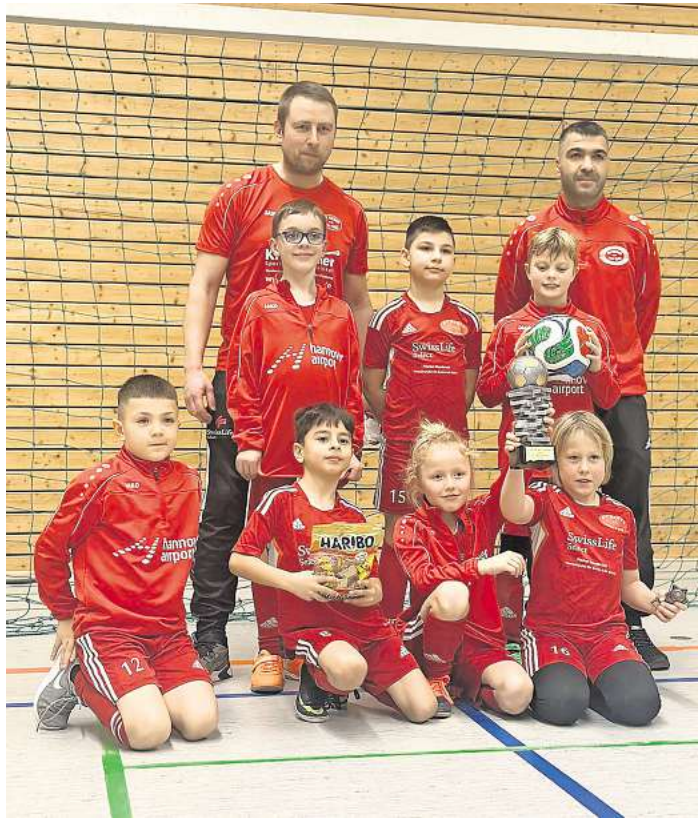
Nicht nur das Fußballerische, auch Kontakte, standen bei der Fahrt im Fokus.