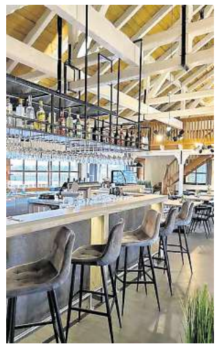
Auch im Gastraum lässt es sich gemütlich sitzen oder auch feiern.

Das Restaurant bietet Platz für bis zu 120 Gästen und überzeugt durch ein rustikales, industrielles und maritimes Ambiente, das perfekt mit der