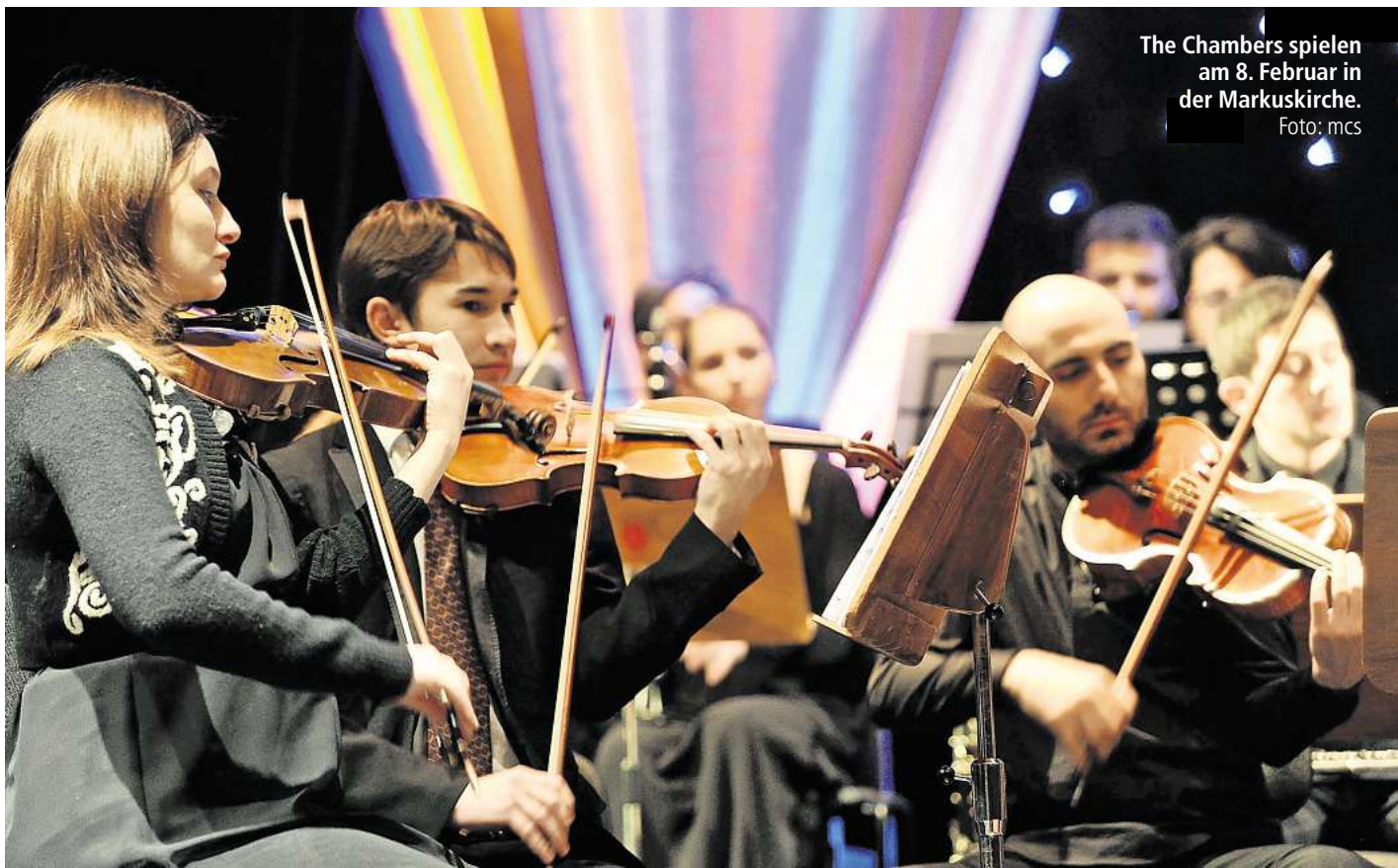
The Chambers spielen am 8. Februar in der Markuskirche.

Die Panflöte, virtuos gespielt vom Rumänen Ion Malcoci, verleiht den Konzerten eine zauberhafte Klangfarbe, besonderen Charakter und unverwechselbaren