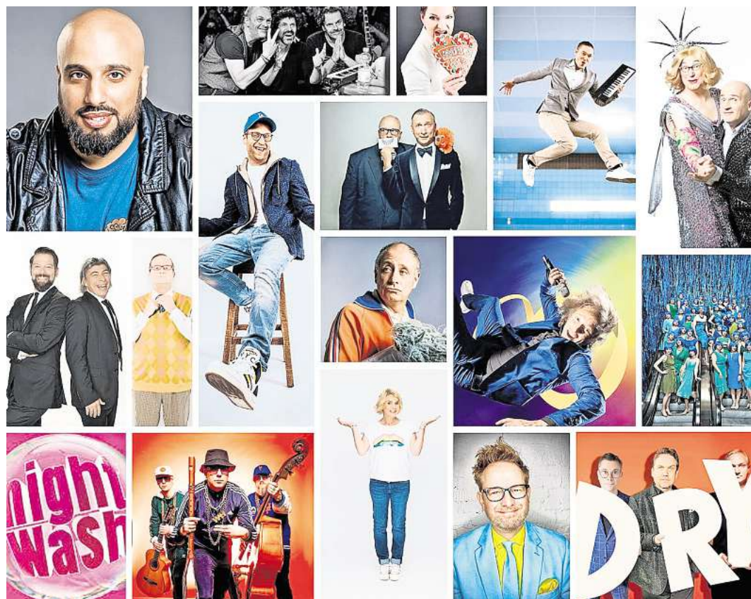
Ein interessantes und abwechslungsreiches Programm erwartet die Besucherinnen und Besucher der Mimuse im Frühjahr.