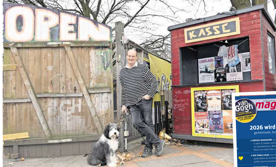
„Unser Programm hat sich immer gewandelt und geht mit der Zeit.“

Grambeck: Ideal wäre, dass wir das komplette Gebäude durchsanieren und wir dort drei Indoor-Areas haben. Ähnlich wie hier eben. Eine für rund 400 Leute und zwei kleinere für um die 40