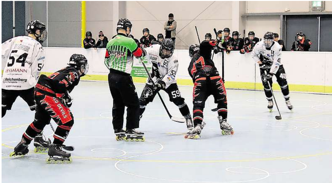
Die Zuschauer sahen packende Partien.