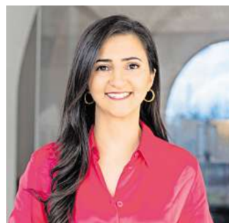
Bürgermeisterin Aynur Colpan.

Wir haben weitere Themen vorangebracht, die oft im Hintergrund laufen, aber entscheidend sind: Photovoltaik, Verkehrssicherheit, Energiefragen, Beleuchtung und viele kleinere Verbesserungen, die unseren Alltag spürbar erleichtern.