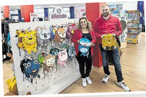
Große Vielfalt an Affenzahn Kinder-rucksäcken.