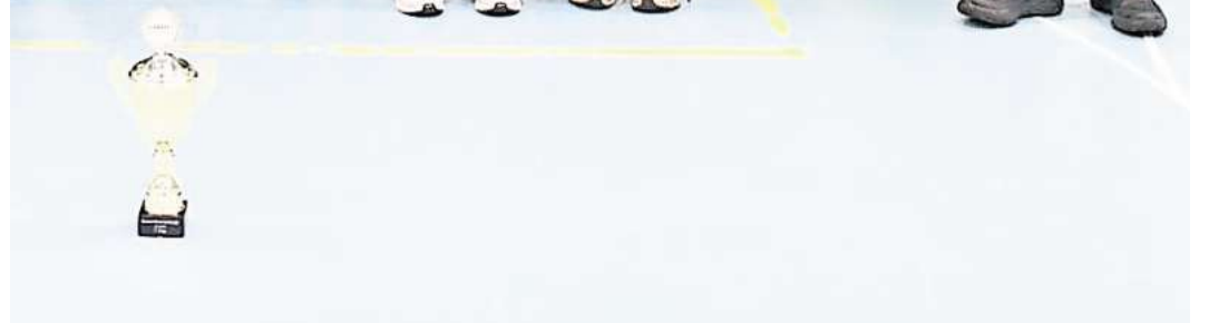
Die Bissendorfer belegten den siebten Platz.