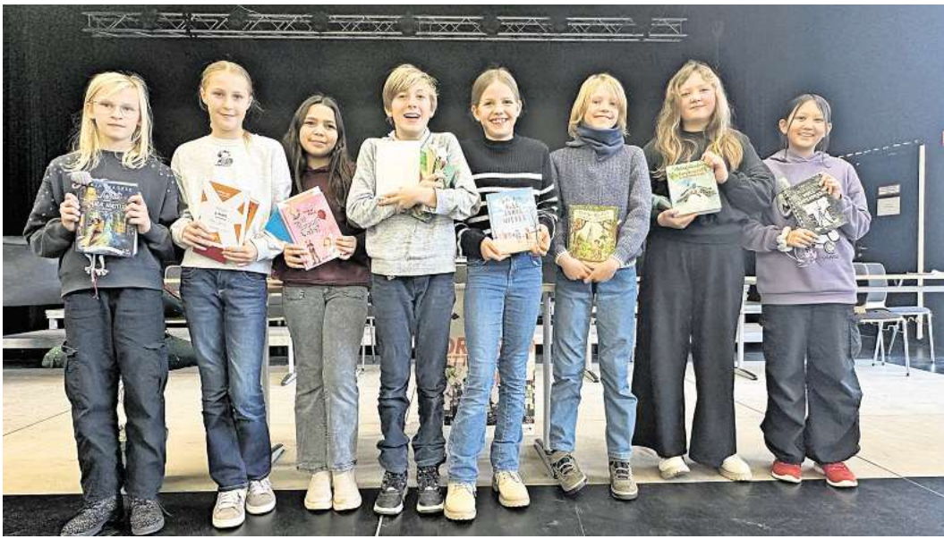
Die Schülerinnen und Schüler zeigten hervorragende Leseleistungen.