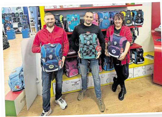
Unsere Favoriten von DerDieDas