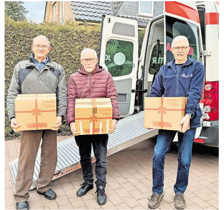
In diesem Jahr packten die fleißigen Helfer sagenhafte 114 Pakete.

zu ihren Empfängern gehen, tragen dazu bei, Not zu lindern und gleichzeitig Wärme und Hoffnung in die Weihnachtszeit zu bringen.