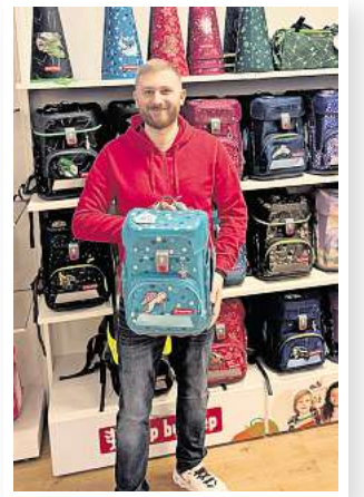
Neues Lieblingsmodell: CLOUD Turtle Josie von Step by Step.

Der „Große Schulranzentag“ soll am Sonnabend, 3. Januar, zwischen 10 und 16 Uhr zu einem großen Familien-Event an der Walsroder Straße 78 werden. Es laufen viele Aktionen wie etwa Waffelbacken oder Glücksrad.