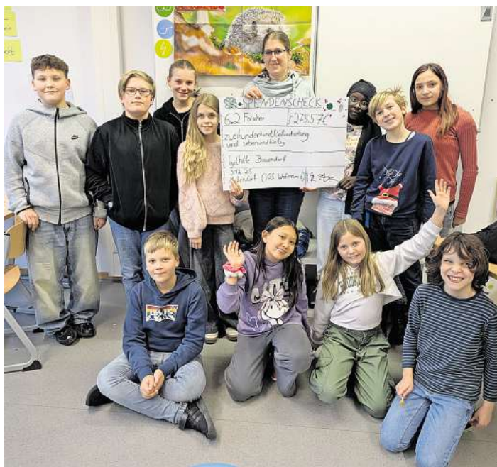
Die Forscherklasse übergab jetzt den Spendenscheck an die Igelhilfe.

Außerdem ermutigte Pannes alle Bürgerinnen und Bürger, aufmerksam zu sein: Anzeichen für einen hilfsbedürftigen Igel können unter anderem sein, wenn das Tier bei Tageslicht umherirrt, unterernährt wirkt oder sich lethargisch verhält.