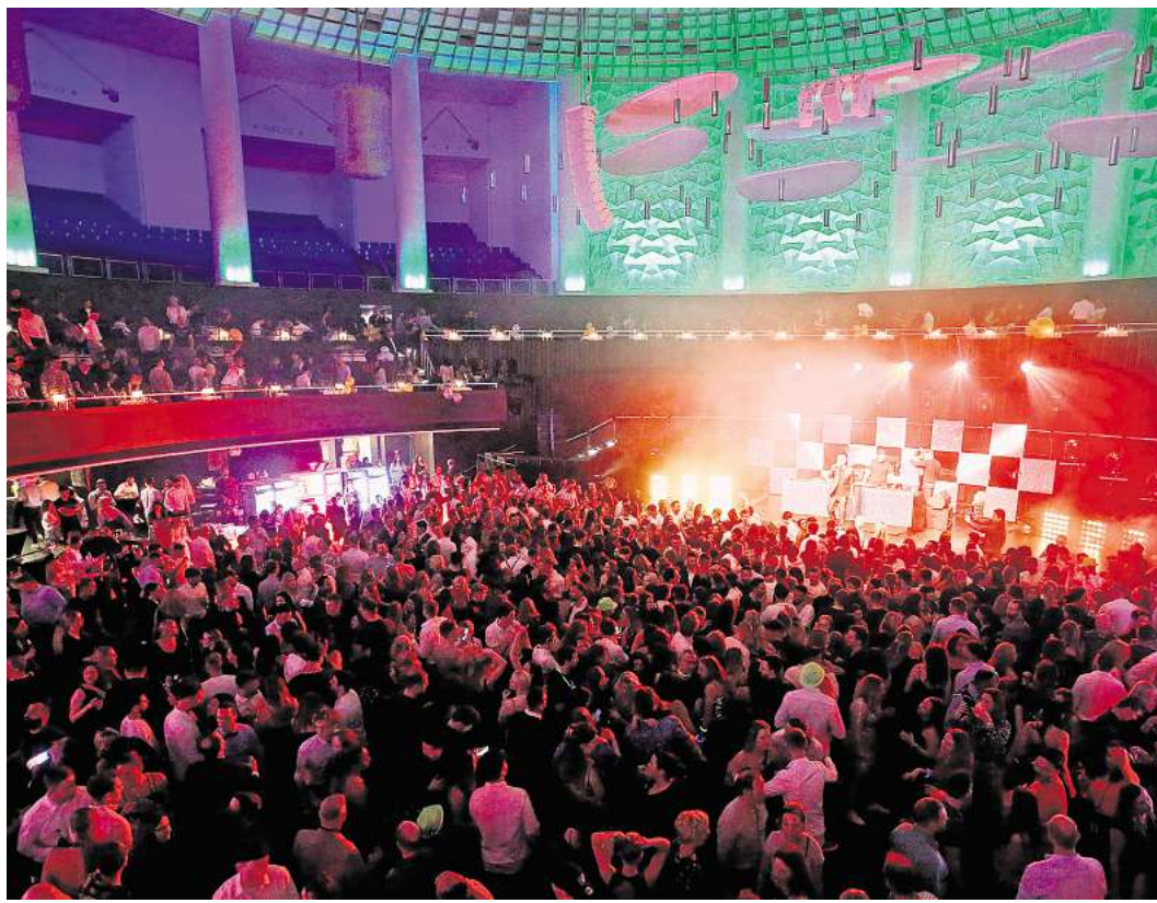
Bereits zum elften Mal steigt die große Silvesterparty im HCC.

Aufgrund der großen Nachfrage empfiehlt sich eine frühzeitige Buchung – in den vergangenen Jahren war die Silvesterparty ausverkauft.