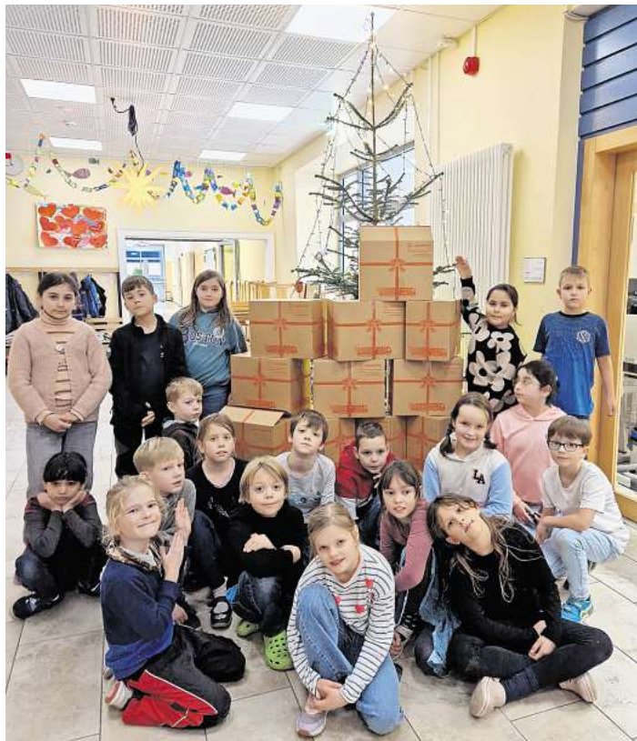
Die Viertklässler sind stolz auf die große Anzahl gepackter Hilfspakete.

Eine besonders berührende Note erhält die diesjährige Aktion durch die Geschichte eines Drittklässlers: Als er noch in Moldawien lebte, erhielt er selbst einmal ein Weihnachtstrucker-Päckchen. Die Überraschung und