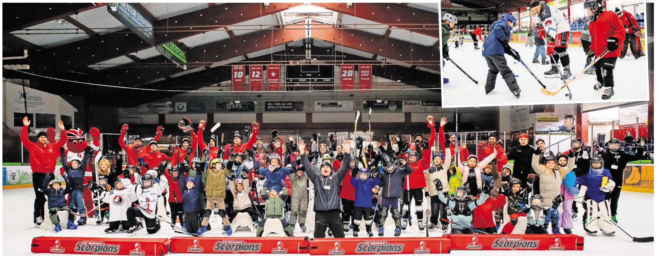
Die Teilnehmerinnen und Teilnehmer hatten alle viel Spaß.

Rund 70 Kinder verbrachten einen spannenden und erlebnisreichen Tag auf dem Eis und konnten hautnah erfahren, wie viel Freude