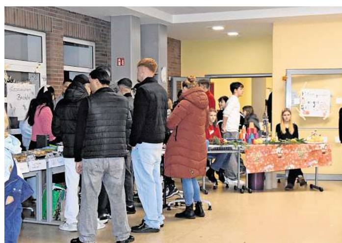
Beim Adventsbasar an der KGS Schwarmstedt herrschte wieder große Nachfrage.