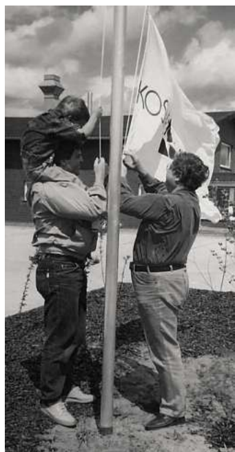
Der Beginn der erfolgreichen Firmengeschichte reicht drei Generationen zurück.

Die Dr. Rimpler GmbH zeigt, wie nachhaltig gewachsenes Unternehmertum, technische Innovation und ein tiefes Verständnis für Hautpflege Hand in Hand gehen können. Der Ausbau des Firmengeländes ist mehr als nur ein logistischer Schritt – er ist ein Bekenntnis zu dem, was das Unternehmen seit fast vier Jahrzehnten ausmacht: Qualität, Verantwortung und die stetige Weiterentwicklung im Dienste der Hautgesundheit.