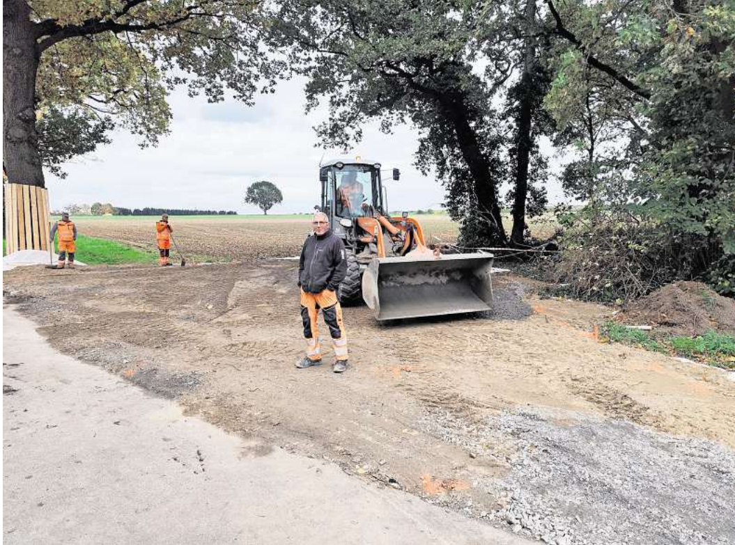
Raumgreifend: Tiefbauer bereiten einen Parkplatz in der Wedemark für den Transport des ausgemusterten Airbus vor.

Das alles – und noch viel mehr – hat einen einzigen Grund: Ein Airbus-Rumpf rollt durchs Land. Vom Flughafen Langenhagen zum Serengeti-Park in Hodenhagen, wo er sozusagen aufs Altenteil kommt und künftig als Restaurant genutzt werden soll.