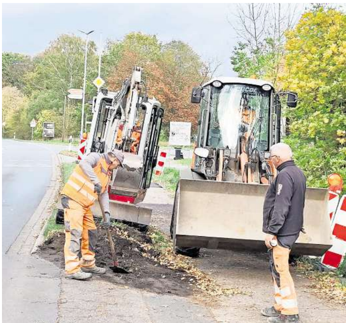
Viel Platz nötig: In Resse bereiten Tiefbauer die Straße für das ausgemusterte Flugzeug vor.