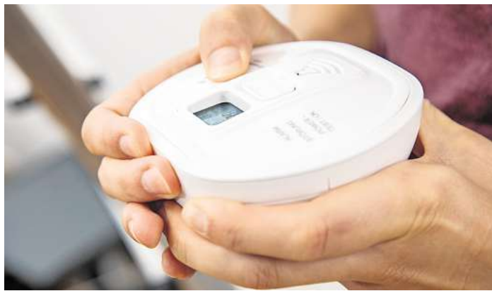
Sie haben eine Gastherme daheim? Ein CO-Warmmelder kann helfen, sich besser vor einer Kohlenmonoxidvergiftung zu schützen.

Kohlenmonoxid (CO) entsteht bei sogenannten «unvollkomme-