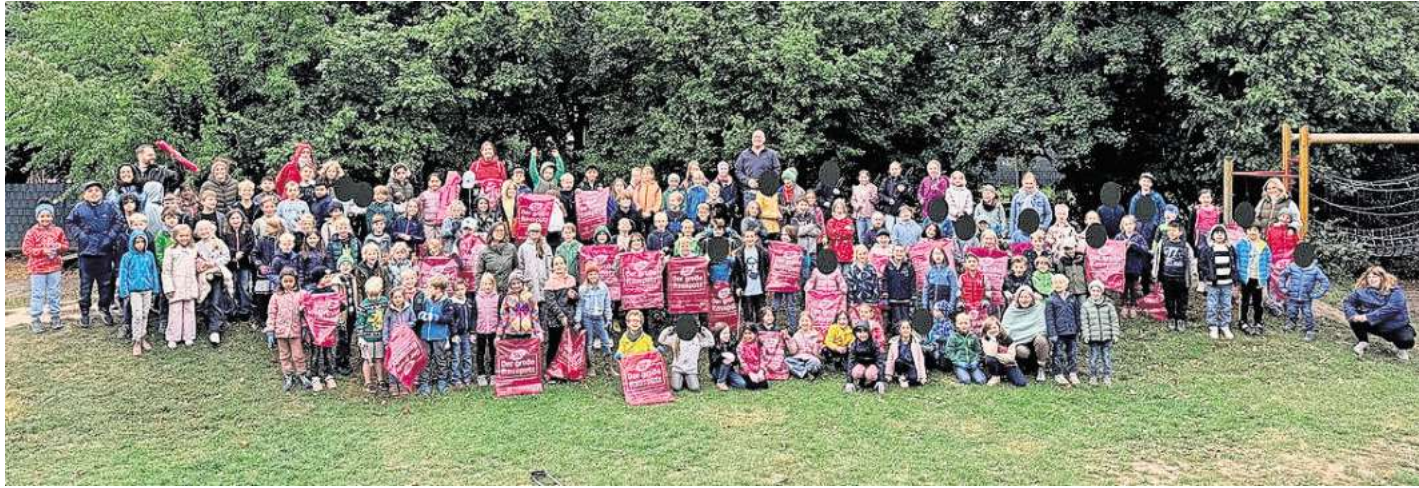
Die Schülerinnen und Schüler waren mit Feuereifer bei der Sache.

Grundschule Brelingen sammelt Müll für eine saubere Umwelt