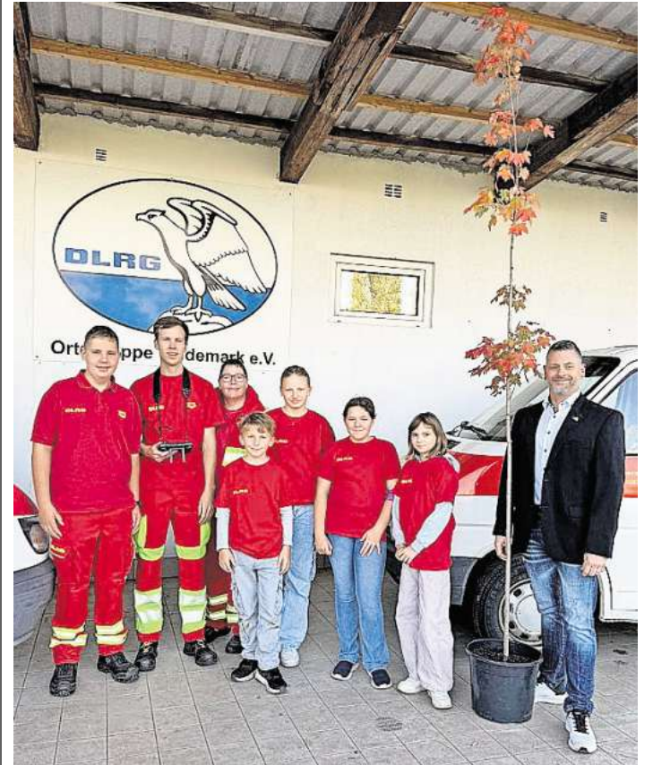
Die Ortsgruppe pflanzte den Baum direkt am Vereinsheim.

Diese Aufgabe hat sie insbesondere dank der freundlichen Unterstützung der Baumschule Schmidt erfüllt. Sie spendete uns einen jungen Rot-Ahorn und lieferten diesen sogar mit Pflanzerde, Pfählen und Seilen fürs stabile Anwachsen direkt zum DLRG Vereinsheim. Dort durften die DLRG-Ortsgruppe Wedemark den Baum auf dem Gelände des Spaßbads Mellendorf gegenüber des Vereinsheims einpflanzen.