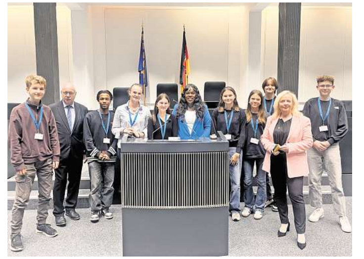
Die Schülerinnen und Schüler stellten im Landtag durchaus kritische Fragen.

Schüler mit vielen neuen Eindrücken und einem besseren Verständnis für Demokratie nach Mellendorf zurück – und vielleicht mit der einen oder anderen Idee, selbst einmal politisch aktiv zu werden.