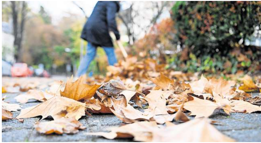
Weg mit den Blättern: Wer für solche Arbeiten rund ums Haus einen Dienstleister beauftragt, kann steuerlich profitieren.

Auch rund ums Haus stehen in der dunklen Jahreszeit oft wichtige