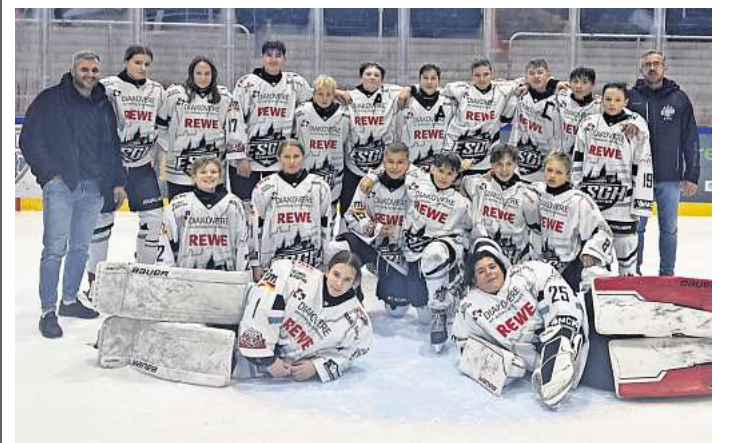
Der Puck lief durch die Reihen des ESC Wedemark Scorpions.

Allerdings verletzte sich im Spielverlauf der gegnerische Torhüter – auf diesem Wege gute Besserung und eine schnelle Genesung!