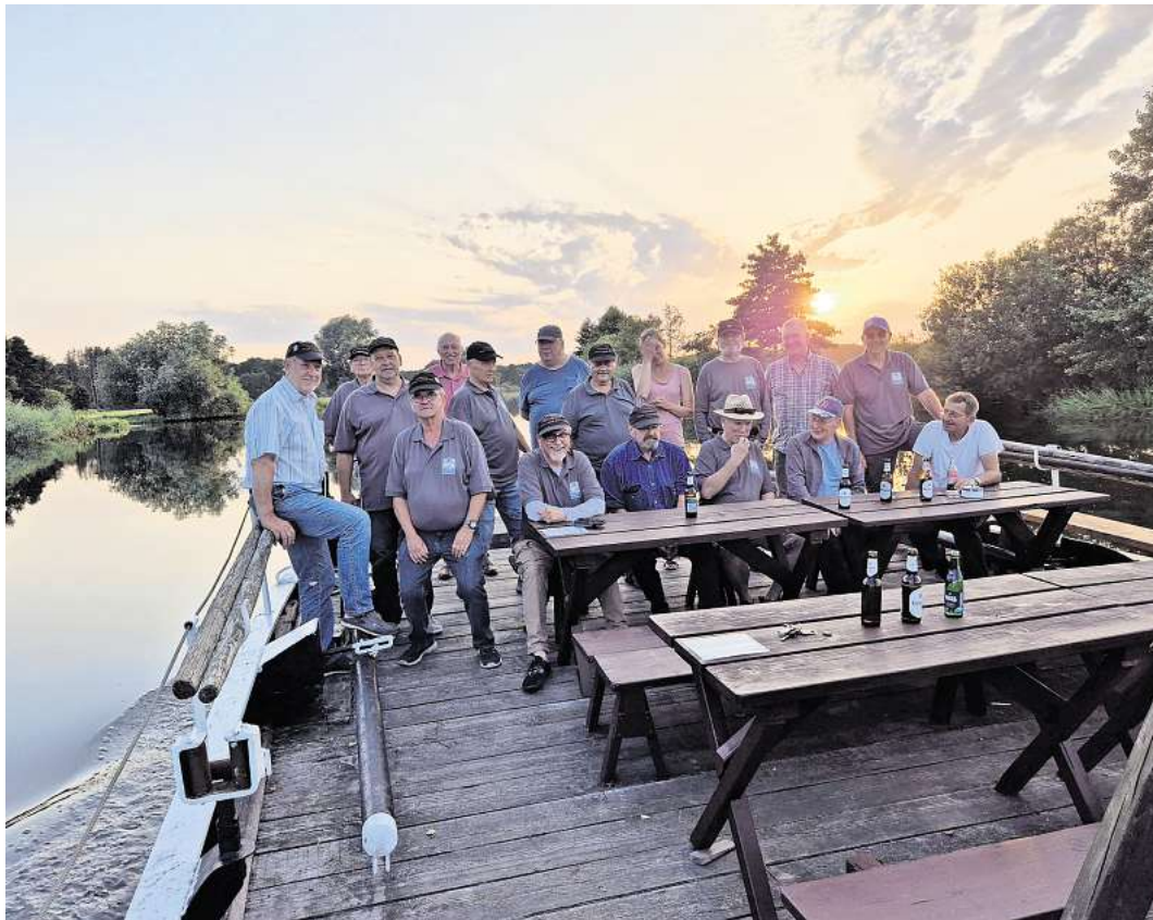
Die aktiven Flößer bei Ihrer jährlichen „Sunset-Fahrt“ ohne Gäste.

Jedes zweite Jahr wird das Holzfloß auf traditionelle Weise von den Mitgliedern des Vereins gebaut. In früheren Zeiten diente das Flößen dem Holztransport aus der südlichen Heide nach