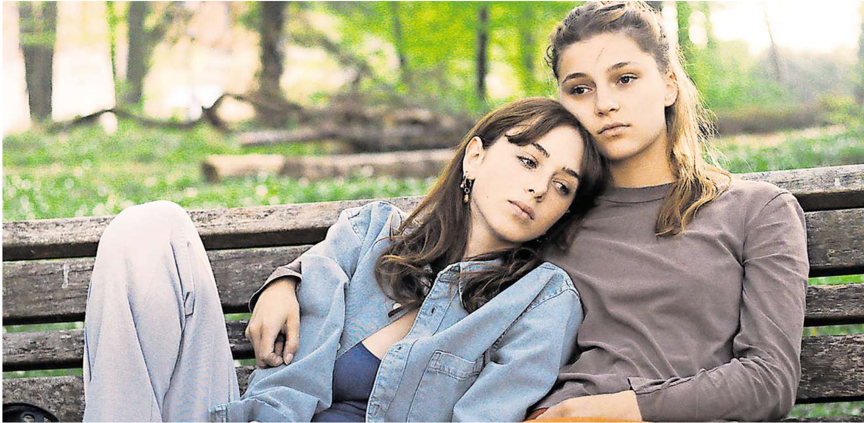
Szene aus „Rivière“.

magaScene Veranstaltungstipp: QUEERE FILMKUNST im Kino im Künstlerhaus