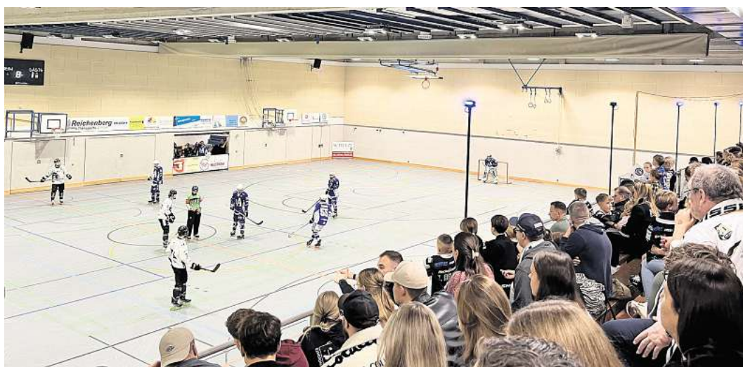
Die Bissendorfer Panther setzten sich letztendlich mit 9:4 durch.

Auch die Damen der Bissendorfer Panther haben am vergangenen Wochenende einen spannenden Auswärtssieg gegen die Pulheim Vipers eingefahren und sich mit einem 5:3 den wichtigen Vorteil des Heimrechts für die bevorstehenden Play-offs gesichert. Trotz eines dünnen Kaders – nur acht Feldspielerinnen und eine Torhüterin – und mit Interims-Trainer Marc Engelke, der die Mannschaft taktisch hervor-