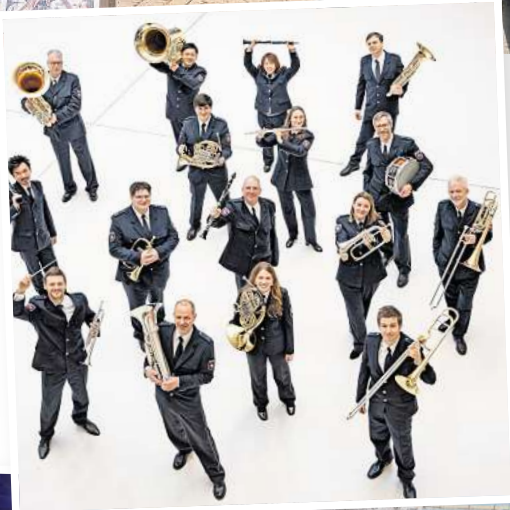
Das Polizeiorchester Niedersachsen wird zur Eröffnung des Tages den „Bissendorfer Sonntagsmarsch“ uraufführen.

Und auch das umfangreiche kulinarische Angebot verspricht die Gaumen zu verwöhnen: von herzhaft bis süß ist für jeden Geschmack etwas dabei. Specksalat oder Burger, Crêpes oder Schmalzkuchen, Bratwurst, Steaks und Pommes, hausgemachtes Eis, Spezialitäten vom Food Truck, edle Weine, Räucherfisch und noch viel mehr warten darauf, am Sonntag die Gäste rund herum zu verwöhnen!