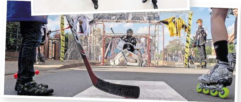
Viele Vereine wie hier die Bissendorfer Panther bieten Mitmach-Aktionen für die Besucher an.