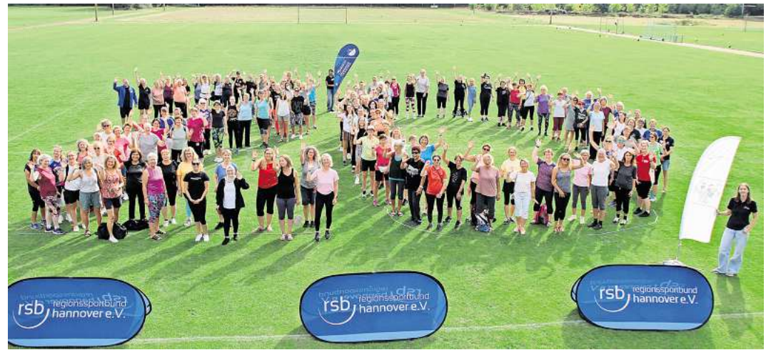
Mehr als 330 Frauen nutzten das Angebot.