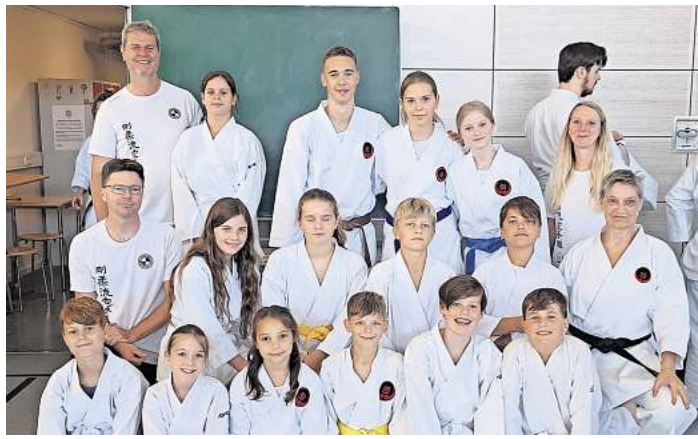
Einmal im Jahr treffen sich Karateka aus ganz Europa zum European Gasshuku.

ELZE. Einmal im Jahr treffen sich Karateka aus ganz Europa zum European Gasshuku. Gasshuku ist eine japanische Tradition, gemeinsam zu üben und voneinander zu lernen. In diesem Jahr waren es mehr als 300 Karateka aus 23 Ländern, aus ganz Europa, Südafrika, USA, Kanada, Israel und Indien. Das Training wird angeleitet durch die besten Trainer:innen (Sensei) unserer Stilrichtung einschließlich dem World Chief Instructor Sensei Tetsuji Nakamura. Die Unterrichtssprache ist Englisch und natürlich Japanisch für die Fachbegriffe. Englisch mal nicht nur für die Schule, sondern um mit japanischen, dänischen, spanischen, holländischen und, und, und ... Karateka und Sensei zu sprechen. Montag morgens früh um 7 Uhr wurde in Elze am Sport- und Tanzhaus gestartet, um rechtzeitig zu Trainingsbeginn in Hamburg zu sein. In Hamburg angekommen ging es auch gleich los... Registrierungs-Badges verteilen, Karate-Anzug anziehen, schnell nochmal zur Toilette, dann das erste Training. Beim ersten Training trainieren immer alle gemeinsam, Anfänger:innen und