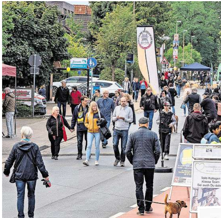
Am Sonntag gehören die Straßen im Ortskern den Fußgängern. Sie werden für den Fahrzeugverkehr gesperrt und werden so zu einer echten Flaniermeile. An der Gottfried-August-Bürgerstraße werden die Stände des Krammarktes aufgebaut und für die kleinen Gäste dreht sich dort auch das Kinderkarussell. (Foto oben)

Mit dabei sind unter anderem wieder die Roll- und Eissportgemeinschaft (REG) Wedemark, die wie in jedem Jahr mit Vorführungen ihres Könnens zur sogenannten Schilling Kreuzung lockt. Die Läuferinnen und Läufer zeigen, wie viel Spaß und Eleganz im Rollkunstlauf steckt – und sind Ansprechpartner für künftige Vereinsmitglieder. Ganz unterschiedliche Vereine und Organisationen präsentieren sich, angefangen bei der DLRG, dem NABU, der Polizei, der Feuerwehr, der Verkehrswacht oder den Selbsthilfegruppen verschiedener Art, das Programm bietet nahezu einen lückenlosen Schnitt durch die Gemeinde und darüber hinaus. Nicht fehlen darf natürlich auch das Handwerk, es wird zu erleben sein, was die Tischler leisten können, die Maler, die Sicherheitstechnik zu bieten haben oder was im Sanitärbereich aktuell ist. Unter dem Label „#zusammenWedemark“ präsentieren sich wedemarkweite Gewerbebetriebe am eigenen Stand, als Dienstleister im familienentlastenden Dienst ist Kern Care dabei und informiert über seine hauswirtschaftlichen Hilfe und Alltagsbetreuungen wie Reinigungstätigkeiten, Hilfe beim Einkaufen, Begleitungen zum Arzt oder zu kleineren Ausflügen. Bunt und spannend ist die Vielfalt, die sich an diesem Tag geballt zeigen wird. Die jungen Besucherinnen und Besucher dürfen sich auf Bastelaktionen freuen, sich fröhlich schminken