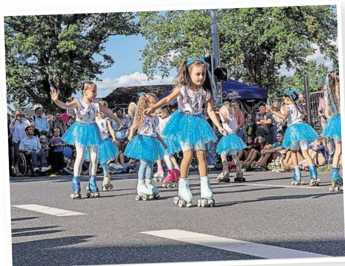
Die Roll- und Eissportgemeinschaft (REG) wird gleich mehrfach Vorführungen ihres Könnens im Bereich der Schilling-Kreuzung zeigen.