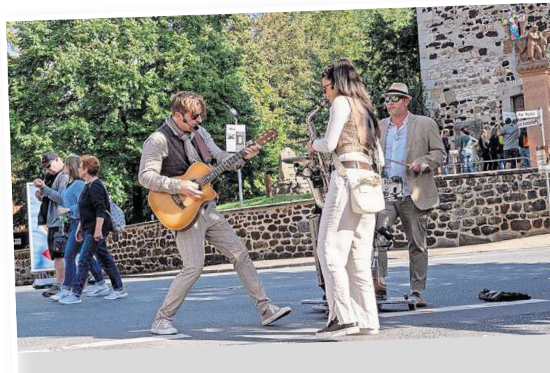
Und auch Live-Musik gehört natürlich beim Bissendorfer Sonntag dazu, sie wird an verschiedenen Standorten zu hören sein.