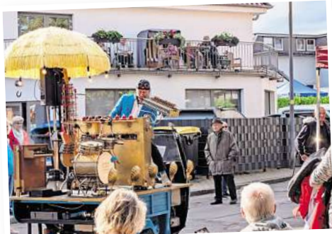
Das Druckluftorchester wird durch die Straßen rollen. Mit sattem Sound unterhält ein einzelner Akteur in Orchesterbesetzung – mit Hilfe von Druckluft und Geschick.