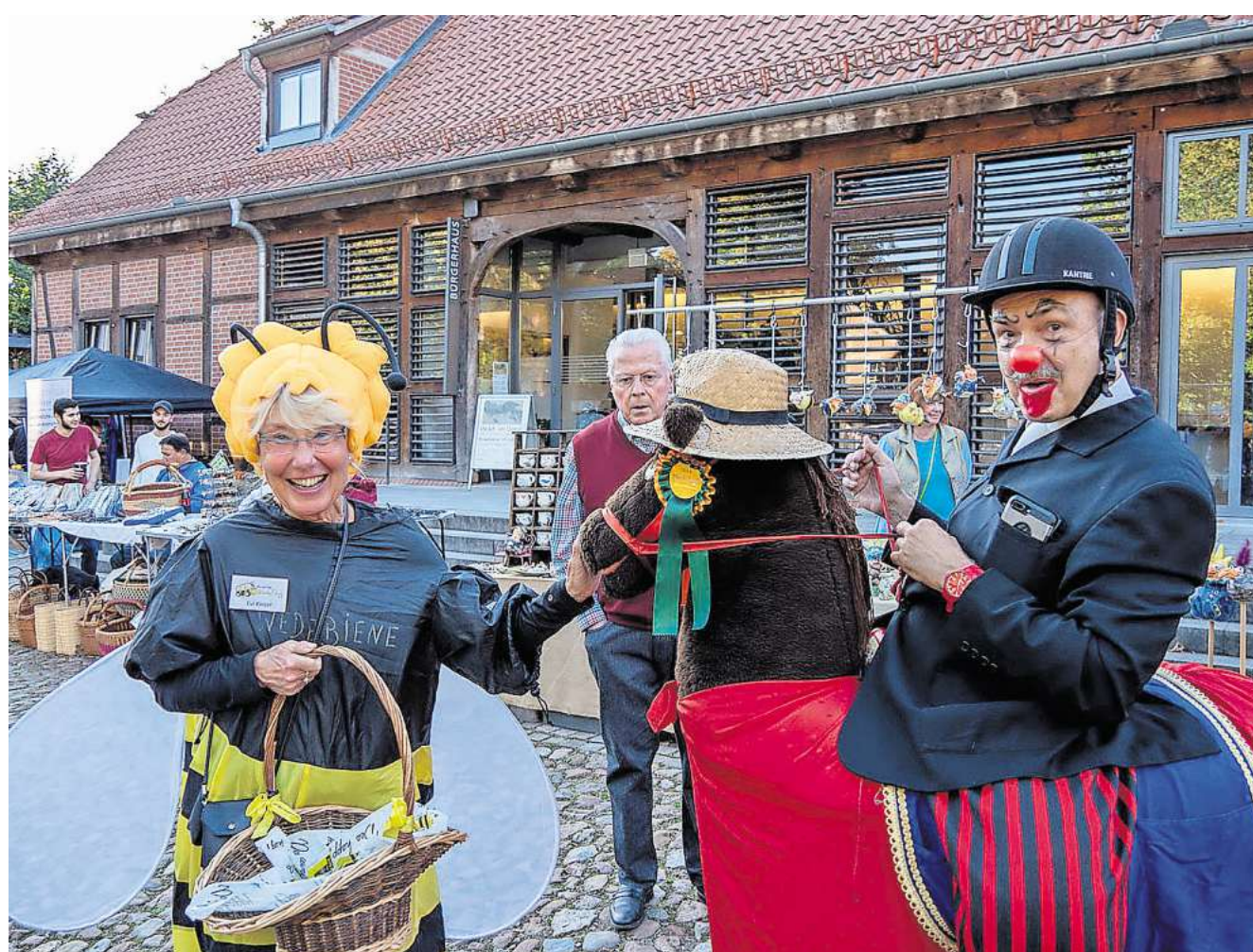
Walking Acts werden am Sonntag für Unterhaltung und manchmal auch Schabernack sorgen.

aufführung. Ob unter freiem Himmel oder im Konzertsaal – die Egerländer-Blasmusik des Polizeiorchesters Niedersachsen ist ein Garant für Unterhaltung. Das Orchester wird an der Kreuzung Mellendorfer Straße/Scherenbosteler Straße aufmarschieren und nach den Grußworten der IBK-Vorsitzenden Katharina Sauer und des Bürgermeisters Helge Zychlinski den „Bissendorfer Sonntagsmarsch“ spielen. Ab 14 Uhr wird der Kinderzauberer und Ballonkünstler, der GROSSEtobini, durch die Straßen ziehen und in verschiedenen Kostümen beeindruckend. Die Roll- und Eissportgemeinschaft (REG) lässt um 15.30 und um 17 Uhr im Kreuzungsbereich zu ihren Auftritten ein. Und wer die für die Gemeinschaft etwas Gutes tun möchte, kauft Tombola-Lose: Es erwarten die Gewinnerinnen und Gewinner interessante, hochwertige Preise. Der Erlös der Tombola kommt der Kinder- und Jugendfeuerwehr Bissendorf/Scherenbostel zu Gute.