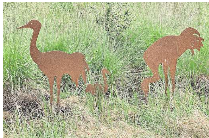
Ein letztes Mal geht es in diesem Jahr auf den Moorerlebnispfad.

neuer Steg auf dem großen Rundweg gebaut werden musste, und eine neue Schwinggrasbrücke gebaut werden konnte. Darüber und über die Hintergründe des jahreszeitlich schwankenden, und zurzeit eher geringen Wasserstandes, möchte der NABU Wedemark informieren. Durch die leichten Niederschläge in den letzten Wochen ist der Wasserstand wieder etwas angestiegen, so dass die neue Schwinggrasbrücke ausprobiert werden kann. Treffpunkt ist der Parkplatz am Moorerlebnispfad/Sportplatz, Osterbergstraße 37, in Resse. Die Führung ist kostenlos und dauert etwa zwei Stunden.