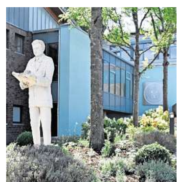
Das beleuchtete Logo der KGS beim neu gestalteten Eingangsbereich mit Namenspatron Wilhelm Röpke.

SCHWARMSTEDT. Nach zehnjährigen Bemühungen startete im Sommer 2000 in Schwarmstedt die Kooperative Gesamtschule. Endlich konnten auch Schülerinnen und Schüler, die zum Gymnasium wollten, die Wilhelm-Röpke-Schule, die davor Haupt- und Realschule war, besuchen, lange Fahrtwege blieben erspart. Zuerst war man ein wenig skeptisch, so gab es dann auch nur eine Gymnasialklasse. Lernten die Schülerinnen und Schüler genug, so viel wie auf einem „richtigen“ Gymnasium? Waren genug Gymnasiallehr-