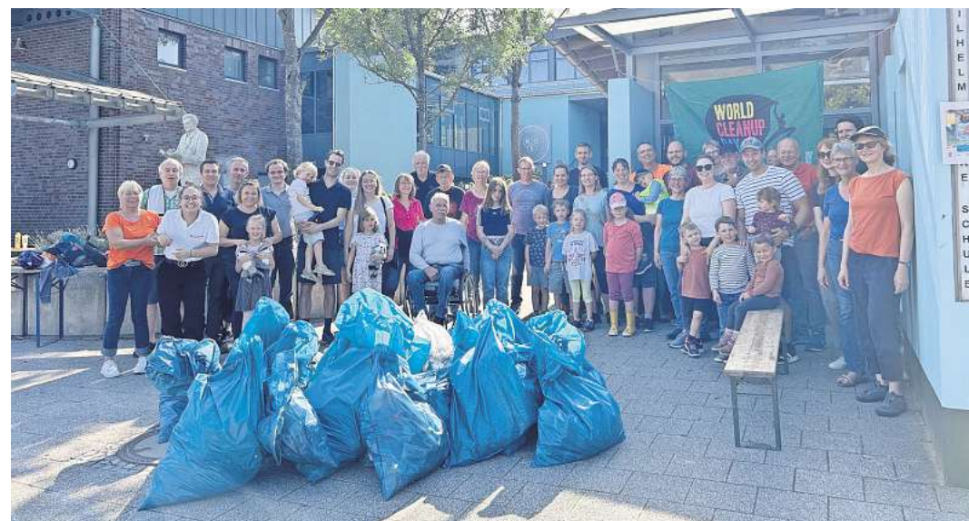
Viele waren jetzt mit blauen Müllsäcken unterwegs.

SCHWARMSTEDT. Am vergangenen Sonnabend konnte man in den Orten Bothmer, Grindau und Schwarmstedt viele Menschen mit blauen Mülltüten beobachten. Das waren die Teilnehmenden am Cleanup Day – der weltweiten Müllsammelaktion, die jährlich im September – stattfindet. Zeitgleich um 10 Uhr starten in den drei Ortschaften der Gemeinde Schwarmstedt Bürger und Bürgerinnen, ausgestattet mit Sammeltüten und Müllzangen. Zu den Fundstücken gehörten u.a. ein Teppich, ausgemusterte Küchenausstattung und Haushaltsartikel, Baumaterialien. Papier und Kartonagen sowie Lebensmittelverpackungen. Dosen (allerdings deutlich weniger als früher) und kleine und große Glasflaschen, Zigarettenskippen und auch Vapes füllten die Tüten. Bürgermeisterin und Schirmherrin Claudia Schiesgeries freute sich über die gute Beteiligung – insgesamt waren über 70 Menschen unterwegs - und dankte