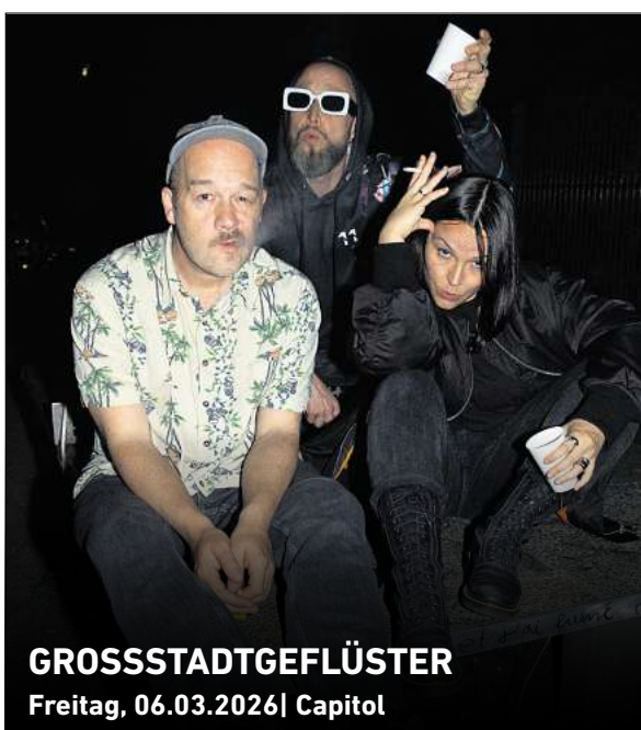
GROSSTADTGEFLÜSTER Freitag, 06.03.2026 | Capitol

Ihr persönlicher Ticketservice der HAZ & NP