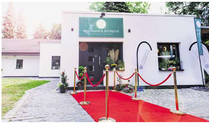
Zum Sommerfest rollte die neue Beauty Lounge den roten Teppich aus.

Extra: Beim Kauf von Pflegeprodukten erhalten Sie 15 % Rabatt.