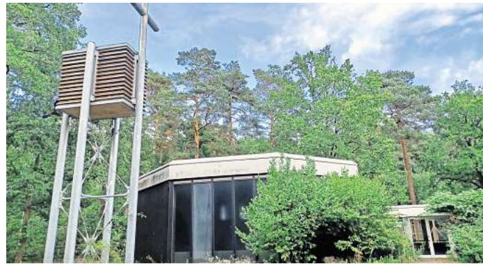
Außer Betrieb: Die entwidmete Christophoruskirche - im Vordergrund der Turm, der nun demontiert und in Bissendorf neu aufgebaut werden soll.

Bauwerk wird in Bissendorf-Wietze demontiert und auf Bissendorfs Friedhof wieder aufgebaut