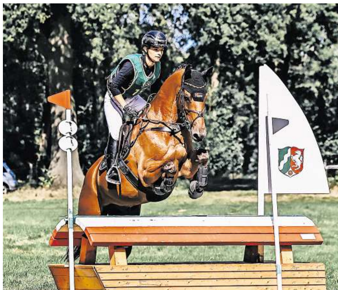
Stars des Spitzensports auf der Geländestrecke in Twenge: Julia Krajewski auf Ero de Cantraie.