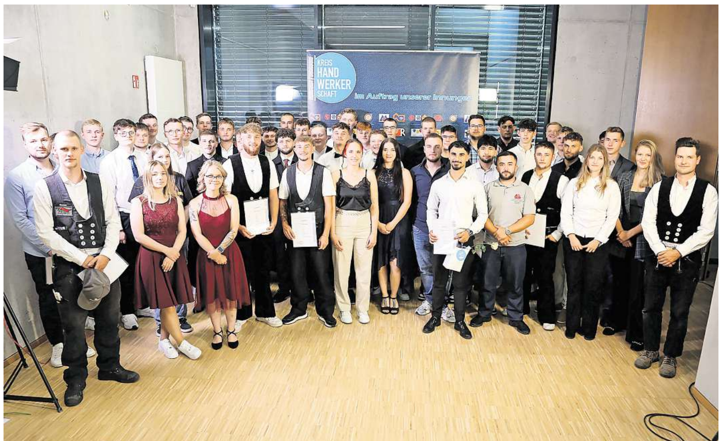
Die Absolventen der Sommerprüfung freuen sich über ihre Gesellenbriefe.