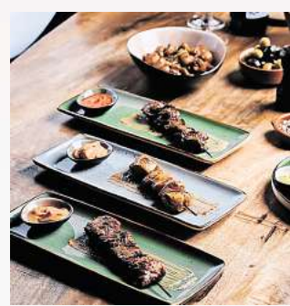
Typisch spanische Gerichte nach authentischen Rezepten sind auf der Speisekarte zu finden. Foto: privat

hungsweise auf den Grill: „Besonders beliebt sind zum Beispiel unsere Grillteller mit iberischem Schweinefilet, aber auch die vegetarische Variante mit Gemüse oder auch mit Fisch ist sehr beliebt.“ Und natürlich stehen auch die beliebten und für die spanische Küche bekannten Tapas auf der Karte, die für eine wahre Geschmacksexplosion sorgen können. Dazu kommen knusprige Patatas Bravas oder die verlockenden Gambas al Ajillo. Dazu ein Glas süffigen Rioja und es könnte ein perfekter Abend werden – und das in einer perfekten Kulisse für ein geselliges Beisammensein im Kreise von Freunden oder der Familie. Das Ibérico bietet Platz für Feiern aller Art, im Innenraum können gut 80 Gäste verwöhnt werden, dazu kommt ein großzügiger Außenbereich. „Ob ein romantisches Abendessen zu zweit oder eine fröhliche Feier – unser Restaurant bietet den idealen Raum für unvergessliche Momente“,