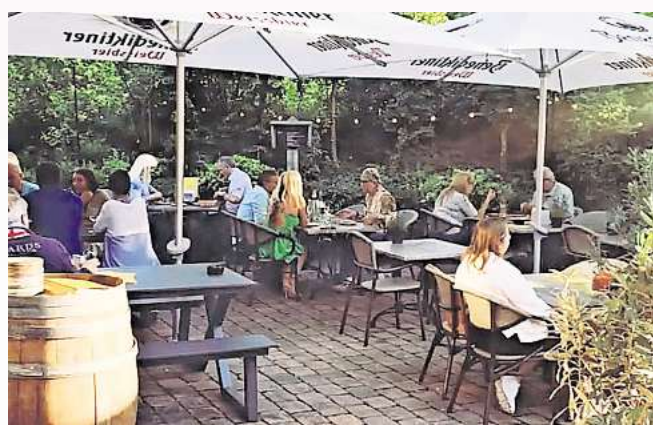
Der Garten am Ibérico lädt besonders an lauen Sommerabenden zum Verweilen und Genießen ein.

so Dennis Chaves. Das Restaurant Ibérico ist dienstags bis donnerstags von 17 bis 22 Uhr geöffnet, freitags und samstags von 17 bis 23 Uhr und sonntags von 17 bis 21 Uhr (montags ist Ruhetag). Reservierungen sind unter der Telefonnummer 05130 – 58 58 10 oder per Email: info@iberico-bissendorf.de möglich. Weitere Infos sind unter www.iberico-bissendorf.de oder auch auf Instagram zu finden. (JO)