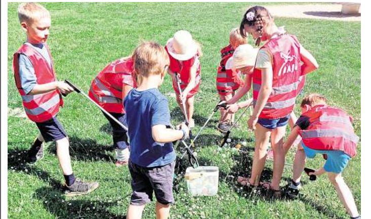
Die NAJU-Kids lernten viele Insektenarten kennen.

schiedlich gemusterten anderen Marienkäfern lernten sie auch den Asiatischen Marienkäfer kennen, einen Import aus Fernost, der den heimischen Arten mit seinem enormen Hunger und einer hohen Fortpflanzungsrate massive Konkurrenz macht. Außer den Marienkäfern spürten die jungen Naturschützer mit Becherlupen noch viele andere Insekten auf der Streuobstwiese