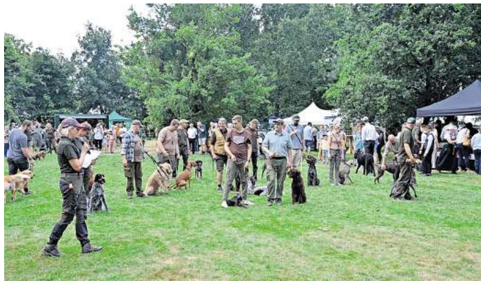
Beim Jubiläumsfest wurden mehrere Jagdhunderassen vorgestellt.

der Drohneneinsatz wurden praxisnah vorgestellt. Musikalisch rundeten die Jagdhornbläser aus den Bläsercorps der Jägerschaft die Veranstaltung feierlich ab.