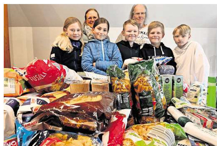
Zeigen soziales Engagement: die sechs Mädchen und Jungen aus der vierten Klasse.

Auf dem Programm standen regelmäßige Treffen in Kleingruppen, die mit Bucks Unterstützung von den Eltern geleitet werden, Kinderkirchen mit allen Teilnehmenden und zum Abschluss eine Übernachtung in der Michaeliskirche. Drei Jahre später sieht man sich dann wieder zur Konfirmationszeit, um die Konfirmation vorzubereiten. Eine neue miniKonfiZeit startet in Bissendorf und Resse nach den Herbstferien – Infos und Anmeldung unter http://www.kirche-bissendorf.de/minikonfis.html .