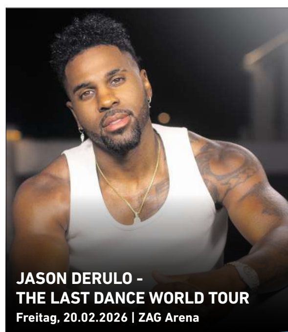
JASON DERULO - THE LAST DANCE WORLD TOUR Freitag, 20.02.2026 | ZAG Arena

Ihr persönlicher Ticketservice der HAZ & NP