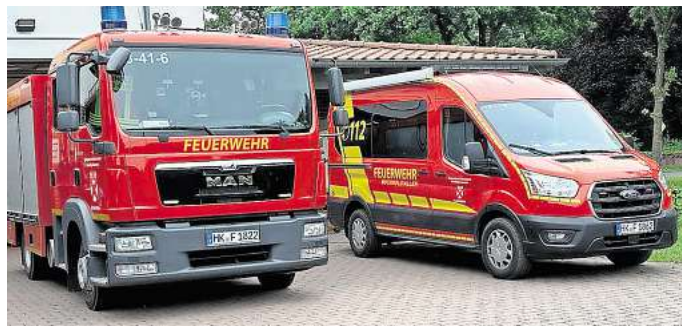
Viele Besucherinnen und Besucher werden am 9. August im Feuerwehrhaus erwartet.

ausstellung verschiedener Rettungseinheiten, die als „Blaulichtmeile“ bekannt ist. Besucher können die Einsatzfahrzeuge hautnah erleben und sich über die Technik und Ausrüstung der Feuerwehr sowie anderer Rettungsorganisationen, darunter die Polizei und die Johanniter-Unfallhilfe, informieren.