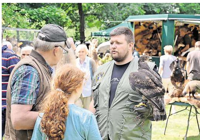
Die Besucher konnten den Greifvögeln ganz nah kommen.