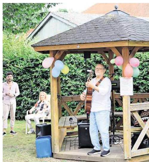
Auch Gäste aus Nah und Fern sind zum Sommerfest in Elze eingeladen.

Seit 2012 findet in Elze regelmäßig ein Sommerfest statt. Dieses wird vom Dorfbild Elze gemeinsam mit dem Deutschen Roten Kreuz organisiert.