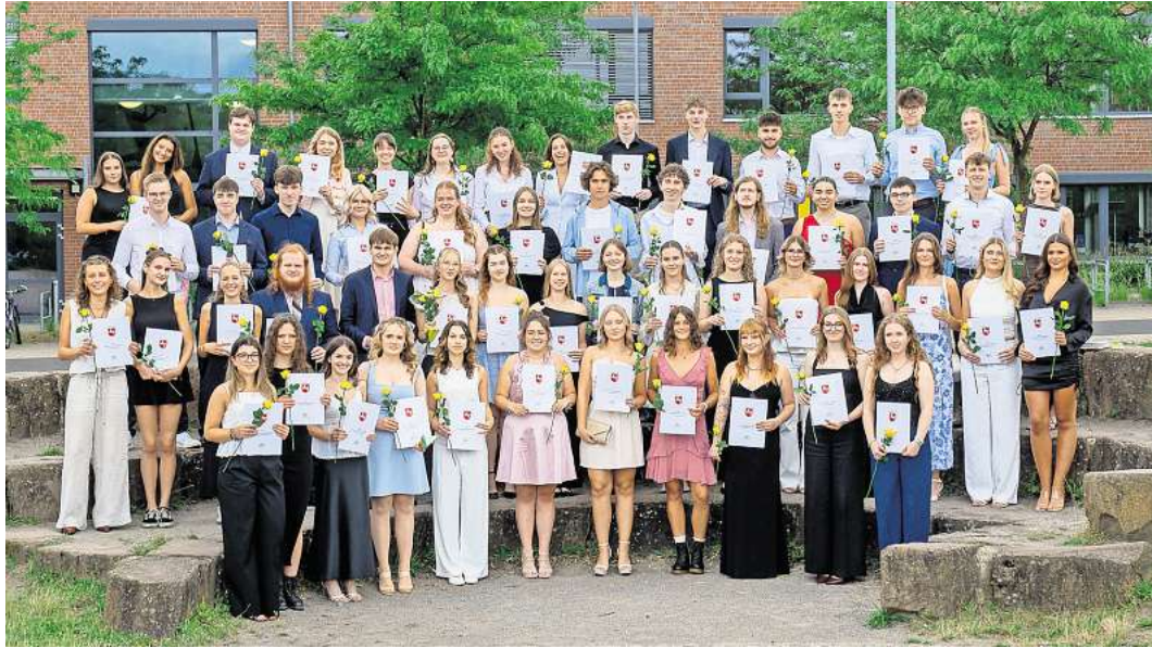
Die erfolgreichen Absolventen des 13. Jahrgangs der IGS Wedemark.

IGS Wedemark feiert erfolgreiche Abiturienten