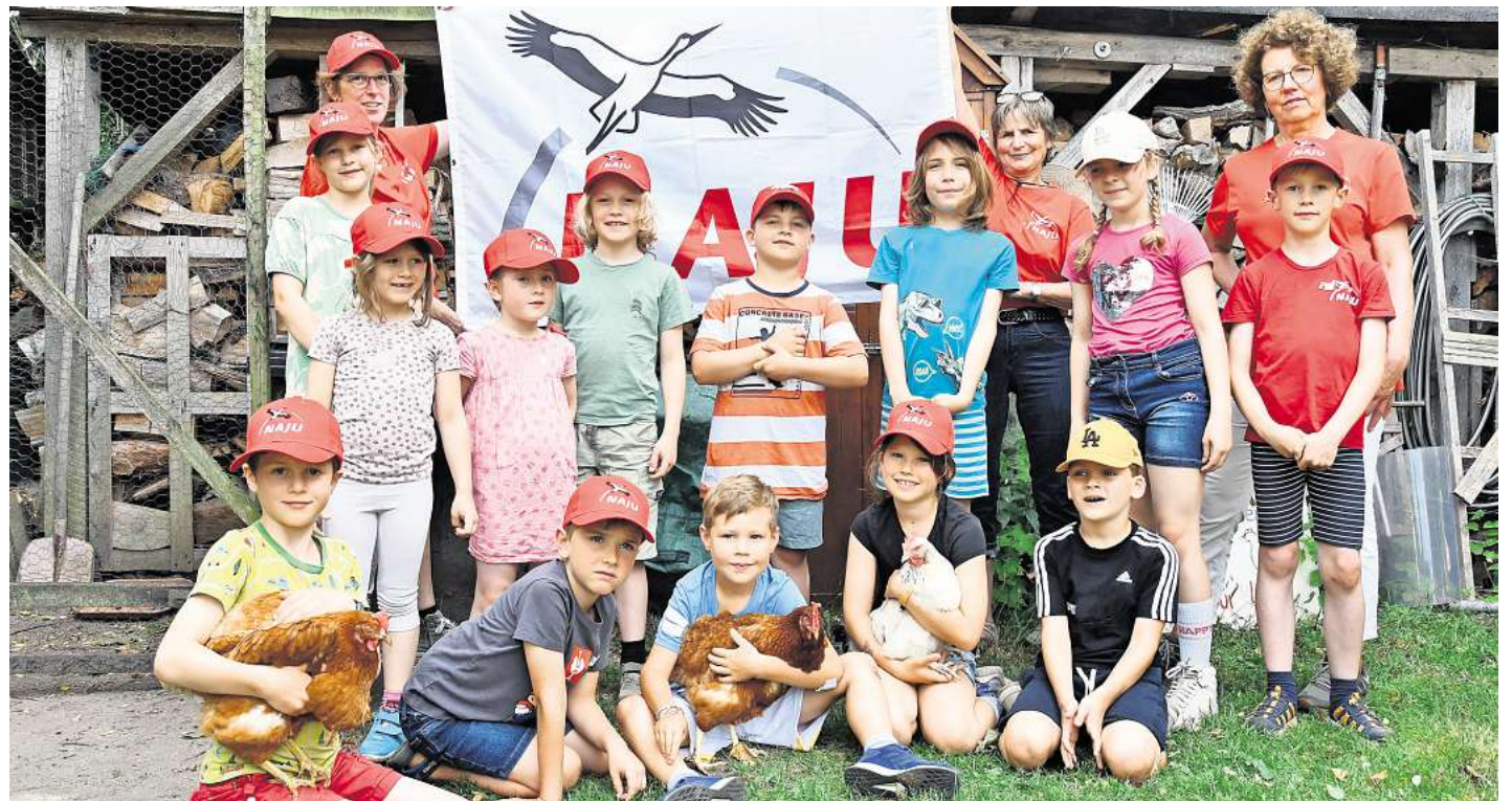
Die Kinder erfuhren viel Wissenswertes über artgerechte Tierhaltung.

NAJU Wedemark unterwegs: spannender Tag mit Hühnern, Ziegen und Ponys