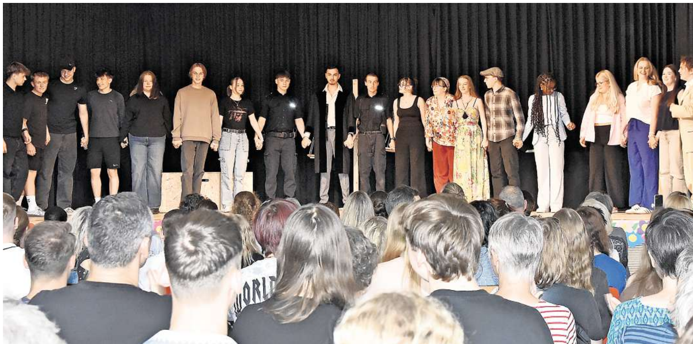
Das Abschlussbild des diesjährigen Theaterstücks an der KGS Schwarmstedt.

Der Kurs Darstellendes Spiel interpretiert den zerbrochenen Krug