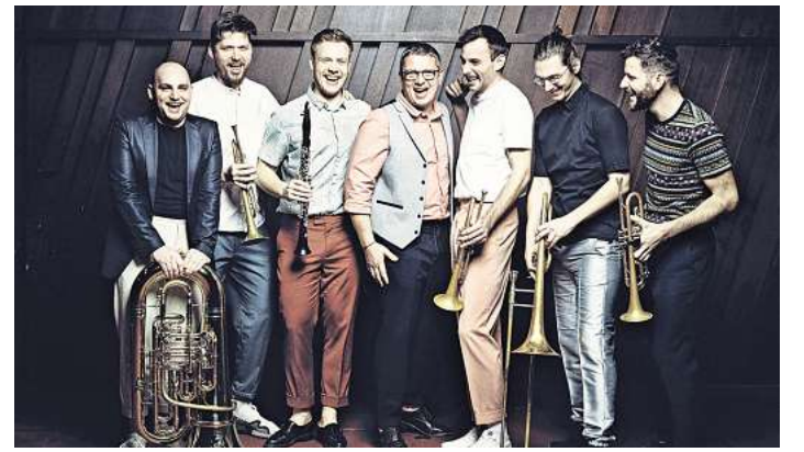
Mit erfrischender Perspektive: die Wiener Blaskapelle "Federspiel".

Federspiel hat sich als innovativer Klangkörper in der europäischen Blasmusikszene etabliert und trat bereits auf großen Bühnen weltweit auf. Zum Jubiläum werden neue Kompositionen sowie beliebte Stücke und Anekdoten aus der Bandgeschichte präsentiert.