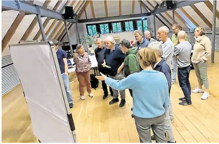
Bürgerdialog der Grünen: „Schreibt unser Wahlprogramm“.

WEDEMARK. Die Grünen in der Wedemark bereiten sich auf die Kommunalwahl 2026 vor und laden die Bürgerinnen und Bürger zu einem umfassenden Dialog ein. In den kommenden Monaten sind verschiedene öffentliche Veranstaltungen geplant, bei denen Themen wie Klimaschutz, Kinderbetreuung, Finanzen, Verkehr, Freizeit, Energie, Landwirtschaft und Verwaltungsreform diskutiert werden sollen.