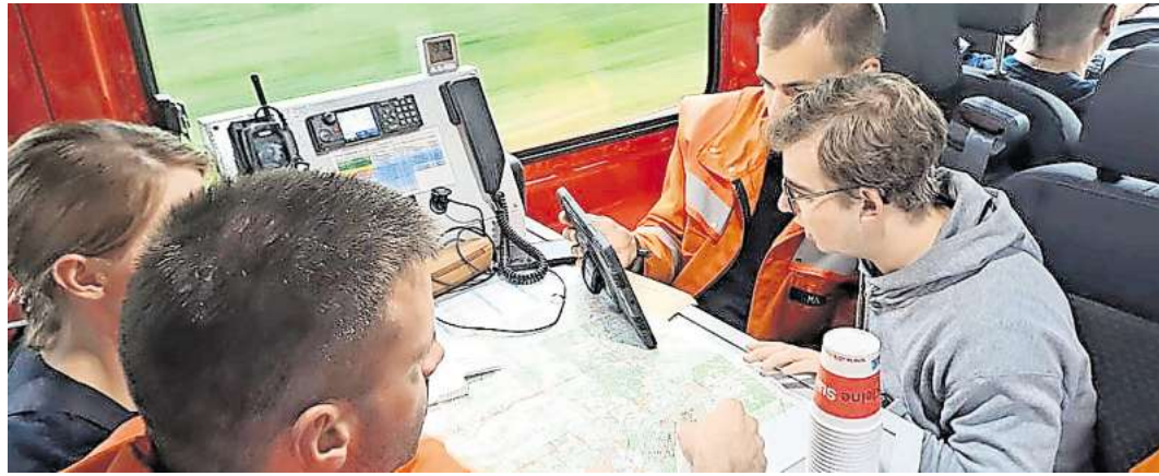
Lagebesprechung in Schwarmstedt.

Ziel der praktischen Ausbildung war es, die Handhabung der Funkgeräte und die Funkbetriebsprache zu schulen, die Orientierung mit Karten zu trainieren und anspruchsvolle Fahraufgaben mit den Einsatzfahrzeugen zu meistern. Im Gerätehaus der Feuerwehr Bothmer hatte die Fachgruppe Führung und Kommunikation der Samtgemeindefeuerwehr eine Einsatzleitung eingerichtet, die bei größeren Einsätzen als Unterstützung für die Feuerwehr und