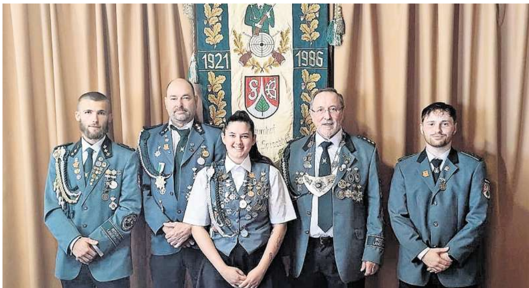
Die neuen Majestäten.

Für den Nachmittag hatte der Schützenverein zum Buffet eingeladen, begleitet von einem bunten Programm für Groß und Klein. Kinder vergnügten sich an einer Hüpfburg, Wasserpistolen und kostenlosem Eis. Bei Musik wurde ausgelassen getanzt und gefeiert. Auch der Barbetrieb erfreute sich großer Beliebtheit und trug zur fröhlichen Atmosphäre bei.