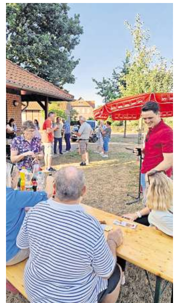
Zahlreiche Bürgerinnen und Bürger waren der Einladung gefolgt.

Die SPD bewertet die lebhaft Resonanz und den offenen Austausch als vollen Erfolg und kündigt an, die Veranstaltungsreihe „SPD vor Ort“ fortzusetzen. Auch künftig sollen Bürgerinnen und Bürger die Möglichkeit haben, direkt und unkompliziert mit Kommunalpolitikerinnen und -politikern ins Gespräch zu kommen und ihre Anliegen mitzuteilen.