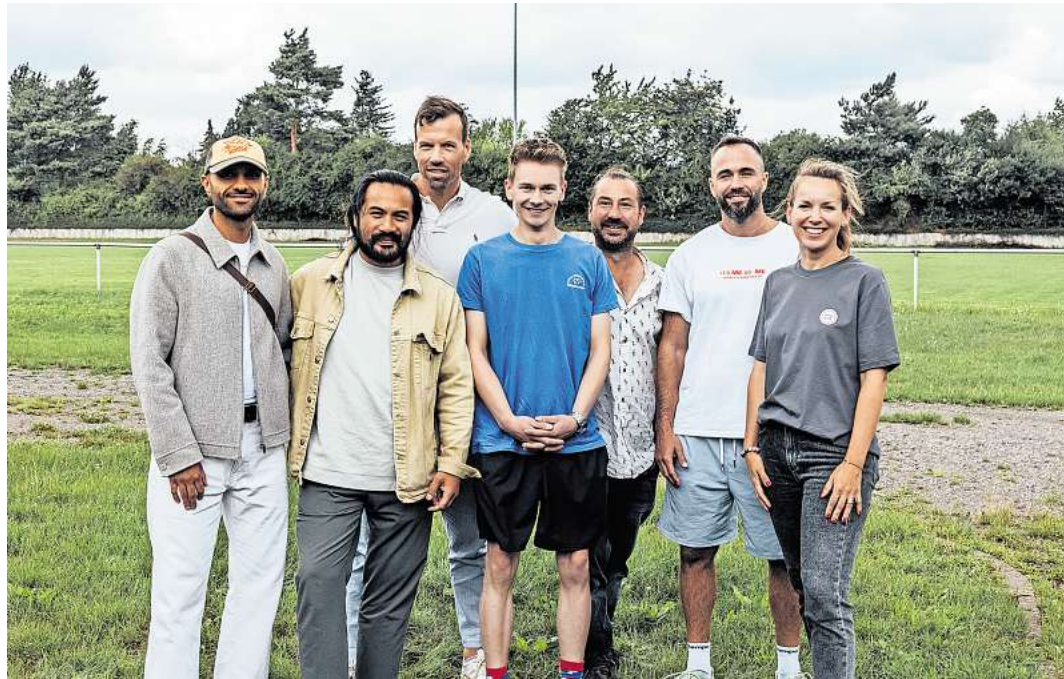
Das Organisationsteam freut sich auf ein spannendes und abwechslungsreiches Event.

Uhr angesagt. Jugendliche zahlen zehn Euro, Kinder sind frei. Also: Jede Menge Fitness, Fun und Fußball sind garantiert – Torwandschießen, Schnellschuss-Messung sowie eine riesige Hüpfburg runden das ganze Event ab.