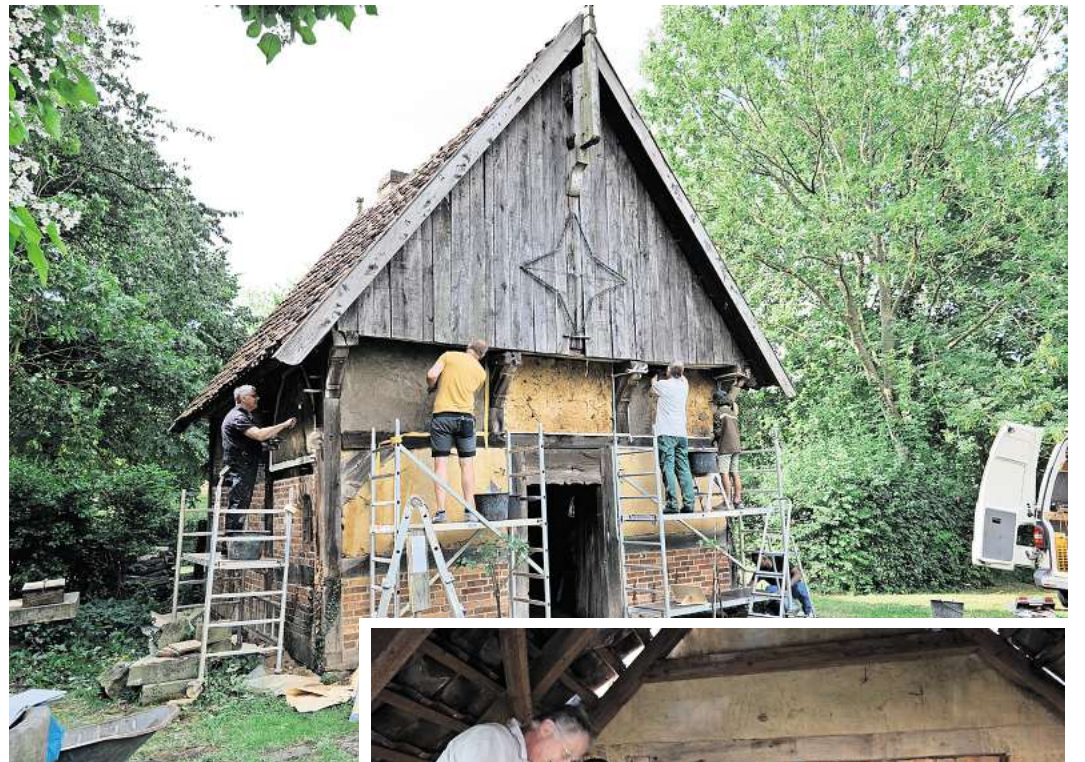
In dem Lehmbau-Workshop werden insgesamt zehn Lehmgefache saniert.

Den nächsten Backtag gibt es im Brelinger Pfarrbackhaus beim Dorf- und Gemeindefest, das am