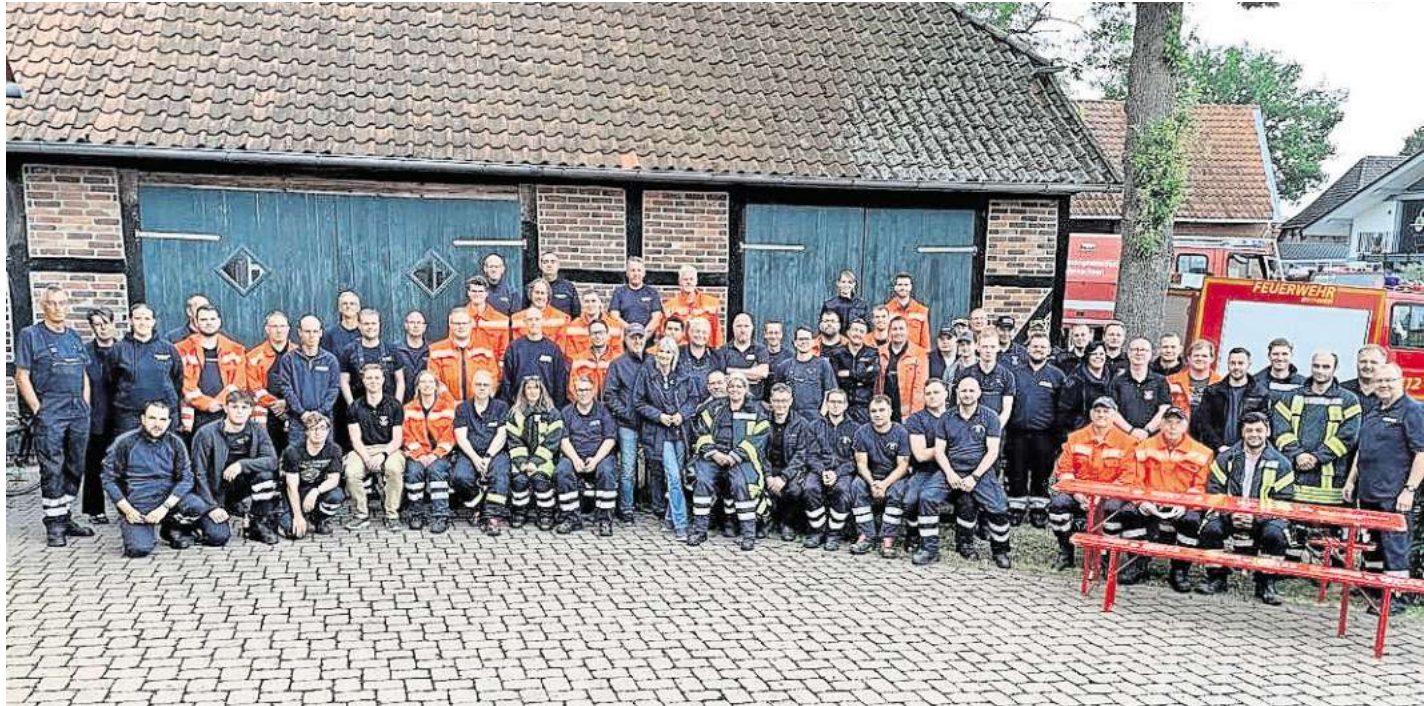
Neun Ortswehren haben sich an der Übung beteiligt.

wurden die gemeinsamen Erfahrungen ausgetauscht. Die Feuerwehrführung zeigte sich mit dem Ablauf und der Beteiligung an der Übung sehr zufrieden. Solche Ausbildungen sind wichtig, um im Einsatzfall schnell und koordiniert handeln zu können und stärken zudem die Kameradschaft innerhalb der Samtgemeindefeuerwehr.