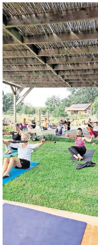
FLEXIBAR-Training mit neurozentriertem Input.

LINDWEDEL. Ein Highlight des Sommers bietet der zweite „MOVE&SHINE“ Fitness-Kongress am 23./24. August in Lindwedel. An diesem Wochenende begrüßt der Sporthof Schöne Aussicht Ausbilderinnen der internationalen Fitnessszene für ein inspirierendes und bewegungsfreudiges Event rund um den Themenkomplex ganzheitliche Fitness. Alle Menschen, die sich für die nachhaltig positiven Aspekte der ganzheitlichen Bewegung interessieren (Trainer und Teilnehmer von Gruppenfitnesskursen) kommen auf ihre Kosten, denn präsentiert werden die Trends der Branche: BodyART, neurozentriertes Training, Spiral Moves, deepWORK, Pilates, 5D Training und vieles mehr. Mitmachen kann jeder, denn ganzheitliches Training berücksichtigt immer verschiedene Level. Ein rundes Abendprogramm in dem schönen Ambiente des Sporthofes bietet Möglichkeiten der Vernetzung, der Gemeinschaft und des Austausches. Anmeldungen unter (0160) 7 75 06 57/schoene-aussicht-lindwedel.de.