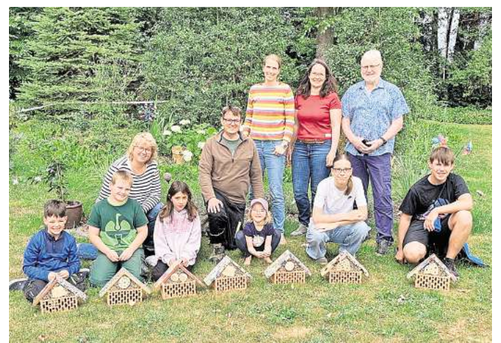
Gemeinsam haben sie geklebt, gesägt und gebohrt.

Bei schönstem Sommerwetter wurde gemeinsam mit Vertreterinnen und Vertretern des Bürgervereins an den Häusern geklebt, gesägt und gebohrt, um einer Vielzahl Gailhofer Insekten neue Unterschlupfmöglichkeiten zu bieten.