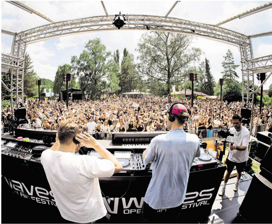
Im Spaßbad Mellendorf herrscht bald wieder Festival-Atmosphäre.

Waves Open Air: Premiere am Sonnabend, 6. September