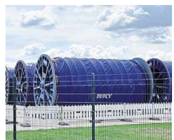
Mächtig: Die Kabeltrommeln wiegen je 100 Tonnen und tragen rund zwei Kilometer Kabel.

Dazu gibt es ein Rahmenprogramm mit Mitmachstationen, Hüpfburg, Kinderschminken und einem gastronomischen Angebot.