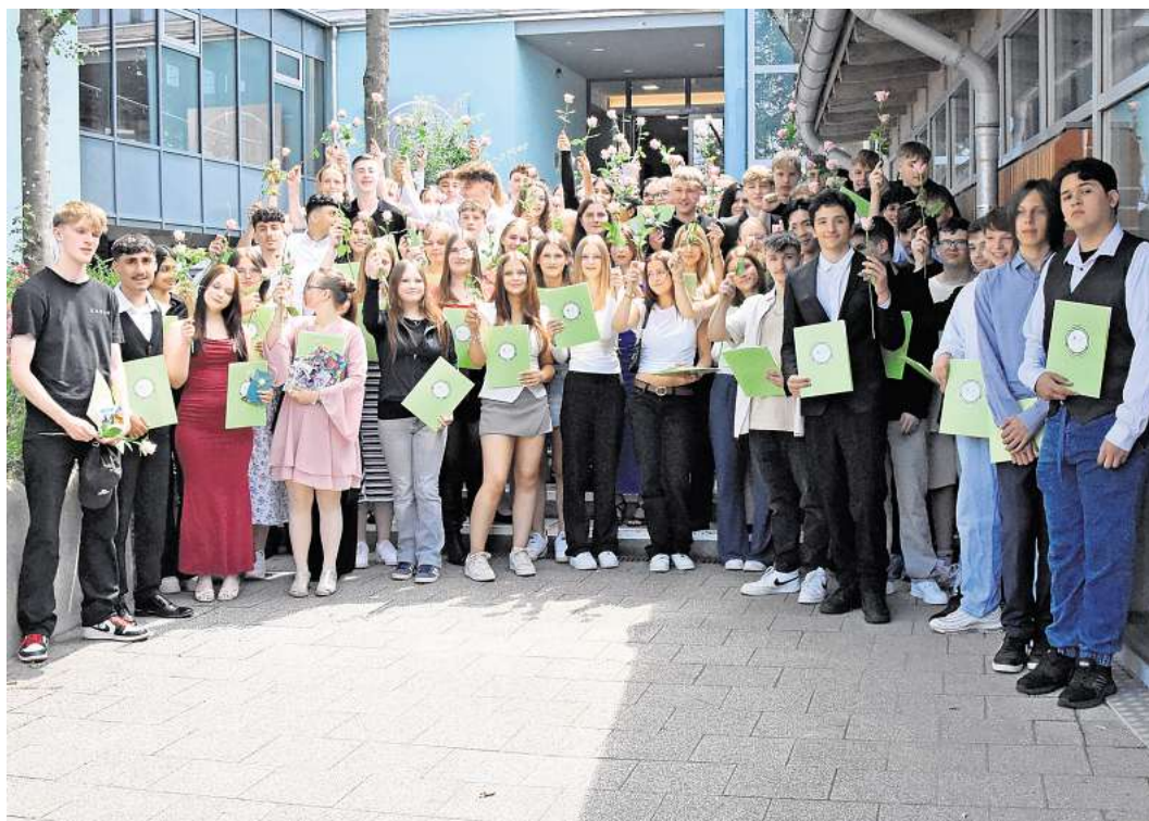
Die KGS Schwarmstedt verabschiedete ihre Haupt- und Realschüler feierlich.

Feierliche Entlassung der Haupt- und Realschüler