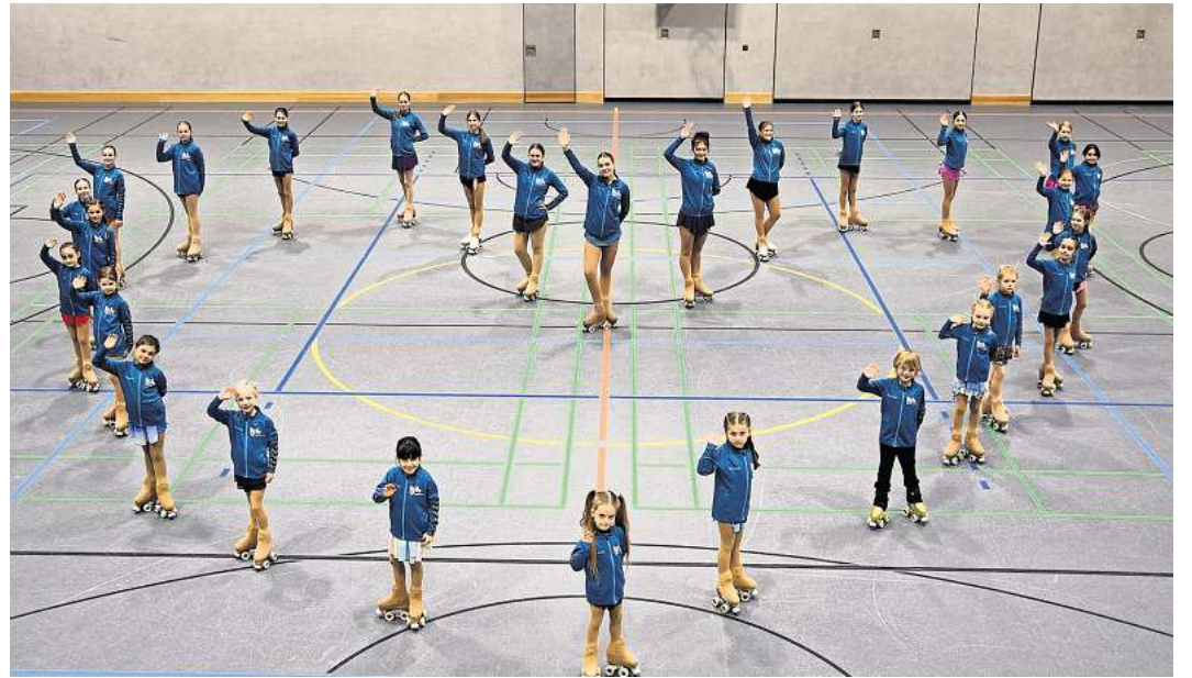
Insgesamt 14 Vereine aus ganz Niedersachsen haben ihre Talente gemeldet.

Unser Fazit: Der achte Heidepokal wird wieder ein echtes Spektakel – für Sportfans, Familien und alle, die Kunst auf Rollen lieben. Vormerken, hingehen, mitfeiern!