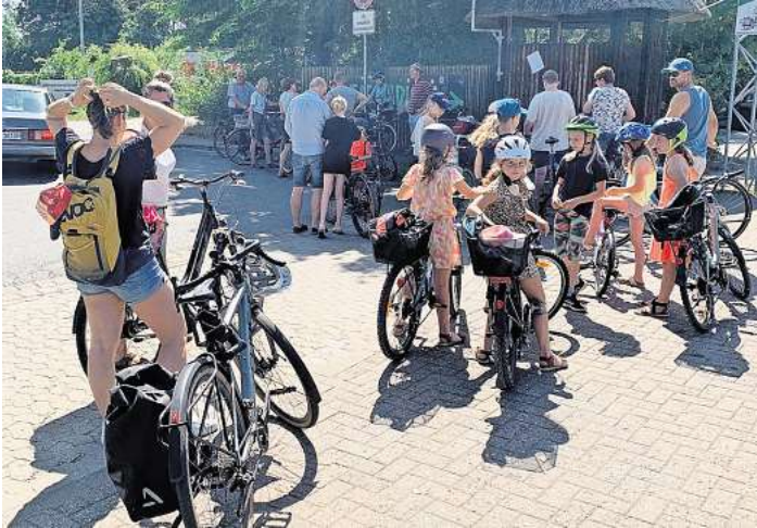
Die Gruppe suchte sich schöne Wege abseits befahrener Straßen.

stamm zu schlagen. Es wurde eifrig gehämmert. Im Anschluss machte die Gruppe einen gemütlichen Spaziergang rund um den See, um die Natur zu genießen, Vögel und Frösche zu beobachten und die dortigen Kunstobjekte zu bestaunen. Später ging es weiter in Richtung Waldkater. Dort bot sich den Erwachsenen die Gelegenheit zum geselligen Beisammensein, während die Kinder auf dem Spielplatz und im Streichelzoo auf ihre Kosten kamen. Nach der gemeinsamen Rückfahrt nach Mellendorf zog es vor allem die Jüngsten zum Abschluss noch ins Freibad, um den schönen Tag entspannt ausklingen zu lassen.