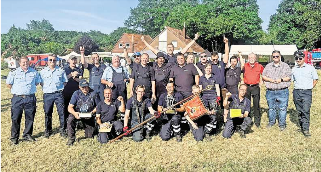
Das Bild mit den strahlenden Siegern.