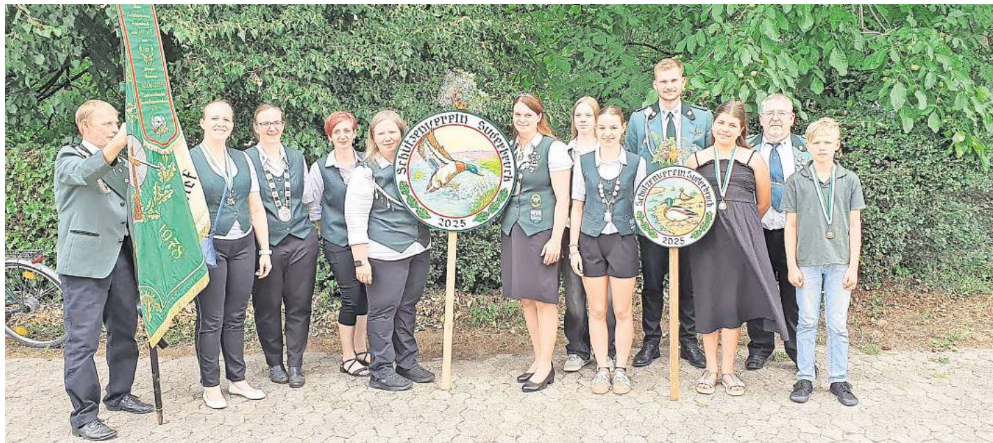
Die Preisträger des Schützenvereins Suderbruch.

130 Teilnehmer beim traditionellen Schützenfest auf der Festwiese