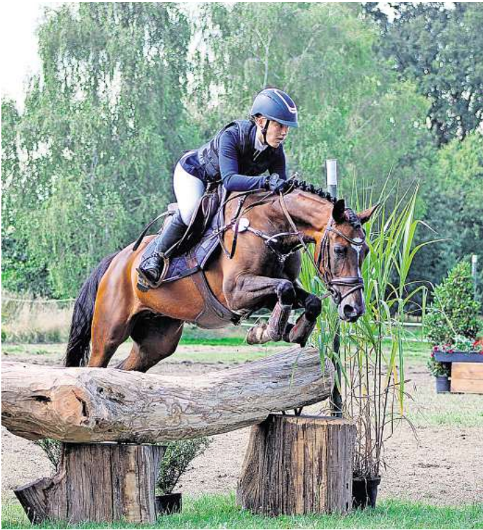
Spannend wird es wieder beim Brelinger-Berg-Derby am Sonntag-nachmittag.

Von den Jungpferdeprüfungen der Klassen A und L im Springen und in der Dressur, über Prüfungen der Klassen E-M** sind