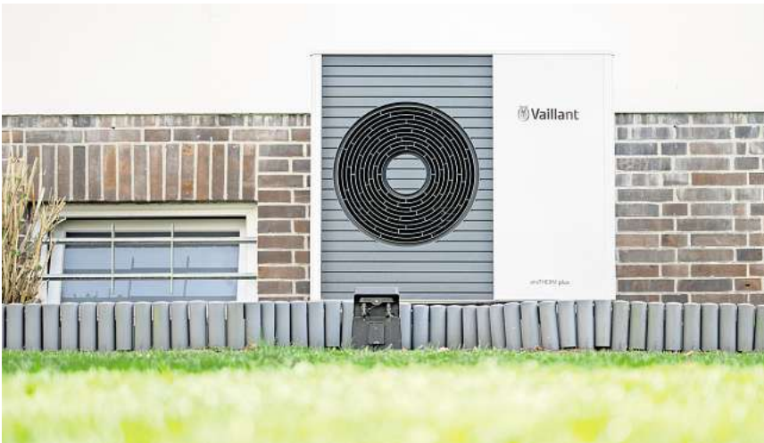
Preise und Details bei Wärmepumpen liegen weit auseinander.

Natürlich können sich die Kosten je nach Material, Leistung und individuellen Gegebenheiten vor Ort unterscheiden. Doch zum Teil