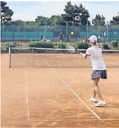
Auf allen neun Plätzen herrschte den ganzen Tag über reger Betrieb.

Bereits während des Turnierwochenendes war allen Beteiligten klar: Dieses Event soll keine einmalige Sache bleiben. Die Vorfreude auf eine Neuauflage im kommenden Jahr ist groß – möglicherweise sogar erweitert um eine Jugendkonkurrenz.