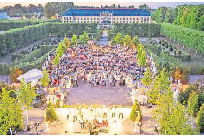
So lauschig können Sommernächte sein.