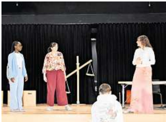
Die Gerichtsrätin erläutert Eve und ihrer Tochter Marthe ihr Vorgehen.