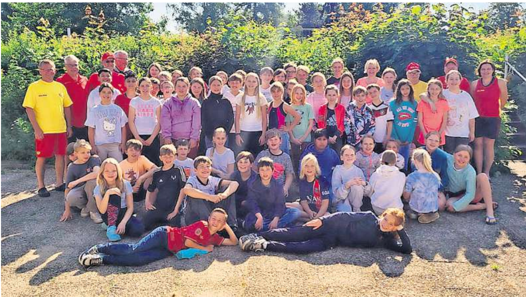
Die Kinder sind jetzt sicherer im Element Wasser unterwegs.

Mehr Infos unter: www.schwimmoffensive-hannover.de . Die Region Hannover ist Sponsor und trägt mit ihrem finanziellen Engagement dazu bei, dass solche Schwimmoffensiven laufen können. Ebenso möchte sich die DLRG-Ortsgruppe Wedemark recht herzlich bei der Heidebäckerei Meyer bedanken, die jeden Tag frische Brötchen zur Versorgung des ehrenamtlichen Trainerteams zur Verfügung stellt.