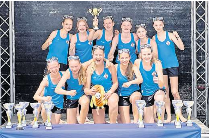
Die weibliche B-Jugend des MTV ist Titelverteidiger an der Ostsee.

Gespielt wird auf einem Sandspielfeld der Größe 27 x 12 Meter. Der Torraum ist im Unterschied zum Hallenhandball-Halbkreis rechteckig. Im Gegensatz zum Hallenhandball gibt es je nach Art des Torwurfs unterschiedlich viele Punkte. Für ein einfaches Tor erhält das Team einen Punkt. Der Torhüter darf ins Angriffsspiel miteinbezogen werden bzw. durch einen speziell gekennzeichneten Schlüsselspieler ersetzt werden. Torwürfe durch diesen Schlüsselspieler zählen zwei Punkte. Ebenfalls gibt es für einen Spin-Shoot (Sprungwurf mit Drehung um die eigene Ach-