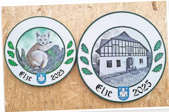
Die handgemalten Königsscheiben werden bei den Ausmärschen zu ihren neuen Besitzern gebracht.

Ab 18 Uhr versammeln sich die Schützen und ihre Gäste zur Königsvesper und stimmen sich damit auf den Ausklang des diesjährigen Schützenfestes ein.