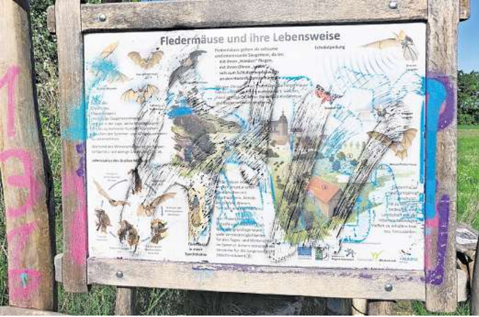
Die Infotafel ist mit Graffiti beschmier worden...