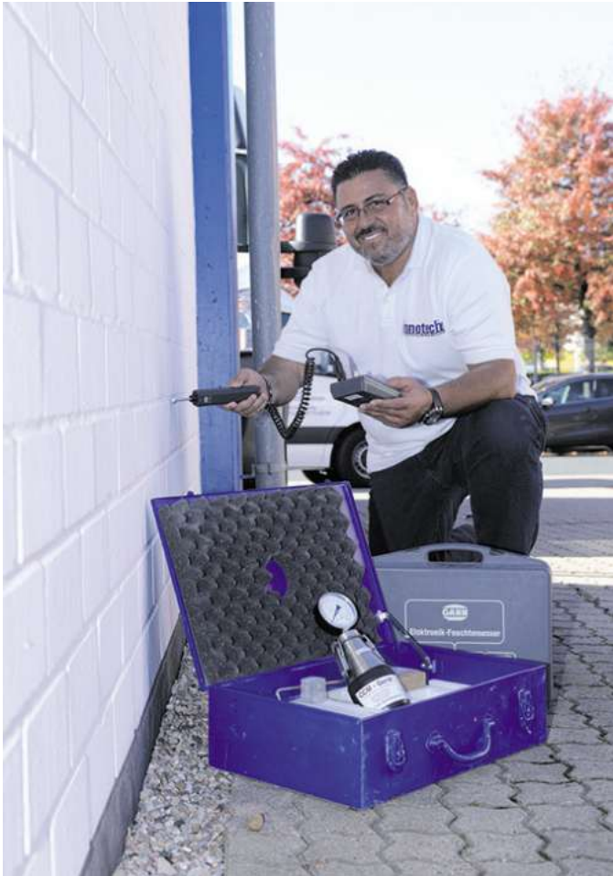
Eine kostenlosen Schadensanalyse und ausführliche Beratung ist für die innotech GmbH fester Bestandteil des Leistungsversprechens.

Starkregenhinweiskarten informieren über besonders gefährdete Wohngebiete