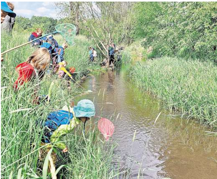
Das Event fand im verwunschenen Garten statt.

„Hat jemand von euch Lust, den PH- Wert des Wassers zu bestimmen, damit wir wissen, ob es sich um ein gesundes Gewässer handelt?“, fragte eine Betreuerin. Und ob! Sogleich wurden eifrig die Teststreifen in die Wasserbehälter gehalten, und es wurde herausgefunden, dass das Wasser weder zu sauer noch zu basisch war, also ein guter Lebensraum für Wasserpflanzen und Wassertiere darstellt.