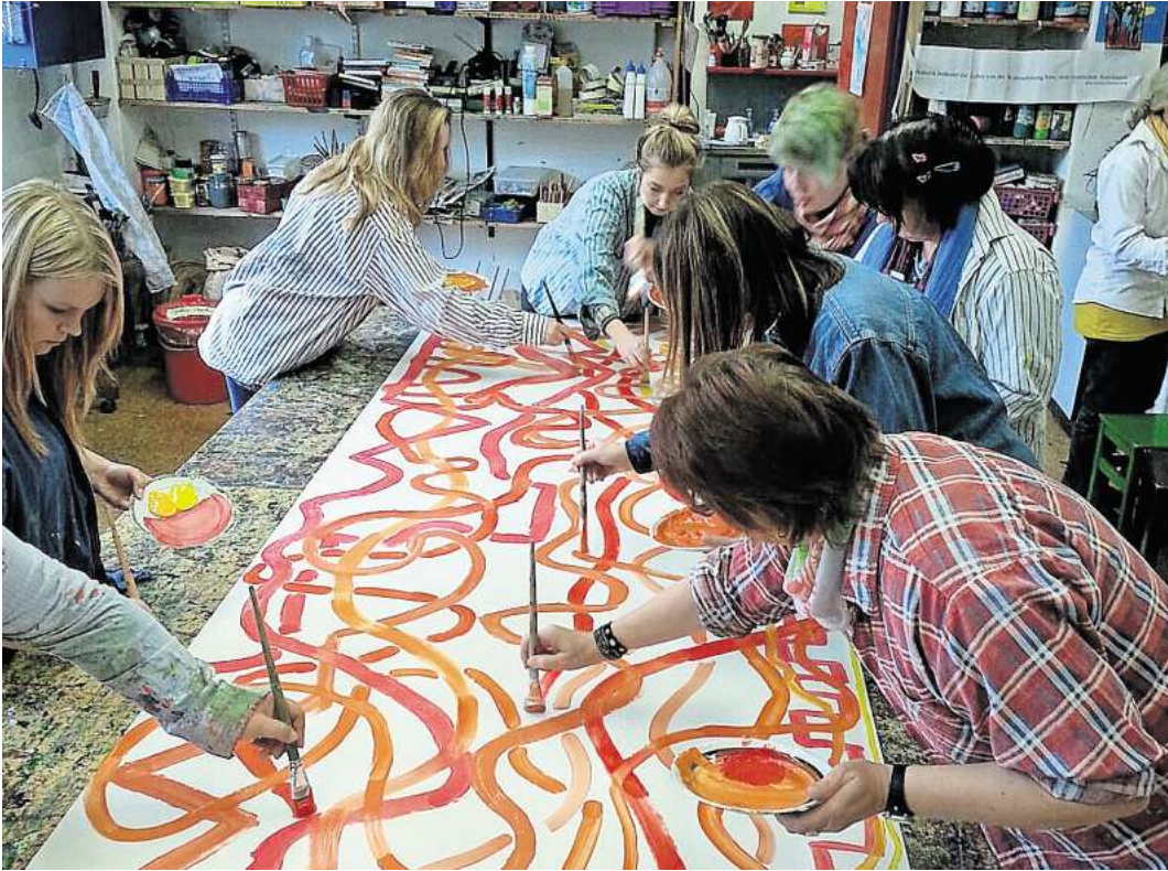
Die Kunstschule Pinx bietet diese Qualifizierung an.

Ästhetisches Lernen ist das erste Lernen überhaupt und Voraussetzung für alle weiteren Lernprozesse. Ästhetische Bildung hat das Ziel, das Kind in seiner ganzheitlichen Entwicklung zu unterstützen. Seine sensorischen, motorischen, emotionalen, ästhetischen, kognitiven und sprachlichen Fähigkeiten werden geschult und es wird in der Entwicklung von Selbstbewusstsein, Kreativität, Eigenständigkeit und Identität bestärkt. Dafür brauchen Kinder kreative Erwachsene, die mit den vielfältigen Methoden der ästhetischen Bildung vertraut sind. Im Orientierungsplan des niedersächsischen Kultusministeriums für Bildung und Erziehung im Elementarbereich, ist ästhetische Bildung daher als eigener Lernbereich definiert.