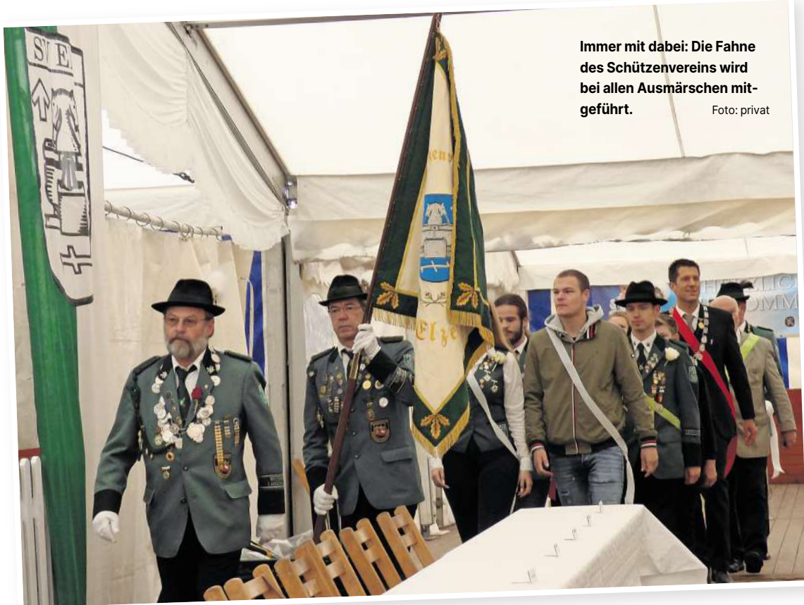
Immer mit dabei: Die Fahne des Schützenvereins wird bei allen Ausmärschen mitgeführt.

Beim König dürfen die Marschierer Rast einlegen und können sich bei Kaffee und Kuchen entspannen. Begleitet wird der Umzug musikalisch vom Spielmannszug Wietze-Steinförde. Gegen 16.30 Uhr wird die Gesellschaft auf den Festplatz zurück erwartet, ab 19 Uhr heißt die Deise Tanz unterm Sternenhimmel mit dem DJ. Die Kinder können sich auf der Hüpfburg austoben, eine Schießbude wird es geben und tolle Preise bei einer Tombola.