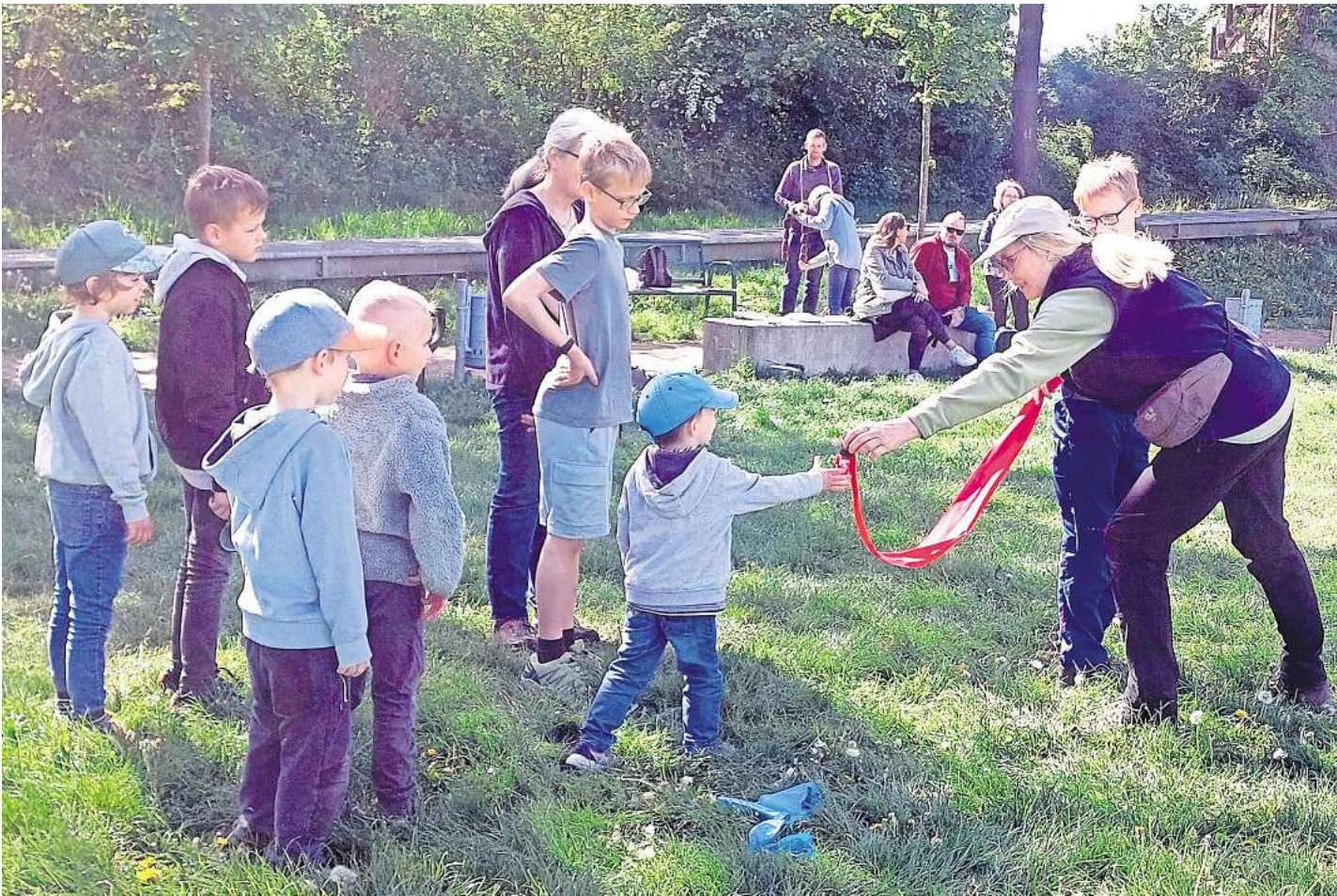
Am heutigen Sonnabend, 14. Juni, steigt die Suche nach Marienkäfern & Co.

NAJU Schwarmstedt untersucht die Artenvielfalt