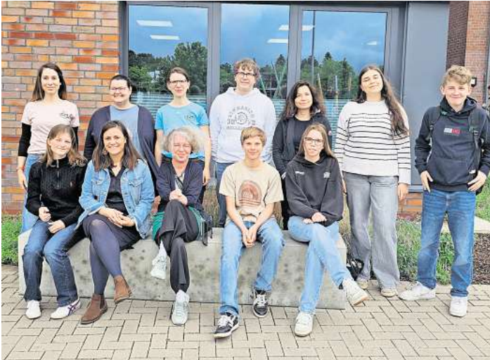
Birgit Langensiepen überzeugte mit Offenheit, Humor und spannenden Einblicken in ihr Arbeitsleben.

Derzeit arbeitet Langensiepen beispielsweise an einer Richtlinie zur Spielspeicherung, die Verbraucherinnen in ganz Europa betreffen wird. Europa sei dabei immer auch Teamarbeit, betonte sie – trotz der vielen Verantwortung sei sie keineswegs „Einzelkämpferin“. Geld spielte