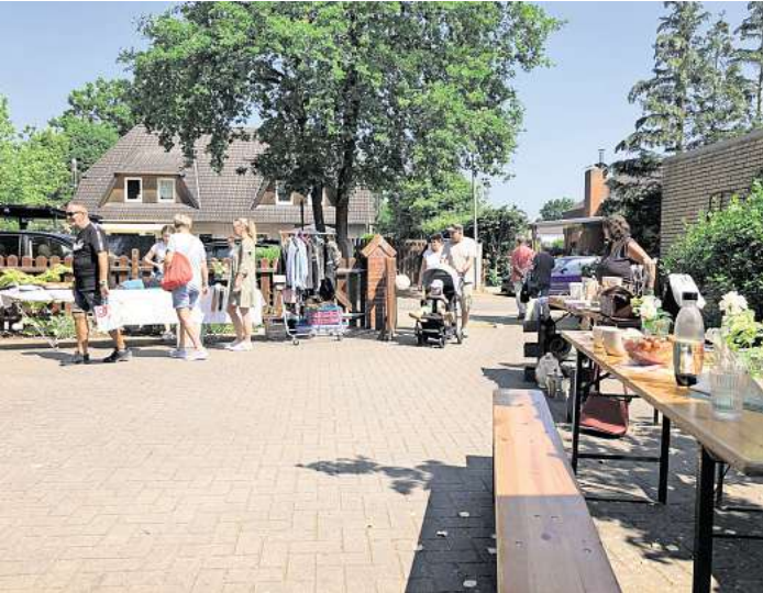
Der Dorf- und Garagenflohmarkt geht bereits zum dritten Mal über die Bühne.

Es gibt ein reichhaltiges Angebot an Leckerreien wie etwa Bratwürstchen, frische Waffeln, Kartoffelpuffer, Popcornstand, Kaltgetränke, frischen O-Saft, Kaffee und ganz viel Kuchen. Und wem