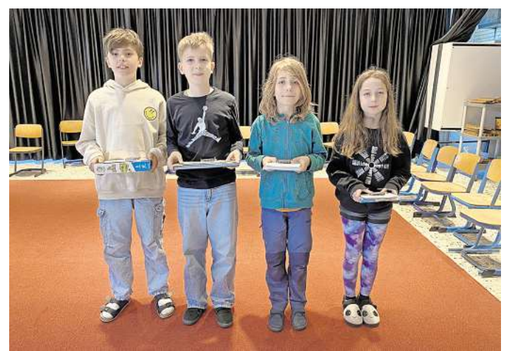
Die erfolgreichen Mathetalente aus Bissendorf.