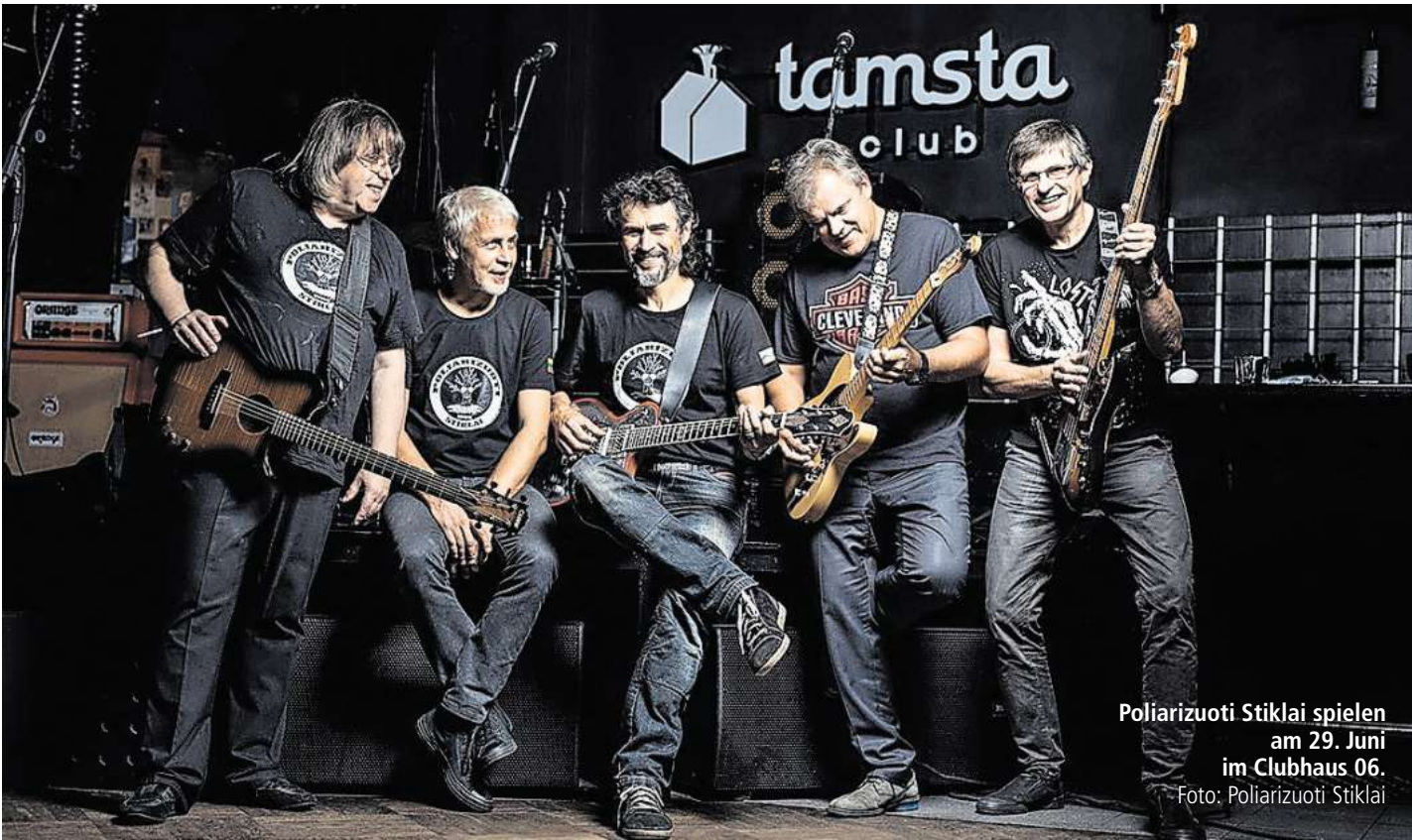
Poliarizuoti Stiklai spielen am 29. Juni im Clubhaus 06.