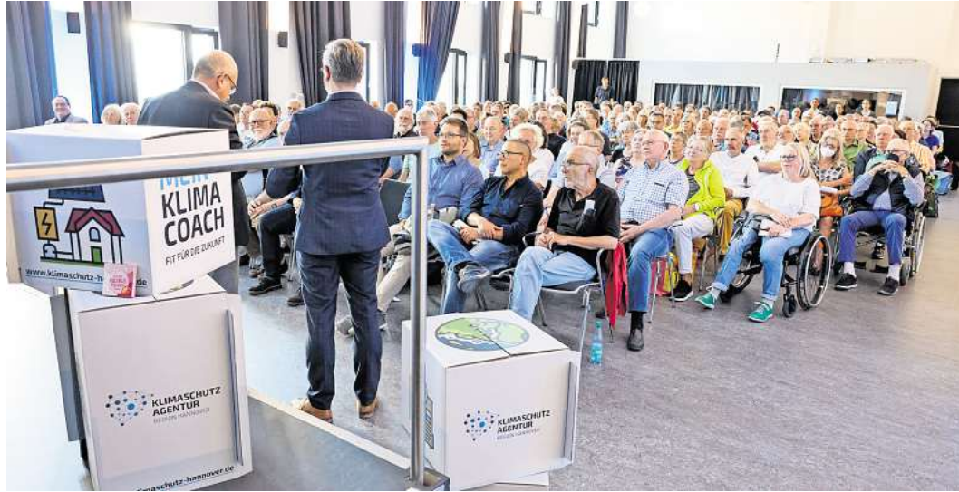
Beim Infoabend geht es auch um einen individuellen Sanierungsplan.

23. Juni: Infoabend zum Thema Dämmen mit der Klimaschutzagentur Region Hannover und der Gemeinde Wedemark