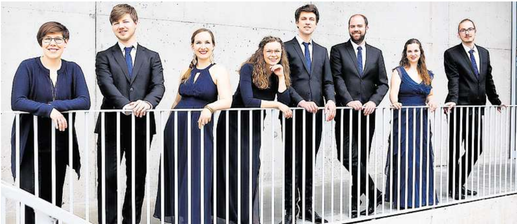
Das „Voktett Hannover“ ist am 10. Mai in Brelingen zu Gast.

„Was erwartet uns nach dem Tod?“, fragen die Sängerinnen und Sänger von Voktett Hannover. „In Musik und Literatur nähern wir uns an diesem Abend