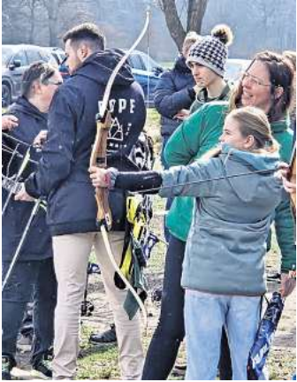
Vereinsmitglieder unterstützen die Gäste beim Schießen.

In diesem Jahr fand der Besuch zum Ende der Wintersaison statt und der Verein stand vor einer großen Aufgabe. Statt der üblichen 20 bis 30 Personen hatten sich in diesem Jahr mehr als 70 Gäste angemeldet, die unter anderem aus dem Ruhrgebiet anreisten. Es war klar, dass nicht alle gleichzeitig schießen konnten, so dass die helfenden Vereinsmitglieder ein Rahmenprogramm erstellten, damit die Wartezeit nicht zu lang wurde. Im Dorfgemeinschaftshaus Hope wurde der Veranstaltungsraum hergerichtet; es gab Kaffee, Kuchen und für den deftigen Hunger waren Würstchen und Schinkengriller sowie diverse Salate im Angebot. Für die ganz Kleinen boten die Helfer Kinderschminken