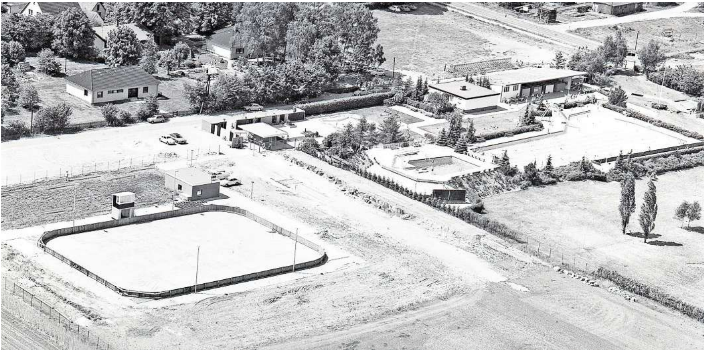
Die Anfänge: 1974 entstand eine Kunsteisbahn in Mellendorf - das neue Sportangebot führte 1975 zur Gründung des ESC Wedemark.

1994 begann die Ära von Jochen Haselbacher, was den Grundstein für sportliche Höhenflüge vor allem im Eishockey legte, aber auch die Fortsetzung der erfolgreichen Arbeit in den anderen ESC-Abteilungen bedeutete. Haselbacher musste je-