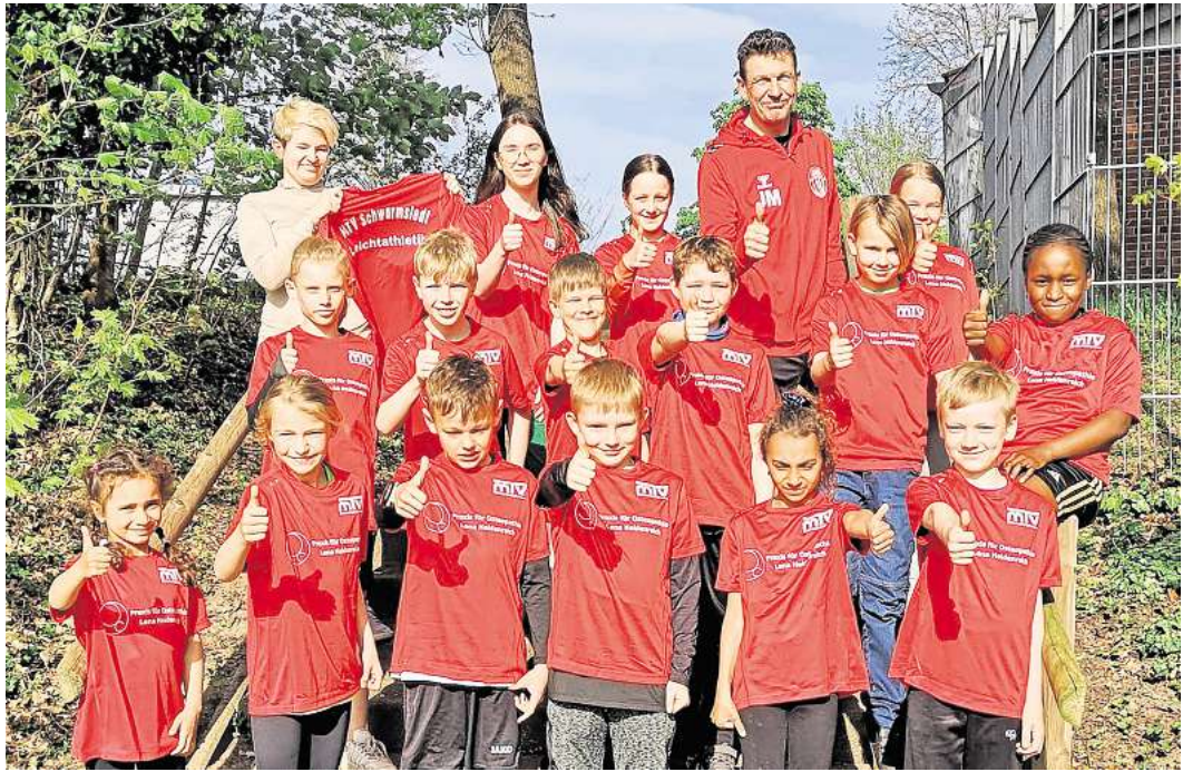
Das Team der Schwarmstedter Leichtathleten ist neu ausgestattet worden.

beschriftet werden. Die nächsten Meisterschaften stehen in den nächsten Wochen bereits im Terminkalender. Es werden aber weiterhin talentierte und leistungsbe-reite Kinder und Jugendliche ab zehn Jahren mit Spaß an der Leichtathletik gesucht. Bei Interesse bitte eine Nachricht an joerg.mertens@t-online.de senden.