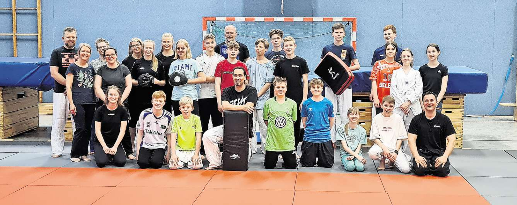
Die Teilnehmerinnen und Teilnehmer nahmen eine Menge aus den drei Trainingsstunden mit.

Spartenübergreifendes Judotraining des Mellendorfer TV