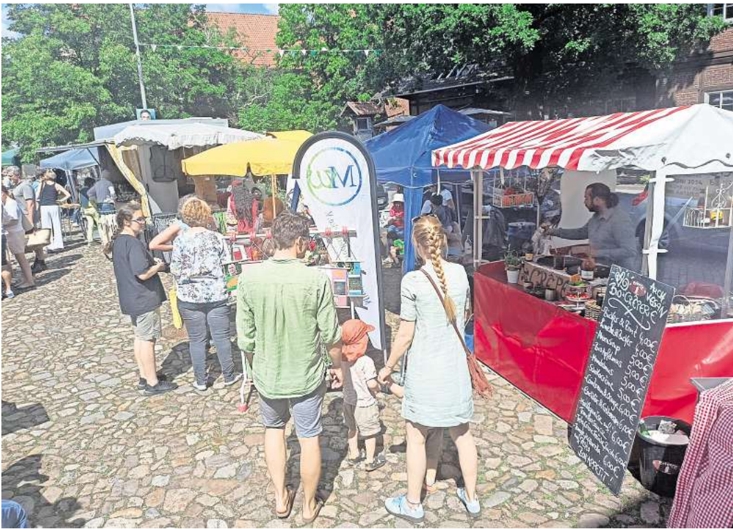
Rund 20 Ausstellerinnen und Aussteller werden am 11. Mai den Ökomarkt in Bissendorf besichtigen.

Für kulinarische Genüsse wird ebenso gesorgt wie für die Kinderbetreuung und Sitzgelegenheiten für die Besucherinnen und