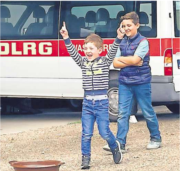
Die Kinder hatten viel Spaß an der Oster-Aktion.

Danach wurde noch bei feinstem Sonnenschein Eier-Laufen und Eier-Weitwurf gespielt, bevor die Kinder nach zwei Stunden wieder ihren Eltern übergeben wurden.