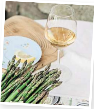
Weißwein ist ein Klassiker zur Begleitung von Spargel. Doch welcher eignet sich am besten?

Zu weißem Spargel harmonieren am besten frische, trockene Weißweine mit feiner Säure und zarter Fruchtigkeit. Ein Silvaner aus Franken oder Rheinhessen gilt als Klassiker zur Spargelzeit – dezent, mineralisch und mit einer eleganten Struktur, die den feinen Geschmack des Spargels unterstreicht, statt ihn zu überlagern. Ebenfalls hervorragend eignen sich Weißburgunder und Grauburgunder, die mit ihrer milden Art besonders gut zu sahnigen Saucen oder zartem Fisch passen. Für Liebhaber aromatischerer Weine empfiehlt sich ein Sauvignon Blanc, der mit grasigen Noten und lebendiger Frische besonders gut zu grünen Spargelvarianten oder modernen Spargelgerichten mit