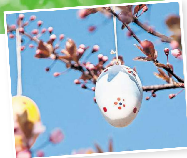
Hübsch bemalte Eier schmücken manchen Osterstraß.

dern am Ostersonntagabend an den Dorfrändern in den Himmel. Die Feuer sind nicht nur Boten des Frühjahrs und verkünden das Ende der Winterzeit, sondern heute sind sie meist die erste große Veranstaltung der Dorfgemeinschaften im Jahresverlauf unter freien Himmel. Das gesellige Zusammensein bei einem kühlen Bier und Spezialitäten vom Grill sind fester Bestandteil des Dorflebens geworden und locken die Menschen Jahr für Jahr aus ihren Häusern.