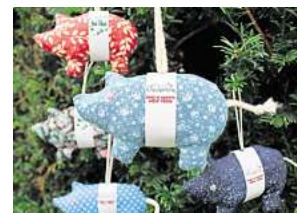
3. Platz: Laura Eicke (Hemmingen)