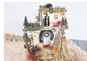
2. Platz: Maja Hüters (Hemmingen)