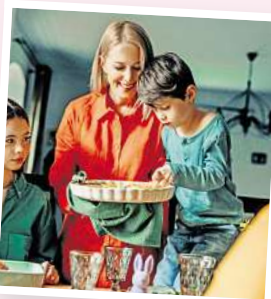
Für Kinder gehört das Backen süßer Leckereien zur Osterzeit mit dazu.

Für alle, die es zu Ostern etwas gesünder mögen, lassen sich klassische Rezepte problemlos abwandeln. Statt Weißmehl kann etwa Vollkornmehl oder eine Mischung aus verschiedenen Mehlsorten verwendet werden, um die Backwaren ballaststoffreicher zu gestalten. Zucker lässt sich durch natürliche Süßstoffe wie Honig oder Agavendicksaft ersetzen, sodass das Ostergebäck nicht nur gesund, sondern auch nährstoffreicher wird. (DJD)