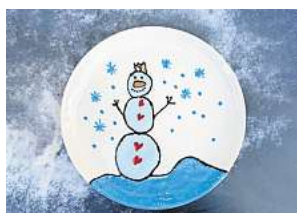
3. Platz: Irma Schlicker (Hannover)