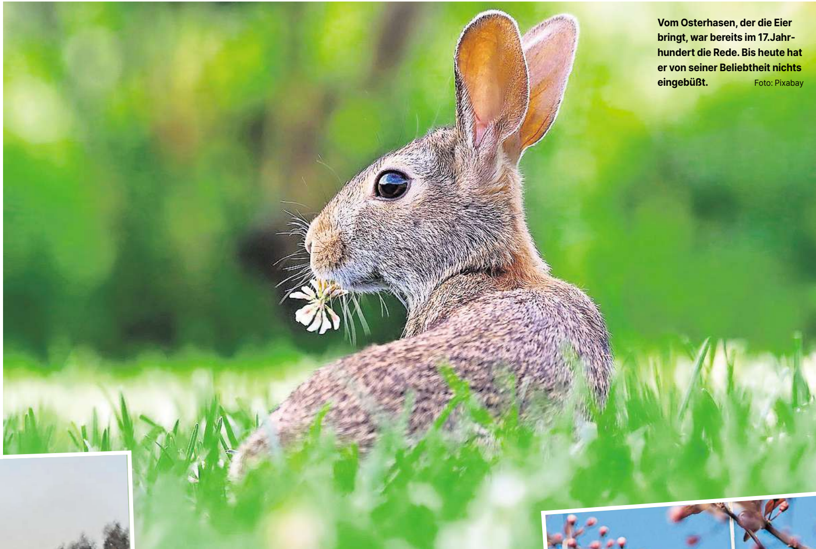
Vom Osterhasen, der die Eier bringt, war bereits im 17. Jahrhundert die Rede. Bis heute hat er von seiner Beliebtheit nichts eingebüßt.

In allen Farben leuchten die Ostereier aus echten Hühnereiern oder aus Schokolade gleichermaßen. Der Brauch, die Eier zu färben stammt bereits aus dem Mittelalter. Um die Symbolik des Eies als Fruchtbarkeitssymbol zu unterstreichen, wurden sie rot gefärbt. Die Farbe sollte das Blut Christi bei der Kreuzigung darstellen, erst sehr viel später kamen weitere, bunte Farben dazu. Und zum Osterfest gab es damals eine regelrechte Eierschwemme, denn mit Beginn der Fastenzeit wurde deren Verzehr kräftig reduziert oder sogar eingestellt. Die Hühner legten aber weiter ihre Eier und so wurden in