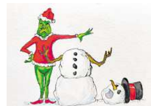
3. Platz: Ingo Stein (Wedemark)