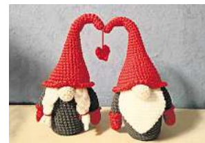
2. Platz: Katharina Meine (Uetze)