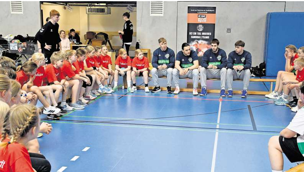
Die Recken stellten sich gern der Fragen der Schülerinnen und Schüler.