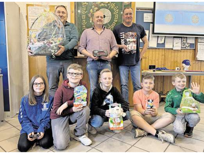
Sieger und Platzierte beim Osterschießen in Lindwedel

LINDWEDEL. Für vergangenen Sonntag hatte der Schützenverein Lindwedel zum Osterschießen ins Schützenhaus eingeladen. Zahlreiche Besucher folgten dieser Einladung, um ihr Können vor den Scheiben zu beweisen. Ziel ware es, einen der schönen Preise zu ergattern. Bei Kaffee und Kuchen und schönen Gesprächen wurde rege vom Angebot des Teilerschießens gebrauch gemacht.