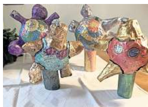
1. Platz: Romy Doecke (Hannover)