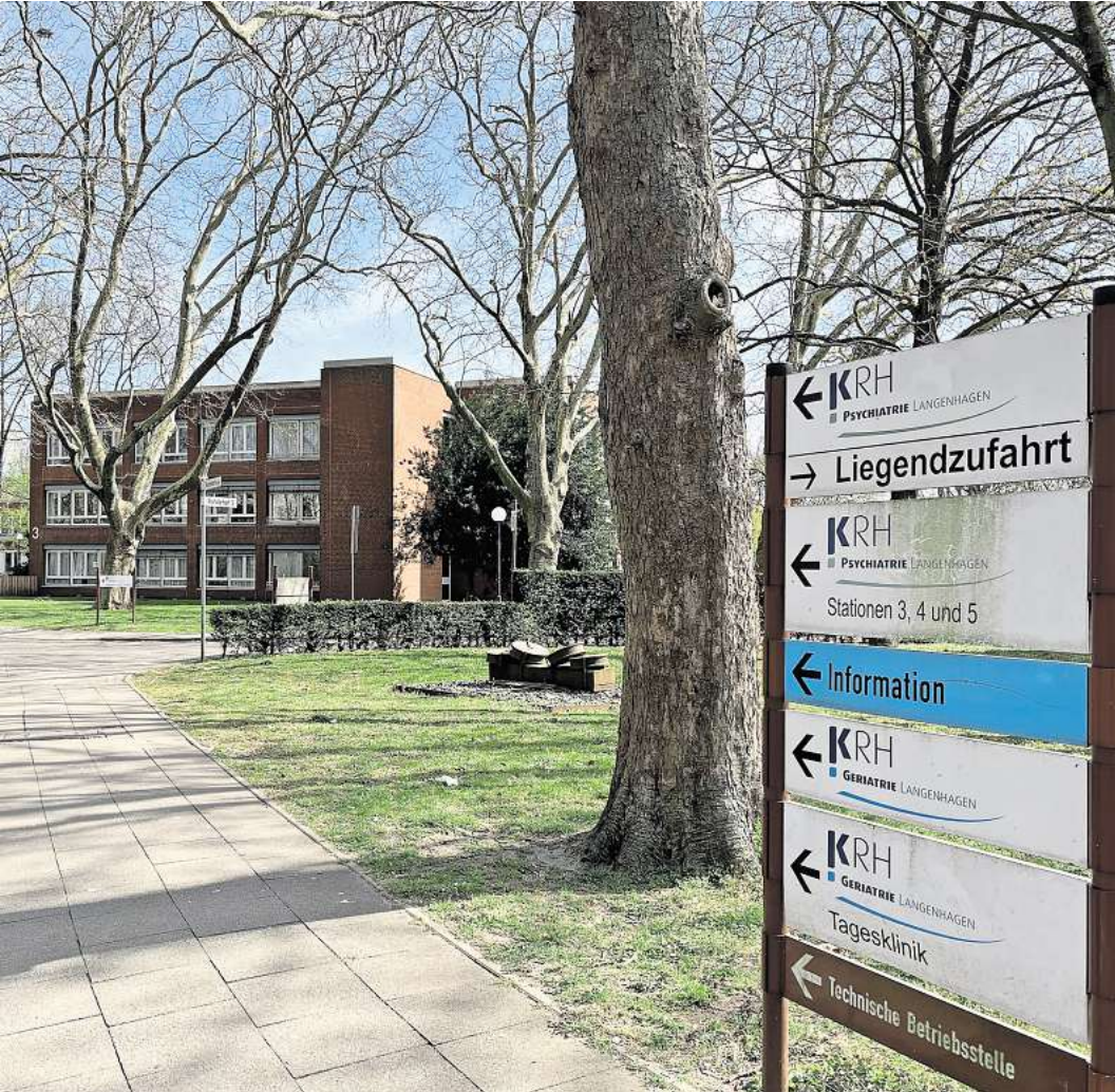
Abschied: Die Geriatric soll aus Langenhagen nach Hannover umziehen – die Räume wird die Psychiatric nutzen, was deren steigendem Bedarf an psychiatrischen Behandlung entgegenkommt.

Die „Medizinstrategie 2030“ sieht vor, dass die Geriatric des Klinikums Region Hannover aus Langenhagen nach Hannover umzieht. Doch anders als geplant wird nur ein Teilbereich weiterbetrieben.