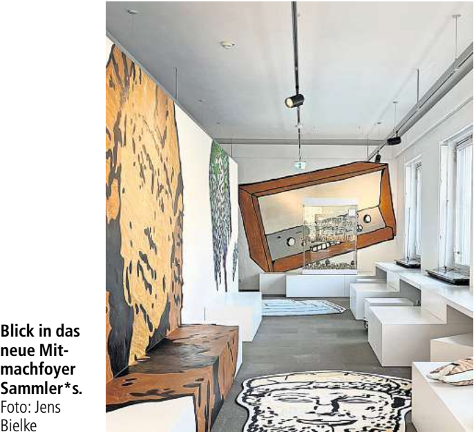
Blick in das neue Mitmachfoyer Sammler*s.

Viele weitere, spannende Neuigkeiten aus der lokalen Kulturszene finden Sie in der aktuellen Ausgabe unseres Partnermediums magaScene, monatlich frisch gedruckt und kostenlos an über 500 Ausgestellen in Hannover oder online auf www.magaScene.de inklusive Download-Möglichkeit.