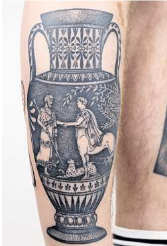
Antikes Motiv auf aktuellem Bein.

der Ausstellung finden am 25. April, 23. Mai, 27. Juni und 17. August im Museum Live-Sessions mit Timo Möhlenbrock statt. Anmeldung unter www.tmo-tattoos.com . Wer die Tattoo-Ausstellung besucht, sollte nach dem Einlass mal rechter Hand in das neue Mitmachfoyer Sammler*s schauen. Die dreimonatige Schließzeit des Museums - rund 150.000 Ausstellungsstücke mussten verpackt und in das neue Sammlungszentrum an der Vahrenwalder Straße transportiert werden - wurde genutzt, um diesen Bereich im Erdgeschoss umzugestalten. Das Sammler*s ist jetzt ein Raum für Begegnung, Unterhaltung, Information und Genuss. Hier können kleine und große Besucher, Spaziergänger und Gäste lesen, spielen, arbeiten, snacken oder plaudern - und das ohne Museumsticket. Gemeinsam mit dem Museumsteam wurde das Sammler*s von dem niederländischen Streetart-Kollektiv Kamp Seedorf und dem Gestaltungsbüro MAF Studio (Amsterdam) gestaltet. Die Zeichnungen von Kamp Seedorf zeigen Objekte aus der Museumssammlung. Als sogenannte Pasteups, Straßenkunst aus Papier und Kleister, sind sie großflächig auf Wände, Decken und Mobiliar aufgeklebt. Die Besucher sind eingeladen, das urba-