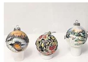
2. Platz: Rimma Schilmover (Laatzen)