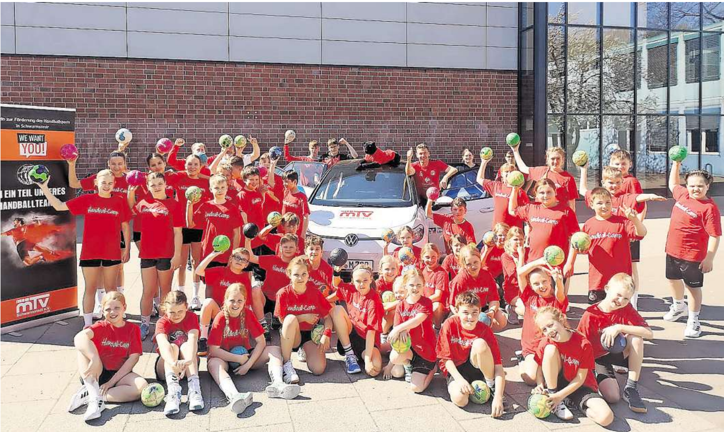
Große Begeisterung am ersten Tag des Osterferiencamps