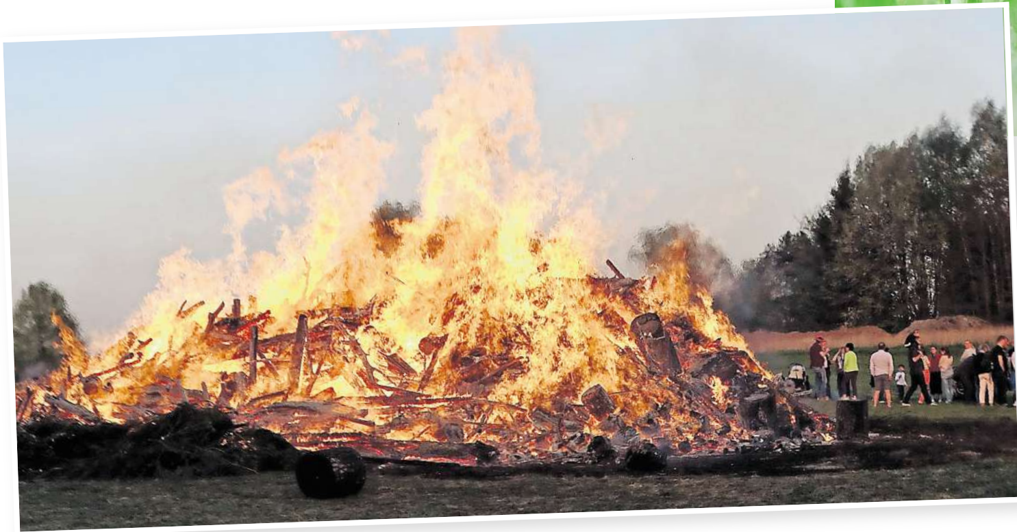
Bis heute sind die Osterfeuer beliebt, auch in der Wedemark lodern sie an den Ostertagen in fast allen Dörfern.