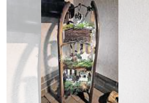
3. Platz: Maren Matusch (Wunstorf)