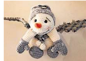
1. Platz: Bettina Tegmeier (Ronnenberg)