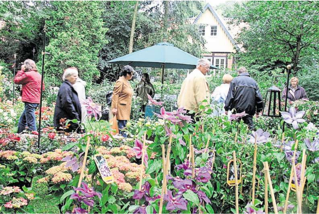
Die „Blumen & Ambiente“ findet Anfang Mai statt.

Eintrittskarten für das romantische Gartenfestival zu gewinnen