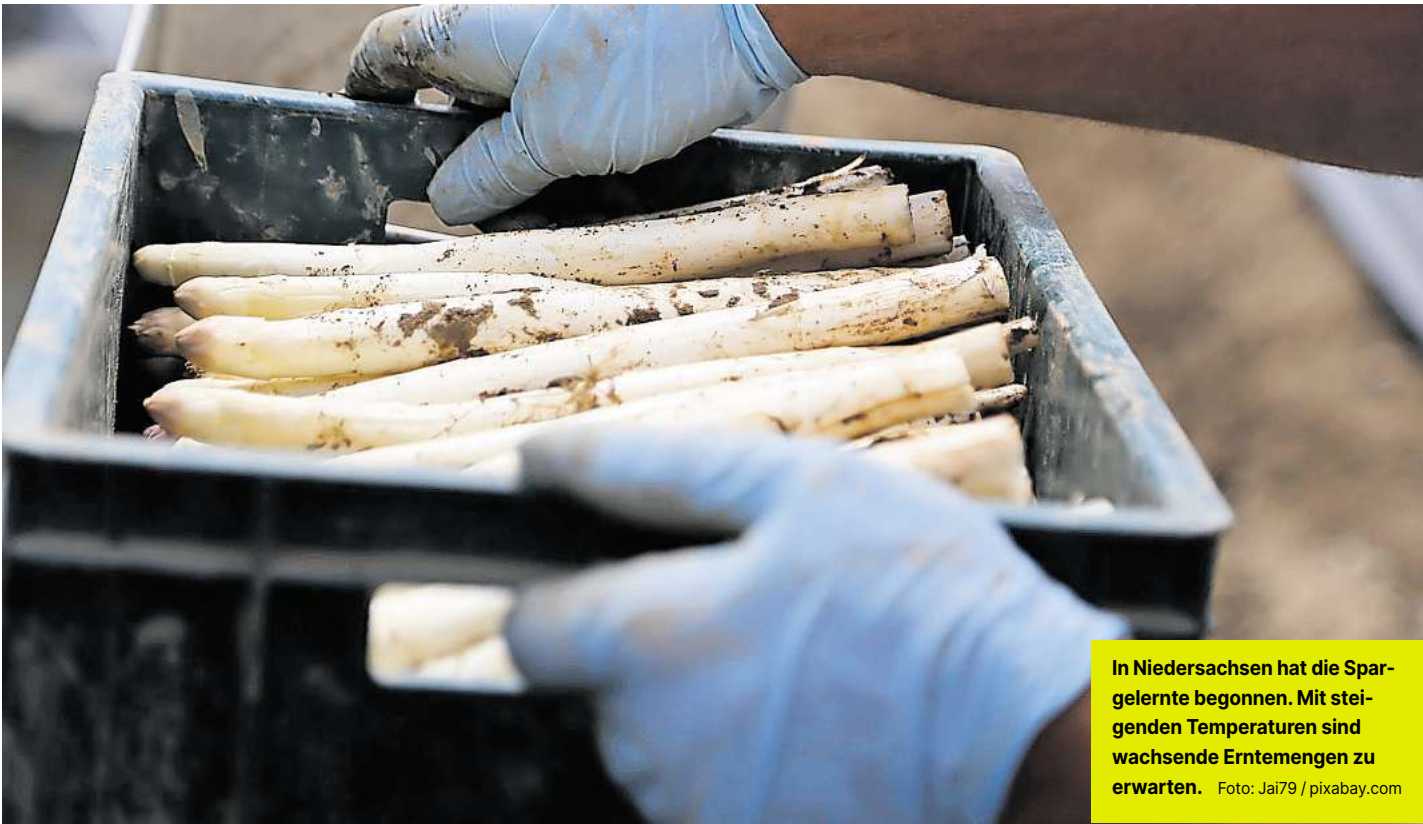
In Niedersachsen hat die Spargelernte begonnen. Mit steigenden Temperaturen sind wachsende Erntemengen zu erwarten.