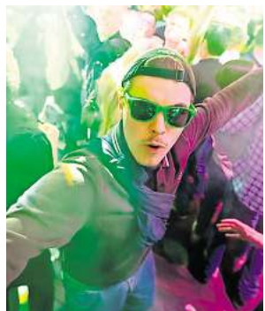
Gute Laune und gute Stimmung gehören für die Feiernden der Schlagerparty zusammen!

der Rubrik „Ticketboom“ reinschauen, teilnehmen – und mit etwas Glück live dabei sein, wenn Brelingen am Samstag, 26. April, wieder im Schlagerfieber bebt!