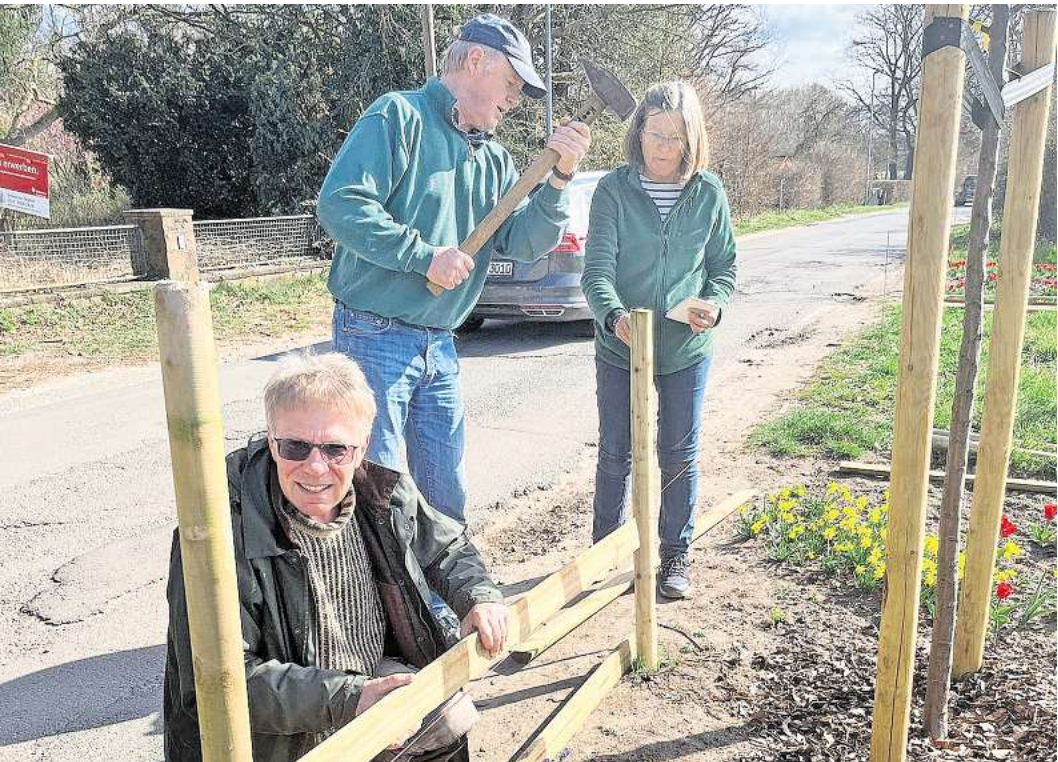
Viele helfende Hände packten bei der Pflanzaktion mit an.

Die Baumscheiben der bereits im Herbst gepflanzten Obstbäume leuchteten mittlerweile farbenfroh durch eine Vielzahl verschiedenster Zwiebelblüher – Narzissen, Tulpen und Blausternchen. Jetzt blüht es an den „Herbstbäumen“ und Osterdekoration schmückt die frisch gepflanzten „Frühjahrsbäume“. Der Wettergott verwöhnt uns seit Wochen mit viel Sonne, so dass wir allerdings langsam einen Frühjahrsregen herbeisehnen. Die vierte Pflanzaktion findet am 17. Mai statt.