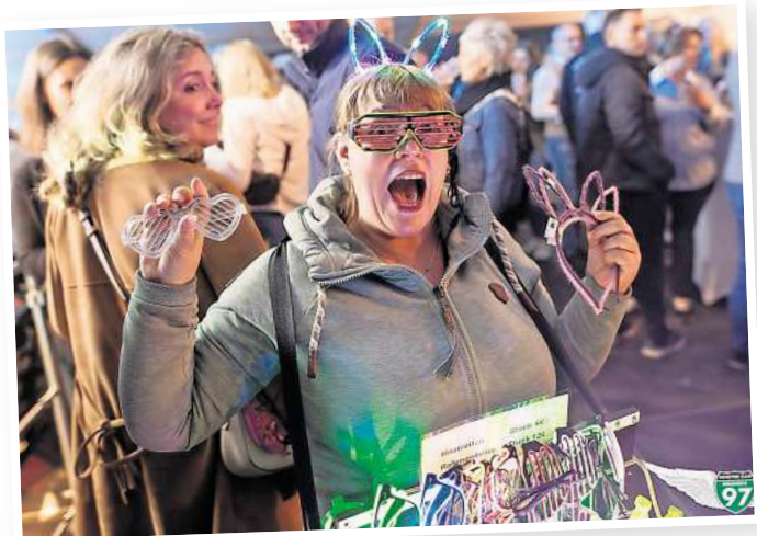
Wer möchte, kommt gleich in passendem Schlager. Outfit zur Party – oder ergänzt es einfach mit entsprechenden Angeboten vor Ort.