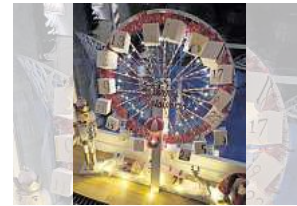
1. Platz: Janina Gundelach (Hannover)