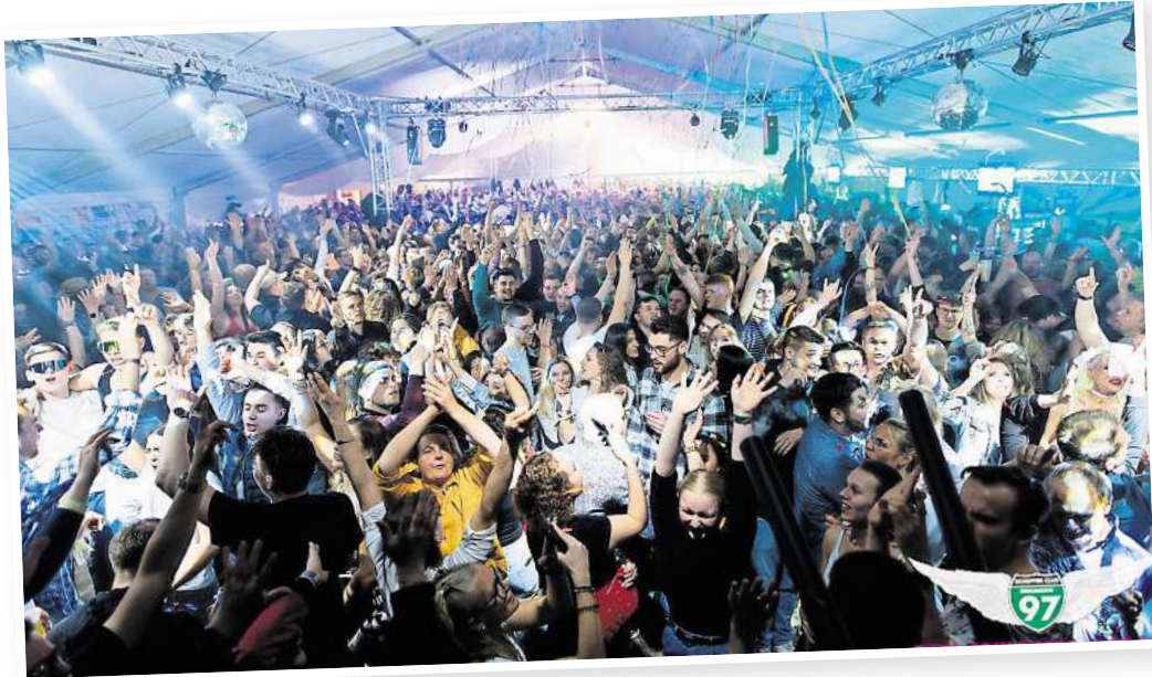
Alle auf einer Wellenlänge – das zeichnet die Partynacht in Brelingen seit mittlerweile 27 Jahren aus!

Veranstaltet wird das Event auch in diesem Jahr wieder von der erfahrenen KS Veranstaltungskonzepte GbR aus Schwarmstedt und dem Scheffer Club Brelingen. Ob Klassiker von Roland Kaiser, An-