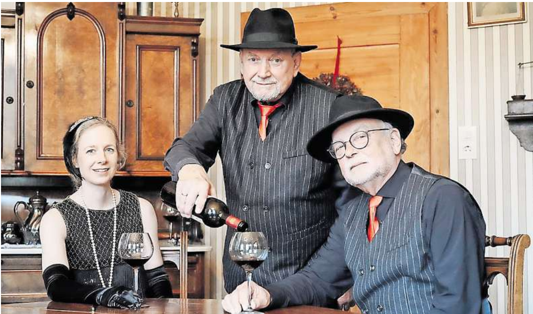
Das Soltauer Lesetheater gibt einen Einblick in Kurt Tucholskys Schaffen.

Das Publikum erfährt in diesem Programm etwas über den privaten Menschen Kurt Tucholsky, der ein Frauenversther per excellence und trotz zweifache Ehe kein Freund fester Bindungen war. Der Kritiker Tucholsky, der die verschiedenen