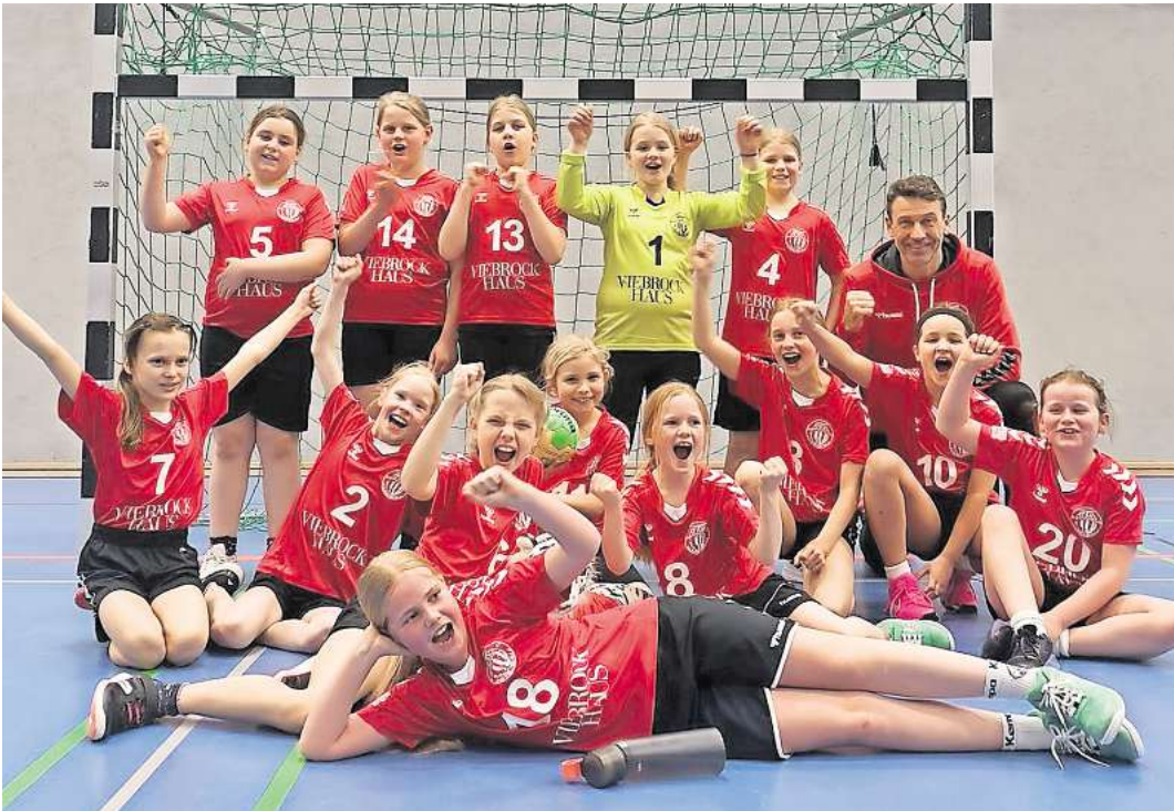
Die Mädchen des MTV Schwarmstedt siegten mit 14:11 gegen den TSV Wietzendorf.

stedt bis zu 18 Mädchen mit großer Begeisterung und haben gemeinsam viel Spaß. Noch zwei Spiele dann ist die lange Saison (Start Anfang September) zu Ende und es beginnt für alle ein neuer Abschnitt in der handballerischen Entwicklung. Der 2014er Jahrgang mit sieben Spielerinnen wird in der D-Jugend aufsteigen und der Rest muss die entstandenen Lücken schließen. In der Saison 2025/26 will der MTV dann sogar in der WJE und WJD reine weibliche Teams melden. Das bedeutet aber, dass noch ein paar handballbegeisterte Mädchen der Geburtsjahrgänge 2013-2016 benötigt werden. Wer Lust auf Handball hat, kommt einfach mal zum Probe- training in die Vierfeldsporthalle Schwarmstedt. Trainiert wird aktuell dienstags von 15.30 bis 17 Uhr und mittwochs von 17.15 bis 19 Uhr. Alle Interessierten sind herzlich willkommen.