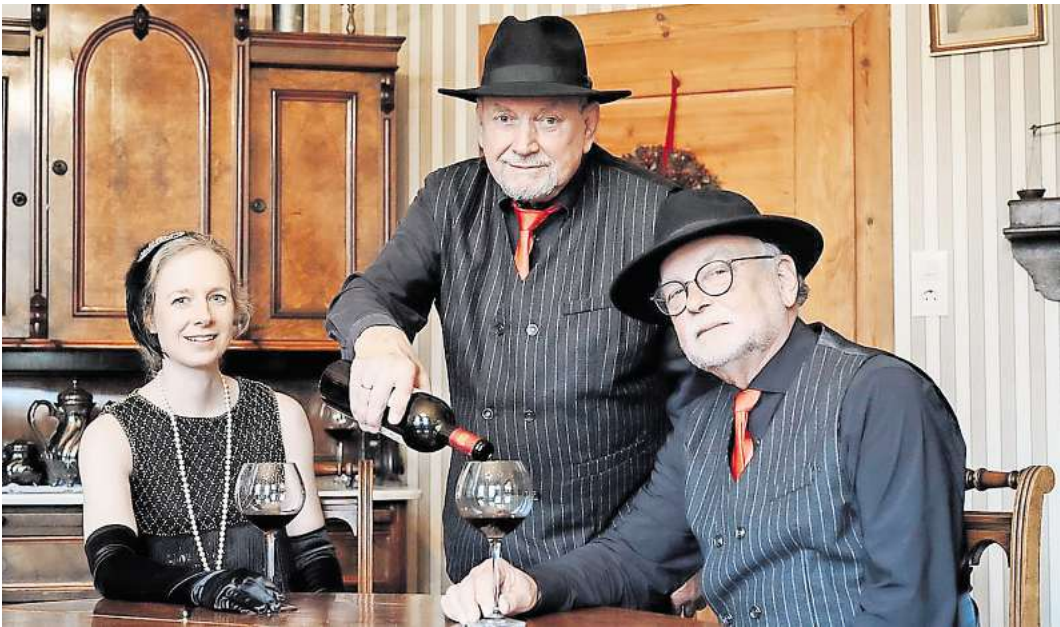
Das Soltauer Lesetheater gibt einen Einblick in Kurt Tucholskys Schaffen.

Das Publikum erfährt in diesem Programm etwas über den privaten Menschen Kurt Tucholsky, der ein Frauenversther per excellence und trotz zweifache Ehe kein Freund fester Bindungen war. Der Kritiker Tucholsky, der die verschiedenen