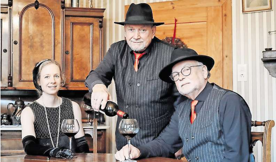
Das Soltauer Lesetheater gibt einen Einblick in Kurt Tucholskys Schaffen.

Das Publikum erfährt in diesem Programm etwas über den privaten Menschen Kurt Tucholsky, der ein Frauenversther per excellence und trotz zweifache Ehe kein Freund fester Bindungen war. Der Kritiker Tucholsky, der die verschiedenen