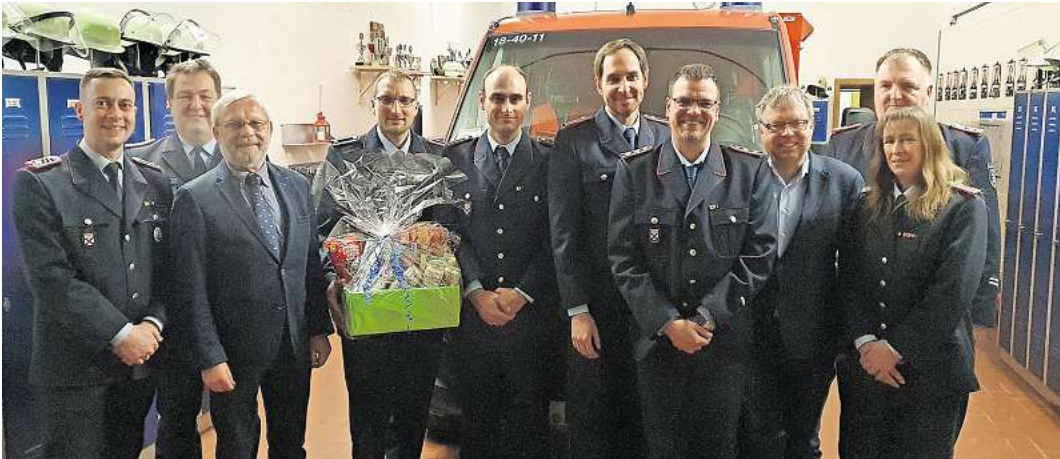
Die Ausgezeichneten der Freiwilligen Feuerwehr Suderbruch.