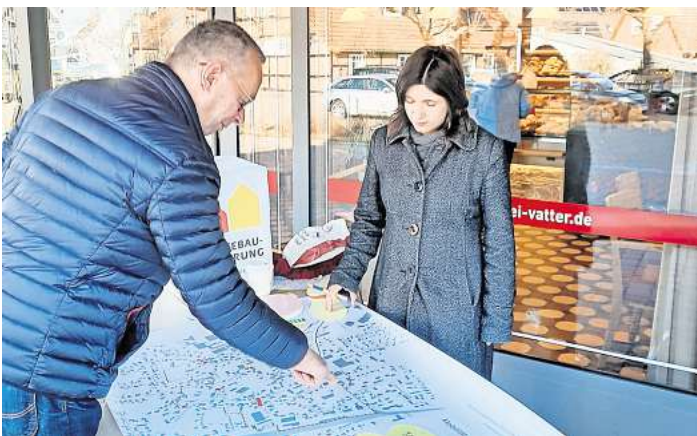
Bürgerinnen und Bürger wurden für das ISEK zur Entwicklung von Schwarmstedt befragt.

higende Maßnahmen und Lichtsignalanlagen. Kritisiert wurden hingegen Mängel in der Fahrradinfrastruktur und das Parken auf Gehwegen. Mehr Tempo-30-Zonen, eine bessere Regulierung der Hol- und Bringzonen vor der Grundschule sowie eine verstärkte Kontrolle des Parkens auf Gehwegen waren ganz oben auf der Wunschliste. Wohnen und Leben: Der Mangel an bezahlbaren und barrierefreien Wohnungen wurde als Problem hervorgehoben. Zudem fehlt ein klar erkennbares Ortszentrum. Vorschläge umfassen die Neugestaltung des Marktplatzes, die Aufwertung des Rathauses und die Modernisierung von Spielplätzen und Grünflächen. Zukunft und Entwicklung: Die Erhaltung historischer Gebäude und die Stärkung des Einzelhandels sind zentrale Anliegen. Kritisch gesehen wurden Leerstän-