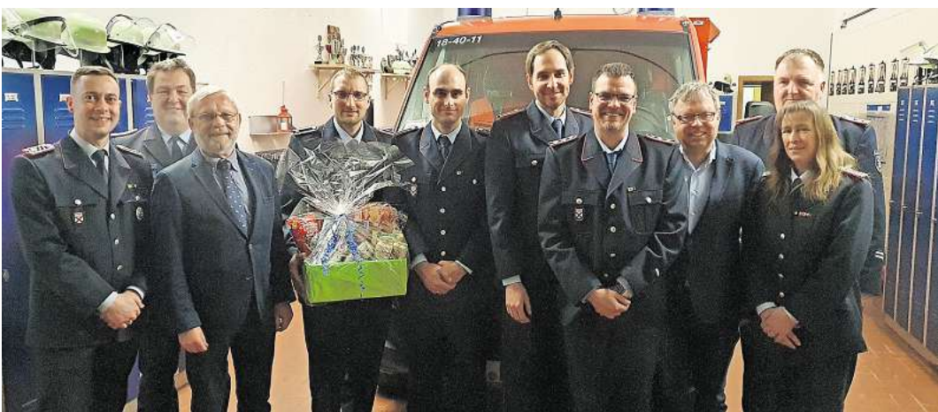
Die Ausgezeichneten der Freiwilligen Feuerwehr Suderbruch.