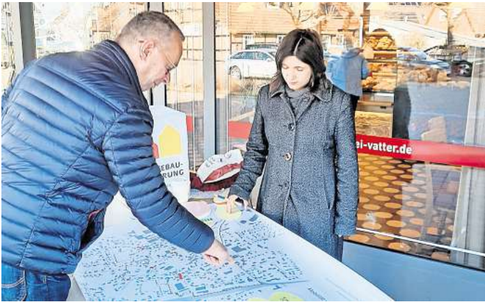
Bürgerinnen und Bürger wurden für das ISEK zur Entwicklung von Schwarmstedt befragt.

higende Maßnahmen und Lichtsignalanlagen. Kritisiert wurden hingegen Mängel in der Fahrradinfrastruktur und das Parken auf Gehwegen. Mehr Tempo-30-Zonen, eine bessere Regulierung der Hol- und Bringzonen vor der Grundschule sowie eine verstärkte Kontrolle des Parkens auf Gehwegen waren ganz oben auf der Wunschliste. Wohnen und Leben: Der Mangel an bezahlbaren und barrierefreien Wohnungen wurde als Problem hervorgehoben. Zudem fehlt ein klar erkennbares Ortszentrum. Vorschläge umfassen die Neugestaltung des Marktplatzes, die Aufwertung des Rathauses und die Modernisierung von Spielplätzen und Grünflächen. Zukunft und Entwicklung: Die Erhaltung historischer Gebäude und die Stärkung des Einzelhandels sind zentrale Anliegen. Kritisch gesehen wurden Leerstän-