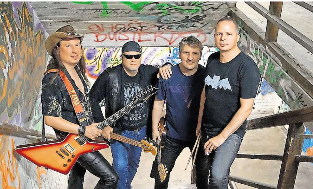
Hard'n Blue liefern erstklassige Classic Rock-Coverversionen. Absolut partytauglich!