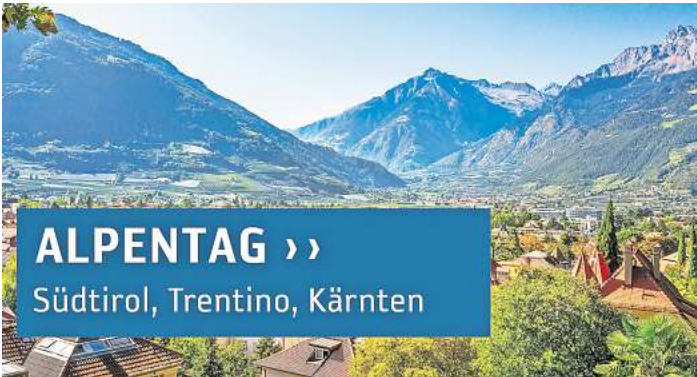
Wer träumt von der nächsten Reise in die Berge?

Traumurlaub zu planen und lassen Sie sich von Experten und Ausstellern beraten. Der Eintritt ist frei. Nähere Informationen zur Veranstaltung erhalten Interessierte unter www.hannover-airport.de/alpentag .