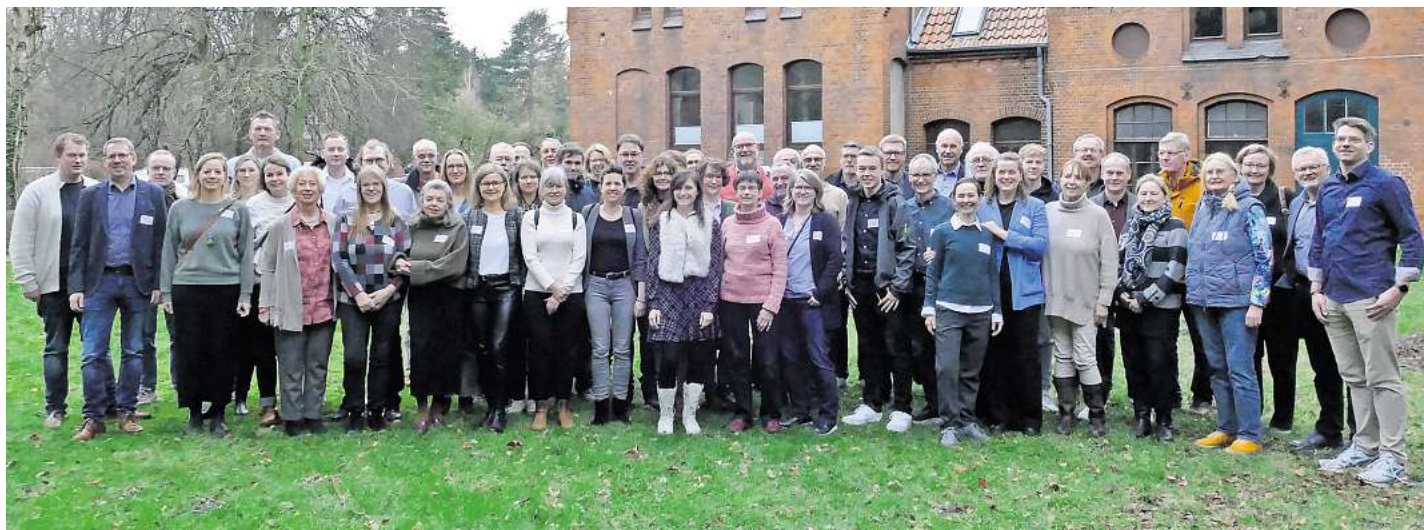
Als Klimapaten sind auch Schwarmstedter ausgebildet worden.

Am Sonnabend, 1. März, ab 20.30 Uhr öffnen sich die Saaltüren in Büchten. Eingeladen sind alle ab 16 Jahren.