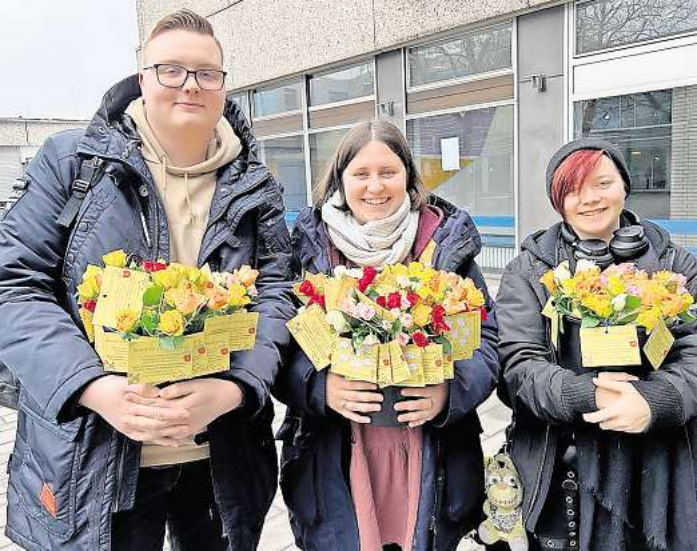
Die Schülerinnen und Schüler weisen auf die Wichtigkeit der Bundestagswahlen hin.