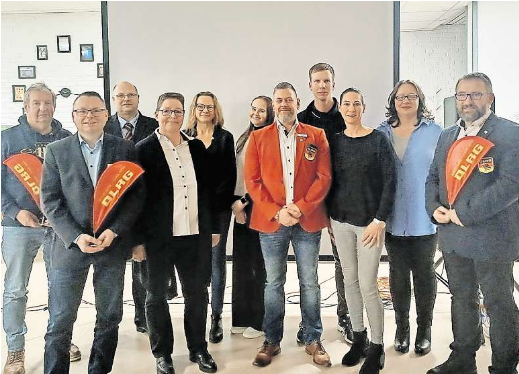
Der neu gewählte Vorstand der DLRG Wedemark.

Zu Gast waren auch Bürgermeister Helge Zychlinski und