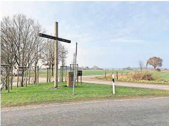
Das Grundstück, auf dem das neue Feuerwehrhaus gebaut werden soll, liegt nahe dem "Kreuz des deutschen Ostens"

MELLENDORF (GÖT). Der alte Standort in der Ortsmitte wird für die Feuerwehr Mellendorf auf die Dauer zu eng. Ein neues Gerätehaus soll her – aber wo soll es stehen? Nach langer Suche nach einem geeigneten Standort sind Verwaltung, Politik und Feuerwehr jetzt fündig geworden: Ein Brachgrundstück am westlichen Ortsrand soll es werden. Das Grundstück liegt nahe der Hermann-Löns-Straße und dem dortigen Neubaugebiet gegenüber – zwischen dem „Kreuz des deutschen Ostens“ und der Biogasanlage am Salhop. Ganz einfach sei die Grundstückssuche in dem beliebten und teilweise dicht besiedelten zentralen Orts- teil nicht gewesen, berichtet Je-an-Pascale Schramke (SPD), der Vorsitzende des Feuerschutz-Ausschusses. Bei der Jahresdienstversam- lung seiner Feuerwehr wies Orts- brandmeister Cord Hanebuth vor allem auf die Vorteile des Stand- orts hin. Allem voran gibt es dort reichlich Platz für ein neues Ge- rätehaus und zugehörige Alarm-