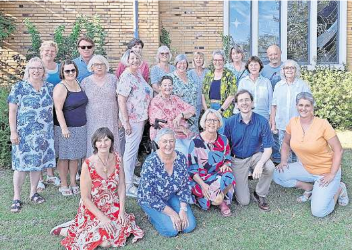
Der Chor "Voices of Joy" ist auch mit von der Partie.