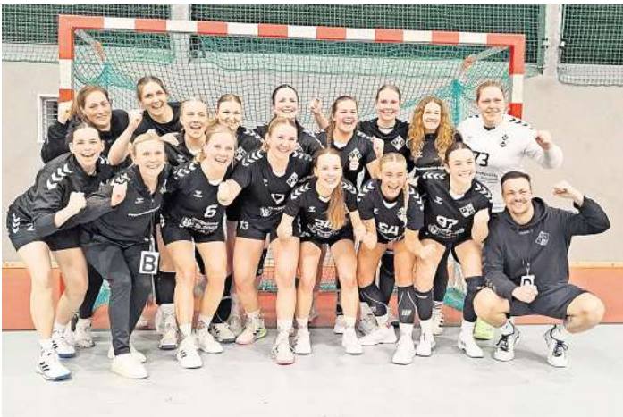
Ausgelassener Jubel nach dem starken und siegreichen Spiel.

Peiner Trainergespann sah sich gezwungen, seine erste Auszeit zu nehmen. Doch die Mellendorferinnen blieben auch danach konzentriert und gingen mit einem 14:10 in die Pause. Nach der Halbzeit kamen die MTV-Damen motiviert aus der Kabine. Durch eine starke Abwehrarbeit, gute Paraden der Torhüterin und ein schnelles Angriffsspiel bauten die Mellendorferinnen ihren Vorsprung auf sieben Tore zum 19:12 aus. Doch dann sahen die Zuschauer einen Bruch im bis dahin guten MTV-Spiel. Unnötige Ballverluste und technische Fehler häuften sich und die Abwehr bekam gegen den jetzt starken Peiner Angriff keinen Zugriff mehr. Peine kam Tor um Tor heran. Beim Stand von 19:16 nahm