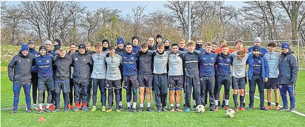
Die Kicker von Eintracht Leinetal bereiteten sich intensiv vor.

Einheiten auf dem Programm. Den Auftakt bildete ein Turnier am Freitagabend, gefolgt von der traditionellen Laufrunde am Sonnabendmorgen. Nach Frühstück und Training gab es Mittag- essen, bevor eine weitere Einheit folgte. Anschließend stand das Abschlusspiel der 1. Herren gegen die U18 an. Der Abend klang mit einem Table Quiz und Teambuilding aus.