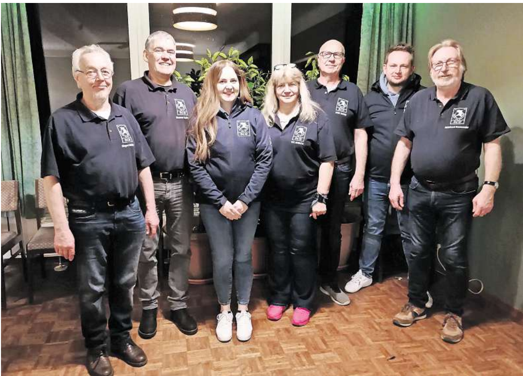
Der Vorstand des ACW.