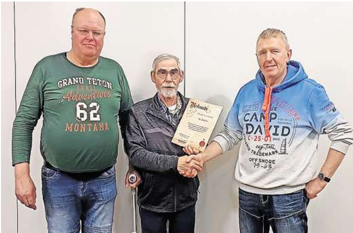
Die Guttempler begleiten Alkohol-, Drogen- und Medikamentenabhängige.