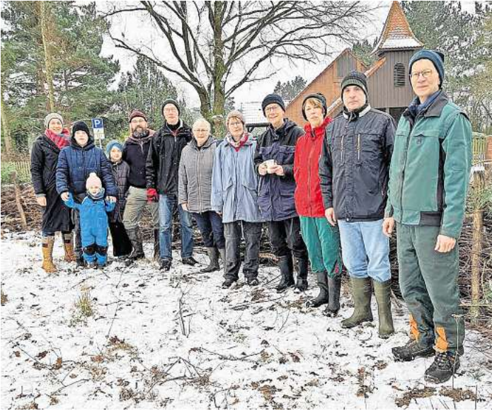
Zahlreiche engagierte Bürgerinnen und Bürger hatten sich zur Aktion eingefunden.

Das locker gelagerte Totholz bietet Lebensraum für zahlreiche Lebewesen, darunter Vögel, Insekten, Kleinsäuger und Reptilien. Die Tiere finden in der Hecke Schutz und Nahrung. Zudem ermöglicht der Samenanflug auf dem sich langsam zersetzenden Totholz die Ansiedlung neuer Pflanzen, die die Hecke weiter stabilisieren und zur Artenvielfalt beitragen.