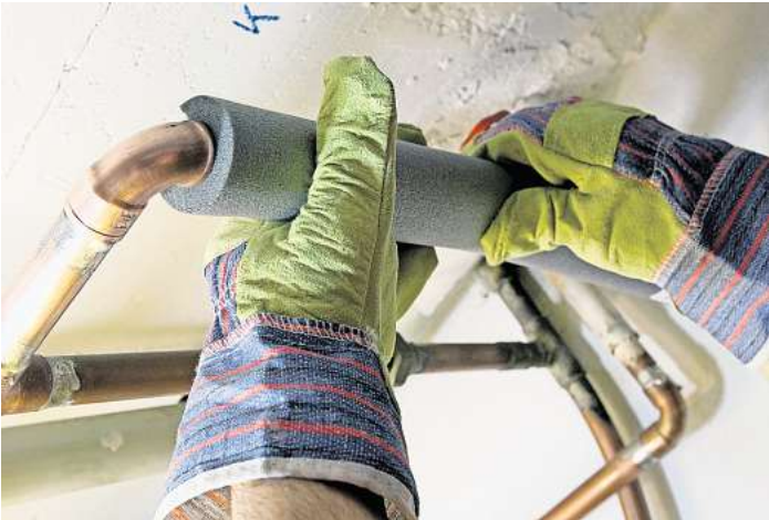
Die Rohrisolierung kann den Energieverbrauch der Heizung deutlich reduzieren.

Zugluft an den Türfugen lässt sich mit Dichtungen aus Gummi