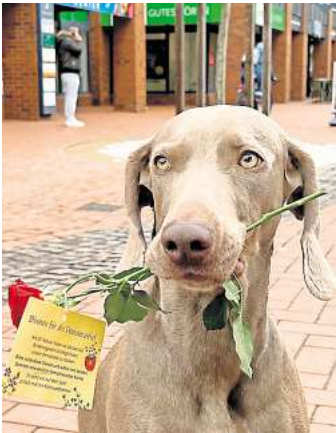
Auch die Hunde werben eifrig.