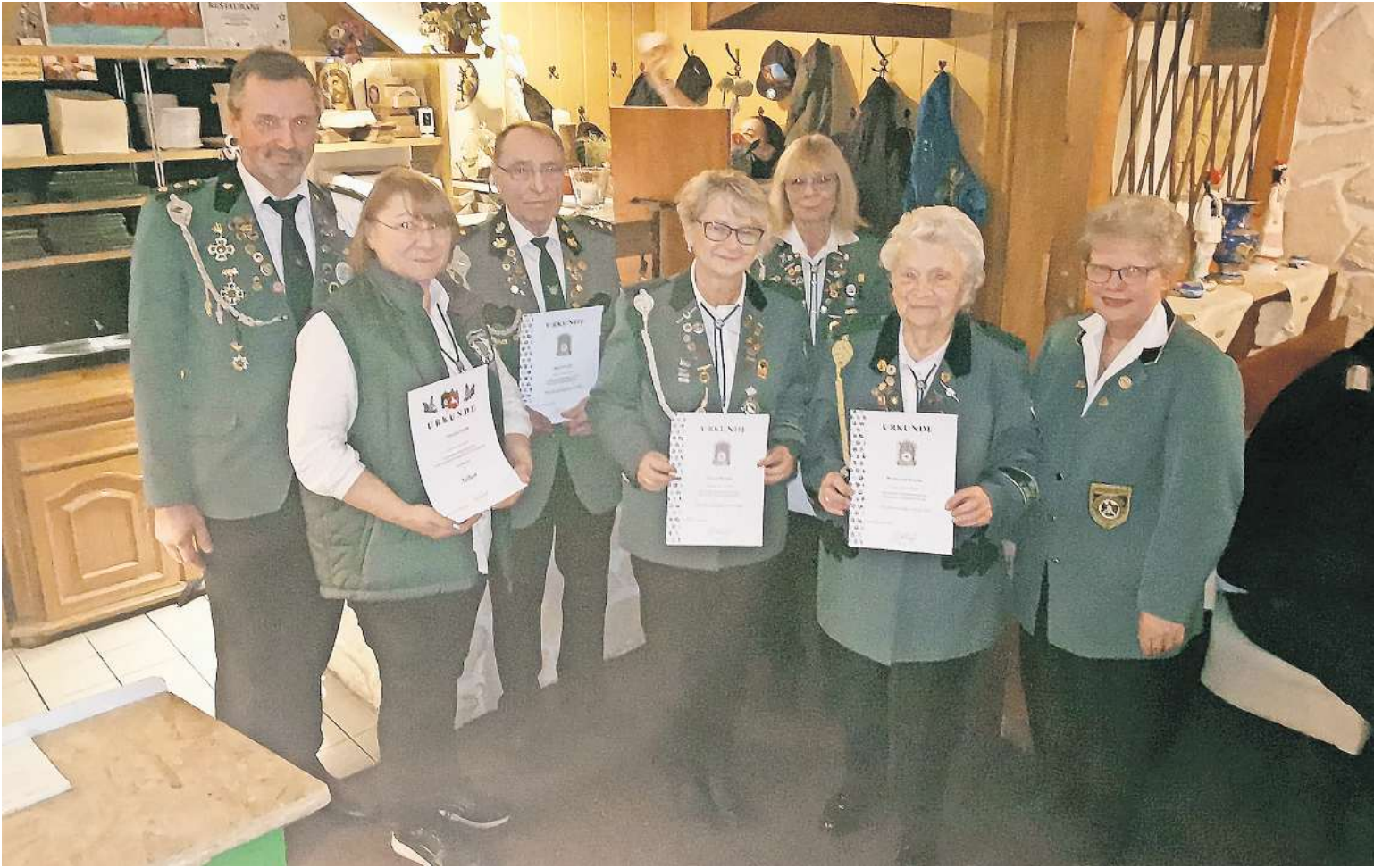
Der Schützenverein Resse ehrte auf seiner Jahreshauptversammlung langjährige Mitglieder.