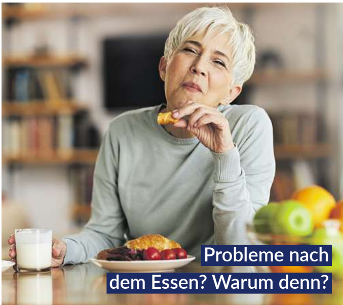
Probleme nach dem Essen? Warum denn?

Tropfen mit ihrer einzigartigen Kombination aus beruhigenden und bitterstoffhaltigen Heilpflanzen sorgen für schnelle Linderung. Direkt nach dem Essen eingenommen, aktivieren Bitterstoffe, z.B. enthalten in Wermut-, Benediktenkraut und Angelikawurzel, die Verdauungssäfte. 1,2 Krampflösendes Gänsefingerkraut, zusammen mit Süßholzwurzel und Kamillenblüten, entspannt den gesamten Magen-Darm-Trakt.