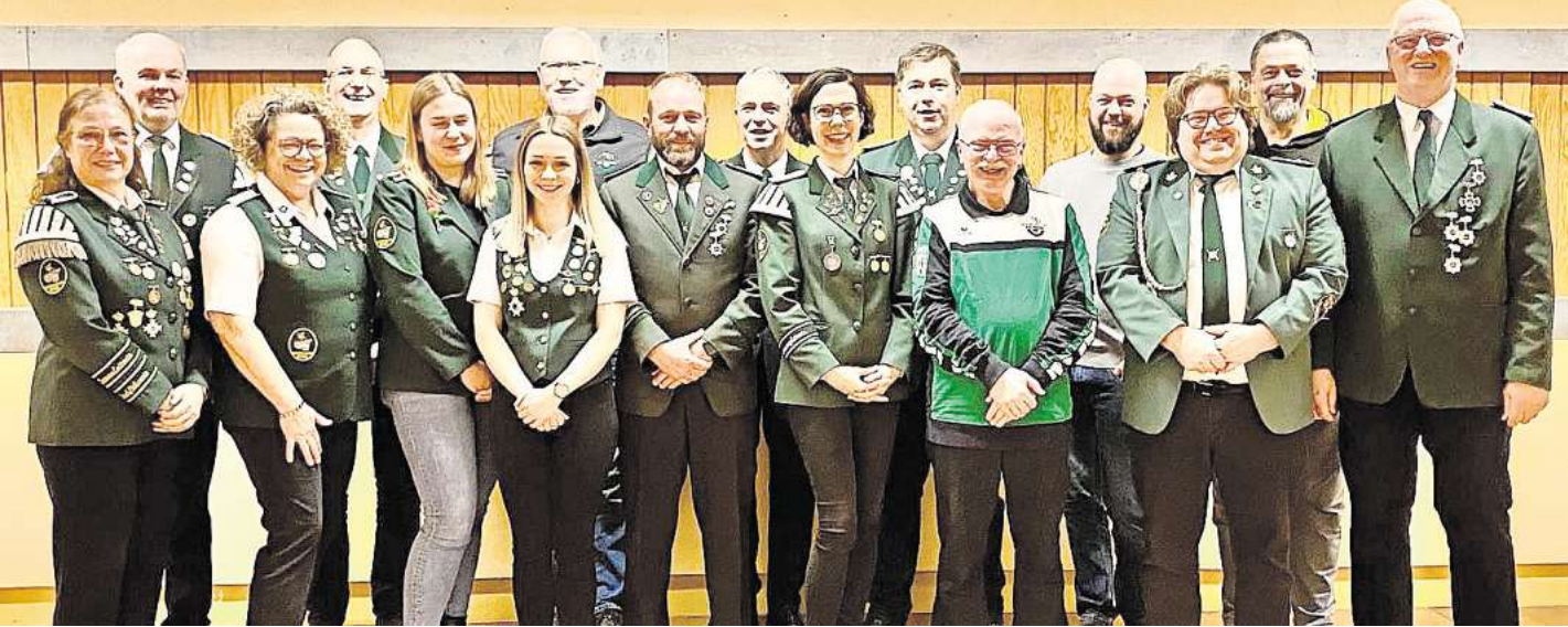
Der Gesamtvorstand des Schützenvereins Essel.

Das diesjährige Schützenfest findet am 7. und 8. Juni statt