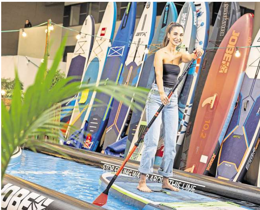
Standup-Paddeling ist auch 2025 einer der Trends beim Wassersport.

Die Themenwelt Reisen & Urlaub der ABF steht 2025 ganz im Zeichen Kanadas. Gemeinsam mit den Urlaubs-Profis von „America Unlimited“ präsentiert sich das Land in Halle 19 in seiner vollen Schönheit. Unter anderem stellen sich die Regionen Yukon, Manitoba, Saskatchewan, Nova Scotia und Ontario vor, außerdem kann man sich über unvergessliche Reiseerlebnisse mit dem Rocky Mountaineer und Air Canada informieren. Aber auch andere Urlaubsziele lassen sich auf der ABF direkt vor Ort buchen. Zum Beispiel auf der Fläche der „Nordischen Länder“. Hier erfährt man Wissenswertes über Skandinavien und das Baltikum. Nicht vergessen: Die Sonderfläche „Harz erleben“, mit VR-Abenteuer-