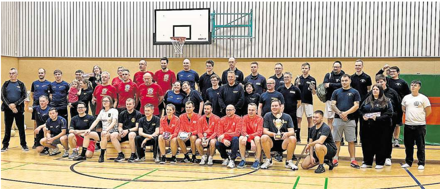
Sechs Teams nahmen am Volleyballturnier der Feuerwehren teil.

fairen Wettkampf miteinander gespielt und am Ende auch miteinander gefeiert. Ausrichter der gelungenen Veranstaltung war die Feuerwehr Bothmer. 2026 wird die Feuerwehr Schwarmstedt das Turnier ausrichten.