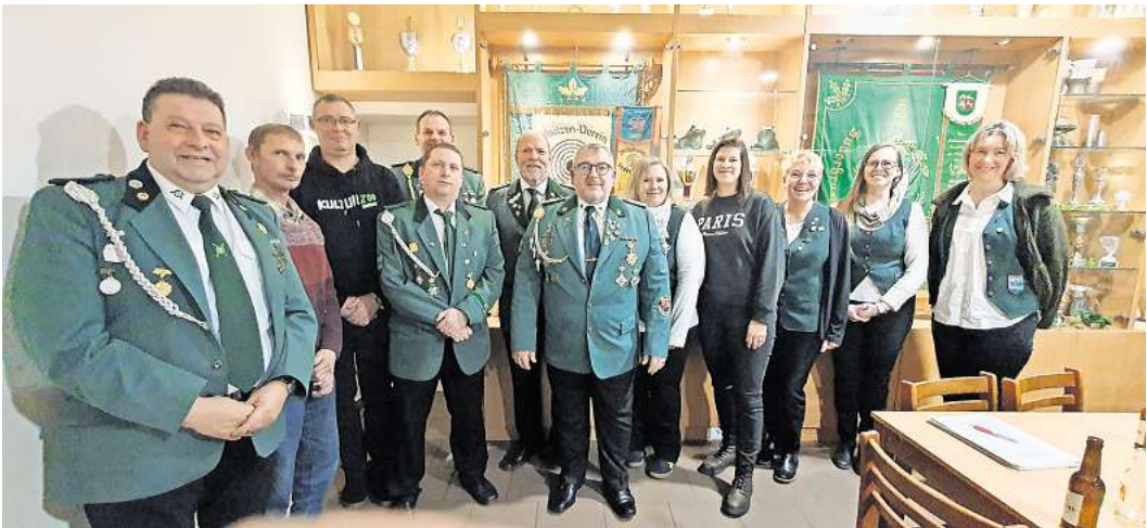
Der Vorstand des Schützenverein Suderbruch mit den neu gewählten Mitgliedern.