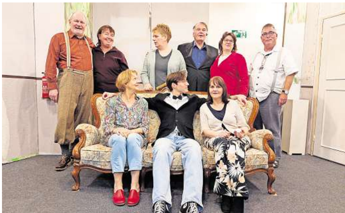
Schwarmstedter PROVINZBÜHNE präsentiert am 14. Februar ihr neues Stück „Alle lieben Waldemar“.

Weitere Aufführungstermine und alle Informationen dazu gibt es unter www.schwarmstedt-provinzbuehne.com