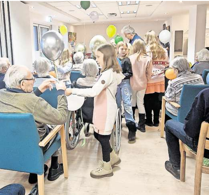
Viel Beifall gab es von den Gästen der Tagespflege Schwarmstedt für die singenden Kinder der Grundschule Schwarmstedt.