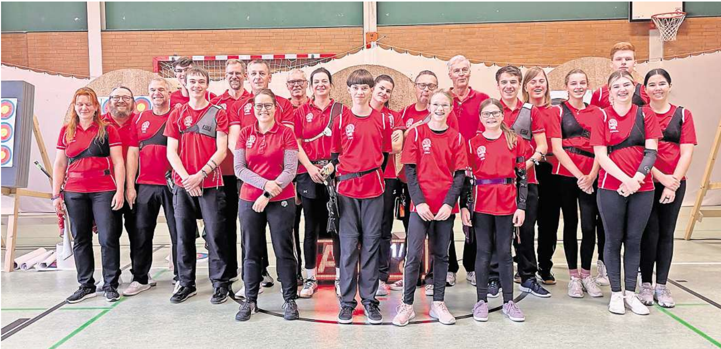
Das erfolgreiche Team der Scherenbosteler Bogenschützen.