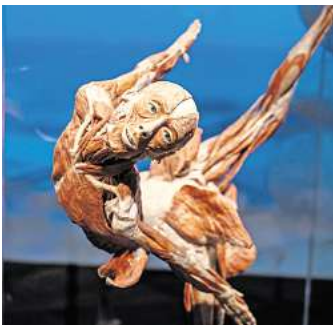
Auf Augenhöhe: Die Ausstellung „Körperwelten“ zeigt detailliert die Anatomie des menschlichen Körpers.