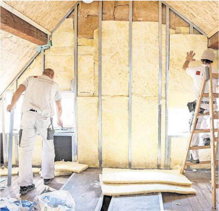
Eine neue Dämmung kann in älteren Immobilien den Wärmeverlust reduzieren und langfristig Energiekosten senken.

Um Förderungen zu erhalten, ist zudem wichtig, den Antrag frühzeitig stellen – und zwar bevor man