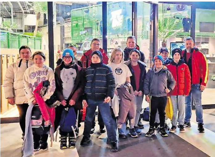
Bei der DLRG-Weihnachtsfeier ging es hoch hinaus.

Hoch hinaus: Am Freitag, 13. Dezember hat sich das DLRG-Jugendeinsatzteam (JET) der DLRG Wedemark einem anderen Element gewidmet, als üblicherweise dem Wasser.