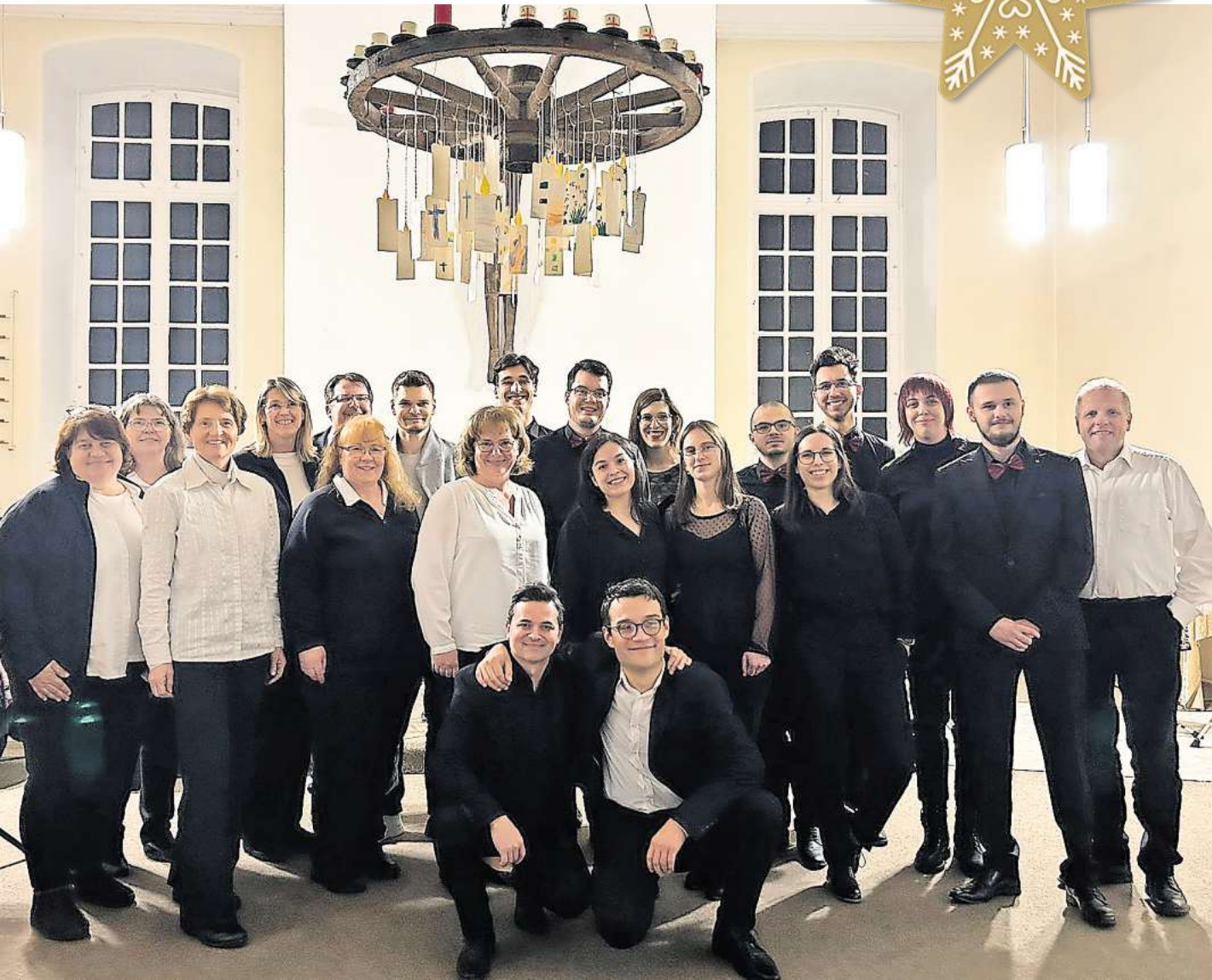
Die Musikerinnen und Musiker aus Kroatien legten Leidenschaft und Emotion an den Tag.

Akademisches Akkordeonorchesters „Ivan Goran Kovacic“ trat in Bissendorf auf