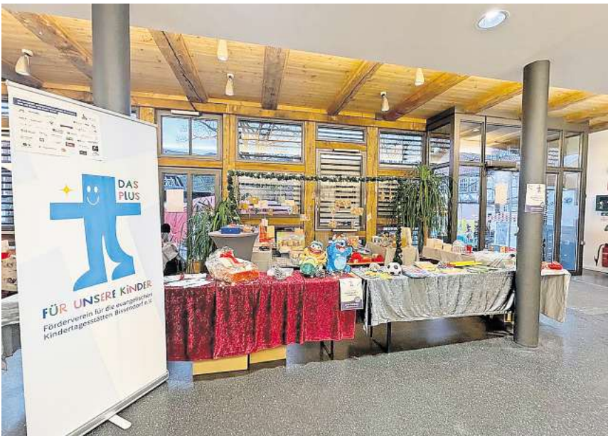
Die Lose waren am Sonnabend schon ausverkauft.

Die Gewinne der Tombola konnten sich wahrlich sehen lassen. Zu den attraktiven Preisen zählten u.a. Gutscheine und Sachpreise von verschiedenen Unternehmen aus der Wedemark und darüber hinaus, die großzügig unterstützt haben.