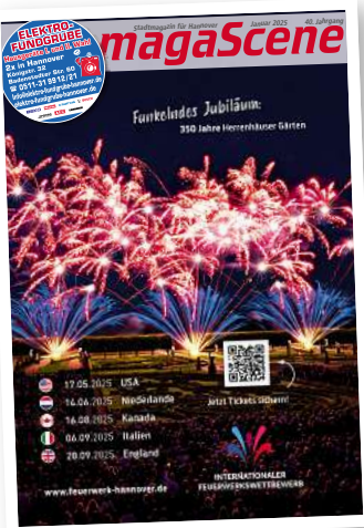
Stadtmagazin für Hannover magaScene

duktion und Vertrieb GmbH, kurz SPV, gegründet. Zu der Zeit war der Hardrock- und Metal-Bereich sehr stark vertreten, er hat es geschafft, viele große Labels aus diesem Bereich für einen Vertrieb über SPV zu gewinnen. Das waren Labels wie Noise, Roadrunner, Metal Blade oder Music for Nations. Sag ein Metal-Label aus dieser Zeit und ich bin sicher, die waren auch bei SPV im Vertrieb. Neben Rock und Metal gab es natürlich noch viele