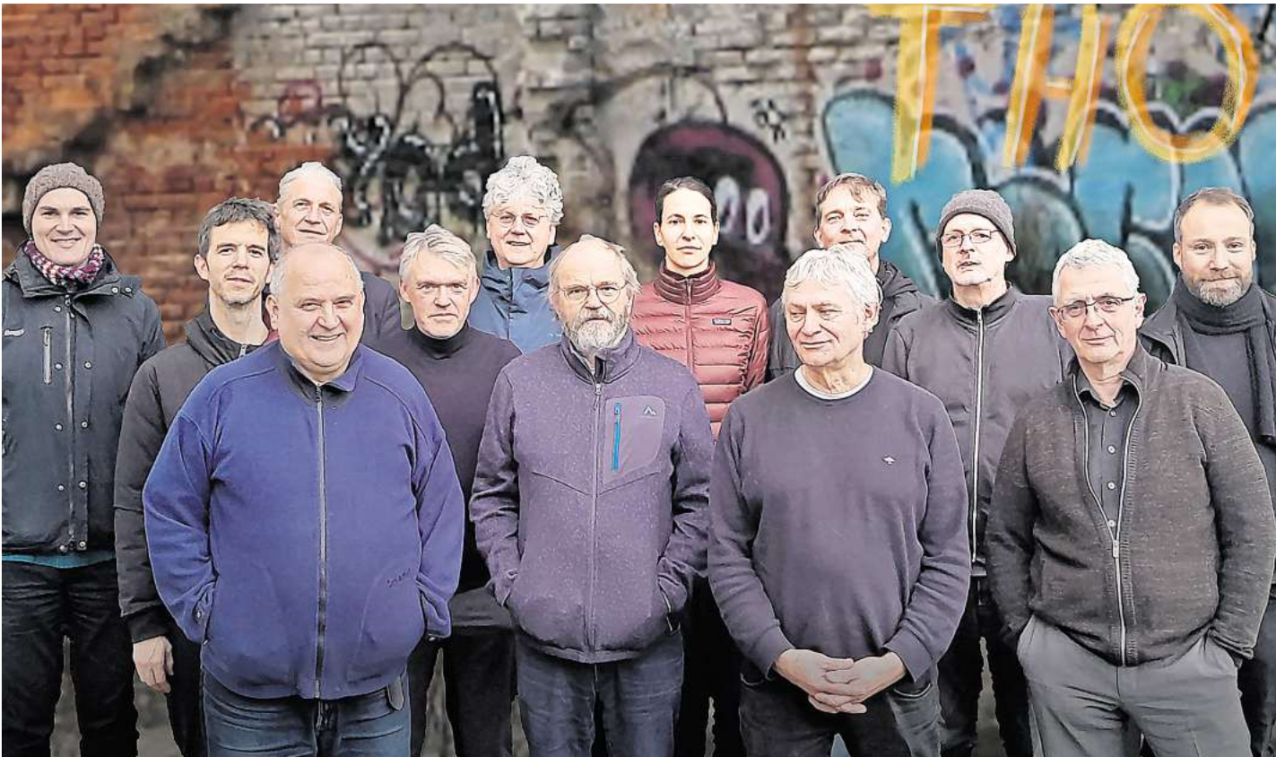
Macht den Auftakt: das Tonhallenorchester Brelingen.

Vier Konzerte zwischen 18. Januar und 15. März