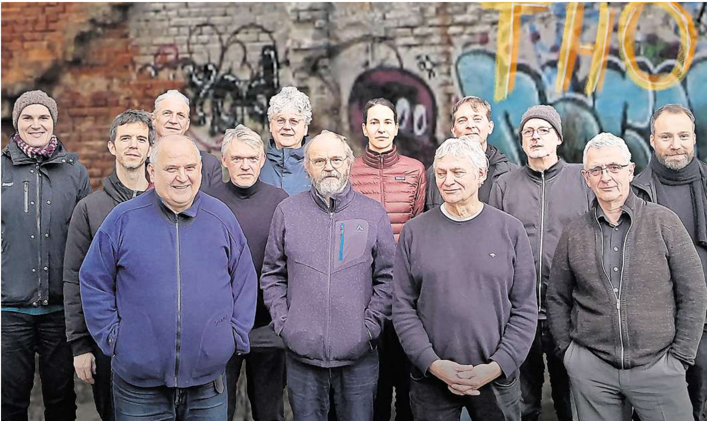
Macht den Auftakt: das Tonhallenorchester Brelingen.

Vier Konzerte zwischen 18. Januar und 15. März