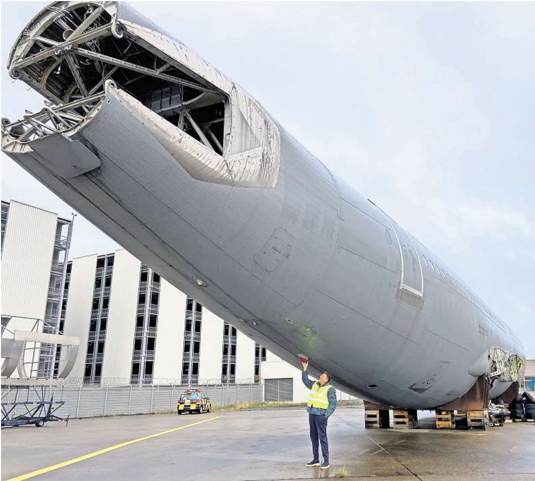
Wie ein großes Zäpfchen: Die Lagerung des Airbus-Rumpfes auf dem Flughafen Hannover kostet den Serengeti-Park jeden Monat 2900 Euro Miete - plus Kosten für regelmäßige Inspektionen.

Da Straßenbäume aber nur bis 4,50 Meter astfrei sind – das sogenannte Lichttraumprofil – wäre der Rumpf auch bei Janssens Methode eigentlich immer noch 30