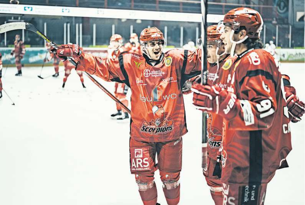
Holten am Wochenende die optimale Punktzahl: die Eishockeycracks der Hannover Scorpions.

Am Sonnabend, 28. Dezember, um 20 Uhr findet das nächste Heimspiel der Hannover Scorpions gegen die Herner Miners in der ARS Arena statt. Der „Klassiker“ gegen die Miners wird zwischen den Feiertagen sicherlich auch gut besucht sein. Der Vorverkauf läuft auf Hochtouren und der VIP-Bereich ist bereits ausverkauft.