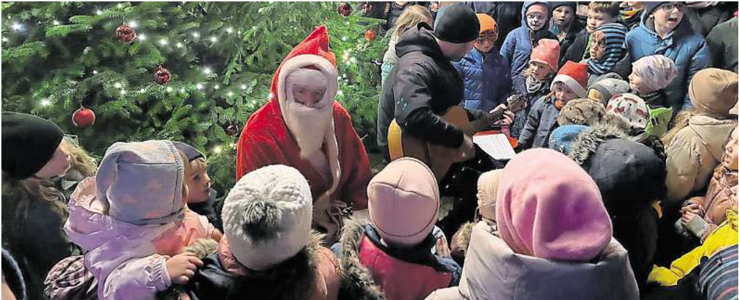
Der Weihnachtsmann vor dem geschmückten Baum beim Verteilen der Geschenke.

tafel wurde vom Schützenverein Hope betreut – ebenso wie das Kinderschminken. Mit den beleuchteten Buden, der Weihnachtsmusik und dem festlich geschmückten Weihnachtsbaum kam Adventsstimmung auf. Richtig besinnlich wurde es dann mit dem Besuch des Weihnachtsmanns um 18 Uhr. Die Besucher standen dicht gedrängt, als zunächst gemeinsam Weihnachtslieder gesungen wurden, und im Anschluss der Weihnachtsmann kleine Geschenke an die Kinder verteilte.