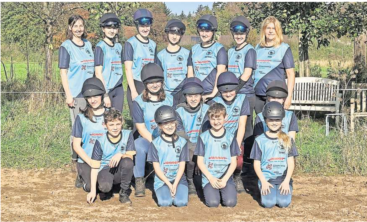
Ein erfolgreiches Team.

Die zweite große Leidenschaft der Hobbits sind die Mounted Games, gerittene Staffelspiele, die für jede Menge Spannung stehen und die seit 19 Jahren bei den Bissendorfer Hobbits des Turnclubs Bissendorf betrieben werden. Im Galopp werden Staffelstäbe, Flaschen, Bälle oder Fahnen übergeben. Zudem müssen vom Pony Bälle aus Wassereimern gefischt werden, es wird im Galopp auf- und abgesprungen, um zum Beispiel Werkzeuge aufzuheben. Die Aktiven brauchen neben den reiterlichen Fähigkeiten auch eine