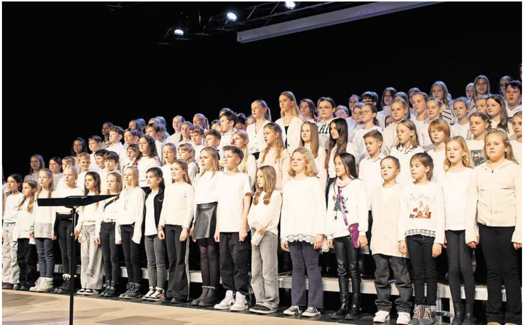
Der Unterstufenchor des Gymnasiums war auch mit von der Partie.