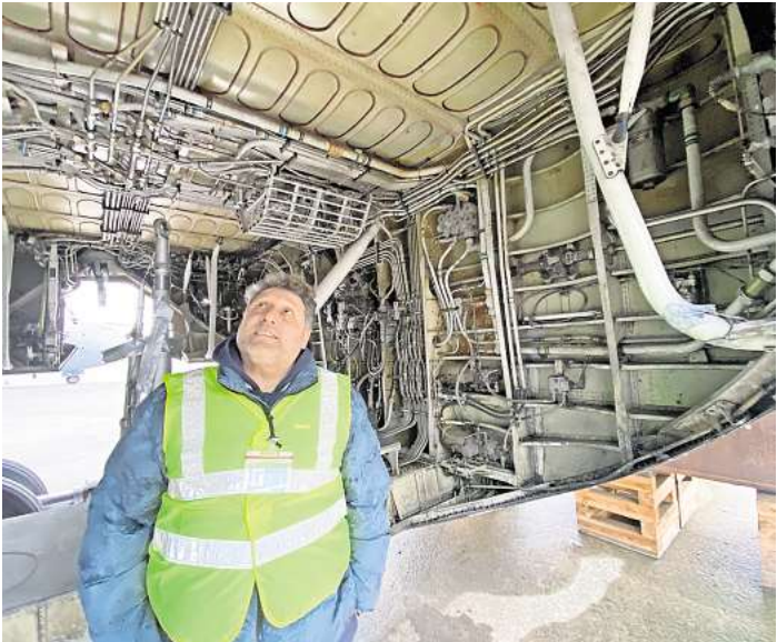
Wie ein großes Zäpfchen: Die Lagerung des Airbus-Rumpfes auf dem Flughafen Hannover kostet den Serengeti-Park jeden Monat 2900 Euro Miete - plus Kosten für regelmäßige Inspektionen.

„Wenn wir den Airbus spätestens bis Mitte März transportieren können, könnten wir im August 2026 mit dem Umbau fertig sein“, so Sepe. Ab dem 15. März verhindert die Brut- und Setzzeit einen Transport, der dann erst ab Oktober wieder möglich wäre. Dann könnte das Bordrestaurant im Serengeti-Park frühestens 2027 aufmachen. Oder eben auch gar nicht.