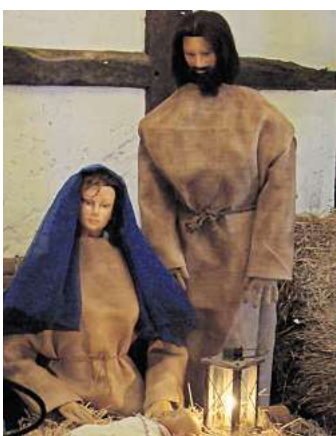
... wie die Heilige Familie.