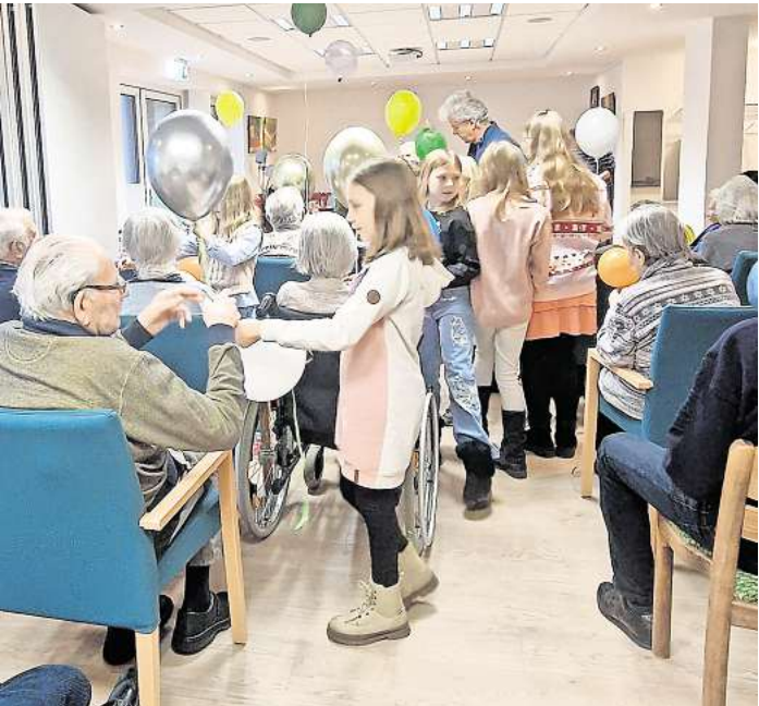
Viel Beifall gab es von den Gästen der Tagespflege Schwarmstedt für die singenden Kinder der Grundschule Schwarmstedt.

SCHWARMSTEDT. In freudiger Erwartung hatten sich die Gäste der Tagespflege Schwarmstedt und Teilnehmer aus der Bewegungsgemeinschaft Heidekreis am vergangenen Donnerstag im großen Raum der Wohnanlage „Am Obstgarten“ versammelt und warteten gespannt auf den Besuch von Kindern aus der Wilhelm-Röpke-Grundschule Schwarmstedt. Gemeinsam mit der Chorleiterin Frau Reichenberg und in Begleitung von Betreuungspersonen kamen sie dann auch pünktlich und ebenso freudig aufgeregt und erfüllten den Raum gleich mit Leben. Gemeinsam mit Frau Reichenberg hatten sie zuvor noch eine Generalprobe in der Schule absolviert. Bei ihrem kleinen Konzert in der Tagespflege Schwarmstedt sangen sie dann textsicher und gut gelaunt ein paar fröhliche Lieder über Schule, Kinderalltag