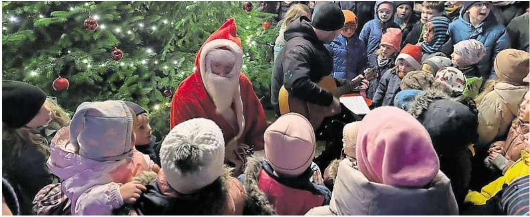
Der Weihnachtsmann vor dem geschmückten Baum beim Verteilen der Geschenke.

Richtig besinnlich wurde es dann mit dem Besuch des Weihnachtsmanns um 18 Uhr. Die Besucher standen dicht gedrängt, als zunächst gemeinsam Weihnachtslieder gesungen wurden, und im Anschluss der Weihnachtsmann kleine Geschenke an die Kinder verteilte.