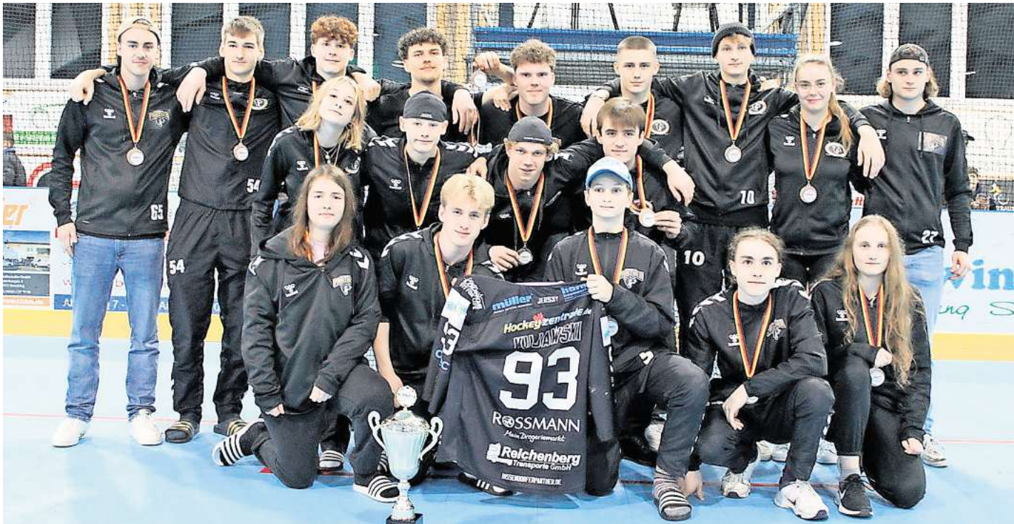
Die jungen Bissendorfer Panther landeten auf dem dritten Platz.

BISENDORF. Bei der deutschen Juniorenmeisterschaft in Atting am vergangenen Wochenende traf das Team der Panther als einer der Favoriten für den Titel auf starke Teams aus ganz Deutschland. In der Vorrunde spielten die Panther gegen Mannschaften aus Berlin (UNITAS Berlin und Red Devils Berlin), Nordrhein-Westfalen (Skating Bears Crefelder SC und Crash Eagles Kaarst) und Bayern (Deggendorf Pflanz und Gastgeber IHC Atting). Am ersten Tag des Turniers zeigten die Panther gleich zu Beginn gegen UNITAS Berlin einen starken Auftritt und besiegten diese mit 7:0. Im zweiten Spiel gegen die Red Devils aus Berlin gelang ebenfalls ein Sieg, wenn auch mit 2:1 nicht ganz so deutlich. Die folgenden Spiele liefen nicht ganz nach den Vorstellungen der Panther, die mit einigen krankheitsbedingten Ausfällen zu kämpfen hatten. So mussten sie sich Deggendorf Pflanz mit 0:2 geschlagen geben und erreichten gegen den Liga-Konkurrenten Crash Eagles Kaarst in diesem Turnier nur ein Unentschieden (3:3). Ein Sieg im letzten Spiel des Tages gegen den Gastgeber