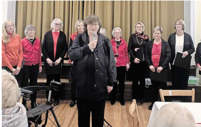
Die Landfrauen verlebten einige besinnliche Stunden miteinander.