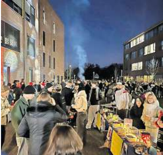
Der Andrang beim ersten Weihnachtsbasar der IGS Wedemark war groß.

WEDEMARK. Alle Teilnehmenden waren im Vorfeld aufgeregt: Wie wird der Weihnachtsbasar? Kommen ausreichend Besucher? Hält das Wetter? Findet er draußen oder doch drinnen statt? Allen voran spielte der Wettergott mit. Strahlend blauer Himmel tagsüber und perfekte Temperaturen knapp über 0 Grad Celsius, so dass auch Winter-Weihnachtsfeeling entstehen konnte. Pünktlich mit Eintreten der Dämmerung strahlte der Weihnachtsbasar im Innenhof des Campus W nicht nur aufgrund der Beleuchtung durch die Technik-AG, sondern auch, weil die Schülerinnen und Schüler sowie ihre Lehrkräfte so viel Freude ausstrahlten. Nicht nur Eltern, Freunde und Verwandte besuch-