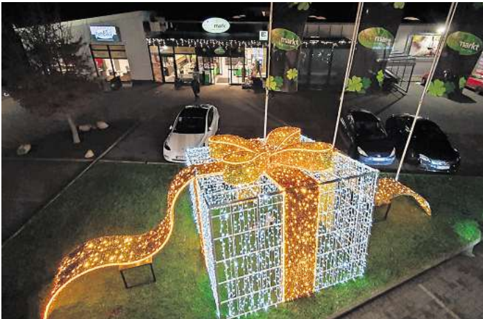
Beeindruckend: Das illuminierte Resser Geschenkpaket ist 3,5 mal 7 Meter groß.