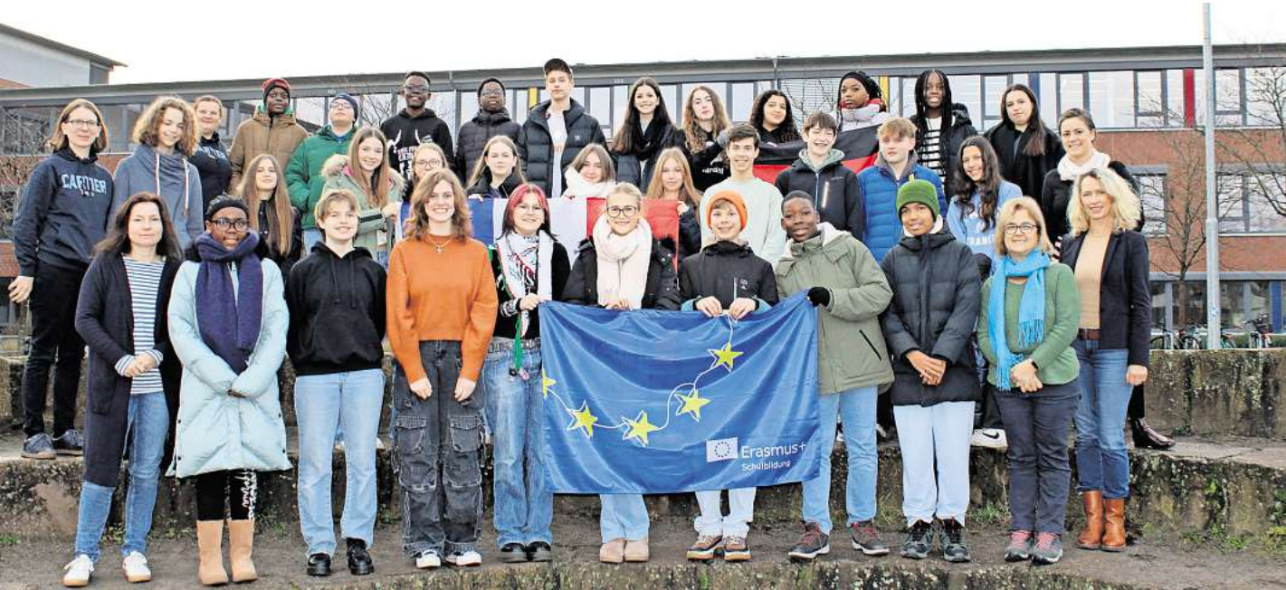
Der Besuch soll die Verbindung zwischen den beiden Kulturen und Ländern stärken.

Gymnasium Mellendorf begrüßt Gäste aus Frankreich