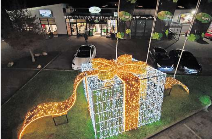
Beeindruckend: Das illuminierte Resser Geschenkpaket ist 3,5 mal 7 Meter groß.