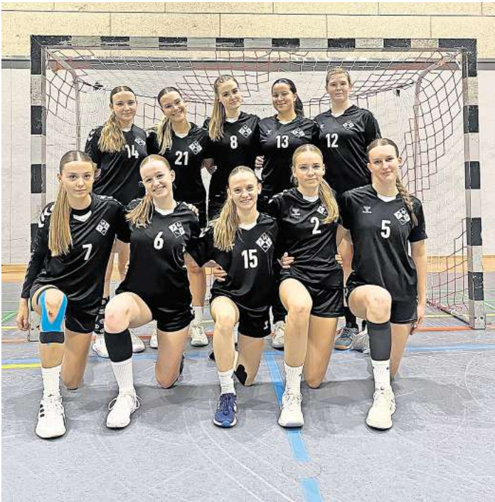
Landete ihre ersten beiden Siege in der Oberliga: die B-Jugend des MTV Mellendorf

MELLENDORF. Mit dem Gewinn der Landesliga-Meisterschaft und dem Aufstieg in die Oberliga war allen Beteiligten klar, dass die neue Saison alles andere als leicht wird. Nachdem die ersten 3 Spiele verloren gingen, blieb festzustellen, dass die Mellendorfer Handballerinnen der B-Jugend immer gut mitspielen konnten und manchmal nur ein bisschen Cleverness oder das berühmte Quäntchen Glück zum Punktgewinn gefehlt hat. Beim Spiel gegen die Peiner SG in der Wedemark-Sporthalle sollte nun endlich der erste Sieg her. Auch wenn man sich beim Aufwärmen in eigener Halle noch selbst etwas fremdgeföhlt hat, zauberten die anwesenden Fans doch schnell eine großartige Heimspiel-Atmosphäre. Die MTV-Mädels begannen zielstrebig und effektiv im Angriff. Die Abwehr dagegen stand am Anfang noch etwas wackelig, so dass Peine zunächst immer wieder ausgleichen konnte. Nach 10 Minuten übernahm dann die Heimmannschaft die Kontrolle und setzte sich über ein 9:4 bis zur Pause auf 20:11 ab. Die Abwehr fand nun Lösungen gegen die flinken Peiner Mädchen, und Martha im Tor ließ wenig zu. Im zweiten Spielabschnitt versuchte Peine mit allen Mitteln die drohende Niederlage abzuwen-