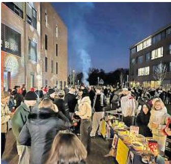
Der Andrang beim ersten Weihnachtsbasar der IGS Wedemark war groß.

WEDEMARK. Alle Teilnehmenden waren im Vorfeld aufgeregt: Wie wird der Weihnachtsbasar? Kommen ausreichend Besucher? Hält das Wetter? Findet er draußen oder doch drinnen statt? Allen voran spielte der Wettergott mit. Strahlend blauer Himmel tagsüber und perfekte Temperaturen knapp über 0 Grad Celsius, so dass auch Winter-Weihnachtsfeeling entstehen konnte. Pünktlich mit Eintreten der Dämmerung strahlte der Weihnachtsbasar im Innenhof des Campus W nicht nur aufgrund der Beleuchtung durch die Technik-AG, sondern auch, weil die Schülerinnen und Schüler sowie ihre Lehrkräfte so viel Freude ausstrahlten. Nicht nur Eltern, Freunde und Verwandte besuch-