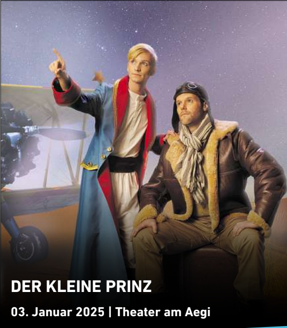
DER KLEINE PRINZ 03. Januar 2025 | Theater am Aegi

Dagegen machen Paare mit Kindern in Langenhagen nur 16,78 Prozent aus – in der Wedemark sind es mit 18,01 Prozent relativ gesehen etwas mehr.