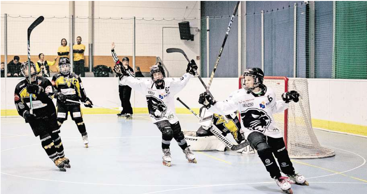
Erlebte eine Achterbahn der Gefühle: das Team der Bissendorfer Panther.

Am darauffolgenden Tag war die Hoffnung groß, als sie im Viertelfinale gegen die Rostocker Na-