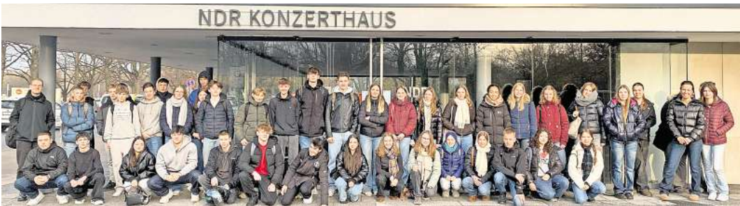
Die Schülerinnen und Schüler lernten interessante Details über die Arbeit als professionelle Musiker kennen.