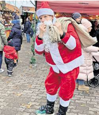
Der Weihnachtsmann schaute auch vorbei.

ABBENSEN. Der Dorfverschönerungsverein Abbensen (DVV) hat auch in diesem Jahr mit viel Engagement und Unterstützung vieler Mitglieder den beliebten Adventsbasar organisiert. Tage-