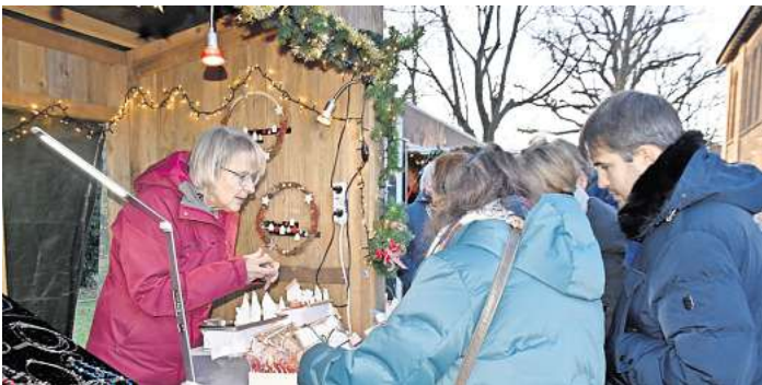
Frostig kalt und sonnig: Ideales Weihnachtsmarktwetter herrschte am ersten Advent in Brelingen.