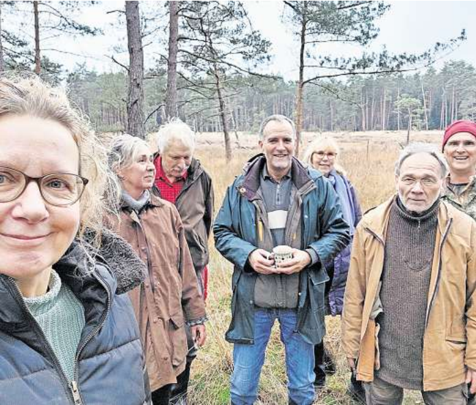
Der NABU Schwarmstedt war mit Astkneifern, Arbeitshandschuhen und Gummistiefeln im Moor unterwegs.

SCHWARMSTEDT. Das uralte Moor inmitten des Naturschutzgebietes „Schotenheide“ nahe Giltten ist ein ökologisches Kleinod unserer Heimat. Es beherbergt neben einer vielfältigen Pflanzenwelt seltenste Libellenarten und hochspezialisierte Schmetterlinge. Ganz nebenbei erfüllt der Lebensraum als natürlicher Kohlendioxid-Speicher eine wichtige klimaschützende Funktion. Zum Erhalt des kleinen Moores bedarf es allerdings einer gezielten und kontinuierlichen Pflege. Im vorliegenden Fall drohen eindringende Jungkiefern, ausgesamte Kulturheidelbeeren und Kanadische Moosbeeren (Cranberries) die Moorfläche zu überwachsen. Anlass genug für acht Freiwillige aus den Reihen des NABU Schwarmstedt, an einem kalten, aber trockenen Novembertag mit Astkneifern, Arbeitshandschuhen und Gummistiefeln zum Entkusseln hinaus zu fahren. Der vordringende Fremdbewuchs („Kusseln“) wurde mit bloßen Händen aus dem Moorboden gezogen oder bodennah gekappt. Das aufgehäuften „Kusselgut“