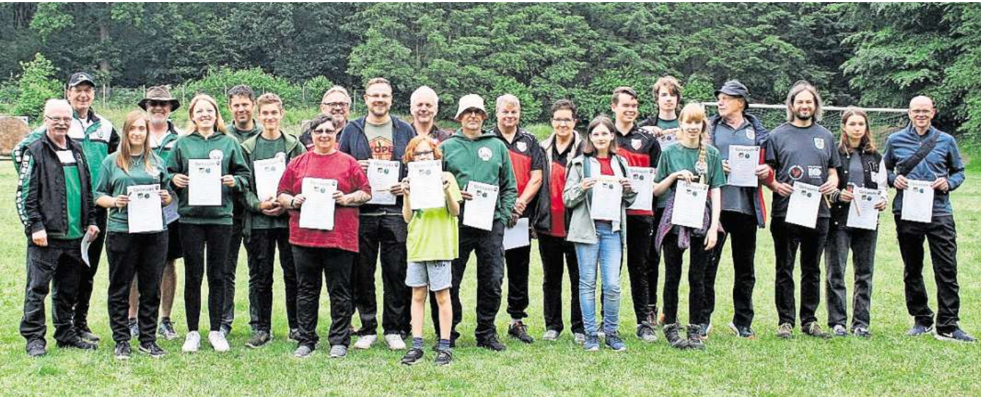
Die Teilnehmer der Kreismeisterschaft.