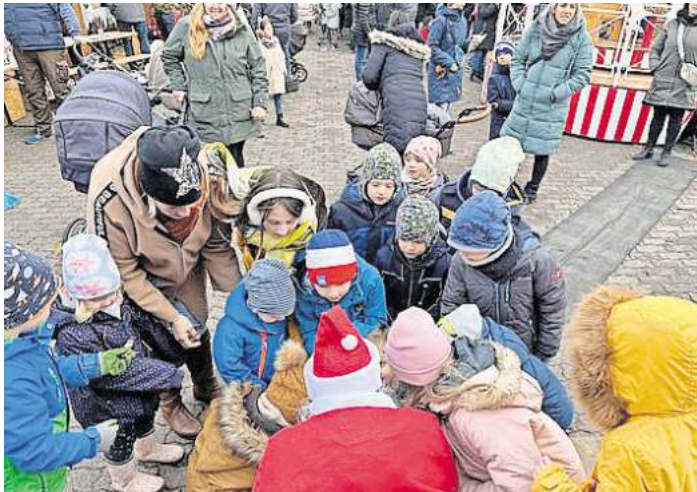
Die Kinder scharrten sich um den Weihnachtsmann.

gie-Karussell kostenlos ihre Runden, und der Weihnachtsmann kam auch vorbei. Insgesamt eine