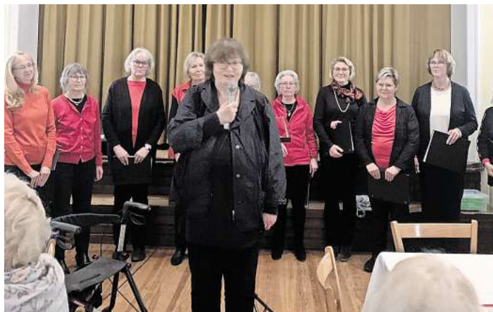
Die Landfrauen verlebten einige besinnliche Stunden miteinander.