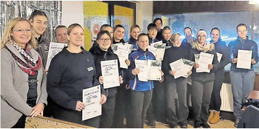
Die erfolgreichen Prüflinge.