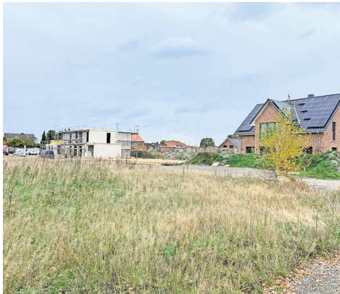
Neuer Bebauungsplan in Arbeit: Das Neubaugebiet in Elze zwischen Wasserwerkstraße und Schmiedestraße.

setzen. Der B-Plan für das Gebiet unter der ursprünglichen Bezeichnung „Bäckkamp“ war vom Verwaltungsgericht gekippt worden. Dadurch wurden die Gestaltungsvorschriften unwirksam, bis ein neuer B-Plan erstellt ist. Dies kann jedoch dauern. „Wir müssen ein Vollverfahren durchführen, auch wegen der Umweltbelange“, so Bürgermeister Helge Zychlinski (SPD). „Das wird länger dauern als im beschleunigten Verfahren.“