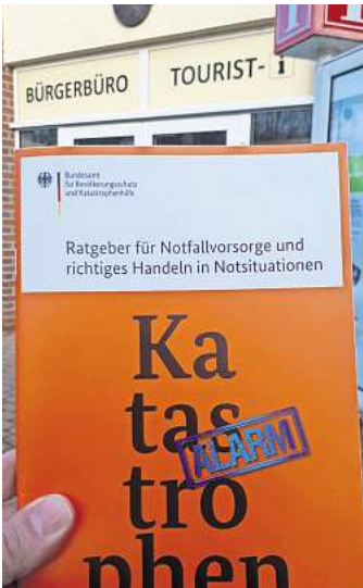
Die Notfallbroschüre stellt detailliert die Abläufe dar.

ist kostenlos im Bürgerbüro der Samtgemeinde Schwarmstedt erhältlich und kann dort abgeholt werden. In leicht verständlichen Texten und Grafiken informiert die Broschüre über Maßnahmen zur persönlichen Notfallvorsorge, wie beispielsweise die Bevorratung mit Lebensmitteln und Trinkwasser, informiert über Gepäck im Notfall oder auch darüber, welche Dokumente man griffbereit halten sollten. In weiteren Kapiteln zu den Themen Unwetter, Feuer, Hochwasser und Gefahrerstoffe gibt es eine Fülle von Informationen und Tipps zur persönlichen Vorsorge und zum Verhalten im Notfall. Bestandteil der Broschüre ist auch eine Checkliste, mit der man sich einen Überblick über den Stand der eigenen