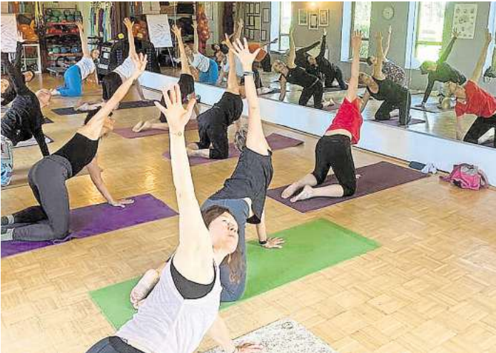
BEWUSST SEIN – Entspannung und Regeneration.

zeigt praktische Übungen zur Nervenregulation und schafft den äußeren Rahmen, um auf allen Ebenen abzuschalten. Insbesondere unterbewusste Spannungsmuster werden über sanfte bewusste Bewegungen gelöst. Am 17. November schließt sich der WinterWellnesstag mit vier Kursen (Yoga in Schlingen, bodyART FLOW, 5D Training mit dem Spinefitter, Tiefenentspannung), Sauna, Massagen und gesunder Kost in gemütlichem Ambiente an. Die Tage sind auch separat buchbar.