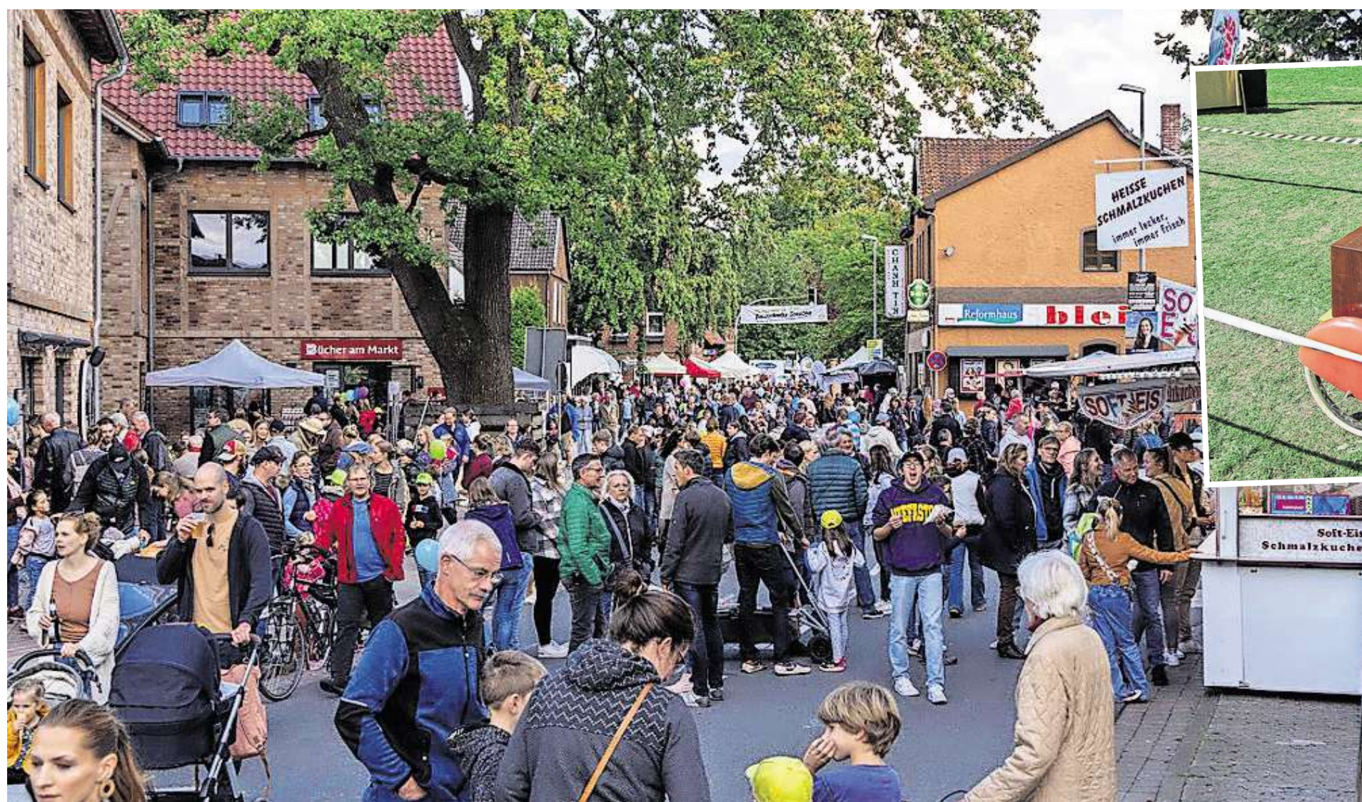
Die Besucherinnen und Besucher können auch diesmal wieder ganz entspannt auf den Straßen in Bissendorfs Ortskern flanieren, sie werden am Sonntag für den Fahrzeugverkehr gesperrt sein.

Mit dabei sein werden auch der Gewerbeverband und das Standortmarketing „#zusammenwedemark“, das Elterncafé, der TC Bissendorf und die Bissendorfer Panther. Die Scorpions werden auch nicht fehlen, hier kann man erneut die Treffsicherheit mit dem Hockeyschläger beweisen oder sein Glück bei der Tombola auf die Probe stellen. Auch der Verschönerungs- und Naturschutzverein ist mit einem Infostand mit von der