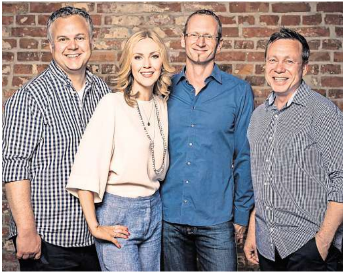
Mal swingend, mal soulig: Die Ellingtones nehmen das Publikum mit auf eine faszinierende Entdeckungsreise durch die Musik der letzten Jahrzehnte.