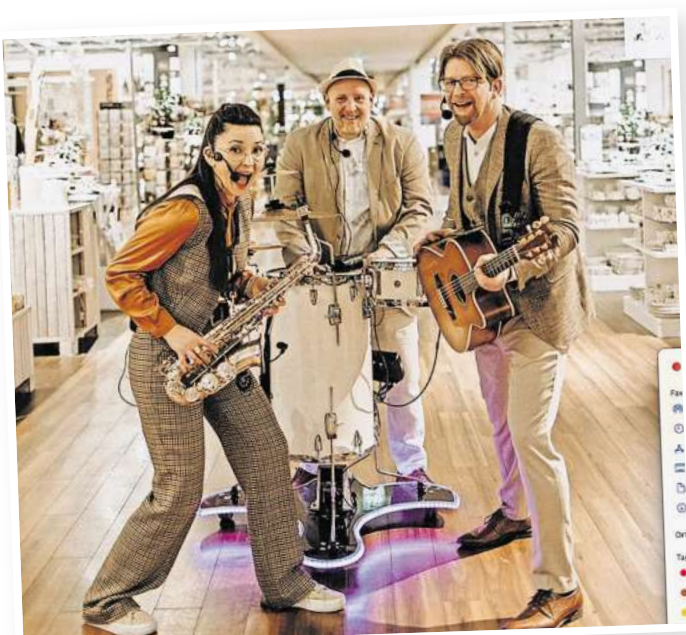
Mitsamt einem transportablen Schlagzeug wird sich die Band „Mr. Moonlight“ mit flotten Rhythmen über die Straßen in Bissendorf bewegen und an verschiedenen Punkten halten.