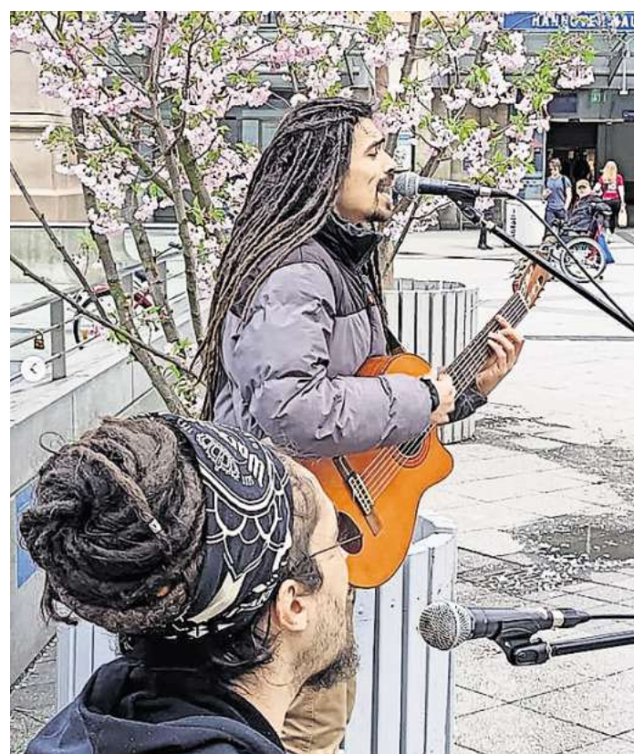
Reggae-Sound und südamerikanische Rhythmen werden von der Gruppe „Amaroots“ gespielt. Die Musiker werden ihren Standort immer mal verändern und sind an verschiedenen Stellen im Ort zu sehen und vor allem zu hören.