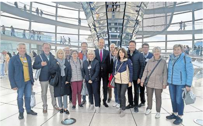
Die Wedemärker erfuhren eine Menge Wissenswertes über das politische Geschehen in der Hauptstadt.

Arbeit im Parlament zu geben. Insbesondere ging er hierbei auf seinen Werdegang und Aufgabenbereich als Parlamentarischer Geschäftsführer der CDU/CSU-Bundestagsfraktion ein. Die anschließende Fragerunde, in der die Bürgerinnen und Bürger ihre Anliegen direkt vortragen konnten, drehte sich primär um aktuelle Themen wie die Vorratsdatenspeicherung und die Auswirkung der aktuellen Landtagswahlen auf das politische Geschehen. Aber auch Themen wie die soziale Gerechtigkeit und eine Umgestaltung des Bürgergeldes bewegten die Teilnehmer sehr. „Es hat mich sehr gefreut, dass ich nach der parlamentarischen Sommerpause eine überaus interessierte Gruppe treffen konnte; wichtige Hinweise wurden an mich herangetragen, die ich in den kommenden Beratungen berücksichtigen werde“, so Hoppenstedt. Abschließend ging es für die Besucher auf die Kuppel des Reichstagsgebäudes.