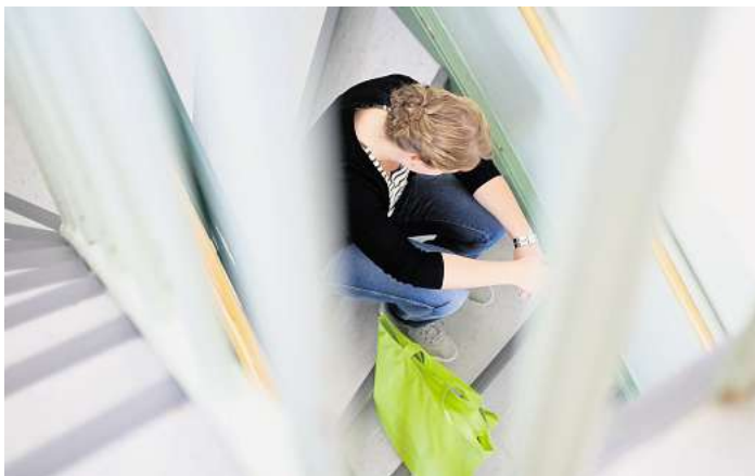
Betroffenen und Angehörige können ab dem 12. September für den «Forschungskompass Mentale Gesundheit» die für sie wichtigsten Themen online bewerten.

Maßgeblich dabei: „Welche Fragen sollte die Forschung beantworten, um die psychische Gesundheit von Ihnen oder nahestehenden Personen zu verbessern?“, heißt es auf der Projekt-Webseite. Wenn am 12. September 2024 die zweite Runde der Online-Befragung startet, haben Betroffene und Angehörige auf der Webseite kommit-deutschland.de drei Wochen lang die Gelegenheit, die für sie wichtigsten Themen auszuwählen. „Für die finale Erstellung des Forschungskompasses ist es wichtig, dass die Erfahrungsexperten die Forschungsprioritäten mit ihrer Bewertung einordnen“, so Projektleiterin Sabine Lipinski. Die Veröffentlichung des Forschungskompass, der auf den Antworten der Teilnehmenden basiert, ist für Anfang 2025 geplant. Im Frühjahr 2024 wurden bei der ersten offenen Ab-