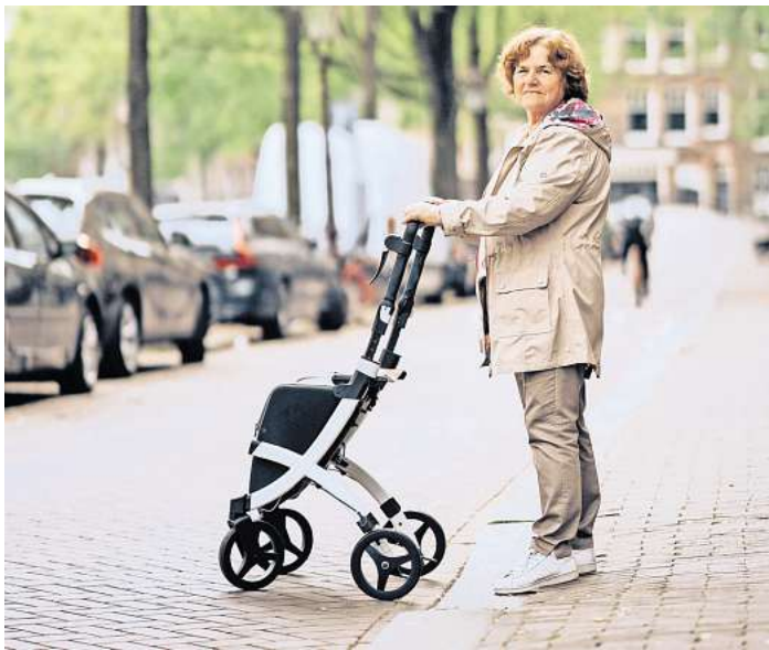
Moderne Rollatoren bieten Sicherheit beim Gehen - und je nach Modell mit integrierten Stauräumen und ausklappbaren Rückenlehnen auch eine Unterstützung beim Einkaufen sowie bequeme Sitzmöglichkeiten.

Rollatoren sind wohl die bekanntesten Hilfsmittel, wenn es um die Unterstützung der Mobilität geht. Sie bieten nicht nur Stabilität und Sicherheit beim Gehen, sondern sind häufig auch mit Sitzflächen ausgestattet, die bei längeren Spaziergängen eine willkommene Ruhepause ermöglichen. Moderne Rollatoren sind zudem leicht, wenig und oft zusammenklappbar, was den Transport erleichtert. Besonders im häuslichen Umfeld oder bei Einkäufen sind sie unverzichtbar, da sie es ermöglichen, größere Strecken unabhängig und sicher zurückzulegen. Neben Rollatoren spielen auch andere Gehhilfen wie Gehstöcke und Unterarmgehstützen eine wichtige Rolle. Gehstöcke bieten eine einfache und effektive