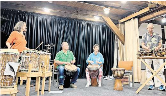
Beim Kulturabend in Schwarmstedt boten die Künstler musikalische Vielfalt.

Mit den „Klangfreu(n)den“ begab man sich auf die Zeitreise in den Barock und Hans-Ulrich Rasokat ließ in einer Lyricsession