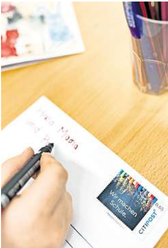
Früh übt sich wer lernt, einen Brief zu schreiben.

Sie sind Lehrer oder Lehrerin und möchten Postkarten als Material für Ihren Deutschunterricht? Dann melden Sie gerne unter service@citipost.de.