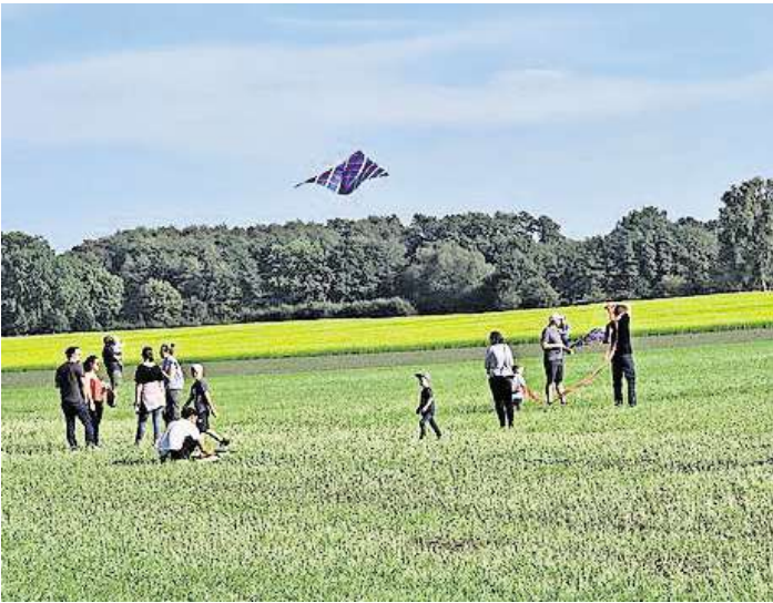
Der Wind war zwar nicht so stark, aber trotzdem war die Resonanz beim Drachenfest gut.

fest hat sich in den vergangenen Jahren zu einem beliebten Treffpunkt für Jung und Alt in Abbensen entwickelt. Schon die Kaffeetafel mit den selbstgemachten Torten und Kuchen war sicher einen Besuch wert. Aber auch das Herzhafte vom Grill und die gekühlten Getränke wurden sehr gut angenommen. Zum Schluss gab es dann auch nur zufriedene Gesichter, sowohl bei den Besuchern als auch bei den Organisatoren des Dorfverschönerungsvereins. Es hat mal wieder richtig Spaß gemacht.