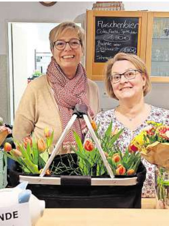
Das Dorfcafé ist zu einer beliebten Veranstaltung geworden: Mindestens drei Mal im Jahr sind alle Einwohner unabhängig vom Alter zu Kaffee und Kuchen eingeladen.