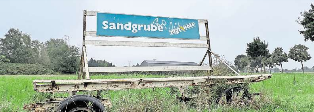
Derzeit noch Ackerland: Auf diesem Feld soll die Erweiterung der Sandgrube angrenzend zum Waldstück entstehen.

Region meldet rechtliche Bedenken an, Grüne haken im Bauausschuss nach