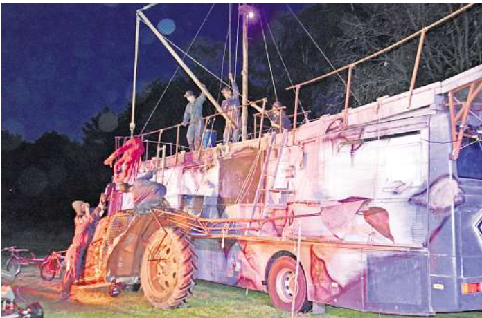
Theatertage in der Wedemark: In der Sandkuhle in Hellenendorf geht das Team des Theaters Wendland auf Waljagd.

Die Freie Bühne Wendland will Meilensteine setzen. Sie steht quasi für die Rückbesinnung auf das Wandertheater als Gegenbe-