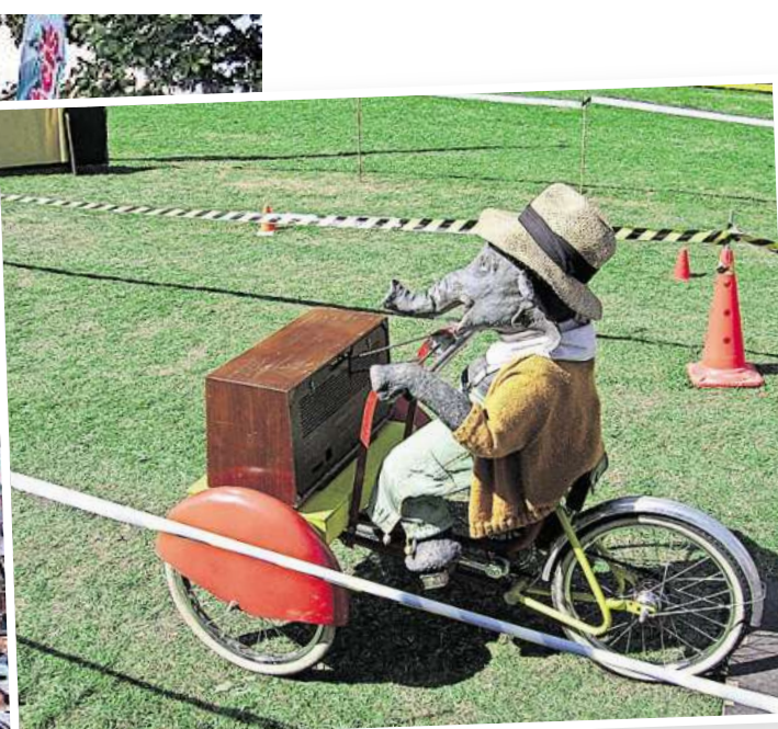
Ein ganz besonderer Gast wird sich seine Wege durch die Besucherinnen und Besucher mit seinem Vehikel suchen: „Jochen der Elefant“ begeistert nicht nur die kleinen Gäste.

Auch in diesem Jahr wird zeitgleich der traditionellen Krammarkt entlang der Gottfried-August-Bürger-Straße stattfinden. Einer der großen Anziehungspunkte für die kleinen Gäste wird sicherlich wieder das Kinderkarussell sein aber auch die Stände mit Trödel, Herbstblumen, Keramik, Kleidung und, und, und. Auf jeden Fall ist sicher, der Bissendorfer Sonntag in diesem Jahr wird eine bunte Vielfalt des Einzelhandels, des Vereinslebens und des Ehrenamtes in der Gemeinde Wedemark zu bieten haben.