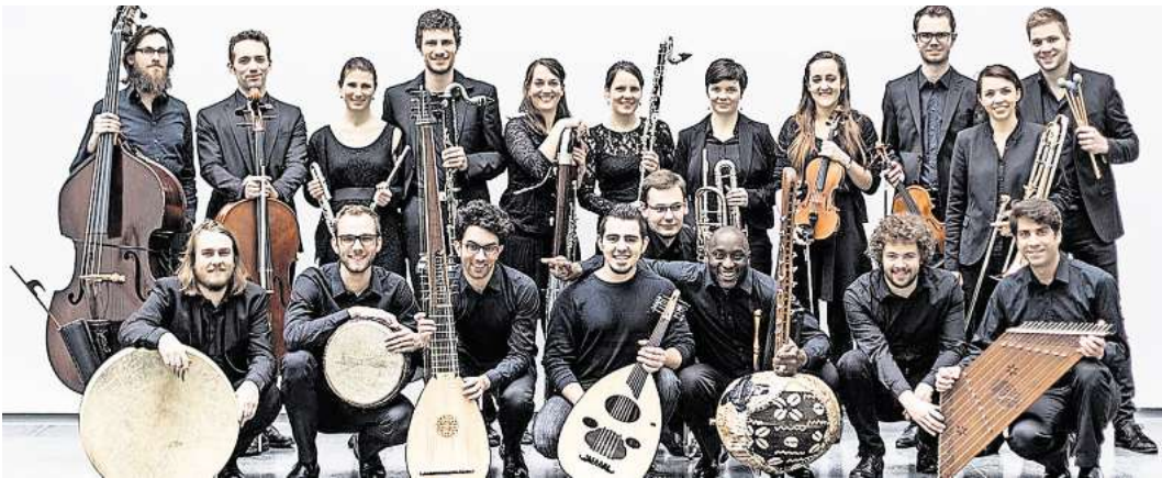
Vereint klassische Musik mit außereuropäischen Musiktraditionen: das Asambura-Ensemble.

Ein weiteres Highlight ist die Aufführung von „MessiaSAmbura“ am Sonntag, 3. November, um 17 Uhr. Georg Friedrich Händels „Messiah“ trifft Musik Ostafrikas – religiöse Entfremdung und interkultureller Aufbruch. Auf der Bühne sind dann