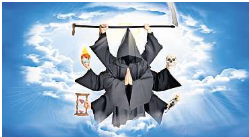
Widmet sich den aktuellen Problemen des Dies- und Jen-seits: Mister Death Comedy.

Aus diesen Zutaten schafft die Mimuse wieder besondere Abende im Langenhagener Kulturkalender. Karten gibt es an allen bekannten Vorverkaufsstellen und unter www.eventim.de