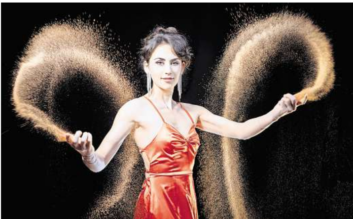
Ein Highlight des Jahres: der Mimuse Maxi Mix.