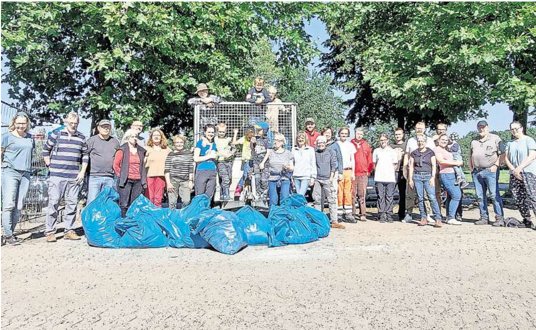
Freiwillige vor: Am Sonnabend, 21. September, wird wieder Müll gesammelt.

Auch in diesem Jahr wird die Aktion wieder kräftig unterstützt von der Johanniter-Jugend mit gegrillten Bratwürsten, vom Bauhof mit einem großen Anhänger voll nützlicher Ausrüstungsgegenstände und von der Freiwilligenbörse mit der Finanzierung von Speis und Trank.