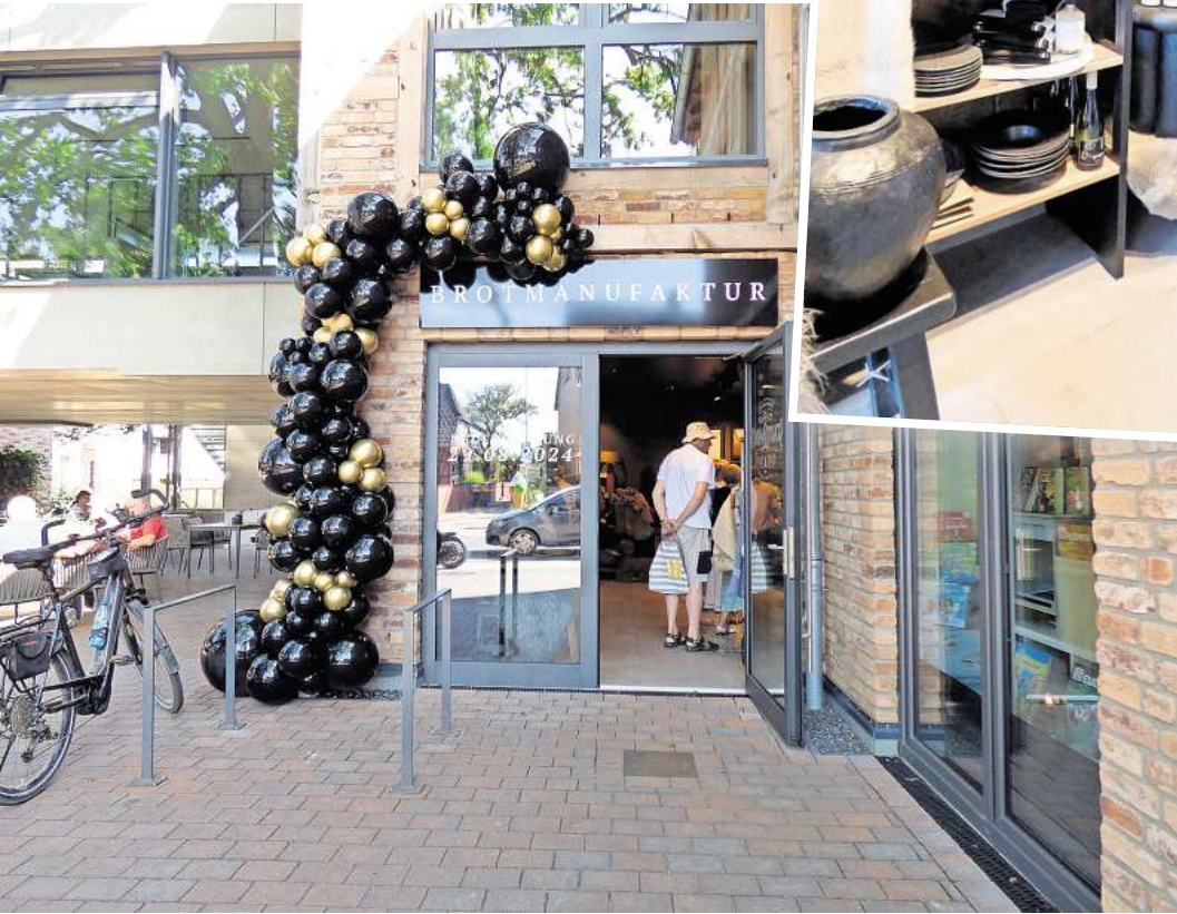
Den Weg in den Shop der Brotmanufaktur dürfte der Duft nach frischem Brot weisen. Denn einiges wird direkt vor Ort in Bissendorf fertig gebacken.