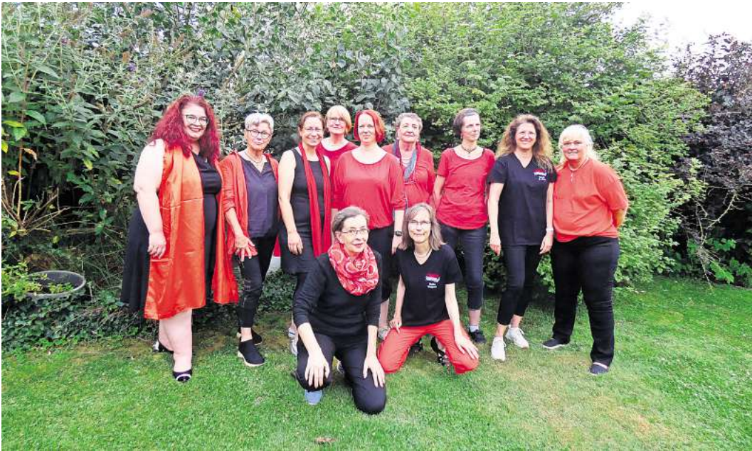
Die neue Regionalgruppe der „Mörderischen Schwestern“.