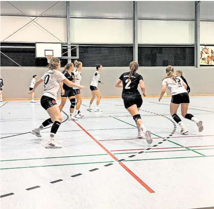
Die Mellendorferinnen setzen auf Flexibilität in Abwehr und Angriff.

der Sporthalle Am Royeplatz gegen den VfL Wolfsburg. Eine Woche später, am Sonnabend, 21. September, müssen die Mellendorfer Damen um 18.30 Uhr beim MTV VJ Peine antreten. Der MTV Rosdorf ist dann am Sonnabend, 29. September, um 15 Uhr der Gegner in der Sporthalle Am Royeplatz. Alle Heim- und Auswärtsspiele sind als Live-Stream über die MTV-Homepage unter http://www.handball-mellendorf.de/cm/index.php/li-vestreams zu sehen.