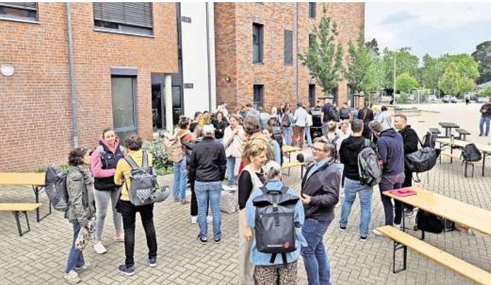
An der IGS Wedemark wird jetzt mit einem neuen Leitbild agiert.

Dabei stehen neben ganz praktischen Bausteinen wie der I-Serv-Führerschein und die iPad-Schulung auch pädagogische Bausteine im Schulprogramm. Das Arbeiten im Team wird von den