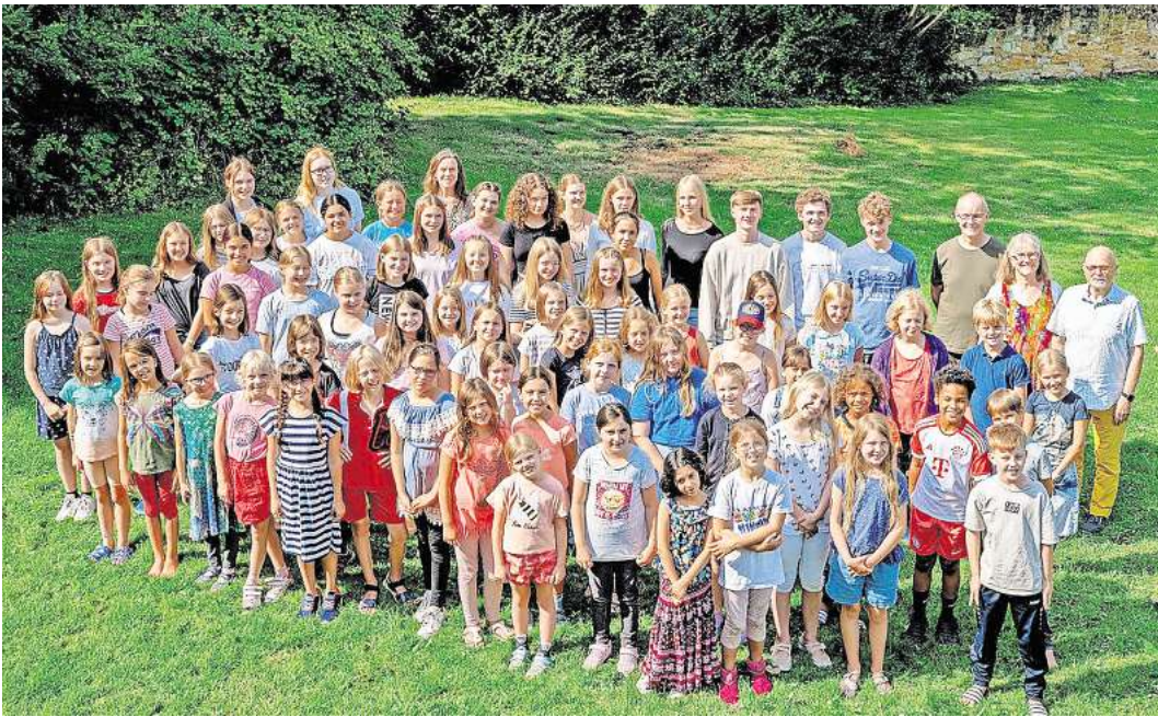
Die Jungen Chöre sind am 20. und 21. September in St. Martini zu hören.

BRELINGEN (OK). Mehr als 100 Kinder und Jugendliche stehen am Freitag, 20., und Sonnabend,, 21. September, jeweils um 17 Uhr in der Brelinger St. Martini-Kirche auf der Bühne. Sie kommen aus den umliegenden Orten der Wedemark, überwiegend aus Brelingen. Mit diesem Bühnenwerk machen die Jungen Chöre St. Martini den Auftakt zum Jubiläum „175 Jahre Kirchbau Brelingen“, feiern in diesem Jahr selbst ihr 25-jähriges Bestehen. Das Stück trägt den klangvollen Namen „La Piccola Banda – Festivale di Fantasia“. In La Piccola Banda geht es um die Flucht der jungen Felicia aus einer als zu eng empfundenen, rational bestimmten Realität in die Fantasiewelt ihrer Tagträume. Eine kleine paradiesische Welt der italienischen Renaissance entsteht mit phantasievollen Bildern und Figuren. Unterschiedliche Charaktere und Stilrichtungen vereinen sich ebenso wie unterschiedliche musikalische Stilrichtungen: von der italienischen Renaissance über Romantik bis hin zur Rockmusik. Die Jungen Chöre – Spatzen-, Mittel-, Kinder- und Jugendchor – werden in dem fröhlichen, musikalisch wie szenisch anspruchsvollen Stück von der „Capella di Festivale“ begleitet.