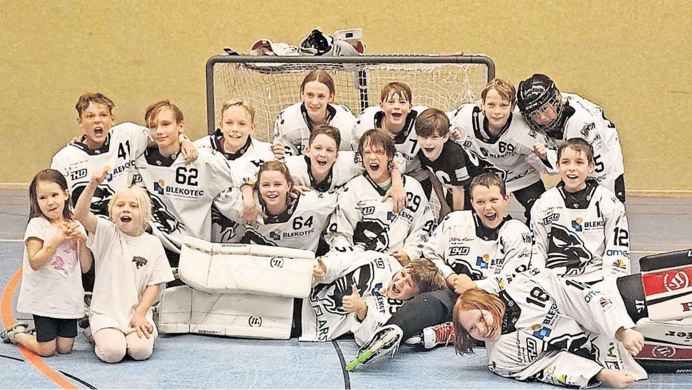
Setzten sich bei den Empelde Maddogs eindrucksvoll mit 18:2 durch: die Pantherschüler.

Inline-Skaterhockey: Pantherschüler wollen sich für Deutsche Meisterschaft qualifizieren