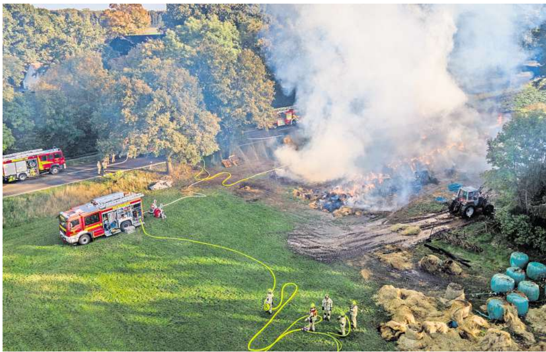
Luftunterstützung: Die DLRG-Drohne half der Feuerwehr und dem THW bei der Brandbekämpfung.

Dabei gehe es aber nicht nur um vollgelaufene Keller oder umgestürzte Bäume, sondern „um Menschenrettung“, wie Plischke betonte. Und dafür brauche es neben der technischen Ausrüstung auch entsprechende Kräfte. Prinzipiell steht es um die Einsatzstärke in der Wedemark zwar gut. Dennoch: „Mitglieder der Freiwilligen Feuerwehr können