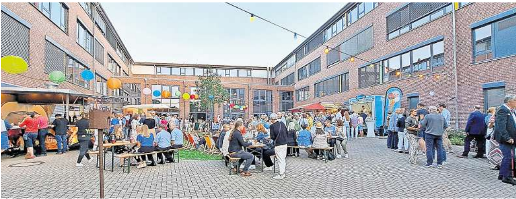
Der Innenhof am Schulzentrum war für das Sommerfest entsprechend umdekoriert.

Unter dem Motto „50 Jahre Gemeinde Wedemark“ stand auch dieser Abend, wie bereits das Bürgerfest im Juni am Bürgerhaus in Bissendorf. Mitarbeiterinnen und Mitarbeiter der Gemeinde Wedemark hatten dafür gesorgt, dass aus dem Innenhof am Schulzentrum ein ansprechender Rahmen mit ausreichend Sitzgelegenheiten entstand. Bunte Lampions leuchteten nach Einbruch der Dunkelheit über allem und die bunte Gruppe der Theater Company „Takkers Conection“ aus den Niederlanden sorgte mit ihren ausgefallenen und vor allem bunten Kostümen für gute Stimmung. Die geladenen Gäste beteiligten sich allesamt mit einem Kostenbeitrag an der Finanzierung des Abends, auch zahlreiche Sponsoren wie unter ande-