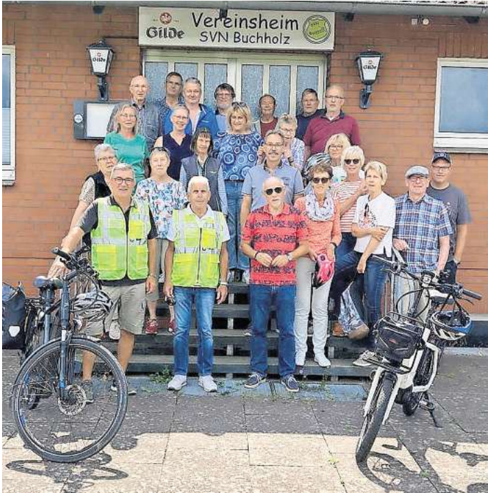
Die Stimmung in der Gruppe war vom Start weg großartig.

24 Fahrradbegeisterte treten kräftig in die Pedalen