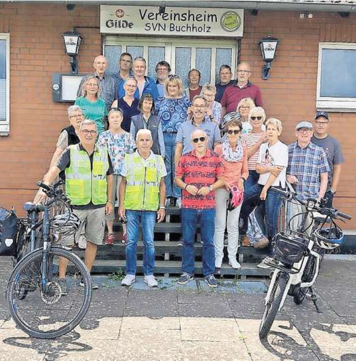
Die Stimmung in der Gruppe war vom Start weg großartig.

24 Fahrradbegeisterte treten kräftig in die Pedalen