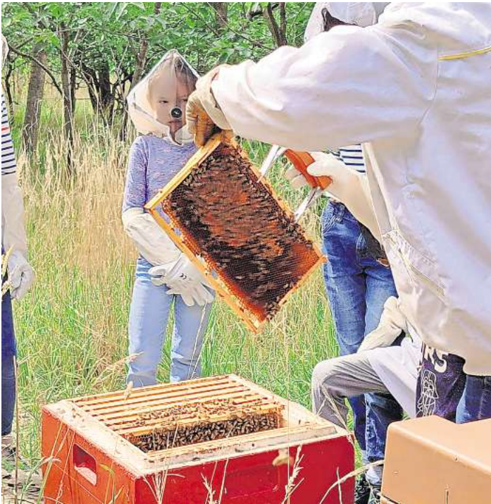
„Was summt und brummt“ hieß das Motto.

stehen, fällt auch der Geschmack des Honigs aus. Honigkostproben aus dem Glas wurden dabei mit dem frischen Honig direkt aus der Wabe verglichen.