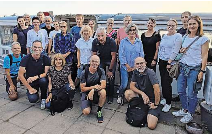
Das Gemeinschaftsgefühl macht den LAC aus.

die Möglichkeit, das Maschseefest aus einer anderen Perspektive zu genießen. Es gab viel Gelächter und Geschichten aus den letzten zehn Jahren wurden ausgetauscht. Der Abend auf der EMS Niedersachsen war ein gemütliches Beisammensein, bei dem die Mitglieder die Möglichkeit hatten, sich zu entspannen und die Gemeinschaft zu genießen. Der Vorstand bedankte sich bei allen für ihr Engagement und ihre Unterstützung in den letzten zehn Jahren und freut sich auf viele weitere erfolgreiche Jahre. "Wir sind mehr als nur ein Leichtathletik-Club", sagte der Vorsitzende. "Wir sind eine Gemeinschaft. Und das ist es, was die letzten zehn Jahre so besonders gemacht hat."