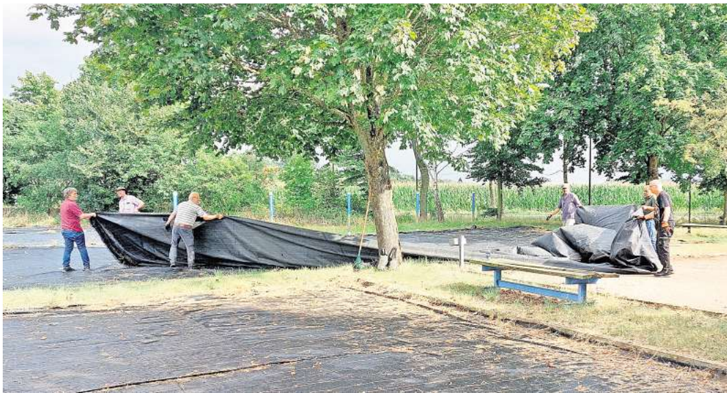
Die „hinteren“ Spielflächen wurden für das Aller-Leine-Tal-Turnier hergerichtet.