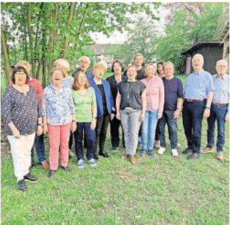
Die Michaeliskantorei lädt zum Mitsingen ein.