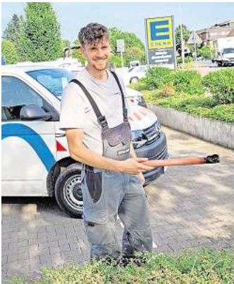
Die Avacon-Mitarbeiter waren bei der Schadensbehebung schnell am Werk.

Um die Auswirkungen eines Stromausfalls für den Einzelnen zu reduzieren, sollte sich jeder Haushalt so vorbereiten, dass er einige Tage ohne Hilfe von außen auskommt. – Legen Sie sich ausreichende Vorräte an Trinkwasser, Lebensmittel und ggf. Babynahrung sowie Hygieneartikel an. – Das Licht von Kerzen, Taschen-