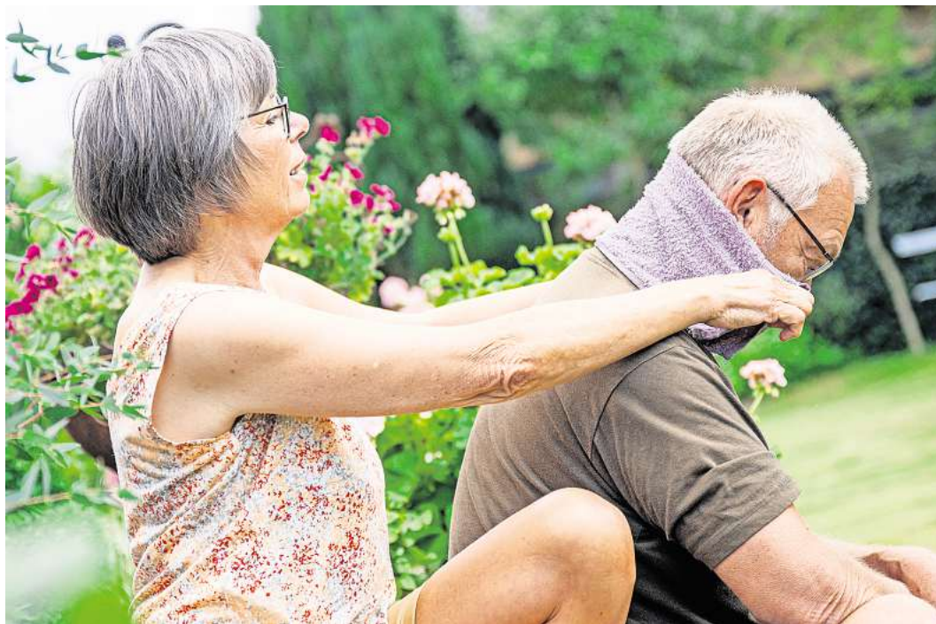
Feuchte Umschläge auf Armen, Beinen oder im Nacken sorgen an heißen Tagen für etwas Abkühlung.

Mehrere kleine, leichte Mahlzeiten sind gut an heißen Tagen. Das kann ein Salat sein, gedünstetes Gemüse und wasserreiche Rohkost wie Tomate, Gurke oder Wassermelone. Auch mageres Fleisch und Fisch sind bekömmlich. Salzgebäck hat gleich zwei positive Effekte: Es regt das Durstgefühl an und unterstützt den Salzhaushalt. Herrscht draußen Hitze, gilt es, sie nach