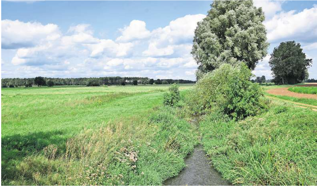
Offene Landschaft: Im Bereich der Wietze in der Wedemark hat bei Fachleuten in Sachen Windenergie ein Umdenken stattgefunden.