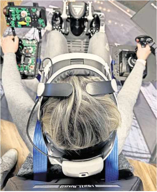
Einen Traum erfüllen: Mit dem Steuerknüppel in der Hand in einem virtuellen Jet die Lüfte erobern.

nach Absprache im „Haarstudio B“ arbeiten möchten. Um das außergewöhnliche Doppelkonzept auch adäquat in die Praxis umsetzen zu können, haben sich Grubes ein raffiniertes System einfallen lassen: Unter der Woche wird alles optisch so aussehen, als wäre das Ladengeschäft ausschließlich ein Friseur. Auch nach außen in der Schaufensterfront soll dies dann der Fall sein. Zum Wochenende aber findet der Kulissenwechsel statt und das VR-Studio hält Einzug. „Deshalb feiern wir am 3. August auch keine Einweihung, sondern eine Zwei-Weihung“, sagen beide mit einem Schmunzeln und freuen sich auf viele interessierte Gäste zum Tag der offenen Tür von 11.00 bis 16.00 Uhr. Eine Terminbuchung für das VR-Studio ist insbesondere über das Internet möglich unter www.vr-experiences.de oder per Telefon (05130) 974 72 57. Einen Friseurbesuch im Haarstudio B vereinbaren Sie telefonisch unter (05130) 609 00 00 oder an den Öffnungstagen direkt im Geschäft.