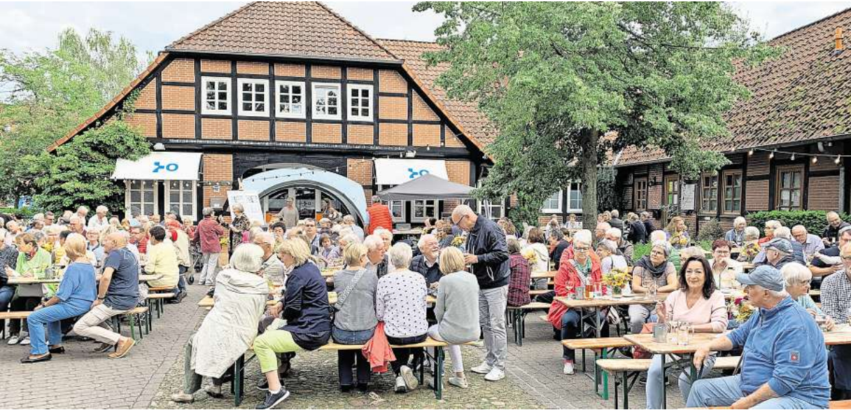
Vielfältigkeit ist sein Markenzeichen: Der Bürger- und Verschönerungsverein Mellendorf veranstaltet Ferienpassaktionen mit einem Imker, Radtouren, Pflanzaktionen, Busfahrten, das Herbst- und Weinfest, sammelt Müll und stellt Schilder und Bänke auf.

Verschönerungsverein Mellendorf will junge Familien gewinnen