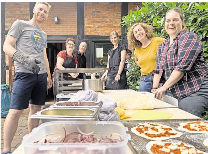
Das war die Schools-Out-Pizza zu Ferienbeginn - gemeinsam mit dem Förderverein der Bissendorfer Grundschule.