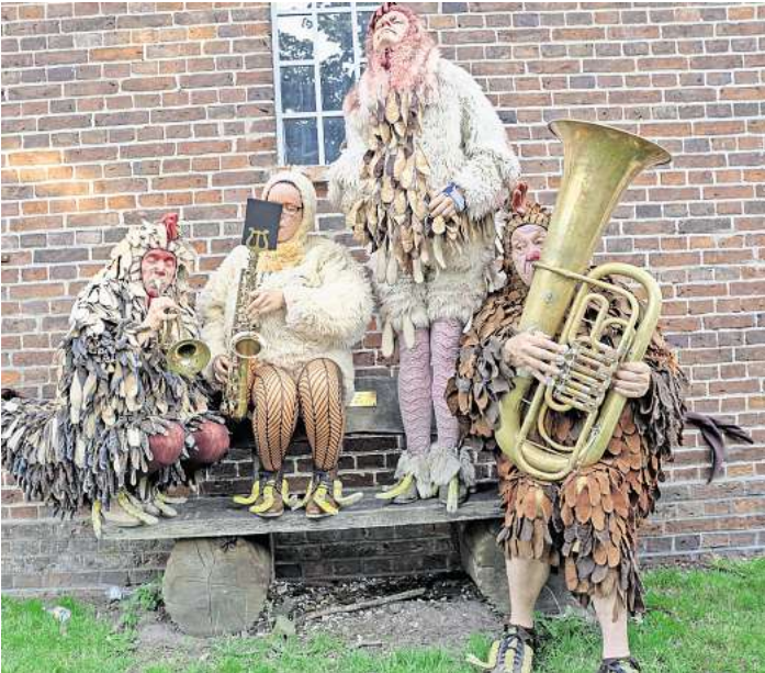
Bei den Wedemärker Theatertagen hat ein prachtvoll gefiederter Hühnerhaufen seinen musikalischen Auftritt.

Die Theatertage der Gemeinde Wedemark sind ein bunter Mix aus schauspielerischer Darbietungen an verschiedenen Veranstaltungsorten: vom Landmarkt über die Berliner Straße und die Sandkuhle in Hellendorf bis zur Aula der Grundschule Mellendorf. Vom 19 bis 22. September und am letzten Wochenende im Oktober. Der Vorverkauf läuft.