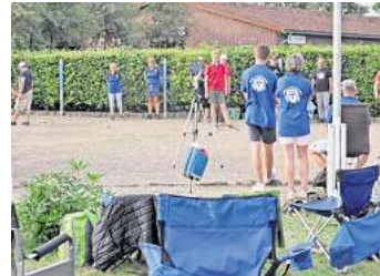
Auf dem Boulodrome in Essel wird seit über 30 Jahren Boule/Pétanque gespielt.

Das Zwickel-Turnier in Essel ist Teil einer Turnierserie in und um Hannover. Insgesamt gibt es in diesem Jahr 21 Turniere, zwei davon in Essel. Der Name der Turnierserie leitet sich aus der Höhe des Startgeldes ab: Früher betrug dieses 2 Mark (1 Zwickel), heute beträgt es 1 Euro. Etwa 50 Prozent der Startgelder werden am jeweiligen Spieltag ausgeschüttet. Der Rest wird für das Finale gesammelt. Dafür qualifizieren sich die besten 16 Teilnehmerinnen bzw. Teilnehmer nach dem letzten Spieltag. Der SV Essel freut sich auf die Teilnahme zahlreicher Teams und einen schönen, sommerlichen Turniertag. Das zweite Zwickel-Turnier in Essel findet am 20. August 2024 statt.