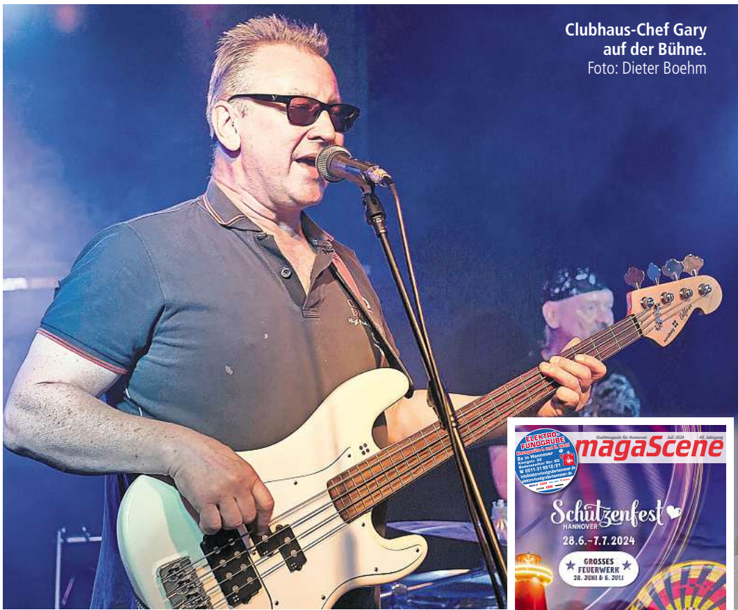
Green River Gang.