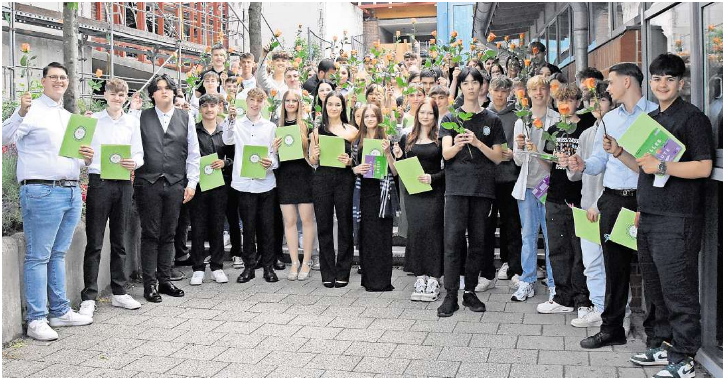
Alle Abschlussschülerinnen und Schüler auf der Eingangstreppe.

Feierliche Entlassung der Haupt- und Realschülerinnen