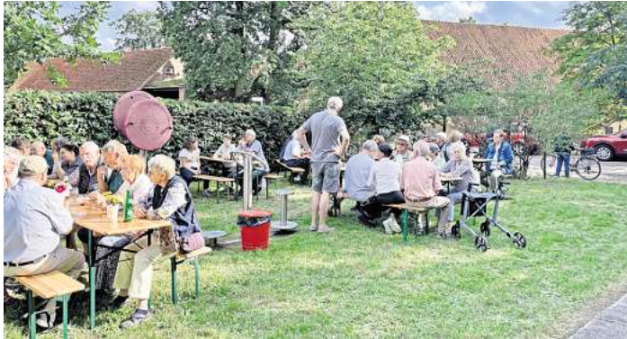
Das Sommerfest in Elze findet am 27. Juli hinter der alten Schule statt.

Ab 15 Uhr geht es etwas deftiger weiter. Neben Grillgut und verschiedenen alkoholischen sowie nichtalkoholischen Getränken werden Weißwein und eine Käseauswahl gereicht. Alles zum Selbstkostenpreis. Für musikalische