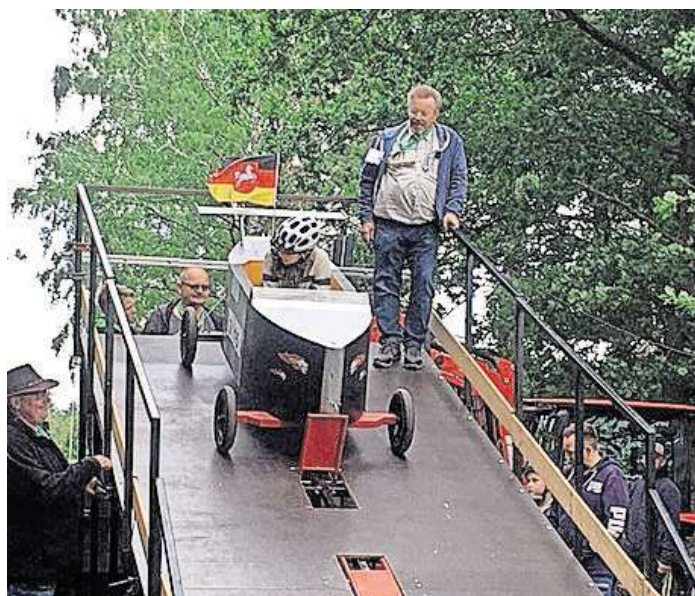
Seit 2016 regelmäßig im Veranstaltungskalender des DVV Abbensen: Das Seifenkistenrennen.

Viele neue Mitglieder kämen beispielsweise aus den Neubaugebieten wie Rawers Hof und in der Siedlung, in der gerade ein Generationswechsel ansteht. Viele Häuser würden an junge Familien verkauft, sagt der Vereinsvorsitzende, „die gerne über unseren Verein Anschluss an die Dorfgemeinschaft bekommen möchten“.