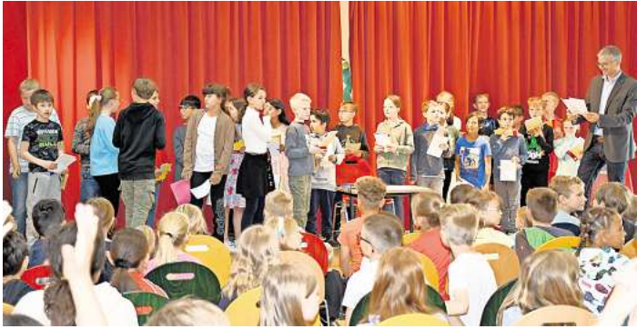
Mit 31 Teilnehmerinnen und Teilnehmern war die Wilhelm-Röpke-Grundschule Schwarmstedt beim Känguru-Wettbewerb 2024 gut vertreten

Schwarmstedts Grundschüler erfolgreich beim Mathematikwettbewerb