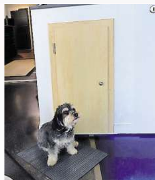
Auch Sonderanfertigen, wie diese kleine Tür – hier mit Familienhund Cooper – sind kein Problem für den Fachbetrieb.