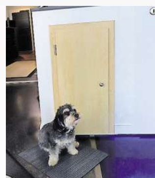
Auch Sonderanfertigen, wie diese kleine Tür – hier mit Familienhund Cooper – sind kein Problem für den Fachbetrieb.