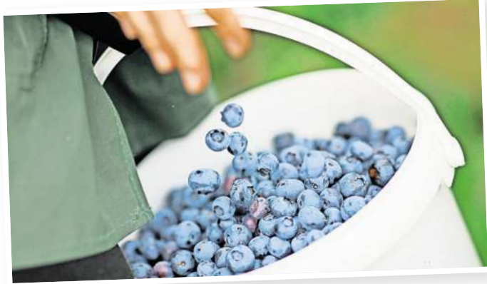
Heidelbeeren (auch Blaubeeren genannt) haben von Juli bis September Saison.

Heidelbeeren enthalten viele Antioxidantien wie Flavonoide und Vitamin C