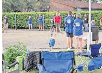
Auf dem Boulodrome in Essel wird seit über 30 Jahren Boule/Pétanque gespielt.

Das Zwickel-Turnier in Essel ist Teil einer Turnierserie in und um Hannover. Insgesamt gibt es in diesem Jahr 21 Turniere, zwei davon in Essel. Der Name der Turnierserie leitet sich aus der Höhe des Startgeldes ab: Früher betrug dieses 2 Mark (1 Zwickel), heute beträgt es 1 Euro. Etwa 50 Prozent der Startgelder werden am jeweiligen Spieltag ausgeschüttet. Der Rest wird für das Finale gesammelt. Dafür qualifizieren sich die besten 16 Teilnehmerinnen bzw. Teilnehmer nach dem letzten Spieltag. Der SV Essel freut sich auf die Teilnahme zahlreicher Teams und einen schönen, sommerlichen Turniertag. Das zweite Zwickel-Turnier in Essel findet am 20. August 2024 statt.