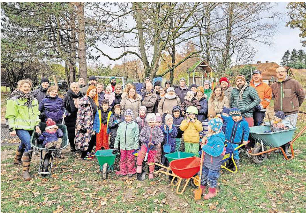
Kinder, Eltern und Kita-Mitarbeiter starteten eine großen Pflanzaktion auf dem Gelände der Kita Abbensen.

Jetzt hoffen alle, dass die neue Blühhecke und die anderen Pflanzen gut anwachsen, neuer Lebensraum für Insekten und Kleintiere entsteht und der Spielbereich der Kinder von der Straße nicht mehr so einsehbar ist.