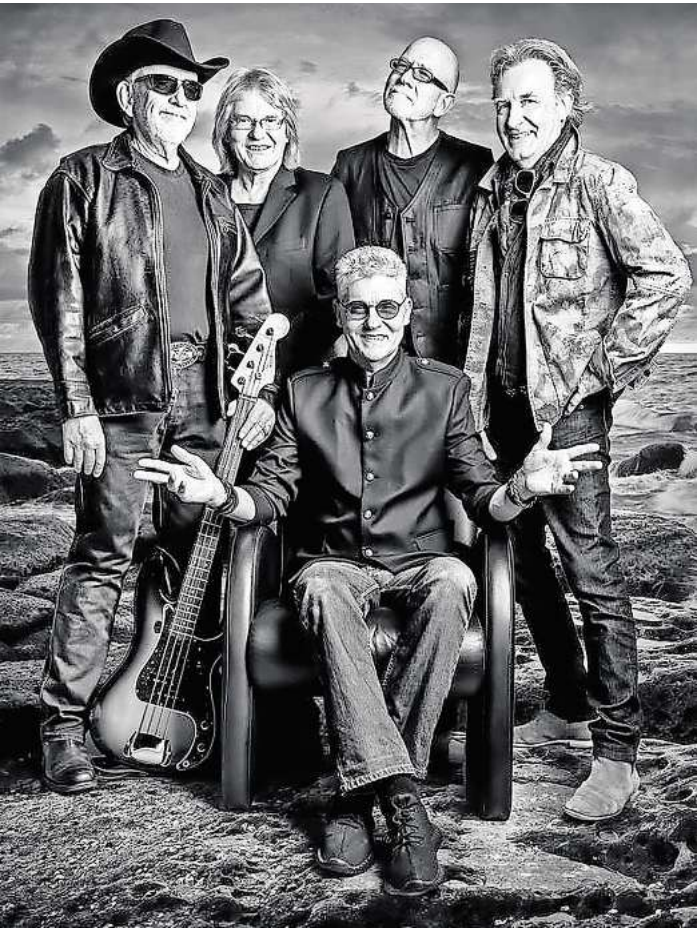
Green River Gang.

Der Anfang war also gemacht. Die ersten ein bis zwei Jahre waren dann laut Gary etwas schwierig. Als dann im Juni 2016 Tante Minchen's Gute Stube an der Hildesheimer Straße in der Südstadt schloss, suchte die Blues-Session, die sonst immer dort stattgefunden hatte, ein neues Zuhause – und sie fand es im Clubhaus 06.