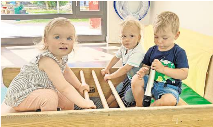
Spielen, essen, musizieren: In der Sennheiser-Betriebskita werden die Kinder vielseitig beschäftigt.

Die Eltern sind nicht nur wegen der praktischen Lage von der „Ohrwürmchen“-Kita überzeugt, sondern auch wegen des pädagogischen Konzepts. Schon Lehmborgs älterer Sohn war bei den „Ohrwürmchen“ untergebracht. Jetzt besuche er einen Kindergarten in Celle. „Wir hät-