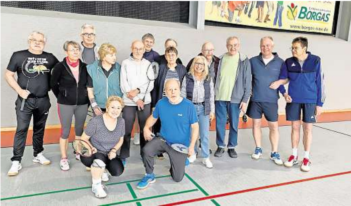
Die „Badminton Oldies“ des Mellendorfer Turn-Vereins feierten ihr 10-jähriges Bestehen.

Im Rahmen der Geburtstagsfeier wurde ein Ausflug zum NDR-Landesfunkhaus am Maschsee durchgeführt. Während einer zweistündigen Führung konnte sowohl in als auch hinter die Kulissen des NDR in Niedersachsen geblickt werden. Weitere Informationen zu den Badminton-Oldies finden sich auf der Homepage der MTV ( https://mellendorfertv.de ) oder können direkt beim Gruppenleiter Volker Jannsen, Tel. (05130) 5845435 eingeholt werden.