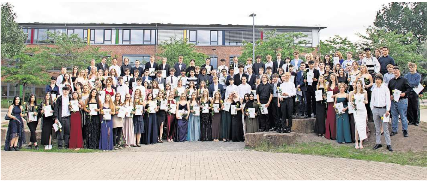
Die Absolventen der neunten und zehnten Klasse.

Alles in allem zeigte sich die Schulleiterin höchst zufrieden mit dem ersten Jahrgang, den sie an der IGS Wedemark verabschieden konnte. Passend zur am Abend gestarteten Fußball-EM gab sie den Schülerinnen und Schülern mit auf den Weg: „Euer Trainingslager ist nun beendet, ihr dürft aufs Feld, ihr seid am Ball!“ Dabei wünschte sie ihnen, dass sie nicht nur unbedarft nach vorne stürmen, sondern zu allen Seiten schauen und ihre Mitspieler nicht aus dem Auge verlieren. Zudem sollten sie ihr faires Spiel beibehalten. „Manchmal werdet