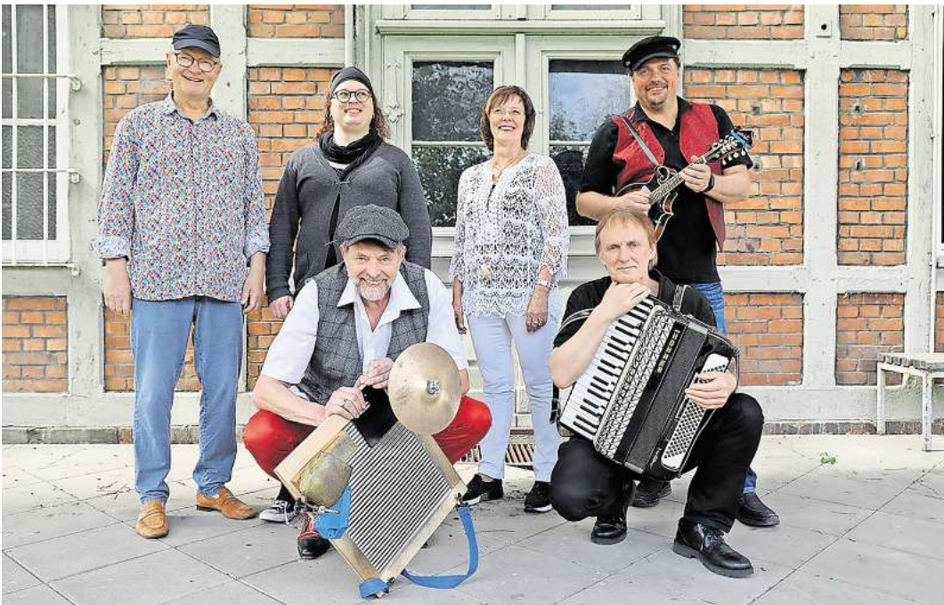
Die Sundown Skiffers eröffnen die Jazz Matineen am 7. Juli.

Künstler für sein Publikum buchen können. Nicht umsonst zieht dieses Event jährlich rund 5.000 Besucher an. In diesem Jahr starten die Jazz Matineen am 7.7. mit den Sundown Skiffers aus Bremerhaven. Sie präsentieren neben traditionellen Skiffle-Stücken bekannte Oldies der 60er und 70er Jahre auch in plattdeutscher Sprache, musikalisch neu definiert, druckvoll mit Waschbrett, Piano, Gitarre, E-Bass und mehrstimmigem Gesang. Am 14.7. wird dann Jackpot auf der Bühne stehen. Das Kult-Orchester aus Dresden