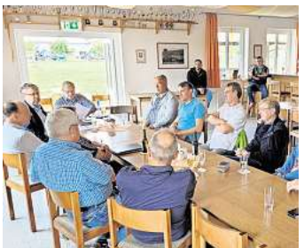
Rege Diskussion im Dorfge- meinschaftshaus Norddrebber.