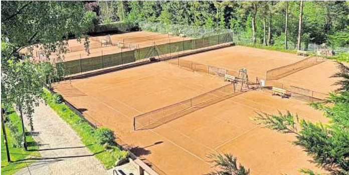
Die wunderbare Anlage des Tennisclubs Resse.

RESSE. Sechzig Jahre ist es her, dass begeisterte Tennisfans das Wagnis eingingen, den TCR TENNISCLUB RESSE e.V. zu gründen. Mitten in einer kargen Heidelandschaft wurden die ersten beiden Tennisplätze angelegt. Die Begeisterung war so groß, dass auch der erste Frost und Rauhref im Herbst die Mitglieder nicht bremsen konnte. Und von dieser Begeisterung und diesem Wagemut profitiert der TCR auch 60 Jahre später noch, z.B. im Rahmen der kompletten Neugestaltung der Anlage vor wenigen Jahren. Mittlerweile sind aus den kleinen Kiefernbüschen ausgewachsene Bäume geworden und viele Generationen haben dazu beigetra-