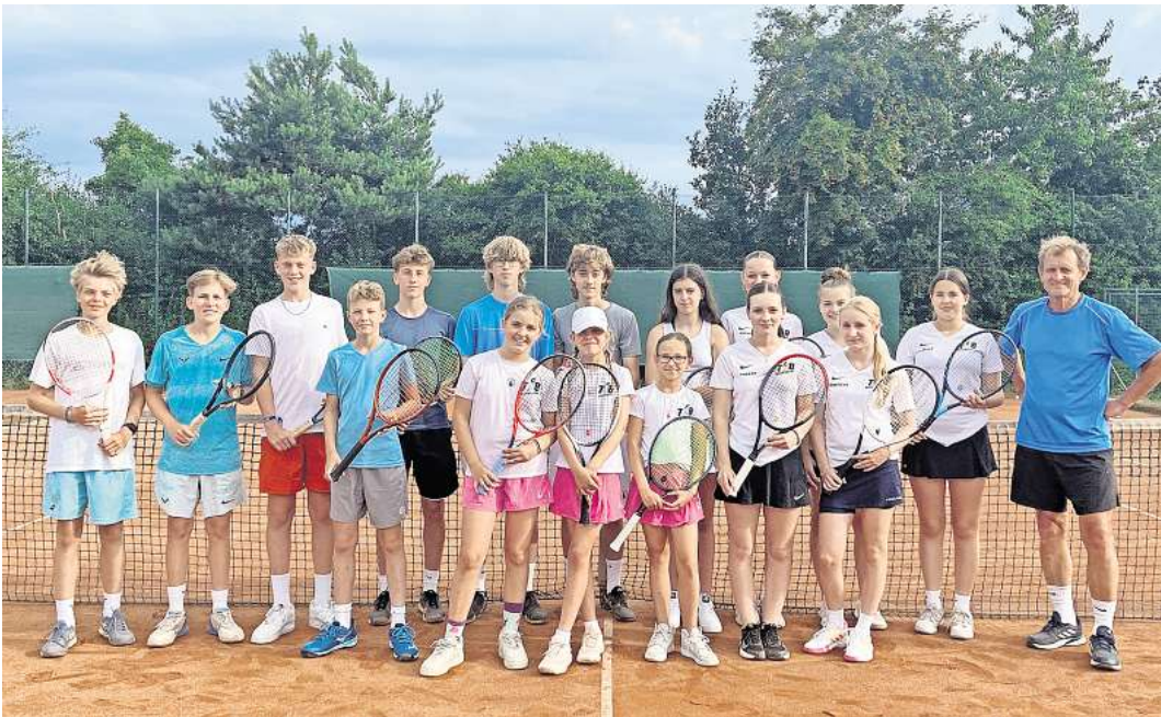
Lieferten stark ab: die Bissendorfer Tennis-Teams.