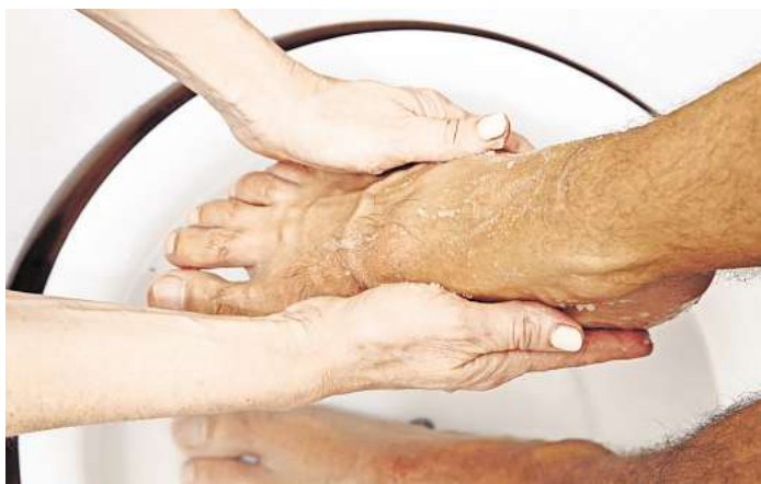
Verständnis und Geduld: Wer einen pflegebedürftigen Menschen wäscht, sollte beides mitbringen.