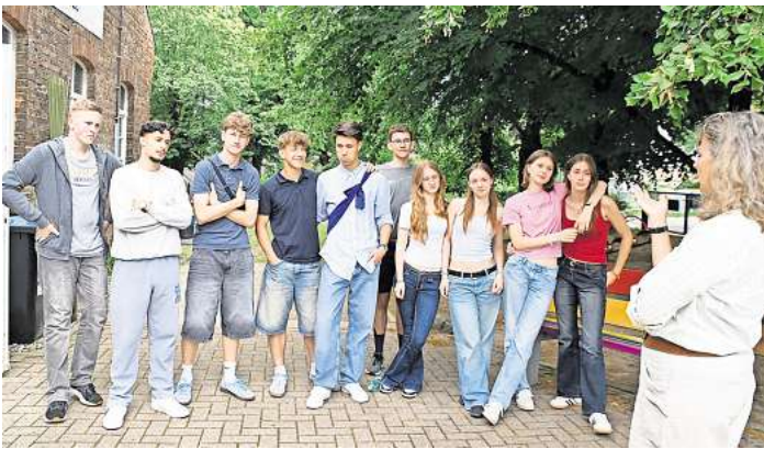
Handyfrei: Schülerinnen und Schüler des Gymnasiums Mellendorf wagten das Experiment.