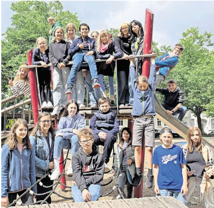
Die Freiluftveranstaltung läuft am Abend vor der Einschulung.