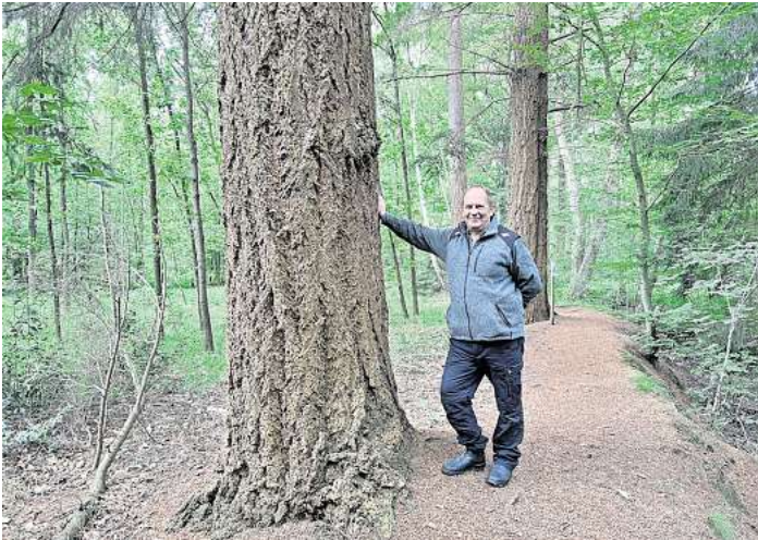
Bis zu 60 Meter hoch: Die harzreiche Douglasie ist im Öko-Bau beliebt.

eine Menge entwickelt. So werden abgestorbene Bäume nicht entfernt, sondern bleiben stehen und bieten Pilzen, Spechten und Käfern Lebensraum.