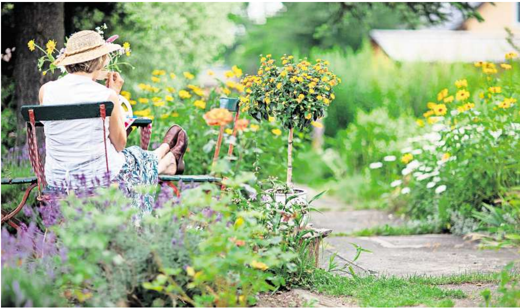
Schattenplätzchen gesucht: An warmen Juli-Tagen sollte man tagsüber lieber den Platz unter Bäumen genießen.

Falls Sie die Sommerfrische woanders suchen und verreisen, könnten Sie durstige Topfpflanzen an einen schattigeren Ort und etwas kühleren Platz im Garten stellen. Dann müssen die Nachbarn und Nachbarinnen nicht so oft gießen. Sie haben ein Bewässerungssystem? Umso besser. Benutzen Sie es schon in den Wochen vor dem Urlaub und testen Sie, ob alles funktioniert. Das beruhigt die Nerven und spart Ihnen auch im Alltag Arbeit.