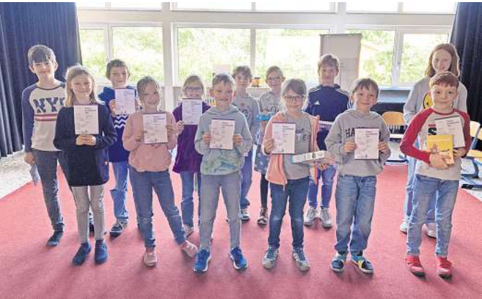
Die Kinder mussten insgesamt 24 Mathematikaufgaben lösen.