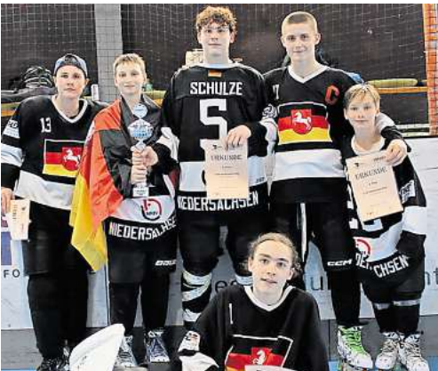
Die Panther zeigten starke Leistungen.