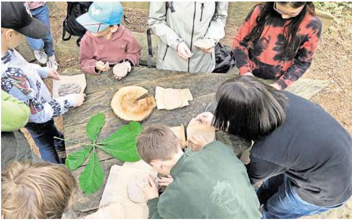
NAJUs beim „Erforschen“ von Baumrinden, Blättern und Jahresringen.

RESSE. Bei frühlingshaften Temperaturen fand ein weiteres Treffen der NAJU zum Thema “Bäume” in Resse statt. Da der Baumlehrpfad eine große Auswahl an heimischen Laub- und Nadelbäumen bietet, ist der 1,5 Kilometer lange Weg geradezu ideal, um mit jüngeren Kindern, aber auch mit Jugendlichen, Bäume zu suchen und sie zu bestimmen. Vorab wurden die Kinder und Jugendlichen in drei Gruppen aufgeteilt, so dass jede Gruppe in ihrem eigenen Tempo gehen konnte und individuell Schwerpunkte gesetzt werden konnten. Die Gruppen erhielten jeweils Bildmaterialien, anhand derer sie zu Blättern die passenden Bäume finden und benennen sollten. Das ging so zügig, dass auch andere Bäume und auch Kräuter entlang der Strecke bestimmt werden konnten. Viel Spaß machte es zudem allen, auch mit Hilfe einer App unbekannte Pflanzennamen herauszufinden. “Schaut mal, da ist eine große Weinbergschnecke“, rief ein Junge, und tatsächlich waren an