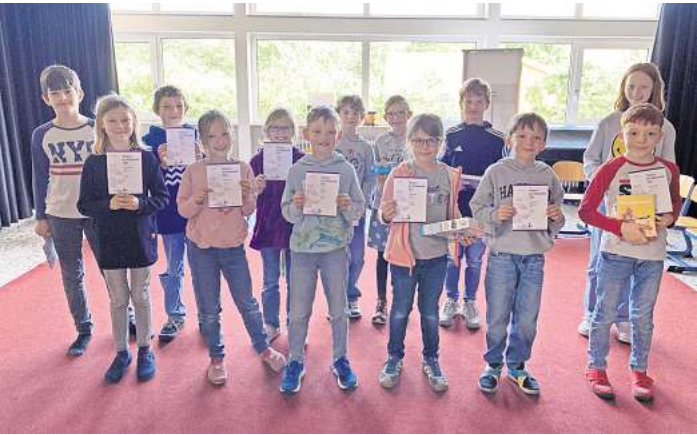
Die Kinder mussten insgesamt 24 Mathematikaufgaben lösen.