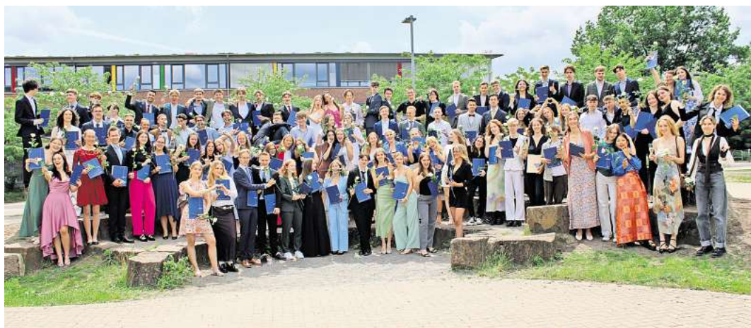
Die Abiturientinnen und Abiturienten des Jahrgangs 2024.