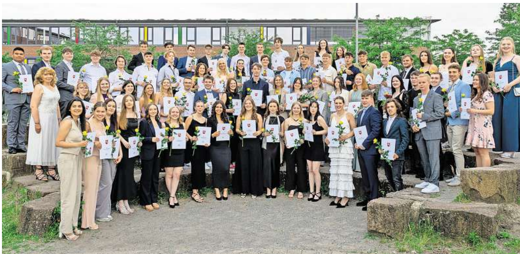
Die diesjährigen Abiturientinnen und Abiturienten der IGS Wedemark.

Die zahlreichen Redebeiträge waren von viel Herz und persönlichen Geschichten geprägt, was den Abend zu einem besonders emotionalen Erlebnis machte. Dabei wurde mehrfach betont, welch tolle, sympathische und soziale Persönlichkeiten dieser