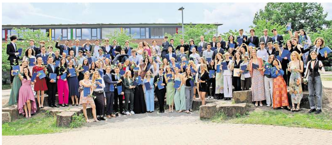
Die Abiturientinnen und Abiturienten des Jahrgangs 2024.