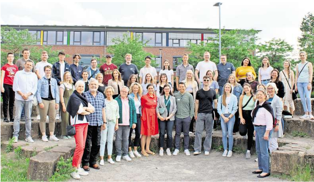
Sie haben vor fünf und zehn Jahren ihr Abitur am Gymnasium Mellendorf abgelegt.

Ehemaligentreffen am Gymnasium Mellendorf