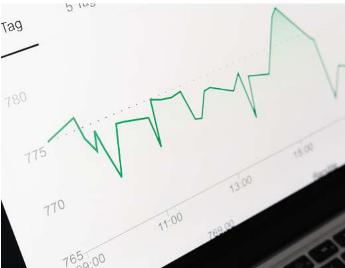
Ein Index fasst den Kursverlauf von Aktien verschiedener Firmen zusammen.