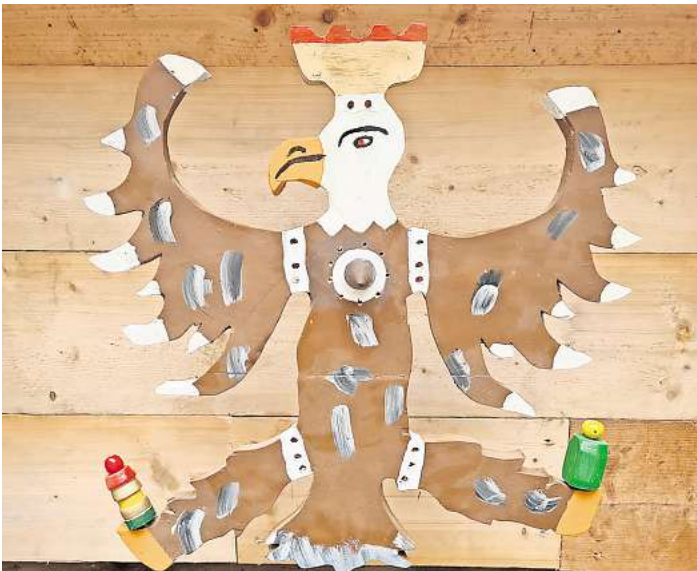
Das ist die Trophäe, um die es in Schwarmstedt beim Vogelschießen geht.

Beim anschließenden Bürgerkönigsschießen dürfen alle Einwohner aus Schwarmstedt, Bothmer und Grindau teilnehmen, die das 18. Lebensjahr vollendet haben. Wer den Rumpf