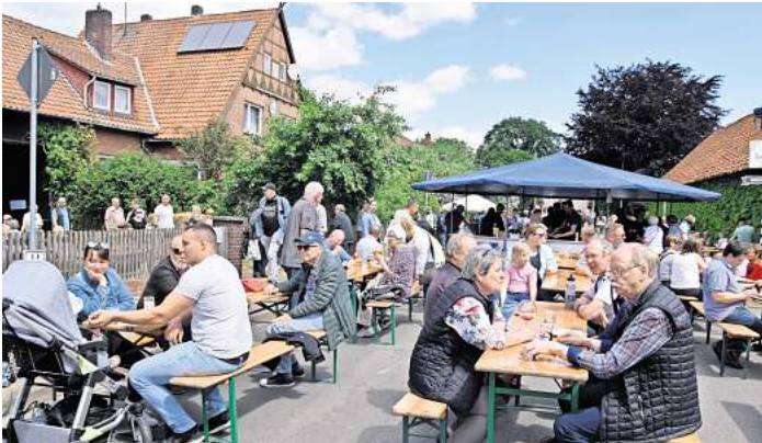
Die Wasserwerkstraße wird während des Spargelfestes zur Schlemmermeile im Ort.