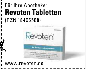
Abbildung Betroffenen nachempfunden. REVOTEN. Wirkstoffe: Acidum silicicum Trit. D4, Calcium carbonicum Hahnemannii Trit. D4. Die Anwendungsgebiete entsprechen den homöopathischen Arzneimittelbildern. Dazu gehört: Bindegewebsschwäche. www.revoten.de • Zu Risiken und Nebenwirkungen lesen Sie die Packungsbeilage und fragen Sie Ihre Ärztin, Ihren Arzt oder in Ihrer Apotheke. • Remitan GmbH, 82166 Gräfelfing

So können unschöne Anzeichen von Bindegewebsschwäche wie schlaffe Haut und Cellulite natürlich von innen bekämpft werden.