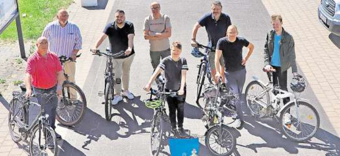
Das Team der Gemeindeverwaltung Wedemark fiebert dem Stadtradelwettbewerb entgegen.

Jetzt werden wieder fleißig Kilometer gesammelt