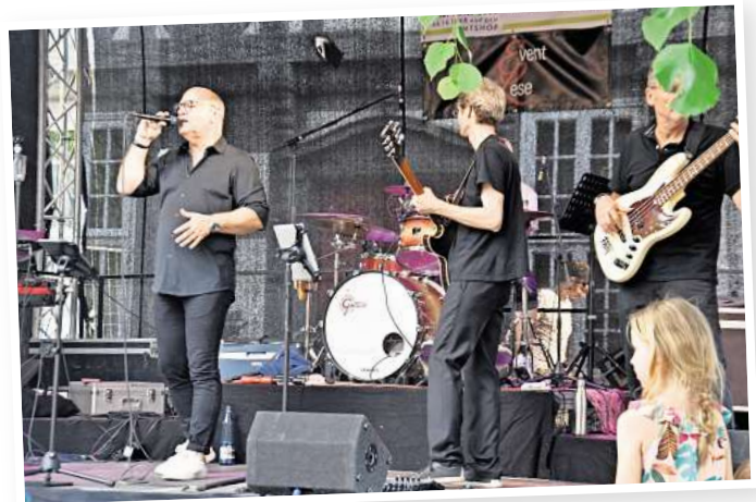
Life-Musik sorgt für die richtige Stimmung beim Wein- und Dorffest. Im vergangenen Jahr mischte die Band Searchin g für Hildegard das Publikum auf.