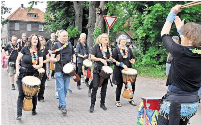
Viele Interessierte folgen: Die Karawane, die sich am Sonntagmorgen durch Brelingen zieht, ist lang.

Brelingen legt mit seiner aktuellen Pfingstveranstaltung „Kultur im Dorf“ die Messlatte noch mal ein Stück höher