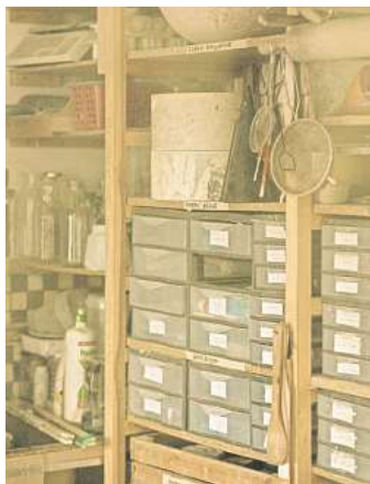
Regalsysteme und Aufbewahrungsboxen im Keller schaffen mehr Stauraum und schützen vor Staub.

wird entsorgt, anderes verkauft oder verschenkt. Alles andere soll im nächsten Schritt aufgeräumt und sortiert werden. Unterteilt man sein Keller-Gut zunächst in diese drei Bereiche, so gewinnt man einen ersten Überblick. Die zu entsorgenden Dinge können direkt in den Müll oder werden zum Recyclinghof gefahren. Dinge, die verkauft oder verschenkt werden sollen, können separiert und fotografiert werden. Sobald der Keller entrümpelt ist, sollte man sich genau umsehen. Alte Regale können neu angeordnet werden, um für Übersichtlichkeit und ideal genutzten Stauraum zu sorgen. Sofern man keine Regale hat und bisher alles