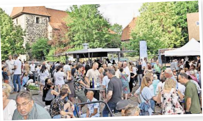
Das Ambiente auf dem Amtshof passt perfekt für ein Wein- und Dorffest mit der Kirche als Kulisse.