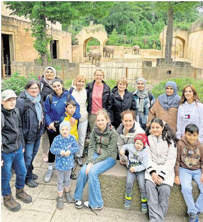
Ein ganz besonderes Erlebnis für die Teilnehmer des Gemeinschaftsprojektes Bunte Beete- Bunte Teller: Der Ausflug in den Erlebniszoo Hannover.

light war zweifellos die faszinierende Robbshow in Yukon Bay, die die Herzen der kleinen und großen Zuschauer:innen höher schlagen ließ. Doch der Höhepunkt des Tages war das gemeinsame Picknick, bei dem die Frauen mit ihren Kindern ihre selbst zubereiteten Köstlichkeiten aus ihren Heimatländern gemeinsam genossen. Von exotischen Gewürzen bis hin zu besonderen Süßigkeiten – die Vielfalt der Speisen spiegelte die kulturelle Vielfalt der Teilnehmerinnen wider und zeigte, wie Kochen und Essen Menschen zusammenbringen kann. Als krönender Abschluss des Tages tobten sich die Kinder auf dem Abenteuerspielplatz aus, während die Frauen bei einem leckeren Kaffee weiterhin in angeregten Gesprächen verweilten und die Bande der Gemeinschaft stärkten. Der gemeinsame Besuch im Zoo Hannover war nicht nur ein Ausflug, sondern ein Zeichen der Verbundenheit und Integration. Der Austausch von Geschichten, Rezepten und Erfahrungen zeigt, dass kulturelle Vielfalt eine Bereicherung für uns alle ist. Die Kochgruppe hat noch viel vor: Als nächstes steht das Kochen von Erdbeermarmelade auf dem Plan und auch für das Familienfest der Gemeinde Wedemark im Spaßbad wird die Grup-