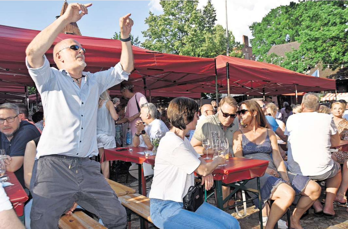
Stimmung pur ist beim Weinfest in Bissendorf garantiert: Da tanzen die Besucher dann auch schon mal auf den Bänken.

Edle Tropfen, Gaumengenüsse, Life-Musik und nette Menschen – die Mischung machts