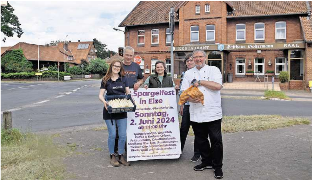
Der Spargelhof Hemme und das Gasthaus Goltermann laden am Sonntag, 2. Juni, zum dritten Spargelfest nach Elze ein.