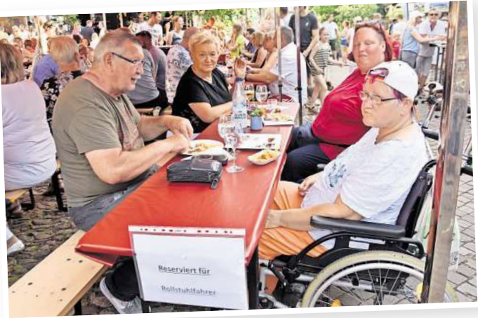
Rücksicht wird beim Veranstalter EventLese groß geschrieben: Für Rollstuhlfahrer ist ein Tisch ohne Bank reserviert, an den sie problemlos herankommen können.

In Kooperation mit den Taschentalenten hat sich die EventLese ansprechende Sitzkissen aus den zurückliegenden Veranstaltungsbanen nähen lassen. Am Merchandising-Stand sind die Kissen neben anderen schönen Accessoires zu erwerben. Weitere Informationen zur Veranstaltung findet man auf Facebook und Instagram. Das EventLese-Team freut sich auf all seine Gäste, Besucher, Sponsoren und Weinfreunde.