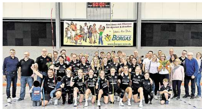
Die Mellendorfer Damen haben eine tolle Saison gespielt.

Die Saison in der Landesliga Mitte begann für die Damen durchwachsen. Gleich im ersten Spiel gab es eine klare Niederlage beim Oberligaabsteiger und späteren Meister MTV Großenheidorn. Nach zwei Siegen gegen Misburg und Lehrte setzte es zuhause die