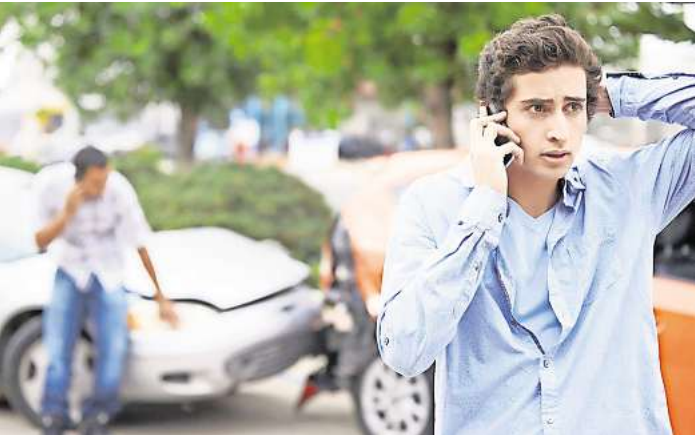
Wer zahlt den Schaden, wenn beide Personen Schuld haben?

die Reparatur des eigenen Schadens muss man selbst bezahlen. Zudem können die Versicherungsprämien erheblich steigen, wenn man einen Autounfall verursacht. Nachdem die Polizei am Unfallort eingetroffen ist, klärt diese zumeist die Schuldfrage. Ist das nicht möglich, wird ein Kfz-Gutachten in die Wege geleitet. Dabei untersucht ein Sachverständiger beide Fahr-