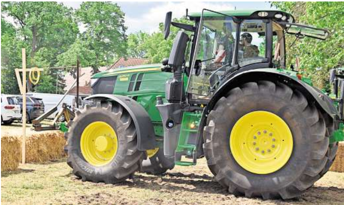
Auch Treckergeschicklichkeitsfahren steht beim Spargelfest in Elze auf dem Programm.