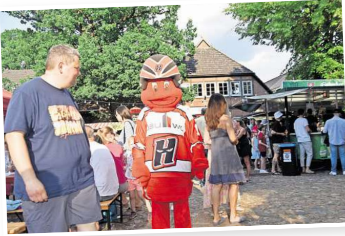
In den letzten Jahren war Maskottchen Scorpi immer ein regelmäßiger Gast beim Weinfest auf dem Amtshof. Das erfreut vor allem die Kinder.