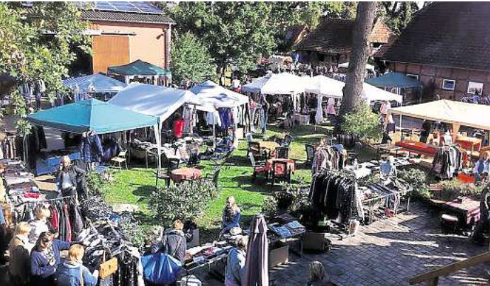
Entspanntes Stöbern auf dem Sporthof „Schöne Aussicht“.

LINDWEDEL. Er ist inzwischen kein Geheimtipp mehr und als Trendsetter für viele Second Hand Freunde aus nah und fern ein Kalendereintrag mit oberster Priorität: Der LADY'S SECOND HAND MARKET auf dem Sporthof Schöne Aussicht bietet am Sonntag, 9. Juni, ab 11 Uhr allen modewussten Frauen, die sich von einst geliebten Kleidungsstücken trennen möchten, oder bereits getragene, dennoch trendige und gut erhaltene Markenklamotten für kleines Geld erwerben möchten ein einmalige Atmosphäre zum Feilschen, Handeln und Kontakten. Die Ausstellerinnen bürgen für Qualität und freundliche Stimmung. Bei selbstgebackenen Hoftorten, süßen und herhaften Crêpes und leckeren Getränken kommt die Schnäppchenjägerin auch im Sinne der Erholung und des Genusses entweder auf der Sonnenterrasse mit schöner Aussicht oder