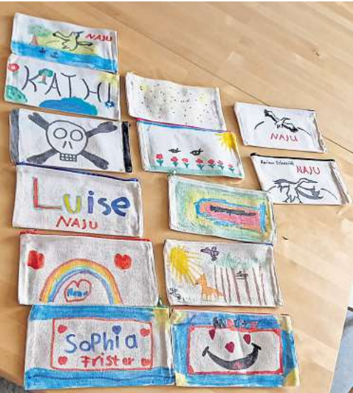
Zum Abschluss des Tages zum Thema Nachhaltigkeit haben die Kinder der NaJu Wedemark Federmappen bemalt.

Kinder lernen: Nussnougatcreme kann man auch selbst herstellen