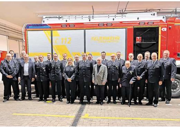
Ehrungen standen im Mittelpunkt der Jahreshauptversammlung der Feuerwehren der Samtgemeinde Schwarmstedt.

Im Jahr 2023 gab es zwei schwere Einsätze: der tragische Verkehrsunfall mit Todesfolge auf der B 214 bei Norddrebber und der Brand der Kindertagesstätte in Buchholz (Aller), diese Einsätze brachten die Feuer-