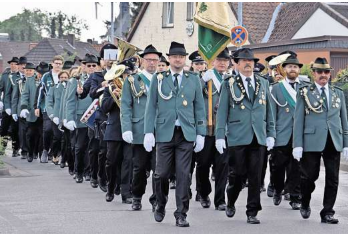
Die Mellendorfer Schützen beim Ausmarsch durchs Dorf, hier auf dem Weg zum Rathaus.