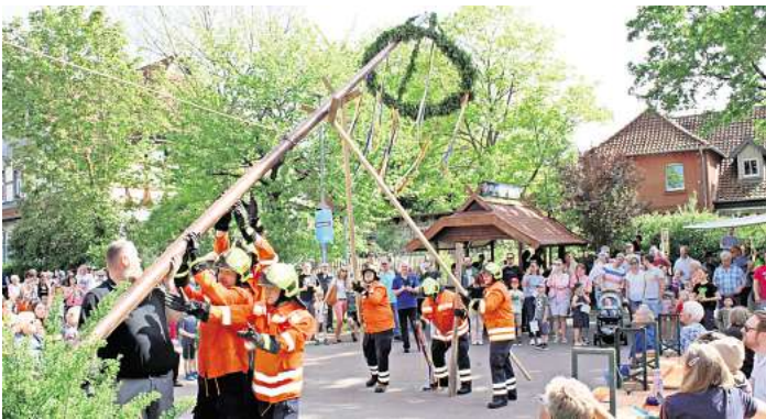
Aktive der Brelinger Feuerwehr richten den Maibaum vor der Brelinger Mitte auf.

BRELINGEN. Ob „Der Mai ist gekommen“ oder „Yellow Submarine“ von den Beatles, der Männergesangsverein Brelingen kann beides. Bei ihrer Maibaumfeier vor der Brelinger Mitte begrüßten die Sänger mit diesen und weiteren Liedern die vielen Besucher. Diese verfolgten zunächst das Aufstellen des Maibaumes durch Aktive der Brelinger Feuerwehr und applaudierten dann den Klängen des Posaunenchores der Kirchengemeinde. Der Vorsitzende des Männergesangsver-