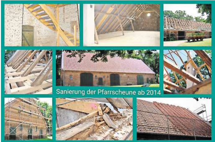
Sanierung der Pfarrscheune ab 2014: Von oben nach unten und von links nach rechts: 1. Blick in den neuen Treppenaufgang linker Giebel 2. Neue Dachbalken mit den alten Sparren vorderes Scheunendach 3. Linker Giebel 4. Fertiger Dachboden 5. Fertige Pfarrscheune nach Sanierung von außen 6. Zerfallener Traufbalken auf der Außenmauer Vorderseite 7. Sanierter Dachstuhl der Pfarrscheune 8. Blick aus mittlerem Scheunengang durch die Decke 9. Neueindeckung des Daches.

29 22 anmelden. Vor zehn Jahren, im Jahre 2014, begannen die Arbeiten an der Sanierung der Pfarrscheune, um diese zu erhalten und diesen einmaligen Platz in Elze mit Leben zu füllen. Der Freundeskreis Pfarrscheune, der sich im Jahre 2008 gründet hat, hat sich all dieses zur Aufgabe gemacht und mit Fleiß und Hingabe umgesetzt. Mittlerweile ist die Pfarrscheune zu einem beliebten Treffpunkt mitten in Elze geworden. Viele Veranstaltungen lassen hier Gemeinschaft erleben und genießen. Angefangen mit der „lebendigen Weihnachtsscheune“, Weihnachtsmarkt, verschiedenste Konzerte, Buchlesungen, Scheunenkaffees, Kirchenkreis-