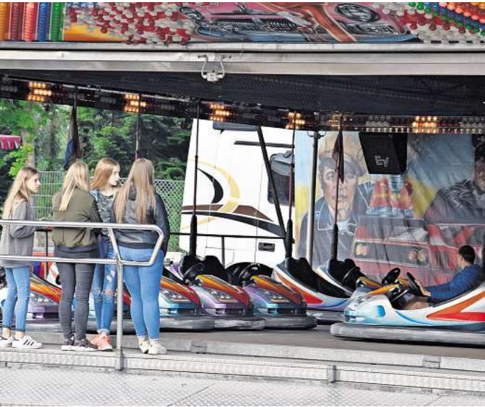
Auch dieses Jahr kommen viele verschiedene Buden und Fahrgeschäfte nach Mellendorf auf den Festplatz an der neuen Sporthalle am Roye-Platz.