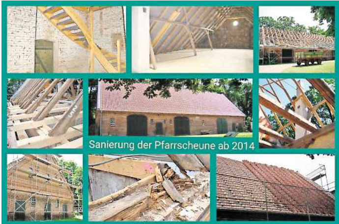
Sanierung der Pfarrscheune ab 2014: Von oben nach unten und von links nach rechts: 1. Blick in den neuen Treppenaufgang linker Giebel 2. Neue Dachbalken mit den alten Sparren vorderes Scheunendach 3. Linker Giebel 4. Fertiger Dachboden 5. Fertige Pfarrscheune nach Sanierung von außen 6. Zerfallener Traufbalken auf der Außenmauer Vorderseite 7. Sanierter Dachstuhl der Pfarrscheune 8. Blick aus mittlerem Scheunengang durch die Decke 9. Neueindeckung des Daches.

29 22 anmelden. Vor zehn Jahren, im Jahre 2014, begannen die Arbeiten an der Sanierung der Pfarrscheune, um diese zu erhalten und diesen einmaligen Platz in Elze mit Leben zu füllen. Der Freundeskreis Pfarrscheune, der sich im Jahre 2008 gründet hat, hat sich all dieses zur Aufgabe gemacht und mit Fleiß und Hingabe umgesetzt. Mittlerweile ist die Pfarrscheune zu einem beliebten Treffpunkt mitten in Elze geworden. Viele Veranstaltungen lassen hier Gemeinschaft erleben und genießen. Angefangen mit der „lebendigen Weihnachtsscheune“, Weihnachtsmarkt, verschiedenste Konzerte, Buchlesungen, Scheunenkaffees, Kirchenkreis-