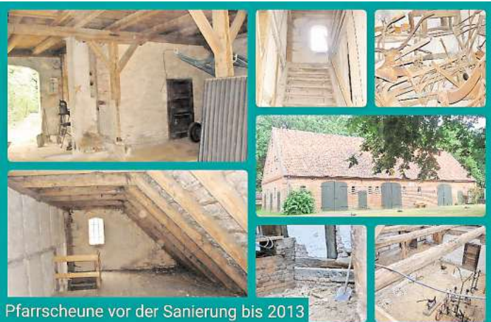
Pfarrscheune vor der Sanierung bis 2013 Von oben nach unten und von links nach rechts: 1. Blick in den mittleren Scheunengang, hinten rechts die alte Waschküche 2. Dachboden bei dem Treppenaufgang am linken Giebel 3. Alte Treppe zum Obergeschoss 4. Alte Pfarrscheune von 1885 vor Sanierung 5. Blick in den linken Scheunengang, Bereich rechts beim Abriss der Decke 6. Blick in die alte Waschküche im mittleren Scheunengang, Sammelplatz alter Ackergeräte 7. Blick vom geöffneten Dach in den mittleren Scheunengang.

Gottesdienst mit Pfarrscheunenkaffee am Pfingstsonntag ab 14 Uhr auf dem Kirchengelände