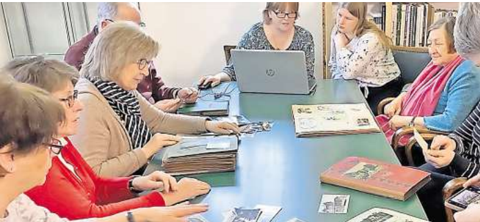
Am 25. und 26. Mai ist Tag der offenen Tür im Heimatarchiv Schwarmstedt.

Gäste können historische Fotos aus Schwarmstedt und den Ortschaften sehen, sie können in alten Briefen stöbern und schau-