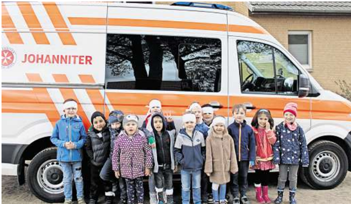
Die Kinder der Kita am Loh beim Ersthilfekursus der Johanniter.

Das war vielleicht eine utopische Vorstellung für die Kinder, doch schnell kann es auch bei ihnen zu Hause zum Beispiel durch einen längeren Stromausfall dazu kommen, dass sie sich Gedanken machen müssen, was sie eigentlich jetzt essen können oder wo sie Licht herbekommen. Schnell merkten die Kinder, dass