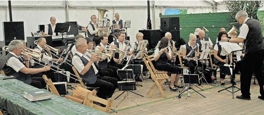
Das Leinetalorchester aus Abbensen spielt beim exklusiven Schützenbüfett am Sonntag im Zelt.

angeboten. Am Nachmittag wird der Blasrohrsport vorgestellt und jedem die Gelegenheit gegeben, diesen auch selbst auszuprobieren. Am Abend steht dann wieder Party im Mittelpunkt