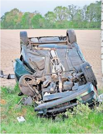
Der Polo prallte gegen einen Baum und blieb auf dem Dach liegen.

Der 51-jährige Fahrer, ebenfalls aus der Region, war bei Eintreffen der Einsatzkräfte noch ansprechbar und mit den Beinen leicht eingeklemmt. Durch Einsatz der Feuerwehren aus Bomlitz und Walsrode wurde er aus dem Unfallwrack befreit. Wenig später verschlechterte sich der Zustand jedoch dramatisch. Er musste reanimiert werden und starb wenig später noch am Unfallort. Ein herbeigerufener Rettungshubschrauber kam nicht mehr zum Einsatz. Da anfangs nicht sofort klar ist, wie viele Personen am Unfall beteiligt waren, wurde vorsichtshalber ein an-