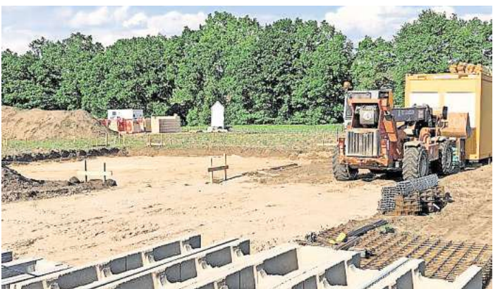
Die Wählergemeinschaft kritisiert den hohen Flächenverbrauch durch neue Baugebiete wie hier in „Neues Land“ in Resse.

WEDEMARK (kra). Es wird immer mehr gebaut, auch in der Wedemark. Doch versiegelte Flächen gefährden den Klimaschutz und begünstigen Hochwasser. Deshalb will die Wählergemeinschaft WPW den Flächenverbrauch begrenzen. Versiegelte Flächen sind klimaschädlich, denn sie erwärmen sich stärker und verhindern das Versickern von Regenwasser. Was erst jüngst im Zuge des Weihnachtshochwassers wieder stärker in Bewusstsein gerückt ist. Und obwohl in der Gemeinde Wedemark viele Ansätze zum Hochwasserschutz verfolgt werden, werden auch weiterhin viele Flächen versiegelt. Die Wählergemeinschaft Pro Wedemark (WPW) will eine deutliche Begrenzung des Flächenverbrauchs erreichen und fordert daher ein Moratorium für die Ausweisung neuer Baugebiete. Wohnraum wird dringend benötigt, auch in der Wedemark, weshalb gerade in den vergangenen Jahren immer mehr Neubaugebiete ausgewiesen wurden. „Wir wollen keinen Entwicklungsstopp“, betonte daher auch Maggie Garland, die für die WPW im Gemeinderat sitzt, „sondern die Herausforderungen besonnen und vernünftig gestalten.“ Die Herausforderungen: Zwischen 2011 und 2022 habe der Flächenverbrauch in der Wedemark laut dem Landesamt für