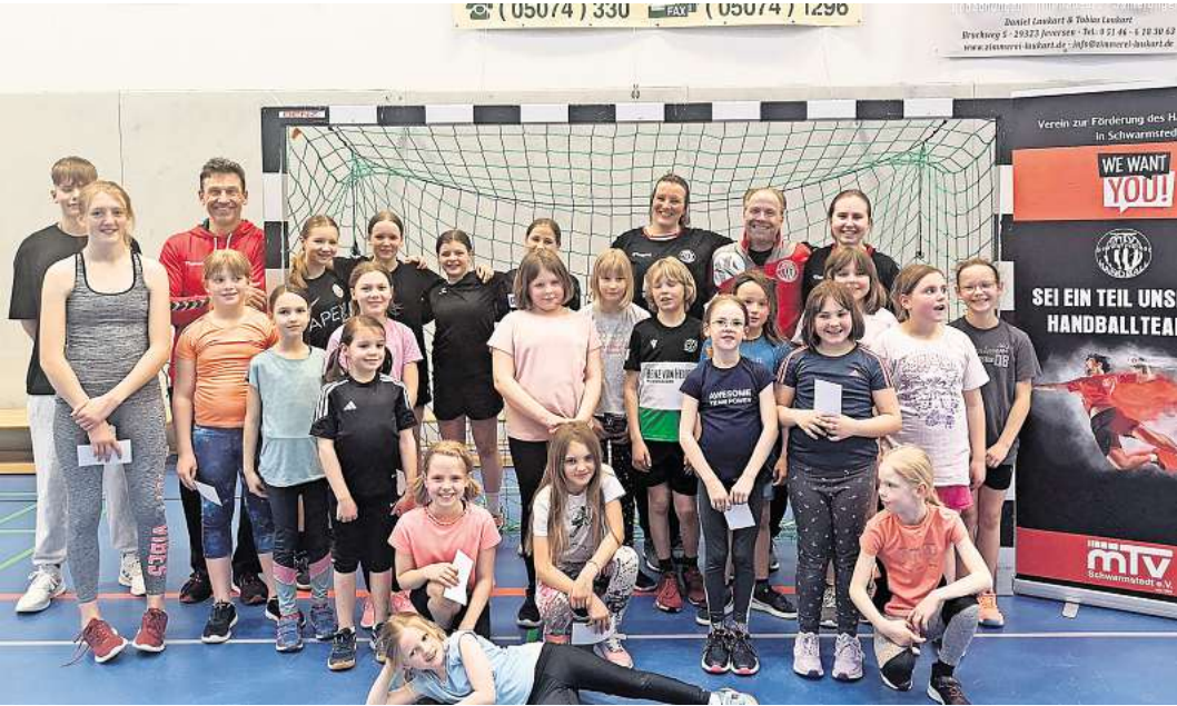
Nach hartem Training und viel Spaß gab es noch ein gemeinsames Gruppenfoto.

Schnuppertraining bei der Handballsparte des MTV