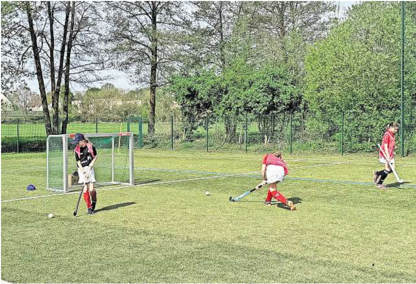
Die Organisatoren waren positiv überrascht von der tollen Resonanz auf den Schnuppertag bei der Hockey-sparte.

Der Mellendorfer TV feierte den Start der Feldhockey-Saison mit einem 2-tägigen Event. Am Samstag eröffneten zunächst alle Jahrgänge die Saison mit einem gemeinsamen Training und jahrgangsübergreifenden Spielen. Am Sonntag lockte der Schnuppertag mehr als 70 interessierte Kinder im Alter zwischen vier und zwölf gemeinsam mit ihren Eltern, Großeltern, Geschwistern und Freunden auf das Gelände des Silke Hanebuth Immobilien Sportpark. Bei strahlendem Sonnenschein konnten die Vereinsmitglieder und Gäste zwei interessante und sportlich herausfordernde Tage genießen. Am Samstag wurden die Mannschaften mit neuen Trikots der beiden Sponsoren smartPS sowie Küster & Partner ausgestattet. Direkt im Anschluss wurden Mannschaftsfotos für die anstehende Feldsaison erstellt. Nach den Trainings am Vormittag haben sich die Kinder und Trainer beim Mittagessen in der Vereinsgastronomie Burgeria gestärkt. Am Nachmittag durften die Eltern, Großeltern, Geschwister und Freunde spannende Hockeyspiele der Kinder erleben. Am Sonntagmorgen waren alle Kinder zwischen vier und zwölf eingeladen, den spannenden Team-sport Hockey selbst auszuprobieren. Der Einladung des Mellendor-