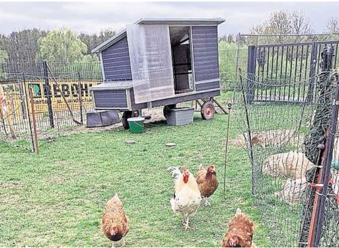
Einige Wochen lang gastierte das Hühnermobil in den evangelischen Kitas in Bissendorf.

Kinder der evangelischen KiTas versorgen die Tiere