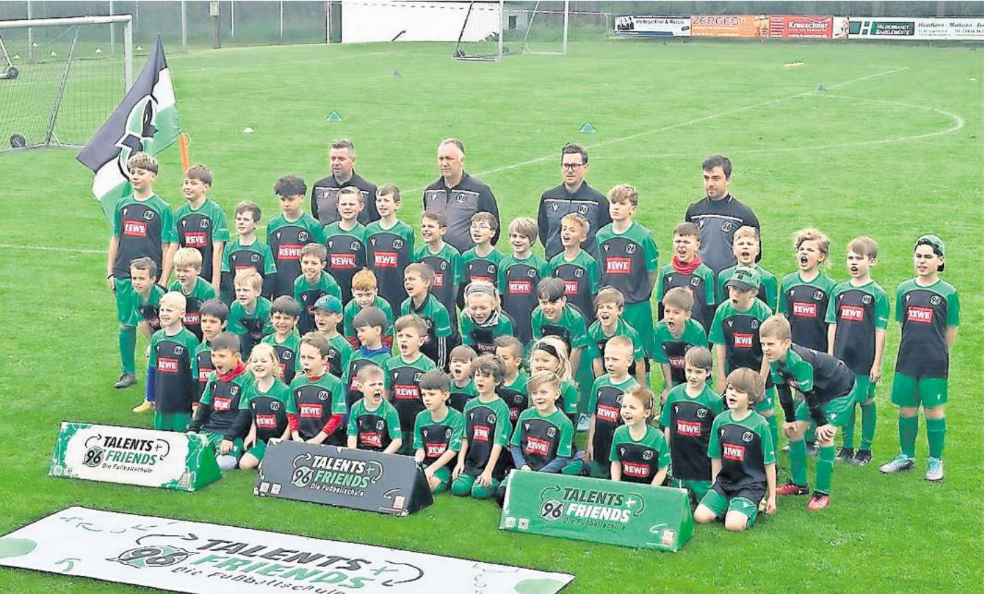
50 fußballbegeisterte Kinder erlebten die Erfüllung ihres Traums.

Für 50 Kinder ging ein Traum in Erfüllung – Lob an den SVR für Top-Zustand des Platzes