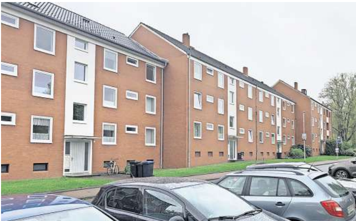
Teures Pflaster: In der Wedemark (hier die Berliner Straße in Mellendorf) sind die Mieten besonders hoch.

Preisangaben pro Quadratmeter klingen immer nach kleinen Differenzen, sie summieren sich aber schnell. Ein Beispiel: Eine Fa-