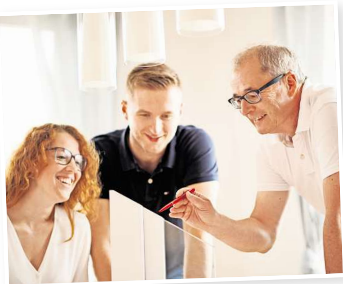
Individuelle Beratung bis ins Detail ist bei Geisler Bau seit vier Jahrzehnten an der Tagesordnung.