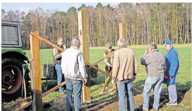
Die Errichtung des Bienenhotels hat Spaß gemacht.