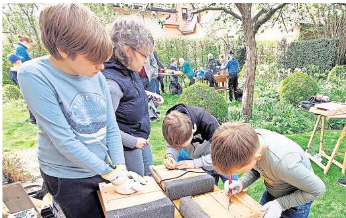
Bei der Schwarmstedt Naturschutzjugend bauten die Kinder beim letzten Treffen Fledermausquartiere.

Das nächste NAJU-Treffen findet statt am Sonnabend, 11. Mai, um 10 Uhr vor dem Gasthaus Teepe, Kirchstraße 12, um das Leben des Weißstorchs zu erkunden. Gern kann ein Fernglas mitgebracht werden. Infos unter 0157 59549515 oder 0174 7988637.