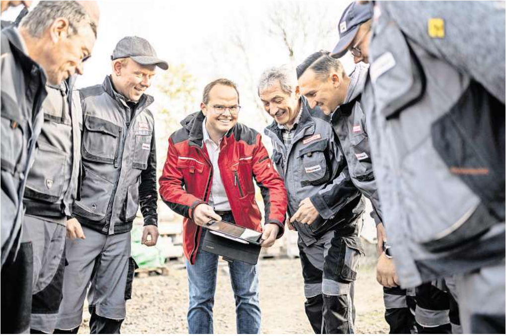
Teamwork und ein angenehmes Arbeitsklima ist bei Geisler Bau selbstverständlich.

Zum 1. Dezember 2016 wurde das Lager zentralisiert. In der knapp 600 qm großen Lagerhalle und dem anschließenden 3500 qm großen Grundstück finden nun alle Betriebsmittel einen geordneten Platz.