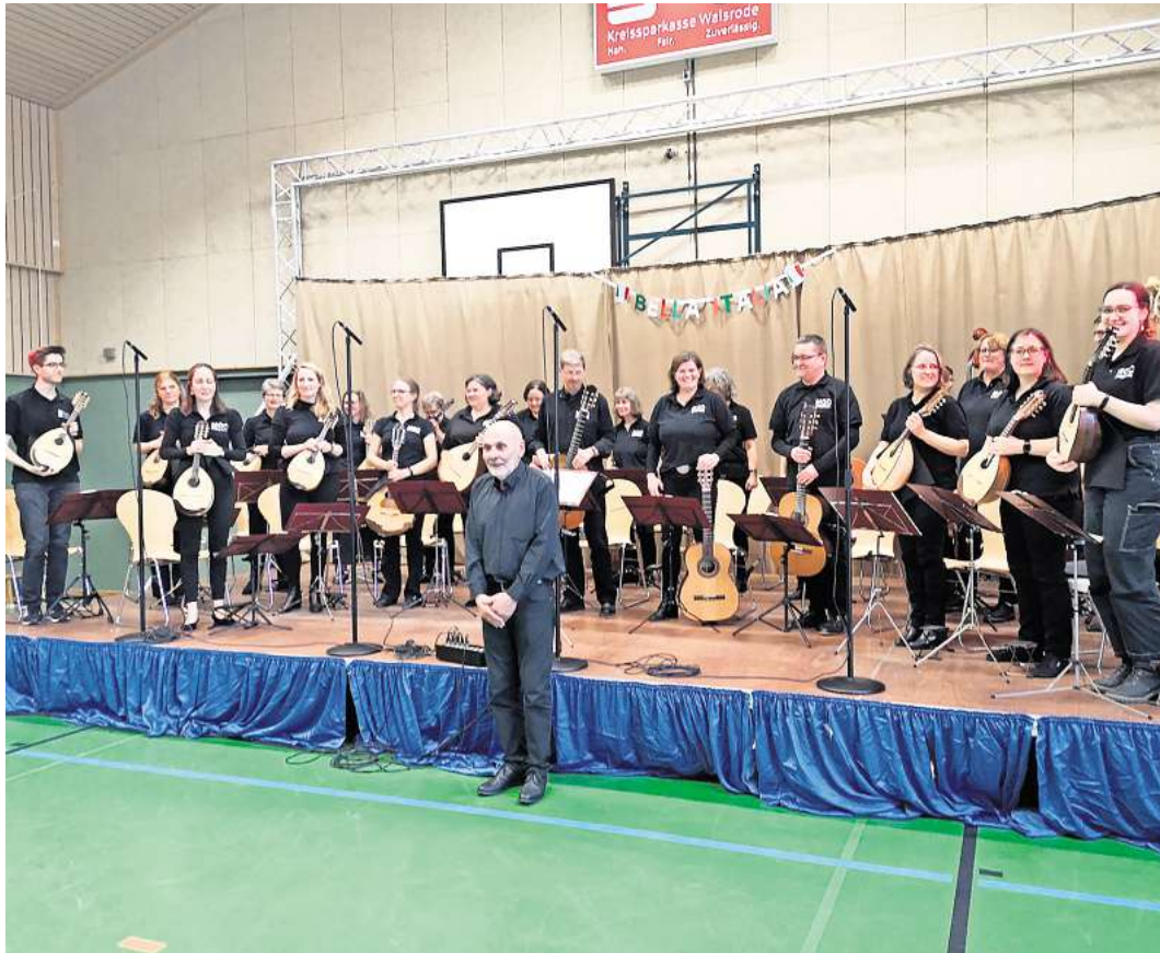
Die Veranstaltung Bella Italia mit Musikeinlage von Chor und Mandolinenorchester kam sehr gut an.