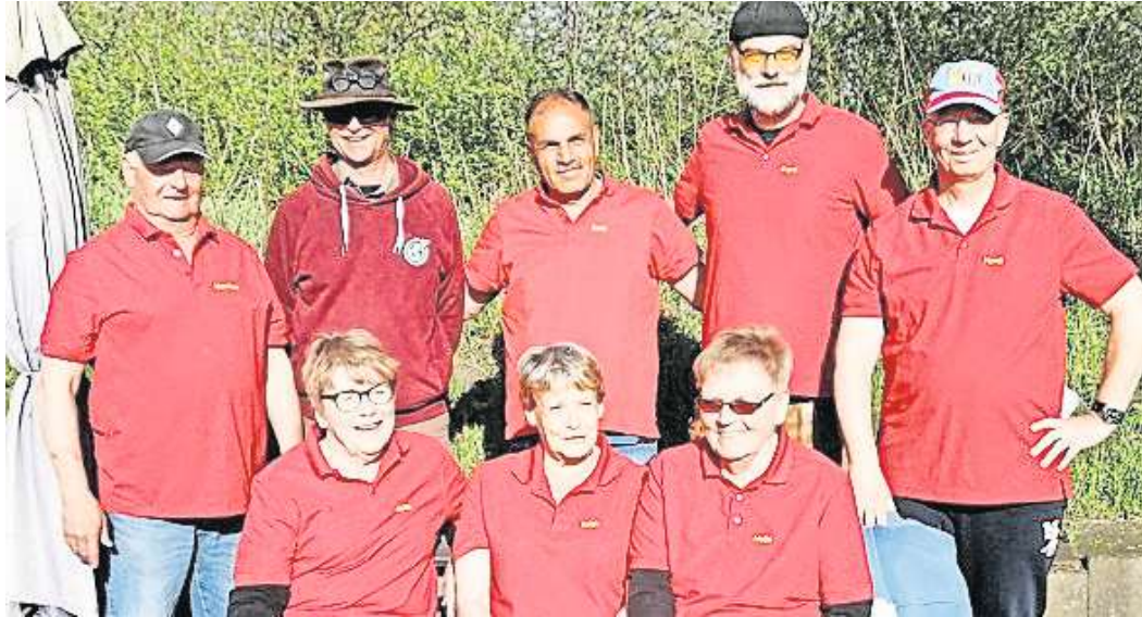
Das Team Essel 1 spielt in dieser Saison in der zweithöchsten Liga des Niedersächsischen Pétanque-Verbandes

Pétanque-Verband startete schwungvoll in die neue Saison