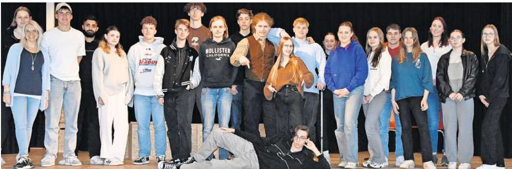
Die Teilnehmer des Kurses Darstellendes Spiel auf der Bühne.