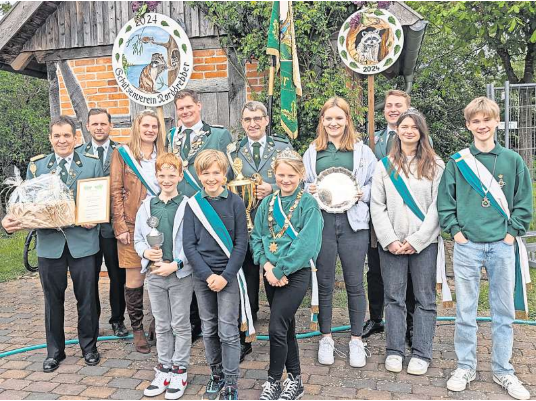
Majestäten und Preisträger beim Schützenfest in Norddrebbber.