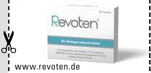
Abbildung Betroffenen nachempfunden. REVOTEN. Wirkstoffe: Acidum silicicum Trit. D4, Calcium carbonicum Hahnemannii Trit. D4. Die Anwendungsgebiete entsprechen den homöopathischen Arzneimittelbildern. Dazu gehört: Bindegewebsschwäche. www.revoten.de • Zu Risiken und Nebenwirkungen lesen Sie die Packungsbeilage und fragen Sie Ihre Ärztin, Ihren Arzt oder in Ihrer Apotheke. • Remitan GmbH, 82166 Gräfelfing

Für Ihre Apotheke: Revoten Tabletten (PZN 18405588)